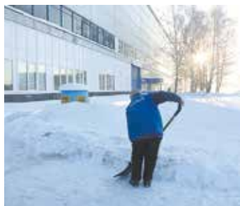
В борьбе с сугробами используется и ручной труд

От редакции: видимо, наш читатель оказался на внутризаводской территории сразу после обильных снегопадов. Действительно, за несколько часов справиться со снегом затруднительно. Сейчас внутризаводские дороги уже очищены.