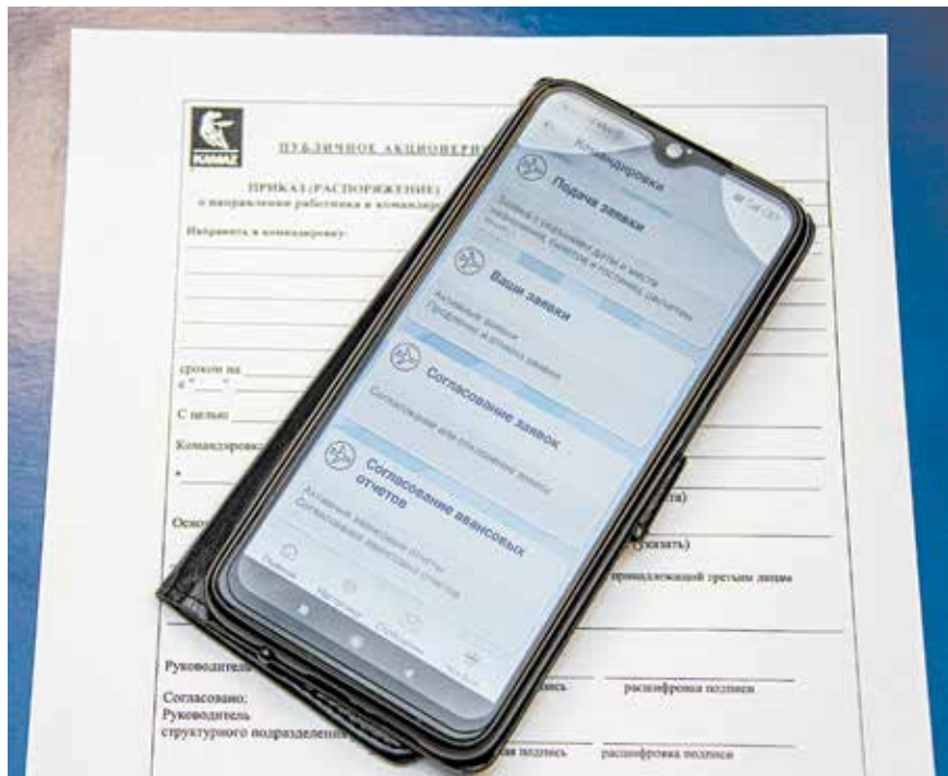
Съездил в командировку — с новым сервисом отчитаться будет проще

Разработчики приложения добавили пользователям возможность анонимно выразить своё мнение по важным вопросам. Вкладка «Опросы» расположена в разделе «Персонал». О появлении нового опроса проинформирует push-уведомление. В этом же разделе сотрудники, покидающие компанию, смогут дать выходное интервью,