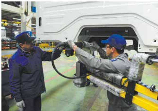
Благодаря гайковёрту с электронной системой управления каждая гайка закручена как надо

Очередного пополнения на участках сборки кабин нового модельного ряда ждут весной. В марте планируется завершить монтаж дождевой камеры, в которой будет проверяться герметичность кабины. В это же время будет смонтирована линия сборки дверей. Финишный участок тоже станет длиннее и превратится в полноценный End of line — здесь на трёх позициях будет вестись программирование и параметрирование электронных систем с одновременной обработкой сразу трёх кабин. Техническое оснащение сборки поднимется ещё на одну ступеньку и встанет на один уровень с мировыми образцами автопрома. Перемены «КАМАЗу» к лицу.