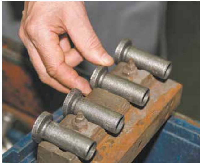
Многоместная призма приспособления при шлифовке надёжно фиксирует детали