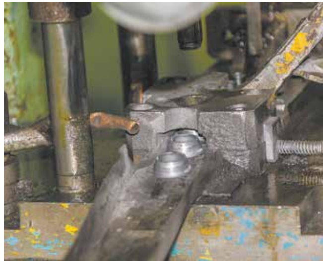
На некоторых прессах выдавливание идёт уже в автоматическом режиме

отражаются в показателях работы коллектива — коэффициент качества стабильно высокий, производительность труда тоже, в рейтинге по работе с персоналом ЦХВ на первых строчках. Вот такой он, эталон!