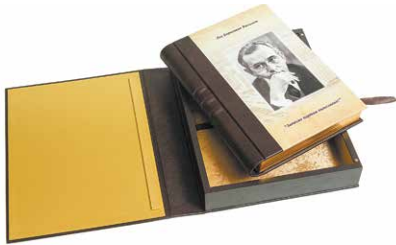
Второй экземпляр издания «Задание партии выполнено» теперь в музее «КАМАЗа»