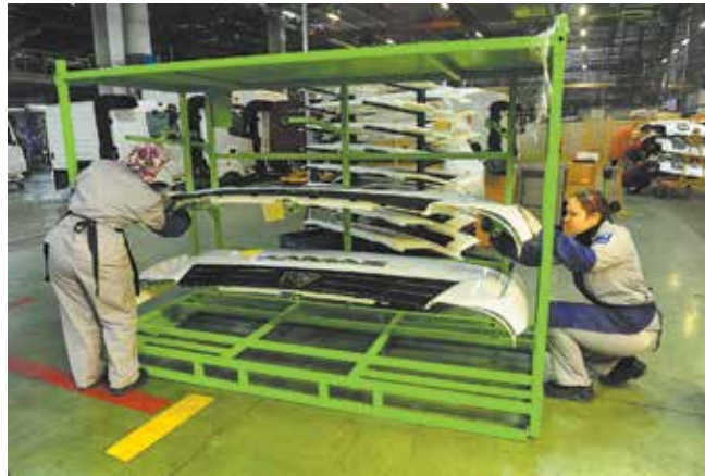
На конвейере обновляются и приспособления для транспортировки — панели должны доехать до места установки в целостности и сохранности