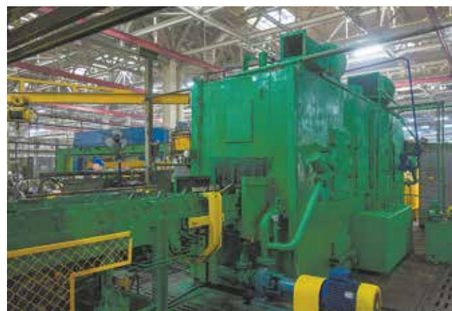
Возвращённая в эксплуатацию моечная машина трудится на новом месте исправно

Замена мойки помогла снизить вероятность появления серьёзного дефекта. Отслужившим своё моечным машинам не хватало мощности, чтобы вымывать все загрязнения. А их наличие может приводить к задирам полукольца и шеек коленвала во время эксплуатации двигателя и дорогостоящему ремонту.