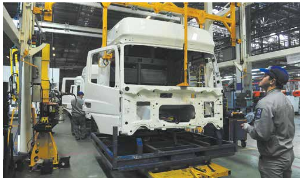
Новая грузоподъёмная система стала для сборщиков надёжным помощником

Активно используются в процессе сборки другие приспособления. Без мани-