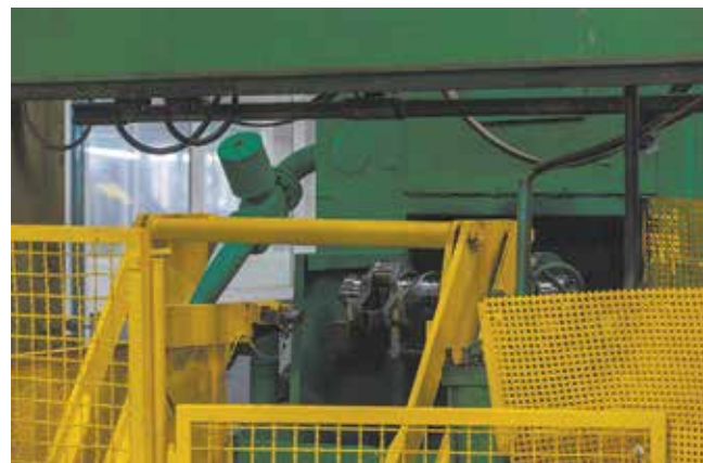
После просверливания отверстий коленвал отправляется на мойку

«Коленвал — одна из базовых деталей, качество работы мотора зависит, в том