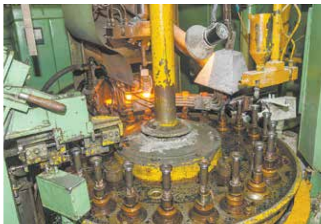
Рабочая поверхность фланца толкателя должна быть особенно износостойкой, поэтому она наплавляется чугуном