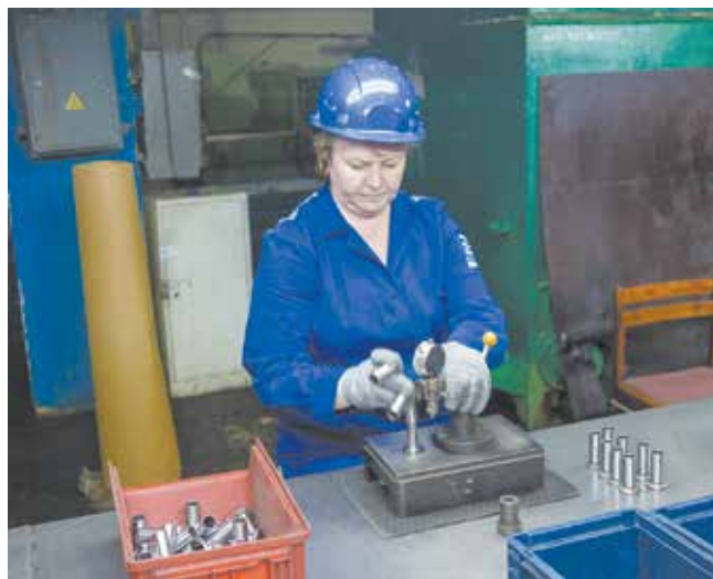
«Качество продукции должно быть высоким», — решили в цехе и ввели дополнительный контроль диаметра толкателя

уверен: с внедрением механизации прессов производительность повысится, а условия труда значительно улучшатся. А сколько ещё идей можно реализовать на этой площадке!