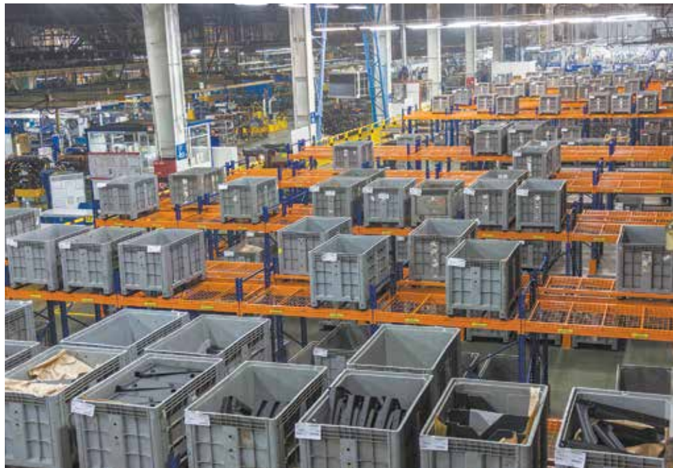
Таким масштабам нужны непрерывные поставки

— Потребности производства грузовых автомобилей и автобусов обеспечены в полном объёме на февраль и март. Ситуация с обеспечением на апрель напрямую зависит от того, как будут запускаться китайские заводы и налаживаться внутренняя кооперация.