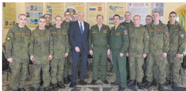
Ребятам из Автограда под силу самые ответственные задачи

Все призёры получают дипломы и памятные подарки. Работы участников будут опубликованы на сайте «КАМАЗа» и партнёров, в информационной системе «Комета», на информационных стендах, в СМИ и обучающих материалах.