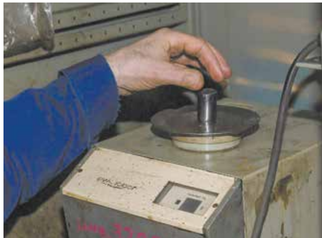
Цикл изготовления в ЦХВ начинается с дозированной отрезки заготовок. Масса изделия контролируется на электронных весах