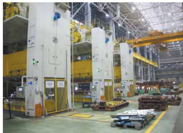
После подключения к SAP TOTO оборудование будет под постоянным контролем

К тому же при автоматическом формировании плановых мероприятий ТОО (годовые, ежеквартальные, месячные и т.д.) и внедрении системы оперативного планирования ремонта технологического оборудования, формирования отчётов будут исключены дублирующие функции организации работ в подразделениях. Состояние подключённого к единой системе оборудования можно будет диагностировать через мобильные устройства (планируется закупить 823 смартфона), появится возможность передачи через них информа-