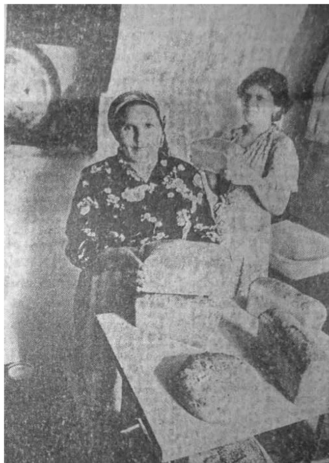
Фото из той самой публикации в «Советской России» о хлебе и родном доме

Родителей давно уже нет живых, но мы всегда приезжаем в гости Старые