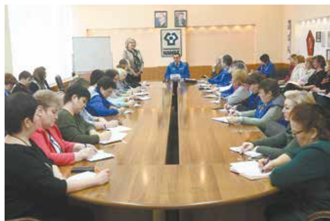
На встречах с представителями фонда заводчане узнают всё об условиях участия в программе НПО

— Решение о проведении пенсионного месячника принимается совместно администрацией и профкомом. Учитывая пожелания камазовцев, специалисты НПФ «Первый промышленный альянс» готовы продолжить практику выездных мобильных офисов в организациях.