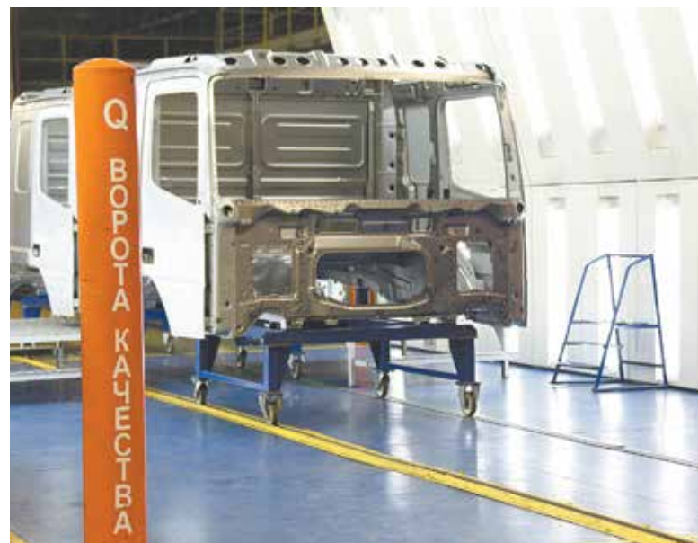
Из этих ворот должен выйти только тот продукт, что прошёл все ступени проверки качества

Динамика на литейке переключается с ситуацией на автомобильном. Два года назад 72% признавались, что не всегда могут работать, как в инструкции. Теперь таковых 58%. Почти в таком же соотношении — результаты о штрафах и наказаниях за брак. На 22% уменьшилось число утверждающих, что допустимый брак передаётся на следующие операции. Но и ини-