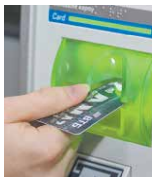
Маленькая карточка даёт ощутимую выгоду

Чтобы заказать зарплатную «Мультикарту»,