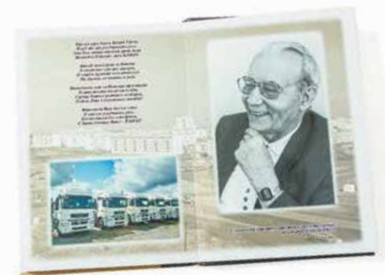
Памятная книга-фотоальбом под названием «Задание партии выполнено» — эксклюзивный подарок к 95-летию «генерала»

Будьте здоровы, дорогой наш Первый! — желают сегодня камазовцы своему высокочтимому. Живите ещё долго и счастливо!