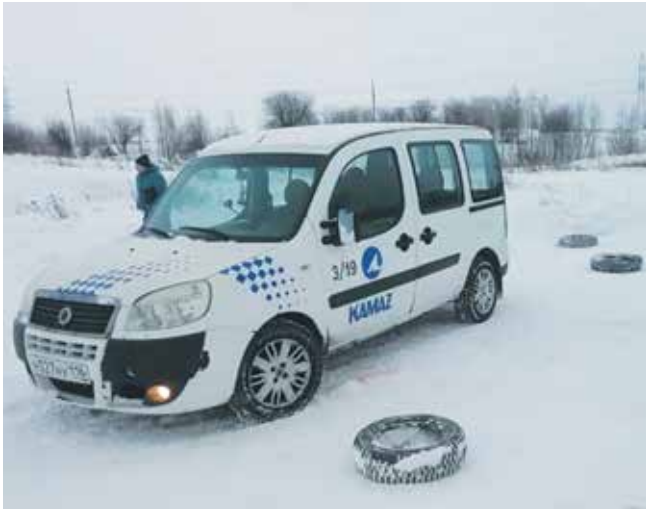
Труднее всего на заснеженной площадке проползти змей

На заснеженной площадке конкурсанты старательно выписывали «луковицу» и «змейку», взбирались на эстакаду, заезжали в гараж. Вместе с молодыми мужчинами упражнения выполняла и Ирина Усова, которая уже