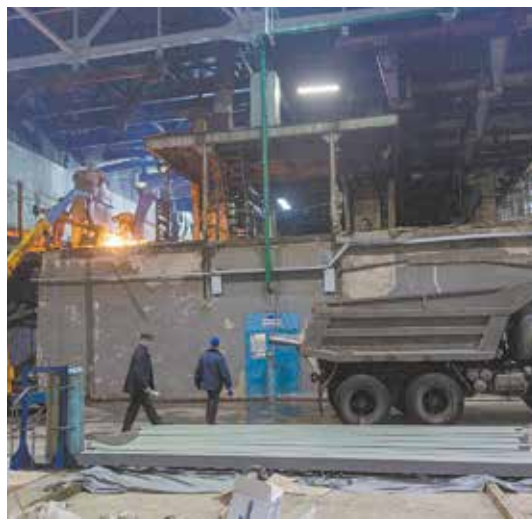
Над испытательными боксами кипит работа

Рабочие «КАМАЗэнерго-ремонта» срезают ПТК по частям. До пожара 1993 года с помощью этого конвейера на станцию подавались моторы для проведения испытаний, а после восстановления завода он не использовался. Более того, это был последний уголок на заводе, где ещё оставались следы пожара. Теперь гарь и копоть исчезнут вместе с