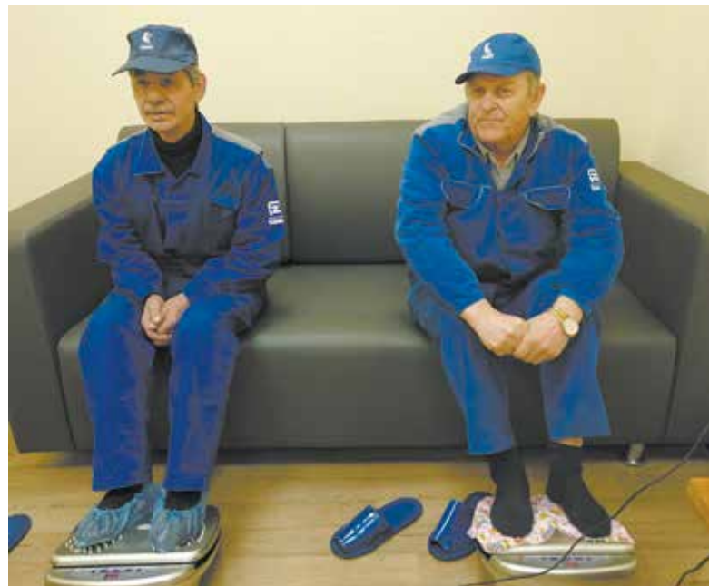
...а мужчины за процедурой ещё и новостями обмениваются

Время за разговором и приятными процедурами пролетает незаметно. За час без шума и спешки успевают получить массаж около 30 человек. Бывает, и очередь образуется, ведь в кабинете сейчас работают шесть аппаратов для массажа рук и четыре для ступней. А слесарей, использующих пневмоинструмент, на АвЗ более 700 человек.