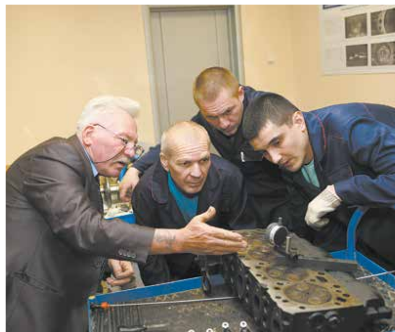
Те, кто проходят курсы обучения, на техпроцессы смотрят шире