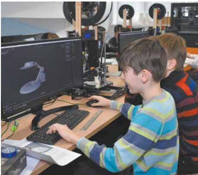
Воплощать фантастические идеи ужасно интересно

ещё юные моделлисты, учащиеся 5-6 классов, должны были с помощью технологии 3D-моделирования придумать платформу для создания голограммы человека, а ребята постарше, из 7-9 классов, спроектировать и создать марсоход. Для этого командам нужно было сделать чертежи с необходимым количеством проекций, создать САД-модели, напечатать их и собрать фантастические механизмы.