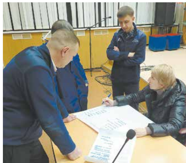
Разбивка на рабочие группы позволяет охватить максимум вопросов

В промежутке между заводскими начнётся серия внутрипроизводственных сессий. Здесь под руководством заместителей директора будут рассматриваться вопросы на уровне корпусов: чугунного, стального, цветного литья, а также цеха точного стального литья и ПЛО. Такая двухуровневая система работы действует на ЛЗ уже третий год и позволяет существенно расширить диапазон решаемых проблем.