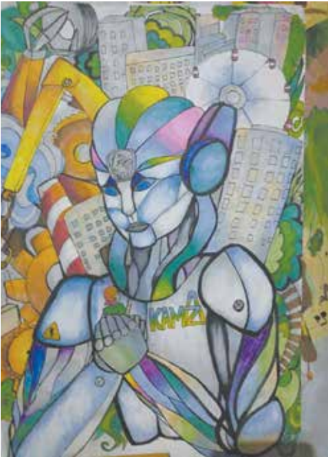
Для юной художницы КАМАЗ — это не только тягач