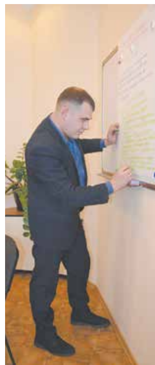
Обсуждения в рабочих группах приобретают законченную форму

Обнаружив потери в моменты запуска и передачи