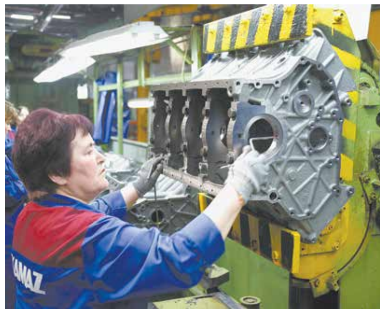
Работа контролёров качества. Вердикт о годности детали выносится после множества проверок

Результаты опроса достоверны для принятия управленческих решений. Первые впечатления заказчика — учить, учить и ещё раз учить персонал «КАМАЗа». Особенно рабочих. Самое ценное, заверили «ВК», будет аккмулировано и внедрено. Ведь всё делается ради одной главной цели — качества.