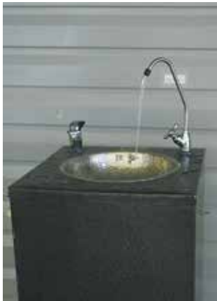
И хотя жара, июль ещё впереди, думать о живой воде прохлады надо сейчас

На заводы «КАМАЗа» уже поступило 37 автоматов газированной воды. Продолжается установка и запуск шести автоматов на литейном заводе. В 2020 году обновление оборудования будет продолжено.