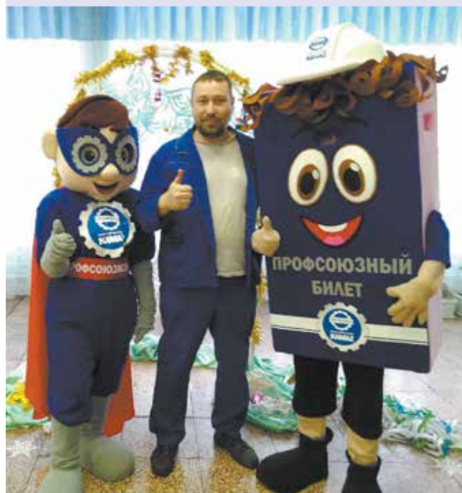
Все хотят сфотографироваться с супергероями

Чем ближе Новый год, тем больше чудес! Сначала у завода двигателей зажглась исполнинская ёлка, состоящая из нескольких хвойных деревьев (о ней «ВК» писали в № 43), затем по цехам с мешком подарков прошлись Дед Мороз и Снегурочка, и, наконец, пожаловали супергерои: Профсоюзмен и его верный друг Профсоюзный Билет. В обеденный перерыв дизелисты собрались у новогодней фотозоны, оформленной в столовой АБК-306. На фоне нарядной ёлочки и праздничных декораций работники завода с удовольствием сделали фото на память с необычными гостями.