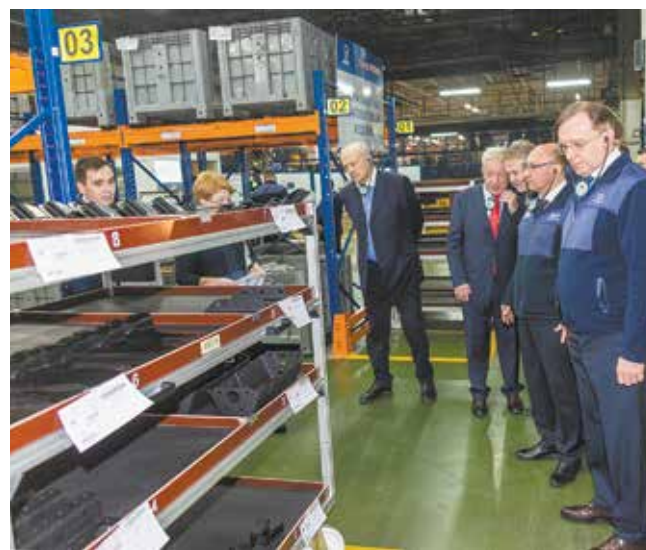
Персонал осваивает применение мобильного терминала, с помощью которого прослеживаются все операции в межконвейерной зоне

— За год проделана очень большая работа. Но кон-