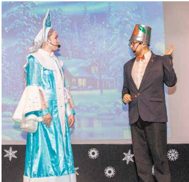
Снегурочка и Снеговик ломают голову, что же подарить заводчанам вместо сладостей, которые съела Шапокляк?