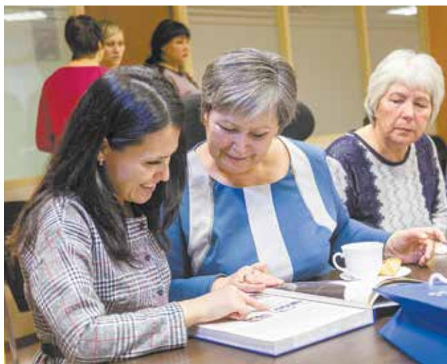
Читать «Историю «КАМАЗа» лучше вместе

Татьяна БЕЛОНОЖКИНА.