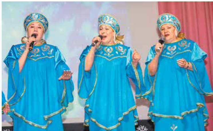
Лучший подарок — песня, знают в вокальном ансамбле «Ивушка»