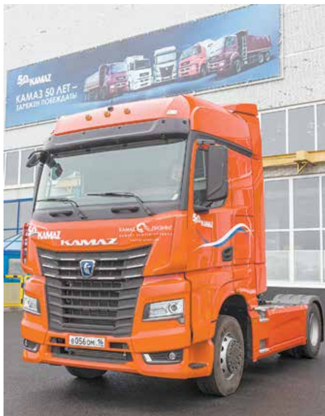
Задача 2020 года — вывод на рынок автомобилей поколения K5

стральные тягачи, причём падение было почти в два раза, что было достаточно проблематично для нас. Поэтому и автомобилей поколения K4 мы выпустили меньше, чем планировали. Однако существенны в нашем бизнесе те шаги, что сделаны по мусоропереработке, мусорная реформа для нас имеет по крайней мере один позитивный фактор: резко увеличился сбыт мусоровозов, поставки шасси на заводы-производители мусоровозов шли почти весь год устойчиво и стабильно. На