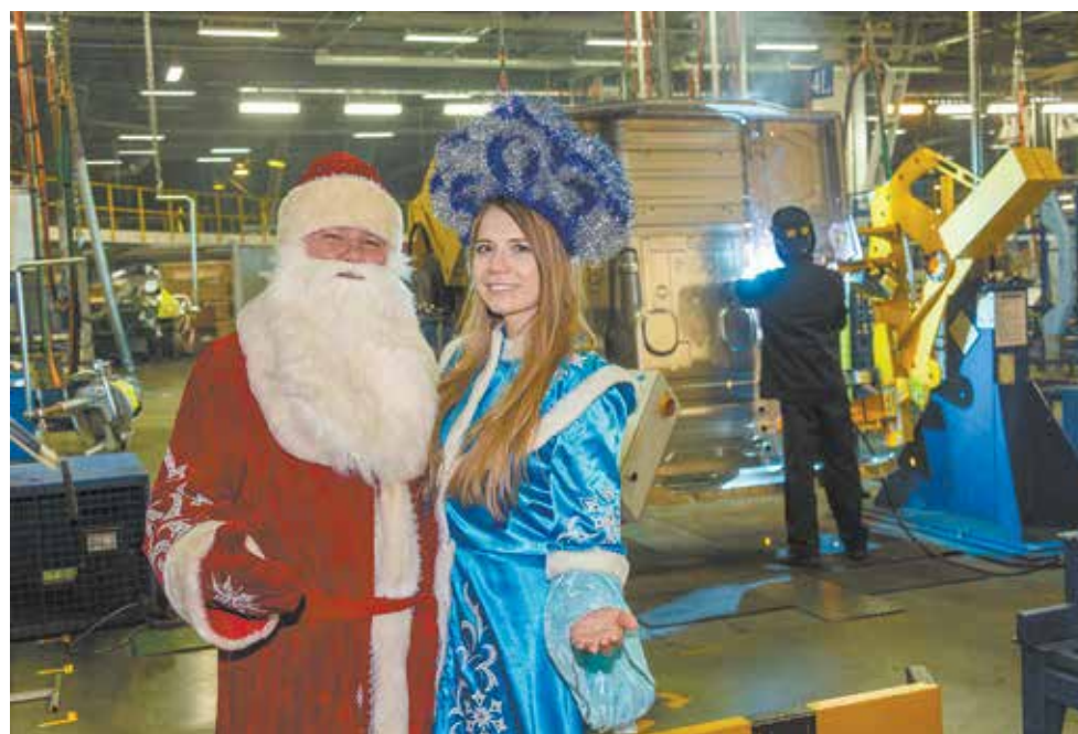
Включаем новогоднее настроение!

Обнаружить шествие среди роботов, сварочных постов и сборочных конвейеров просто — Дед Мороз напевает свои любимые песни, а Снегурочку сопровождает шлейф шоколадно-цитрусового аромата.