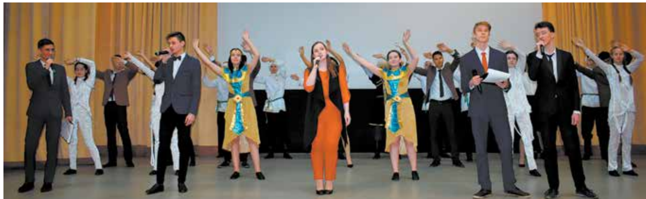
Искренние музыкальные поздравления растопили сердца ризовцев

Свои поздравления для шефов приготовили учащиеся Техколледжа. Ребята напомнили значимые даты, вписанные в историю «КАМАЗа», а затем во весь голос заявили о своих намерениях «решать будущее страны». Были и лирические композиции, Новый год всё же скоро... А ещё задорные татарские, русские танцы и даже лезгинка. Заводчане горячо поддерживали студентов аплодисментами из зрительного зала. Они готовы помочь им развить свои таланты и на заводской площадке, ведь инструмент будущего делать молодой смене.