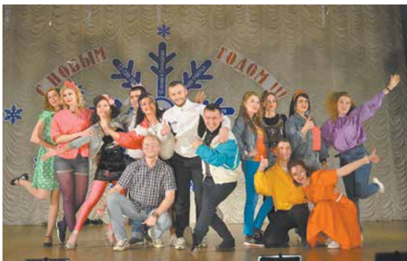
Творческий коллектив кузницы заметно растёт количественно и качественно