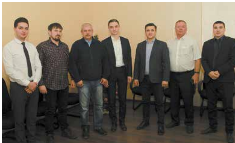
У конструкторов и испытателей общая цель — довести 54901 до совершенства