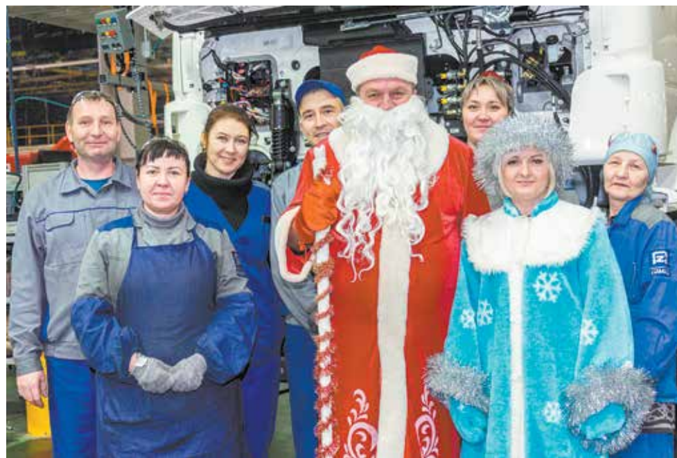
С Дедом Морозом и Снегурочкой работать веселее

Шествие по конвейеру длится около двух часов. Подарков хватит на всех!