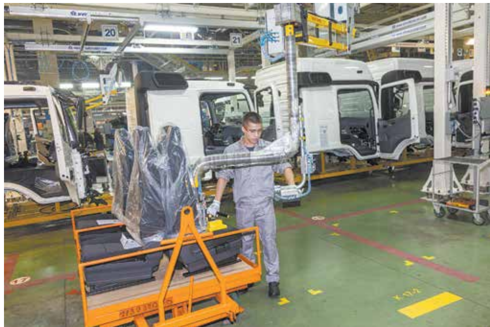
Манипуляторы и «умные» гайковёрты очень актуальны при работе с основными тяжёлыми узлами на новых кабинах