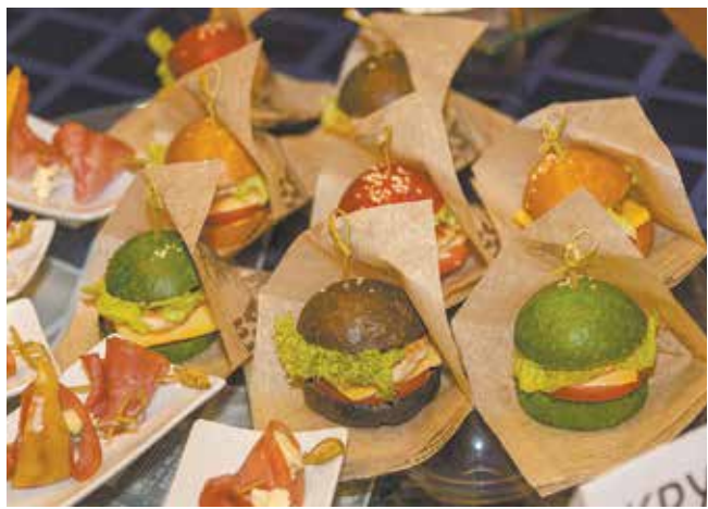
Камазбургер от «Крутых перцев» — яркий, сытный, аппетитный

Дегустация проходила под аплодисменты победителям. На этот раз лучшей была признана команда поваров ПРЗ.