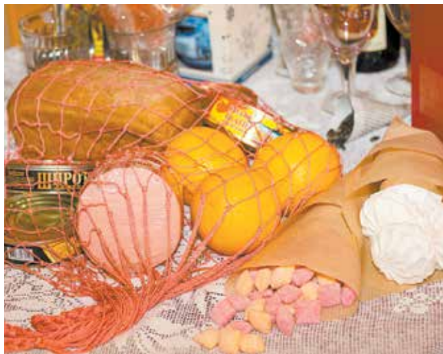
Такой продуктовый набор знаком каждому ветерану «КАМАЗа»