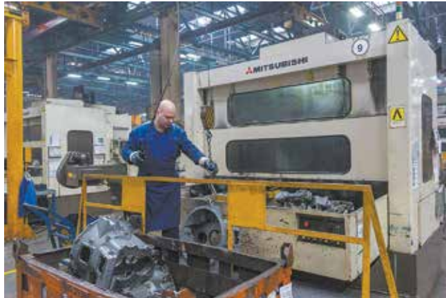
Первые станки, полученные по японскому кредиту, и сегодня работают эффективно

С годами цех расширялся, объёмы производства росли, появлялись новые станки. Сегодня в нём расположено 155 единиц оборудования, в том числе 65 ОЦ и роботизированный комплекс. В цехе созданы условия, позволяющие в кратчайшие сроки без подготовки производства изготовить любое изделие. Добиться таких результатов стало возможно благодаря наличию участков универсальных сборочных приспособлений (УСП) и комплектования инструментальных блоков. Когда поступает срочная заявка, работники цеха собирают УСП, подбирают и настраивают инструмент, разрабатывают управляющую программу и производят наладку ОЦ. Если деталь будет изготавливаться постоянно, параллельно