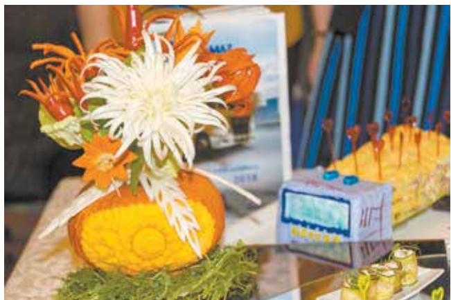
Каждый стол украшают яркие и вкусные букеты из редьки, перца, капусты, моркови