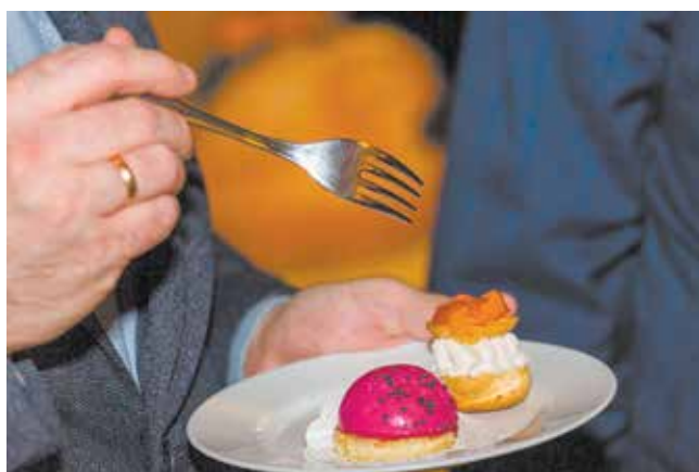
Угощение должно соответствовать уровню торжества