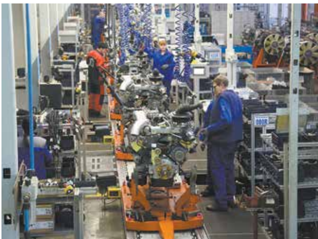
Двигатель Р6, соответствующий классу «Евро-5», себя прекрасно зарекомендовал

— Насколько актуальны разработки по дизельному двигателю? Или его уже вытесняют моторы на альтернативном топливе?