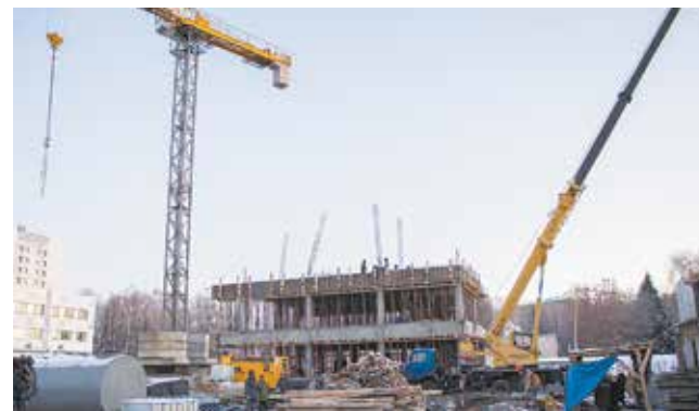
Благодаря камазовскому юбилею в Набережных Челнах будет реализован ряд социальных проектов. Строительство онкодиспансера, который станет региональным центром, уже в разгаре

— «Нам рано жить воспоминаниями», как поётся в песне. В своей жизни я реализовал достаточно много сложных проектов. Но «КАМАЗ» — самый интересный, самый сложный, и я им горжусь.