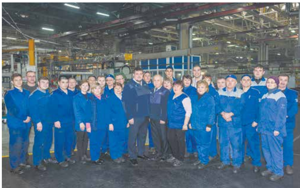
Работники 119-го — настоящий коллектив

При этом в цехе ведётся постоянная работа по внедрению улучшений. Он лидирует на заводе по числу кайдзен-предложений: за 2018