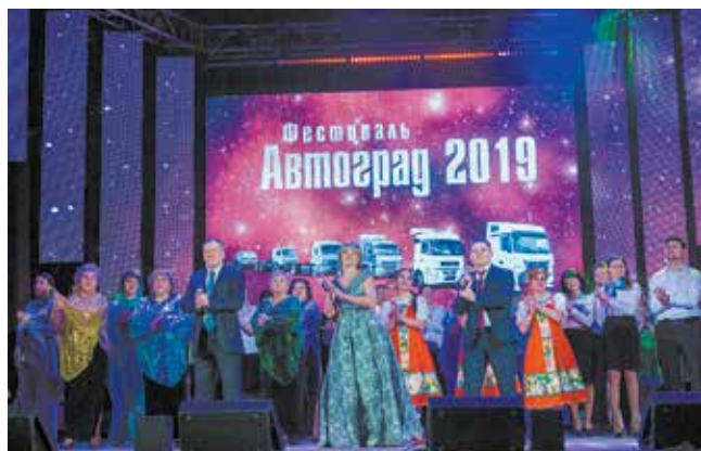
Гала-концерт фестиваля «Автоград» — главный камазовский праздник искусства

«Сильный коллектив — это содружество ярких индивидуальностей. Каждый сотрудник сегодня, как и 50 лет назад, может раз-