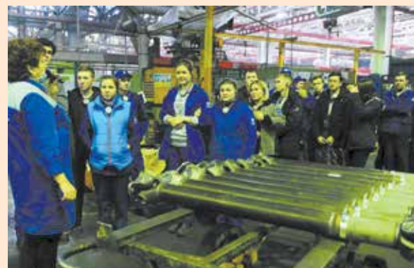
На экскурсии становится понятно, что от качества каждой выполненной детали зависит будущее автомобиля

Тут же новички получили шанс блеснуть эрудицией — специально для них была организована интеллектуальная игра «Квиз, плиз», большинство раундов которой было посвящено 50-летию «КАМАЗа». Победители получили памятные подарки и «золотой Оскар» — первую награду на АвЗ, заработанную собственными знаниями.