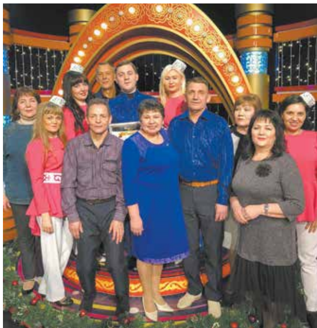
Наша артисты блестяще выступают и на заводской сцене, и в студии республиканского ТВ

Запись программы началась в 10.30 и длилась около пяти часов. Хотя все участники накануне съёмки выступали на сцене «Автограда», все были в хорошей форме.