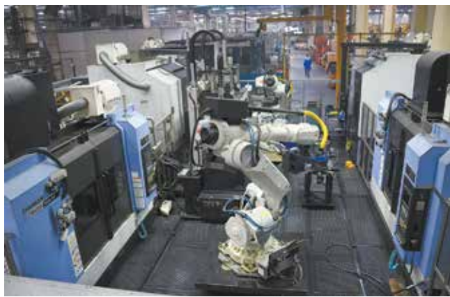
Цеху везёт на новинки: в 90-х здесь появились передовые для того времени станки с ЧПУ, в 2016-м — роботы

подключаются технологии: прописывают техзадание, составляют график подготовки производства, готовят чертежи.