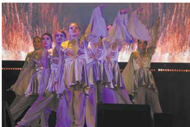
Участницы театра танца «Фьюжн» движутся слаженно, словно единый организм

Напомнили зрителям и о том, что на ударную комсомольскую стройку приезжали люди разных национальностей, которых «КАМАЗ» объединил в одну дружную семью. Это тоже нашло своё