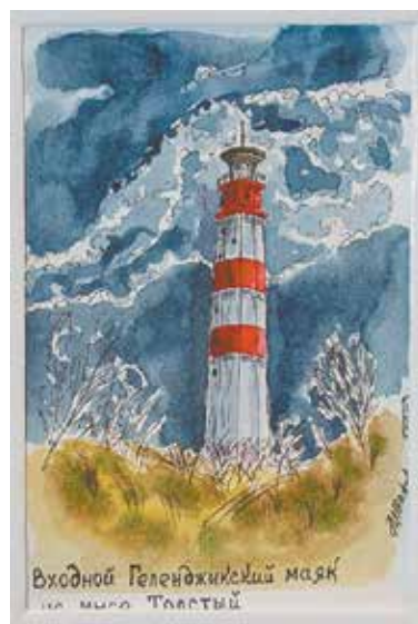
Маяк на Толстом мысе в Геленджике художница мечтала написать задолго до поездки