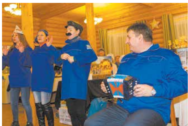
Хорошие повара и накрывают, и частушкой порадуют