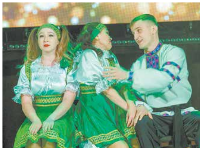
Хрестоматийное «на десять девчонок по статистике девять ребят» в трактовке хореографического ансамбля Ав3

Тем временем за кулисами, очевидно, успели про-