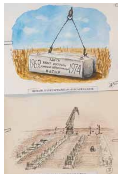
Дань приближающемуся юбилею — камазовская тематика на выставке

поступать в университет на отделение живописи: «Ей надо было упражняться в академическом рисунке. Купили всё необходимое: акварель, кисти и прочее. Но дочь передумала и теперь учится в Санкт-Петербургском технологическом институте, а художественные принадлежности остались лежать без дела. Я нашла несколько уроков скетчинга в интернете и с тех пор рисую почти каждый день. Акварель мне нравится своей выразительной силой, работы по-