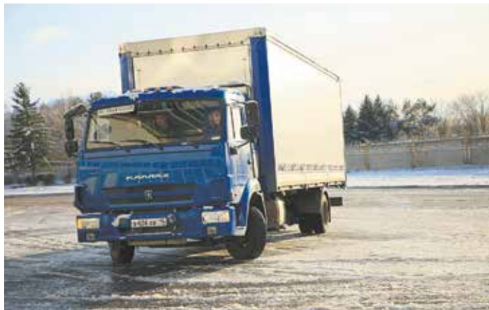
Пока «КАМАЗ» тестирует беспилотный транспорт на закрытых территориях

нормативной базе, и это точно не 20-21 годы. Пока мы взяли ориентир по эксплуатации беспилотного транспорта на закрытых территориях. Но... Электробусы тоже совсем недавно казались «гостями из будущего»!