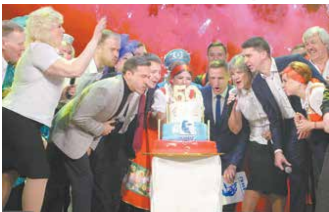
Главный приз — торт со свечами — достался всем

Награда на этот раз была для всех общая — на сцену под праздничные искры фейерверка выкатили торт с эмблемой «КАМАЗа» и золотой цифрой «50».