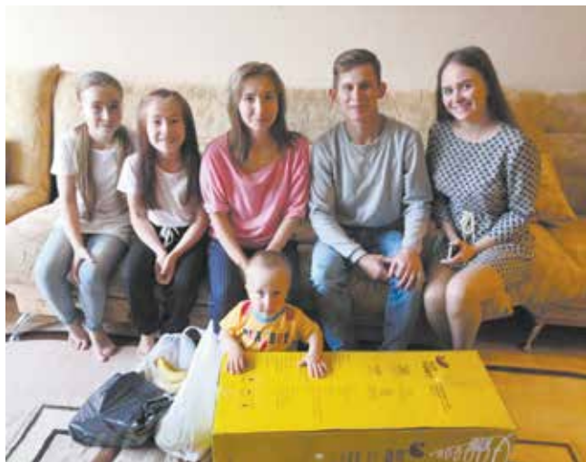
В большой семье новому пылесосу очень рады

А молодые специалисты пока обдумывают новые идеи добрых дел. До дня рождения «КАМАЗа» ещё есть время.