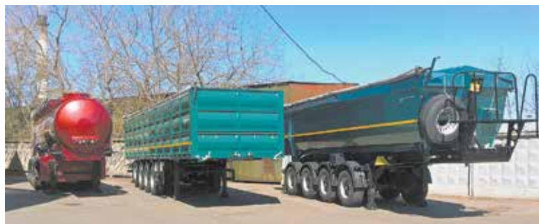
Четырёхосные бензовоз, самосвал и зерновоз — новинки очень актуальные

Основное преимущество новинок в том, что по сравнению со стандартными трёхосными применение дополнительной четвёртой оси на полуприцепе делает автопоезд не пяти-, а шестиосным,