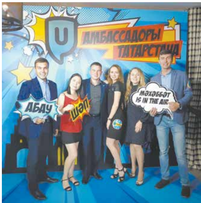
Один из организаторов форума, Академия молодёжной дипломатии «Сэлэт», считает студентов, обучающихся в других странах, амбассадорами Татарстана

Идеи были разные. Молодые люди, озабоченные проблемами окружающей среды, предлагали