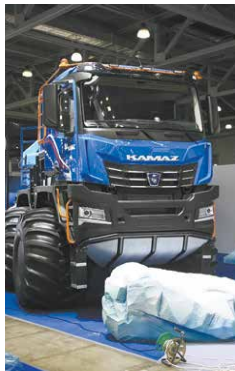
Мощный вездеход КАМАЗ-Арктика

Ещё одна новинка — городской полунизкопольный дизельный автобус НЕФАЗ-4299-30-52 , отличающийся современным дизайном. Подходит для маршрутов с невысоким пассажиропотоком (ёмкость 72 человека). Автобус соответствует программе «Доступная среда», экоклассу «Евро-5», оснащён автоматической КПП. В пользу модели говорит умеренная стоимость техобслуживания и большой срок эксплуатации. Гарантия — 24 месяца, или 150 тыс. км пробега.