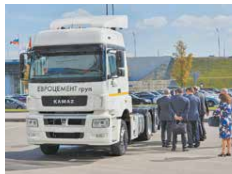
Первый КАМАЗ-65209 на СПГ холдингу «ЕВРОЦЕМЕНТ групп» передан для опытно-промышленной эксплуатации

аналитики. В рамках пилотного проекта ПАО «КАМАЗ» планирует оборудовать порядка сотни грузовиков из действующего автопарка X5 специальным программным обеспечением, которое позволит осуществлять контроль над расходом топлива, качеством вождения и техническим состоянием транспортных средств. Система удалённого мониторинга и диагностики автомобилей в режиме реального