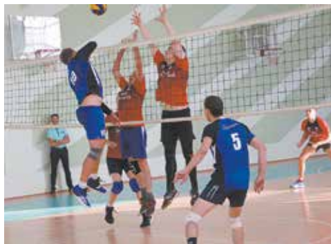
Соперники с обеих сторон волейбольной сетки были настроены только на победу

Среди участников была и команда ООО «Аккурайд Уилз Россия» из Заинска, которая в прошлом году уступила победу НТЦ, а в этом приехала отыграть. Заинцы дошли до финала, в котором встретились с игроками завода двигателей. На протяжении всех трёх сетов соперники шли бок о бок. Несколько раз Заинск выходил в лидеры, однако «движки» вновь догоняли коллег и на последних минутах вырывали победу. В итоге со счётом 2:1 команда «движков» завоевала кубок.