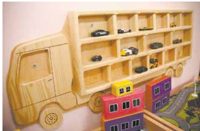
Каждая игрушка на своём месте: красота и порядок