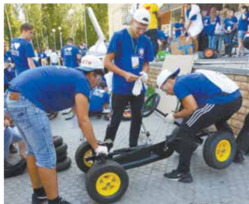
Прототип автомобиля мало собрать, надо ещё убедить инвесторов в него вложиться

— Хочу выразить благодарность представителям КНИТУ, отбравшим делегатов на форум. Все ребята уникальны, показали себя с лучшей стороны в каждом соревновании. За короткий срок нам удалось стать единым дружным коллективом, что в итоге и позволило нам занять первое место. А секрет успеха, на мой взгляд, не делить участников на лидеров и отстающих. Они все равны. Просто нужно найти свой подход к каждому. При этом надо время от времени им напоминать, что они приехали за победой, и почаще хвалить, даже если проиграли.