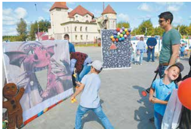
Пока не началась учёба, надо успеть поиграться