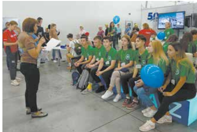
На камазовской площадке можно узнать много интересного и полезного

У всех участников WorldSkills-2019 есть шанс ещё раз попасть на площадку чемпионата, правда, уже в качестве экспертов. Для этого нужно пройти долгий и трудный путь развития профессионала, быть всегда на шаг впереди своих соперников. Первая заявка на победу уже сделана! Каким бы ни был результат, у этих ребят всегда будут предпочтения при выборе рабочего места.