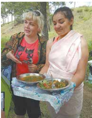
В качестве дополнения к далу туристы-кузнецы обжарили на углях кабачки и сладкий перец

Горох и чечевицу перебрать, промыть и варить до готовности около 1,5 часа. По мере выкипания доливать воду, но немного — традиционный индийский суп должен быть густым. Овощи нарезать, спассеровать на сковороде с томатной пастой и положить в бульон. Посолить, добавить специи. Перед подачей посыпать зеленью.