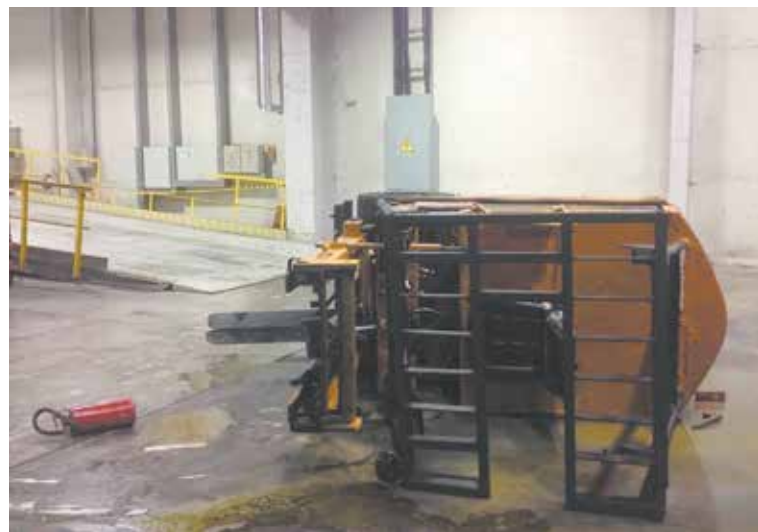
Момент после аварии

главный диспетчер цеха не контролировал выполнение инструкции по охране труда — нужно чаще напоминать водителям о необходимости соблюдать скоростной режим. На полу склада не было разметки, определяющей проезд и установку тар. Между тем специальная маркировка привлекает внимание человека за рулём, он невольно сбавляет скорость. К тому же именно в этот день (вернее ночь) начальник цеха напольного транспорта распорядился вывести водителя на работу со смещением графика с 19.00 до 3.30, а затем продлил время смены до 7.00 без его письменного согласия. Смертельный несчастный случай произошёл в 4.15.