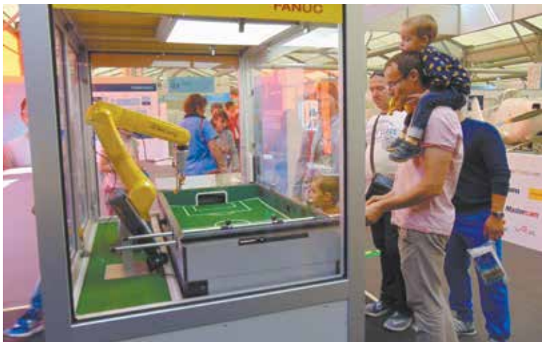
Роботы в будущем станут ещё ближе. Изучаем тактику искусственного интеллекта за игрой в хоккей