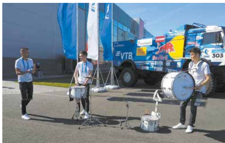
Барабанщики из группы с подходящим названием Know how задавали бодрый темп посетителям «Казань-Экспо»