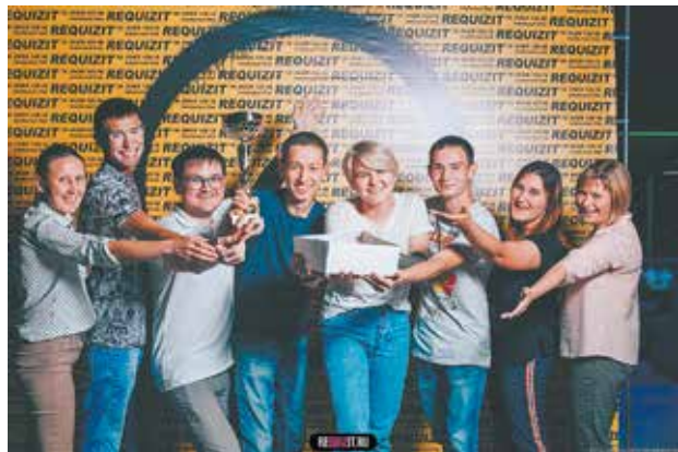
«Эконом и Ко» — обладатели летнего кубка

Интеллектуальные битвы заводчан традиционно проходят при поддержке профкома. Победителям и призёрам были вручены сертификаты от спонсоров, а также от организаторов на участие в регулярной игре.