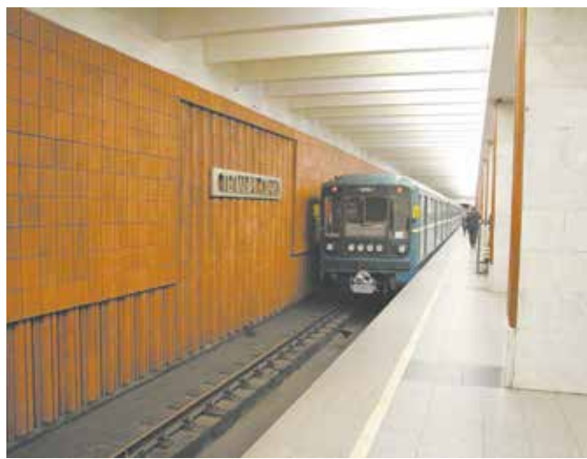
Был такой же обычный день...

Как реанимировали незнакомку, Пивнев уже не видел. Левая нога не двигалась — сам он оказался на носилках уже на краю платформы в техническом помещении.