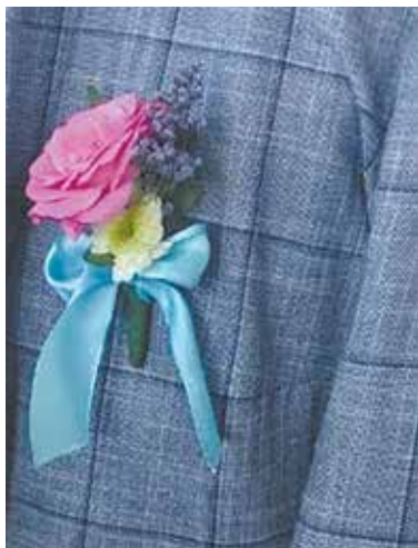
Сувенир на память от компетенции «Флористика»