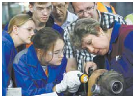
Ребята учились находить дефекты продукции непосредственно на производстве