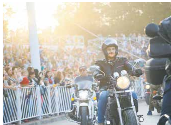
Стремительно и оглушительно: идут байкеры из мото клубов «Ночные волки» и «Стальные монстры»