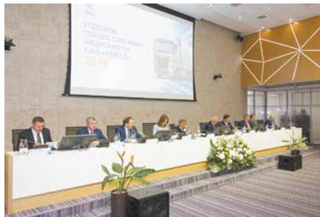
Подведение итогов года — это своего рода фундамент для новых проектов

Кворум годового собрания обеспечивали 92,61% от числа голосующих акций, с 13-ю вопросами повестки дня управились менее чем за час. Комментируя итоги-2018, руководители отмечали, что он был непростым, после реализации в стране ряда масштабных проектов заметно снизилась инвестиционная активность. Автомобильный рынок особенно ощутил это во втором полугодии.