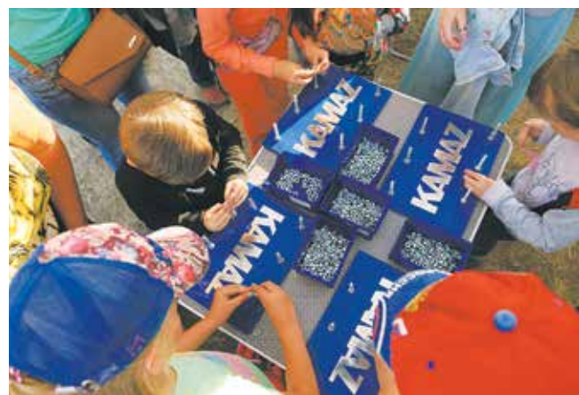
Закрутить как можно больше гаек под силу только самым проворным пальчикам