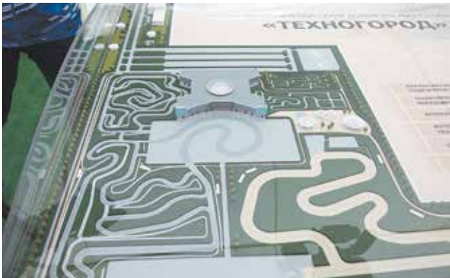
Проект Многофункционального центра допобразования «Техногород»

Презентация получилась очень динамичной: восемь юных гонщиков, участников первенства России по мини-багги, продемонстрировали VIPам, вручившим им подарки, своё искусство. Это выглядело символичным: если движение — то вперёд.