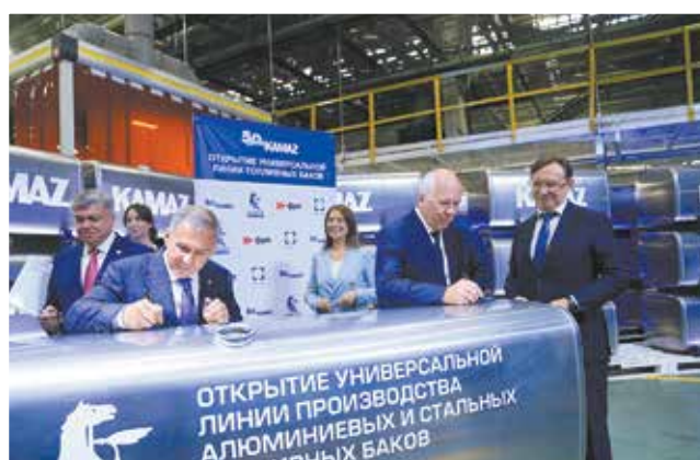
VIP-автографы на 800-литровом топливном баке (которому теперь путь — в заводской музей) завершили краткую церемонию