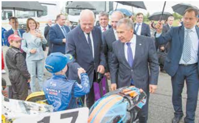
Эти парни достойны рукопожатия VIPов