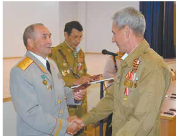
Медали вручены 33 работникам

На «НЕФАЗе» День ветеранов боевых действий отмечается с 2015 года. В связи с праздником 94 ветерана предприятия были поощрены денежными выплатами.