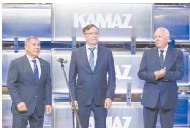
Рустам Минниханов подчеркнул, что «КАМАЗу» удаётся одерживать победы даже в сложный период