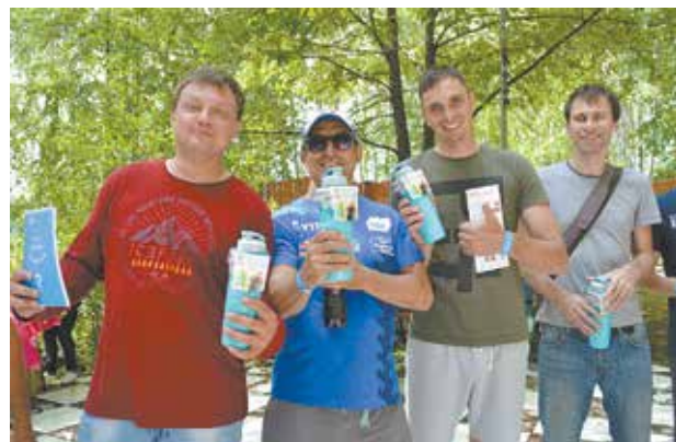
Уйти с подарком с такого праздника — дело чести