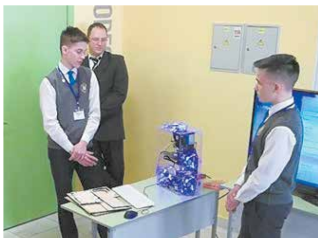
Работа такого системника как на ладони

Есть будущие инженеры и техническая база. В сентябре 2018 года в школе открылись несколько профильных лабораторий. В частности, три 3D-принтера, 3D-сканер и расходные материалы к ним были приобретены для лаборатории 3D-моделирования за счёт «КАМАЗа». Компания оказала помощь в реализа-