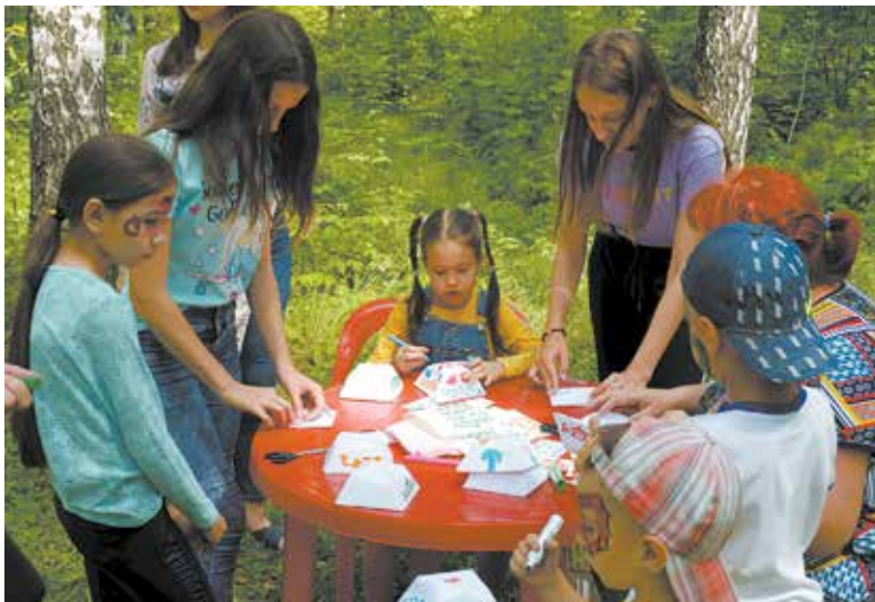
Чья тубетейка краше?

На поляне Сабантуя был дан старт традиционному конкурсу «Папа, мама, я — дружная семья». Главным триумфатором праздника стала команда руководителей завода, одержавшая победу в перетягивании каната. На следующий год соперникам надо собраться с силами и обязательно взять реванш!