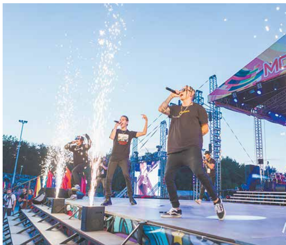
Энергичная и зажигательная, под стать тематике праздника, группа MBAND

Площадку «П Ж Д Т Сервиса» с макетом железнодорожной станции облюбовали самые маленькие посетители. Дети переводили стрелки и с любопытством наблюдали за ходом