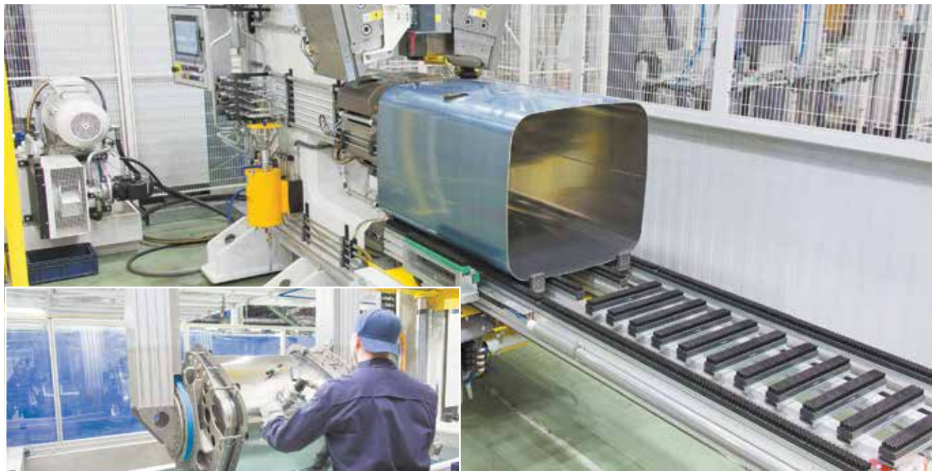
Всё начинается с подъёма механической рукой листа алюминия и его сгиба, и доходит до финишного этапа — испытаний на герметичность уже сваренного бака. Каждого