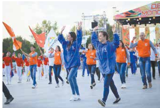
Талантливые, активные, успешные: их так много, что едва поместились на площадке обновлённого майдана

Художники, певцы, танцоры, байкеры, спортсмены, лидеры, профессионалы, молодожёны — самых разных челнинцев каждый год объединяет День молодёжи. А «КАМАЗ», по традиции, сыграл яркую роль в городском празднике.