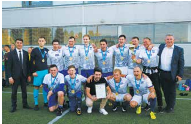
С заслуженной победой, автозаводчане!

водоканальцы ответили им тем же. К концу матча счёт не изменился — 2:2. С учётом результатов предыдущих игр первое место занял АвЗ, второе —