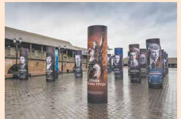
Цель проекта — привлечь внимание к важности и значимости труда людей рабочих профессий

Выставка будет работать до 1 октября. Вход свободный.