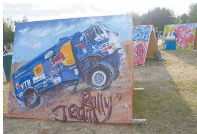
Картину с гоночным грузовиком художница Алина Хайруллина решила подарить «КАМАЗу» на 50-летие