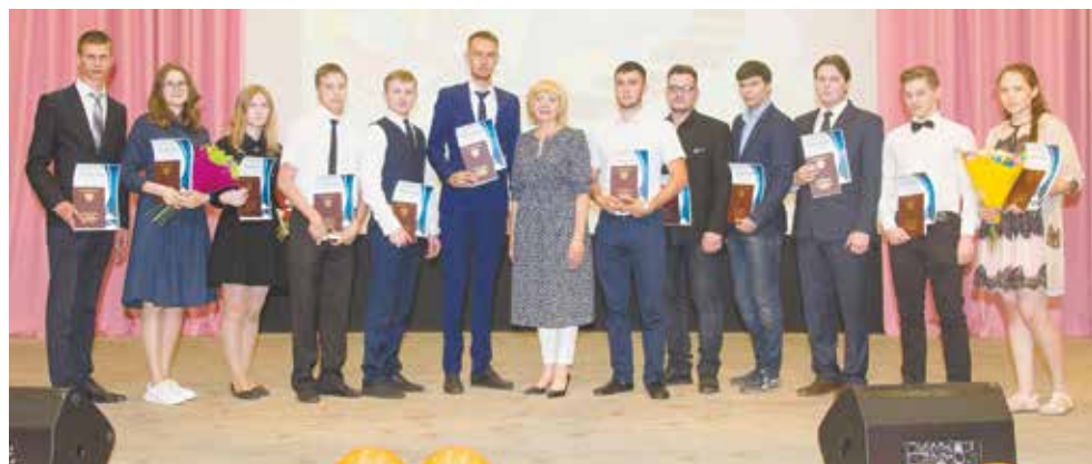
Первыми вручали красные дипломы — их в этом году 12

В зале «Прогресс» 27 июня собрались студенты, отучившиеся по специальностям «Наладчик станков и оборудования в механообработке», «Программирование в компьютерных системах», «Компьютерные сети», «Техобслуживание и ремонт автотранспорта», «Технология машиностроения», «Автоматизация технологических процессов и производств» и «Металловедение и термическая обработка металлов». Всего в этот день должны были вручить 161 диплом, но не все выпускники смогли присутствовать: около 20 человек отправились служить в армию.