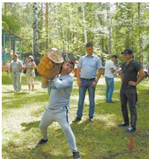
Справиться с таким метательным снарядом может только настоящий силач