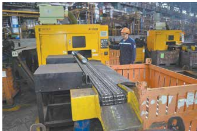
Любая небрежность в работе может обернуться травмой

Лишь один вопрос остался без ответа — почему взрослый мужчина не остановил станок и не смахнул стружку специальной щёткой? Ведь всё было под рукой. Может,