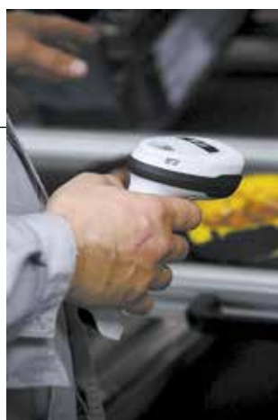
Считывающим сканером можно будет пользоваться прямо в рабочих перчатках

Кроме терминалов и стоек, которыми будет оборудовано каждое рабочее место установки деталей (всего их будет 174), на конвейере появится инструмент с обратной связью. Гайковерты будут автоматически под-