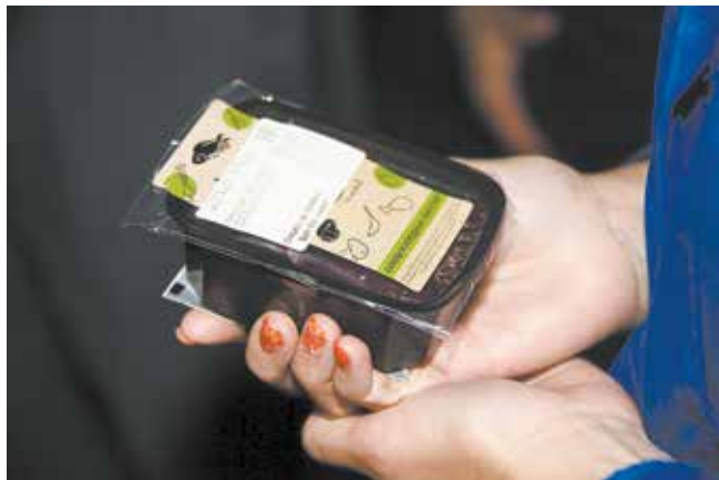
На контейнеры наклеены этикетки, разработанные в соответствии с требованиями ГОСТа: в них прописан состав, дата изготовления, срок годности, рекомендации по разогреву