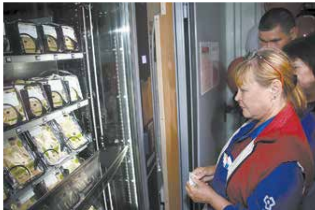
На аппарате — меню с номером ячейки, которую нужно указать для выбора блюда. Оплата происходит бесконтактным образом: работник прикладывает универсальную карту «Содекс» и получает выбранный обед