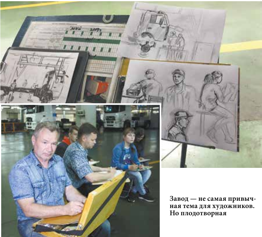
Завод — не самая привычная тема для художников. Но плодотворная

«На конкурсе мы столкнулись с тем, что большинство работ оказались однотипными: дети рисовали, в основном, автомобиль команды «КАМАЗ-мастер» в песках. Мы же хотим, чтобы были представлены художественные произведения разного композици-