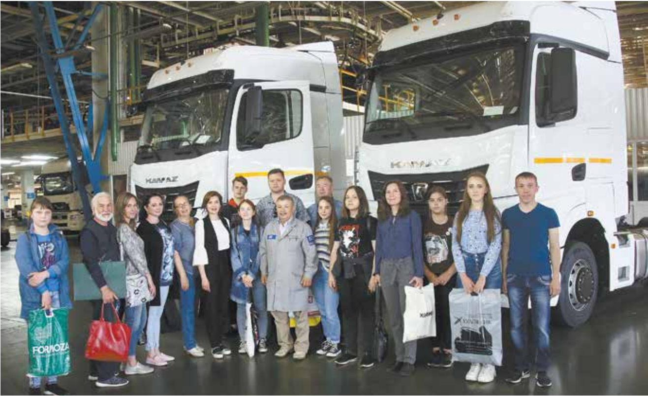
Кого-то из ребят визит наверняка вдохновит на создание шедевра

Сбор работ планируется провести в сентябре, а сам конкурс — в октябре-ноябре.