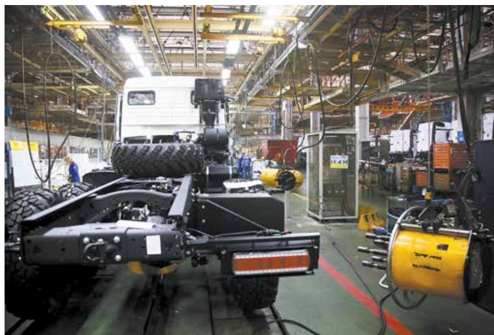
Этот гайковерт для установки колёс после подключения производственной оперативной системы будет сам рапортовать о выполненной операции

— Сейчас на Ав3 вместе с реинжинирингом автопроизводства реализуется сразу