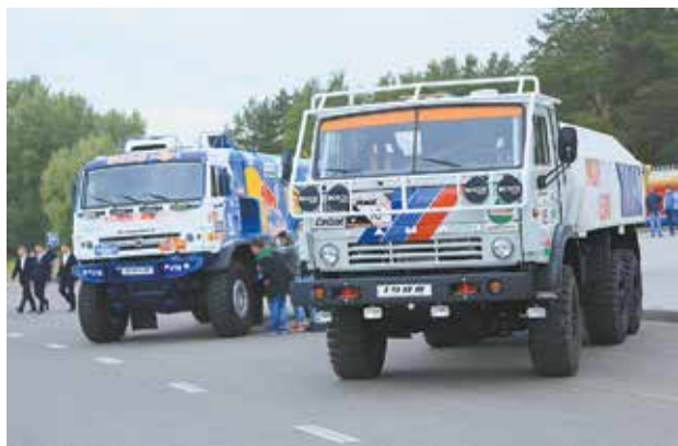
Покорители «Дакара» вызывают неизменный интерес у мальчишек

Не обошли стороной выставку «КАМАЗа» и почётные участники празднования: премьер-министр Татарстана Алексей Песошин и мэр города Наиль Магдеев. Главный конструктор «КАМАЗа» — директор НТЦ Данис Валеев рассказал гостям об особенностях грузовика нового поколения 54901.