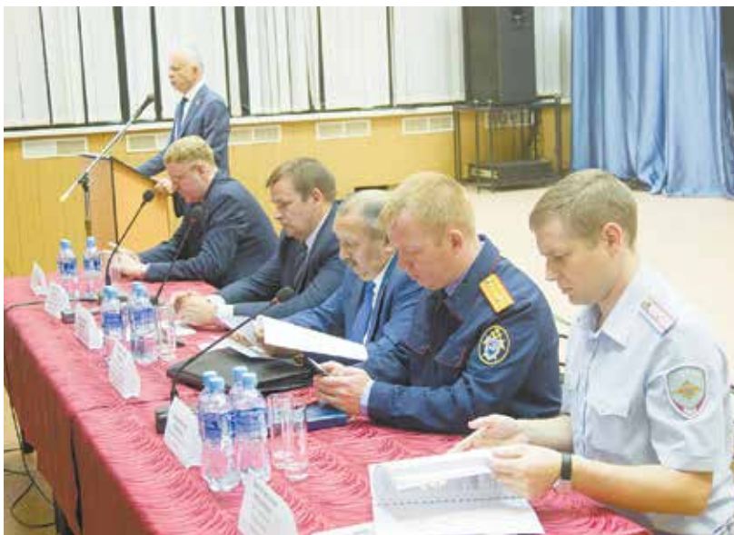
Заводчане внимательно выслушали силовиков, ведь поднятые ими вопросы касаются каждого