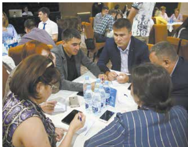
Вопросы на логику и эрудицию кому-то давались легко, а кому-то так и не покорились

Обладателем переходящего Кубка мэра и звания абсолютного чемпиона стала команда «Монооксид диоксида», представляющая «Челныводоканал».