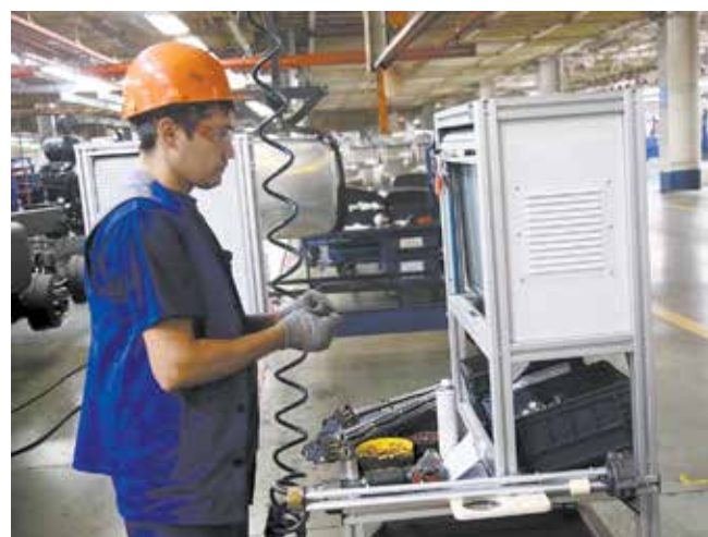
На терминале MES-системы всё под рукой