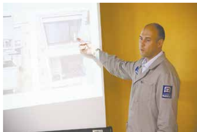
С новыми инструментами мастера и бригады знакомятся на совещаниях

В рамках акции «Лови удачу!» конечные потребители получают автотехнику от производителя в лизинг с авансом от 10%, срок лизинга — до пяти лет на весь модельный ряд. Подробности акции можно уточнить на сайте www.kamazleasing.ru и по телефонам: (8552) 45-27-32, 45-27-33.