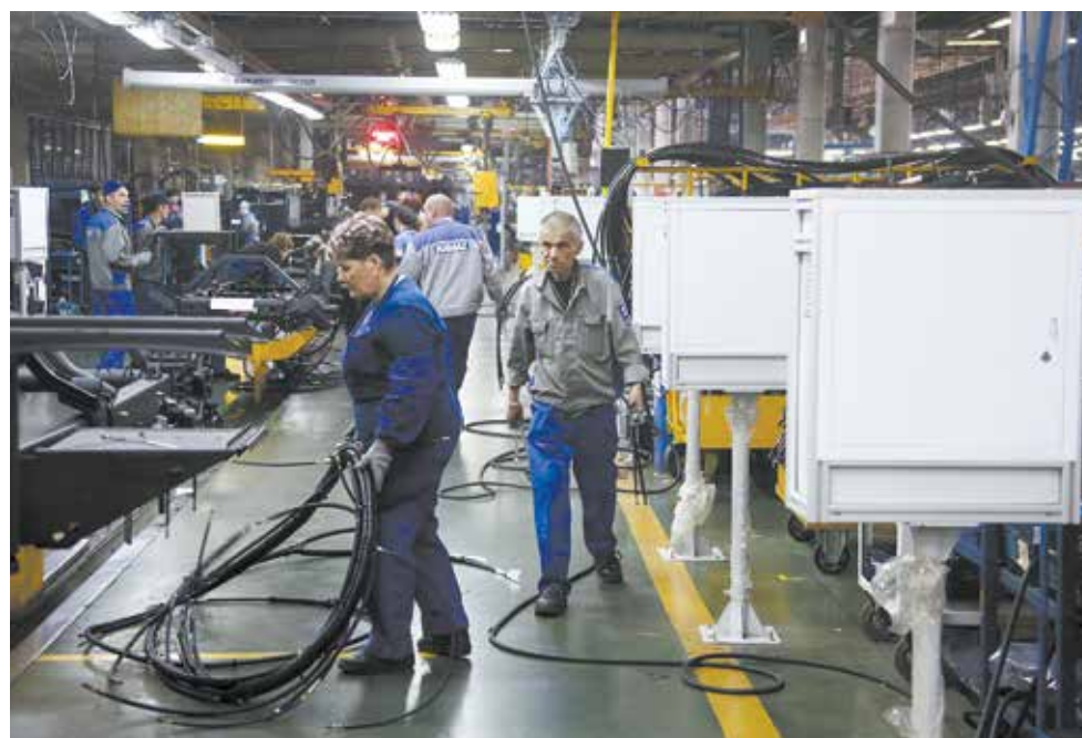
Новый штрих ГСК — стойки MES с обратной связью

несколько проектов по цифровизации — это внедрение MES-системы, электронного техпроцесса, проект идентификации и прослеживаемости, реорганизация логистической зоны, — подчёркивает начальник отдела подготовки производства