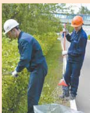
Первая настоящая работа

Придя на «НЕФАЗ», школьники от 14 до 18 лет получают возможность не только самостоятельно заработать деньги, но и познакомиться с градообразующим предприятием, на котором трудятся их родители. Ребята заняты благоустройством и озеленением территории завода: уборкой, посадкой и прополкой