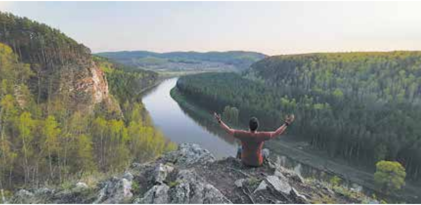
«..как хозяин необъятной Родины своей»