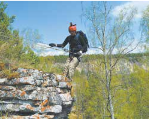
Одно из основных походных развлечений — спуск с альпинистским снаряжением

этого месте. Люди стремятся сохранить окружающую красоту в первозданном виде, чтобы, вернувшись, найти её такой же — словно бы не тронутой человеком». А самым большим приобретением она назвала дружную компанию: «Несмотря на то, что мы с ребятами впервые поехали куда-то вместе, все быстро нашли общий язык».