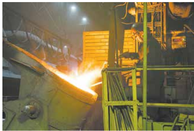
Литейный завод гости назвали передовым в России, но и он испытывает кадровый голод

В работе Международного съезда литейщиков в Казани примут участие около 700 ведущих специалистов и учёных из России, стран БРИКС, а также Германии, Италии, США, Англии, Турции и других государств. Планируется обсуждение докладов по состоянию и перспективам развития литейного производства в России и в мире, созданию новых и реконструкции действующих цехов и заводов, пути решения вопросов импортозамещения. На «круглых столах» участники обсудят технические решения, направленные на повышение качества литых заготовок, улучшение технико-экономических и экологических показателей. На выставке «Литьё-2019» будут представлены современное оборудование, технологии и материалы для литейного производства и многое другое. И, конечно же, непременным участником мероприятий станет литейный завод «КАМАЗа».