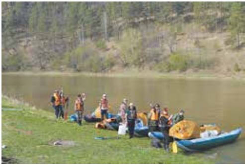
Дизелистам повезло с погодой: в начале мая солнце пригрело почти как летом