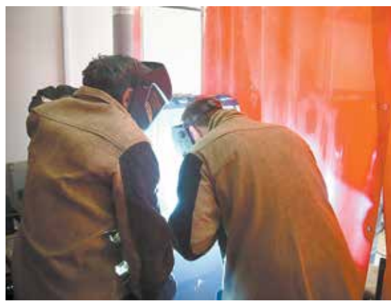
В мастерской дым коромыслом — значит, уже приступили к практике