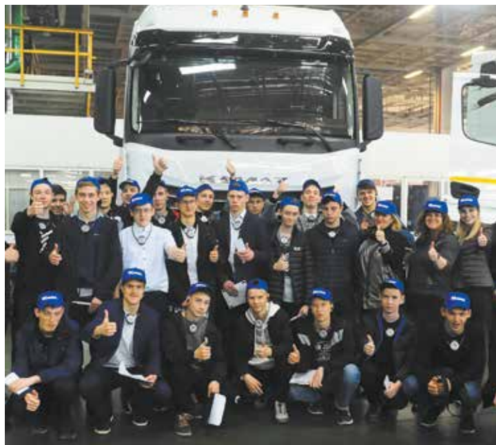
КАМАЗ на вырост для будущих ремонтников