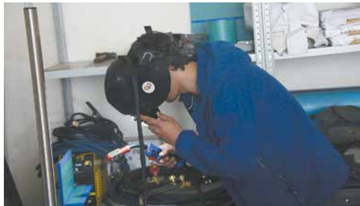
В 3D-маске обучающийся видит процесс сварки как в реальности

Всего за 2018 год обучение по направлению «Сварка» в МЦПК прошли 150 человек.