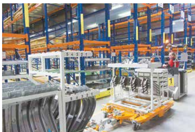
Завод начинается с зоны логистики. Детали укладываются на тележку в строгой очередности