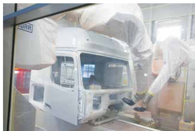
Каркас кабины красят тоже роботы

Привлечение такого количества передовых мировых технологий для их производства — беспреце-