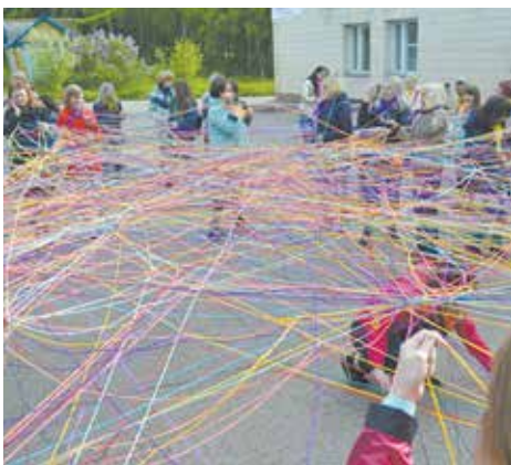
Распутать клубок под силу только слаженному коллективу