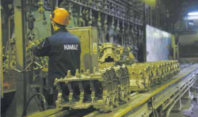
Вопросы качества решаются не только в кабинетах, но и в производственных корпусах

действия признана и литейщиками, и поставщиками материалов. Первые получают возможность озвучить и продемонстрировать проблему, вторые — выдать рекомендации по использованию их продукта и провести работу над ошибками. Доказательство тому — увеличение количества участников «круглого стола». В этом году