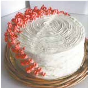
«Красный бархат» требует большого мастерства и терпения, а его приготовление занимает два дня