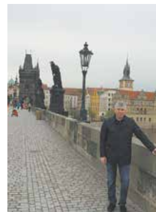
Карлов мост через Влтаву в Праге считается рекордсменом по числу туристов на один квадратный метр

— Всё вам расскажи! Есть пара тайных мечт... Не исключено!