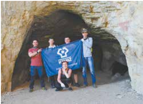
Флаг «движков» побывал и под землёй

«движках» оператором станков с программным управлением, участвовала в турслётах и спортивных соревнованиях. Активной камазовской жизни ей сейчас очень не хватает, и, узнав про сплав от мамы, которая работает на заводе диспетчером энергоцеха, девушка сразу решила ехать.