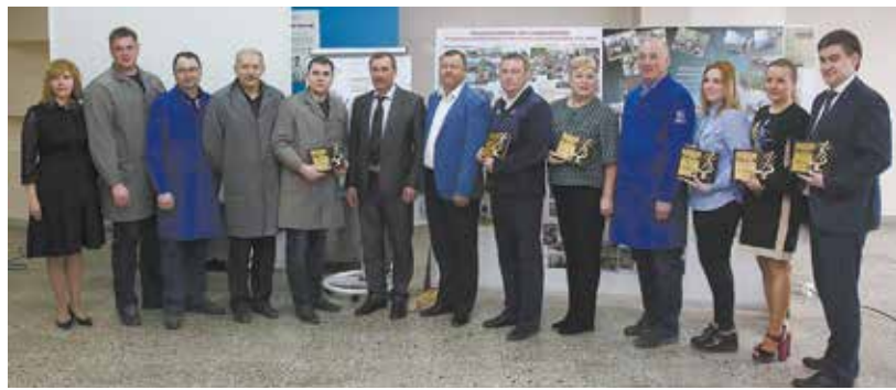
Они не курят и вам не советуют

Сегодня, 31 мая, отмечается Всемирный день без табака. «КАМАЗ» тоже не остался в стороне. В подразделениях компании всегда агитировали за развитие спорта, культурного досуга, а в этом году появился конкурс на самый некурящий коллектив. Первопроходцем стали работники блока развития.