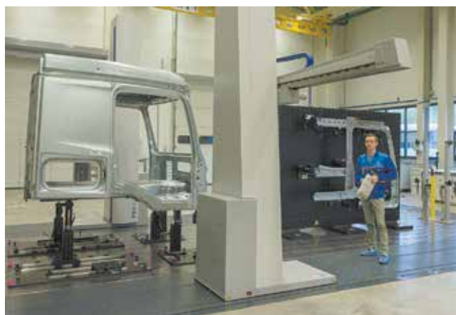
Контроль качества ведётся и на линии сварки, и в лаборатории