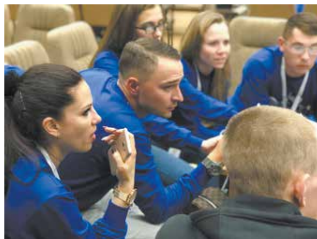
Обсуждения и разработка проектов в рамках образовательной платформы начинались рано утром и заканчивались уже ночью