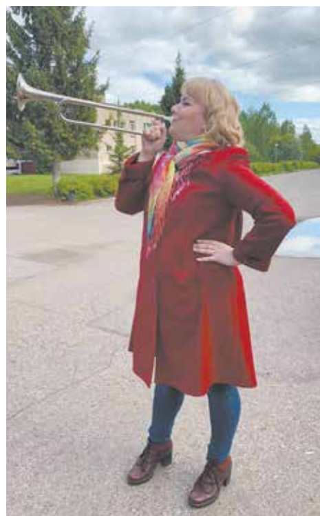
Кадровик, труба зовёт!

и награждения грамотами. На смену торжественной линейке пришёл черёд игр: интеллектуальным и командообразовательным. Игра «Крокодил» на кадровую тему и «шерстяной» тимбилдинг под весёлую музыку прошли на одном дыхании. Праздник удался на славу: шумный, насыщенный, яркий.