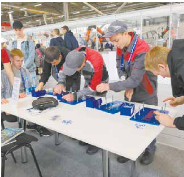
Камазовская площадка участникам Национального чемпионата рабочих профессий полюбилась особенно

Кроме школьников, которым предстоит выбрать дело по душе, к КАМАЗу часто приходили участники соревнований. После выполнения заданий они