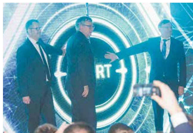
Участники церемонии стали свидетелями запуска самого современного производства