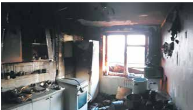
Так выглядели помещения после разгула пламени