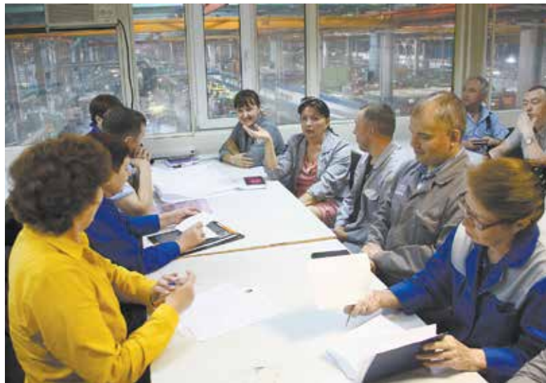
Кто лучше мастера знает проблемы производства?

Председатель Совета мастеров РИЗа, мастер цеха запасных