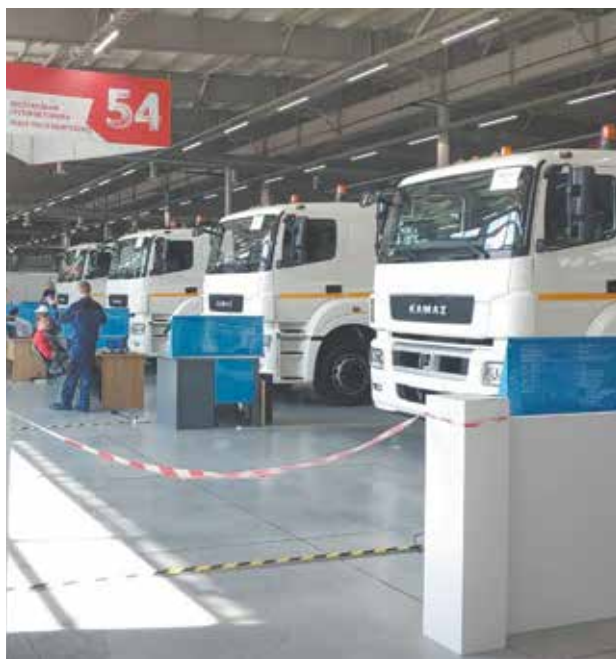
Лучшим молодым специалистам — лучшие машины

АО «ТФК КАМАЗ» для участия в компетенции «Транспорт и логистика» выделило четыре автомобиля КАМАЗ-5490. Направление данной компетенции — «Обслуживание грузовой техники». Кстати, КАМАЗ-5490 — лидер продаж по итогам 2018 года: эта модель занимает 21% от общих продаж.