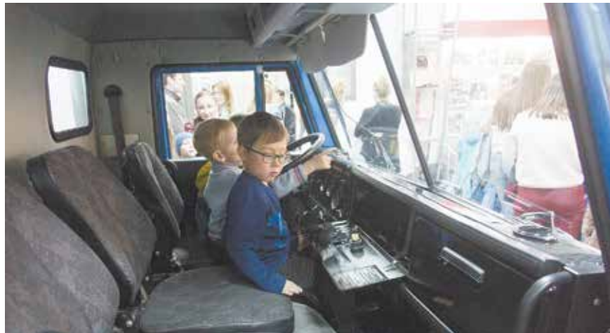
Так ездили их дедушки. Для этих ребят построят совсем другие кабины

стягались в гонках роботов-вездеходов, мастерили значки, слушали песни в исполнении воспитанников «Школы рока», на интерактивной выставке «Город на ощупь» пытались угадать,