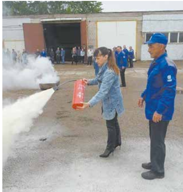
Работники ЦИКТ справились с открытым огнём за несколько минут

Проверка отточила навыки предупреждения и ликвидации чрезвычайных ситуаций и обеспечения пожарной безопасности, а персонал приобрёл необходимый для спасения жизни опыт. Оценена тренировка удовлетворительно.