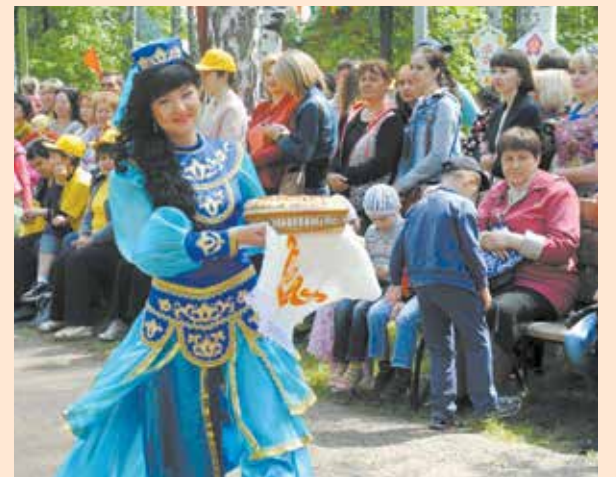
Обаятельная девушка — главное украшение Сабантуя

Кстати, в этом году заводскому конкурсу исполняется 10 лет. В честь этой даты победительница получит отличный приз — путёвку в геленджикский пансионат «Приморье».