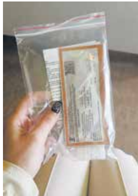
Точность теста высокая, но окончательный диагноз могут поставить лишь после обследования в специализированном учреждении

Между тем, ВИЧ — угроза нешуточная. В Набережных Челнах на учёте в СПИД-Центре состоят около 2000 инфицированных. По данным специалистов организации, почти половину из них составляют мужчины 30–39 лет, работающие и имеющие семью. Как правило, о наличии заболевания люди узнают случайно.