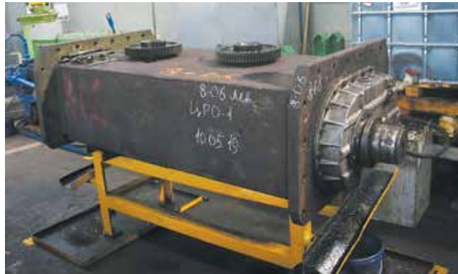
Сейчас вибраторы поступают на ремонт в штатном режиме

После монтажа вибратора узел отправляли на испытательный стенд, причём время прокрутки по распоряжению проектной группы было увеличено с четырёх часов до двух суток. Вместе с главным механиком литейного завода Валерием Гращенковым был также организован и мониторинг испытаний вибраторов в ходе работы на литейке.