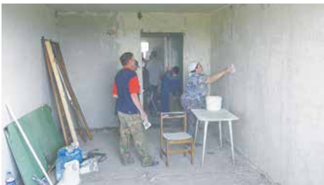
Заводчане работы не боятся, всё приведут в порядок