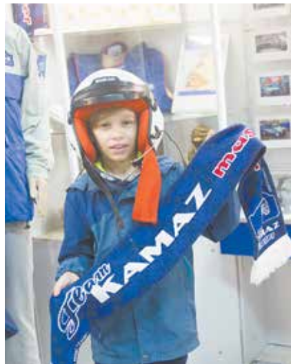
Кем себя чувствуешь, надевая шлем? Конечно, победителем!

стягались в гонках роботов-вездеходов, мастерили значки, слушали песни в исполнении воспитанников «Школы рока», на интерактивной выставке «Город на ощупь» пытались угадать,