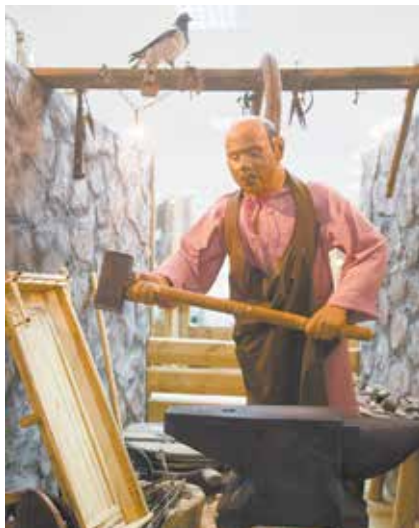
Вот бы этому молотобойцу на камазовскую кузницу попасть...

какой предмет лежит в шкатулке и как он связан с Челнами. С восьми до девяти вечера были открыты двери фондохранилища — все желающие могли увидеть уникальные экспонаты.