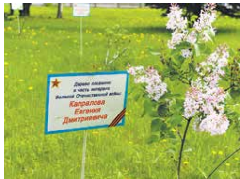
На Аллее боевой и трудовой славы АвЗ у каждого дерева есть своё имя

но-бытовыми корпусами. Позже там появились кусты сирени и спиреи. Заводчане ухаживали за деревьями, рядом с каж-