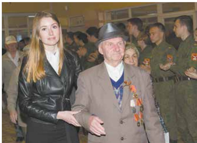
Кадеты приветствуют героев праздника аплодисментами

Каждый старался окружить почётных гостей заботой и выразить им уважение: активисты Совета молодёжи встречали бывших сотрудников своих подразделений на улице и провожали их к местам в зрительном зале. Кадеты, выстроившись живым коридором, сопровождали главных героев праздника аплодисментами.