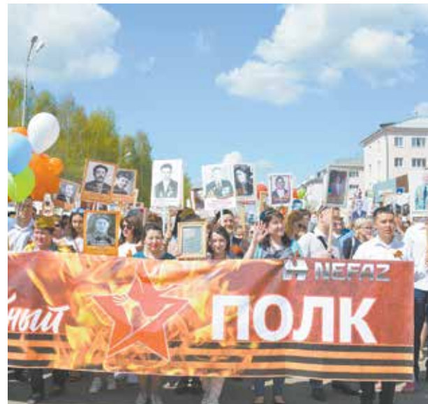
Работники «НЕФАЗа» и их родные 9 мая стали однополчанами

Кульминацией празднования стала уже ставшая всенародной акция «Бессмертный полк», к которой с каждым годом присоединяется всё большее число людей. В шествии приняли активное участие и сотрудники «НЕФАЗа» вместе со своими семьями. В небо было запущено 74 воздушных шара — по числу прошедших после войны лет. Завершилось шествие у Вечного огня в сквере Победы. Вечером здесь в знак светлой памяти героев зажгли свечи. Завершился праздник красивым салютом.