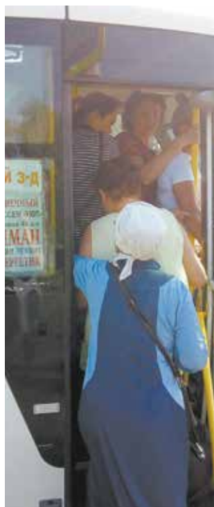
Ехать надо всем. Как быть?

Результаты проверки запотокопированы и отправлены на рассмотрение. Администрация и профком «КАМАЗа» продолжают заниматься решением проблемы.