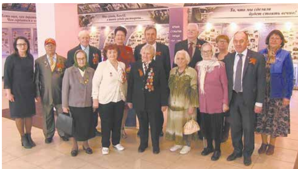
Свидетели истории в музее ПРЗ

«Вы — наша честь и слава. Пока вы с нами, мы перенимаем от вас пример жизнелюбия, оптимизма и силы, — признавались ветеранам заводчане. И от души желали: — Живите подольше!»