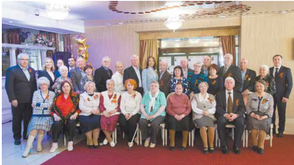
Фото на память о встрече — уже традиция

За столиками гости делятся воспоминаниями о трудном военном и послевоенном детстве. Сотрудники лизинговой компании тоже не остались в стороне — рассказывают о своих родственниках, освобождавших Родину. Мостиком в прошлое стали строки из писем участников сраже-