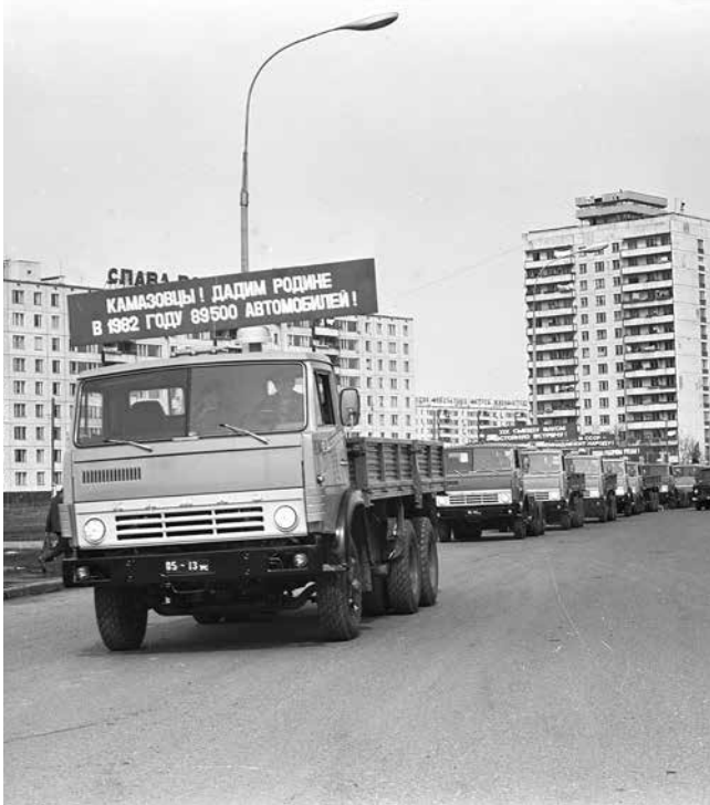
«Дадим Родине в 1982 году 89500 автомобилей!» — с таким лозунгом вышли на демонстрацию камазовцы. План, превышающий предыдущие значения на 19500 единиц, выполнили