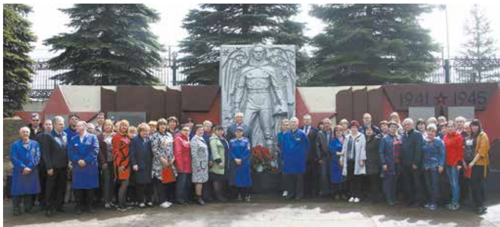
Ветераны уходят, но память о них жива

Память павших в Великой Отечественной войне почтили минутой молчания и возложили цветы к портретам ветеранов. По традиции митинг завершился хоровым исполнением песни «День Победы». На следующий день на литейном состоялся праздничный концерт.