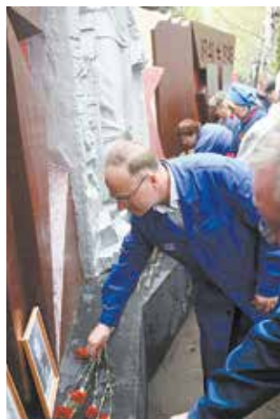
Мемориал Славы с фамилиями фронтовиков, работавших на литейном заводе, был открыт в 1985 году

ленточки, разбирали красные гвоздики. Собравшихся поздравили руководитель