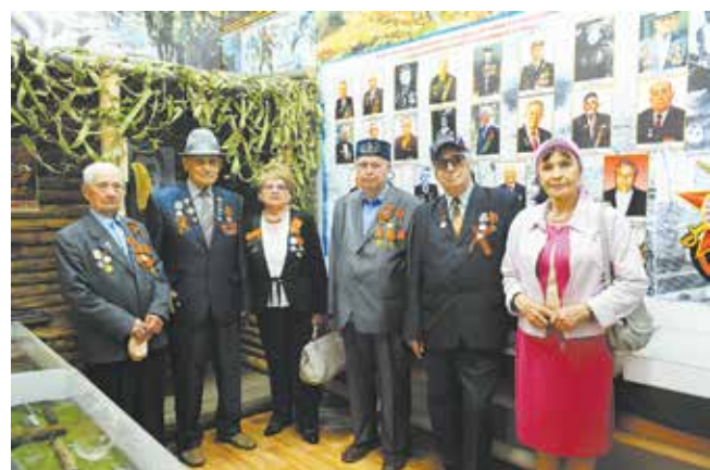
Историю боевого пути каждого ветерана здесь бережно хранят