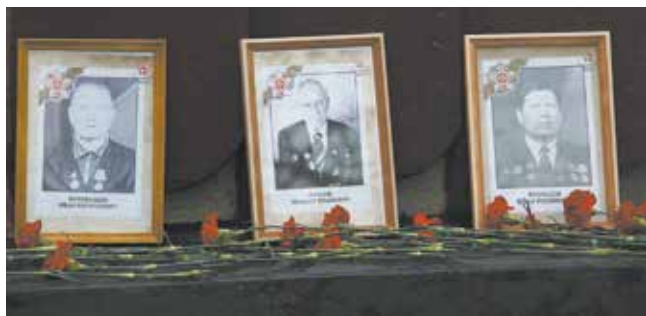
Красные гвоздики — дань уважения участникам войны

Возле мемориала смолкали разговоры — 9 Мая, как известно, праздник осо-