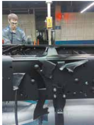
Если момент затяжки не соответствует КД — это уже критический дефект

Причин обнаружилось несколько. Будучи уверенными в поставщике, входной контроль для него проводили по упрощённой схеме. Теперь вернулись к стопроцентному контролю, вместе спартнёром выясняются обстоятельства появления брака. Вторая причина — в процессе окраски на ПРЗ. Сегодня очевидна необходимость стопроцентной отслеживаемости процес-