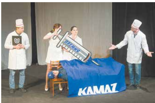
Денежные вливания явно пошли пациенту на пользу

ческого центра, для которого жюри даже изобрело специальную номинацию — «Театральный рэп».