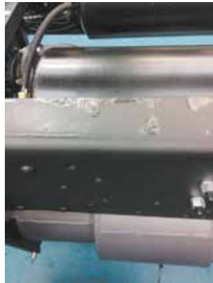
Причин отслоения эмали может быть несколько: от несоответствия эмали требованиям ТУ до недостаточной выдержки времени сушки покрытия

Вторая часть сигнала — по моменту затяжки 6580-2902443/444 кронштейна передней рессоры к раме. В день его поступления уже шла «работа над ошибками». Миновавший ворота качества