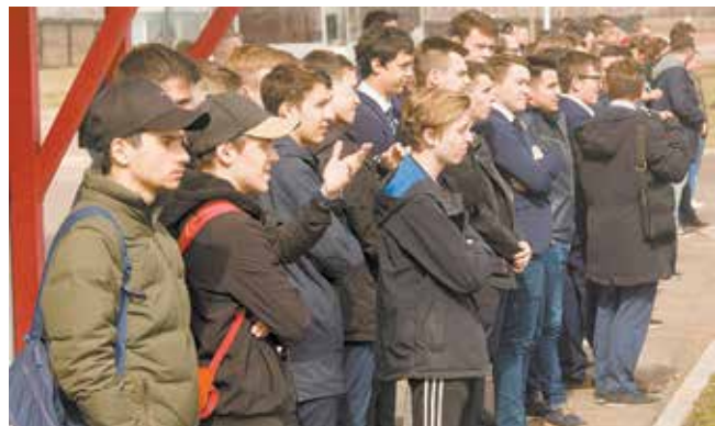
Увиденное на полигоне одних вдохновляет, других заставляет задуматься. Для создания надёжных и манёвренных машин нужны крепкие знания