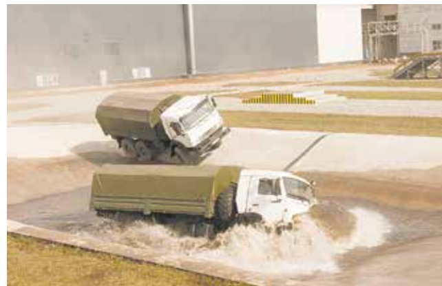
Разойтись в одном рве двум КАМАЗам не проблема. Главное — держать дистанцию