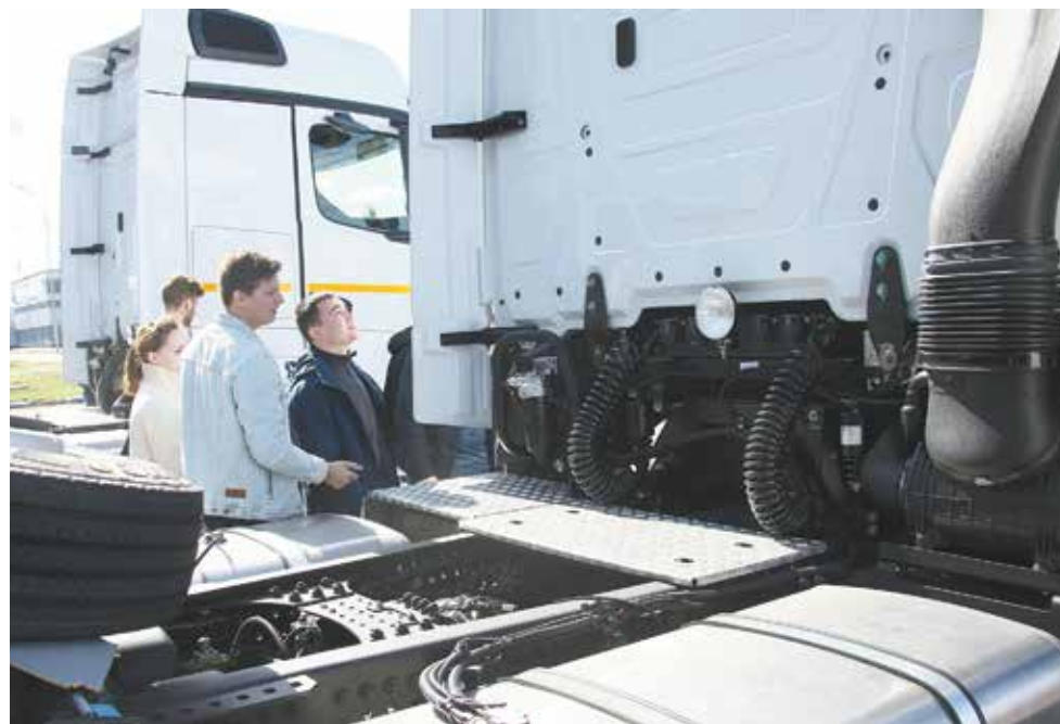
Как там наверху, в кабине нового флагмана К5, мог оценить каждый целевик

Первым забрался в кабину заместитель генерального директора «КАМАЗа» по