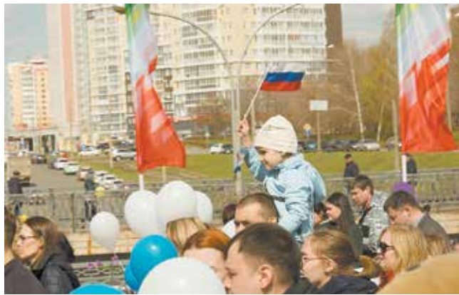
Времена меняются, а Первомай остаётся