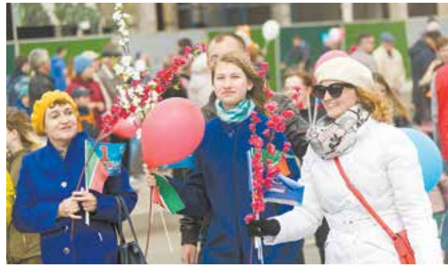
Настоящий праздник весны!