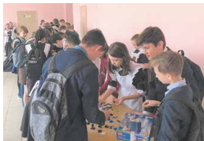
Задача — собрать КАМАЗ быстрее всех

И хотя в начале встречи к словам руководителей завода о том, что на «КАМАЗе» можно реализовать самые смелые идеи, ребята отнеслись со скепсисом, к концу дня переменились: «А может, стоит попробовать свои задумки?»