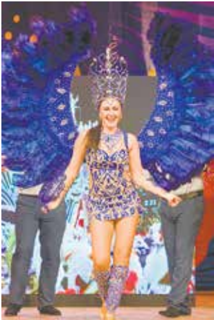
Карнавал! Так празднуют юбилей «КАМАЗа» туймазинцы