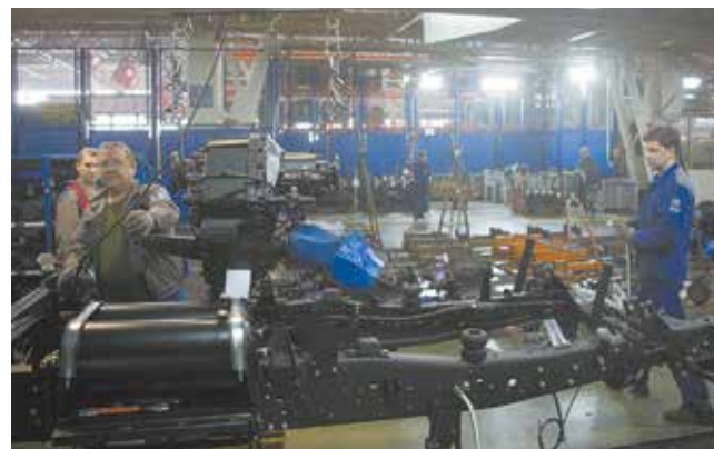
От под сборки до установки узла всего несколько метров

гистов началась программа по обновлению складов, и они согласились уступить площадку автомобильному заводу. Нишу отгородили от склада и начали обустраивать. Установили кран-балку для подачи тяжёлых агрегатов, сделали хорошее освещение, удобные подсобочные столы. Чтобы не царапать лакокрасочное покрытие поперечной балки,