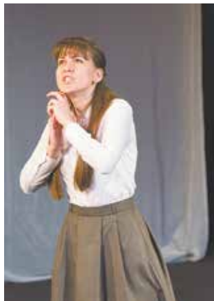
Жюри высоко оценило стихотворение Натальи Фокиной «Рука отца»

Всего члены жюри раздали 21 диплом. Все артисты также получили ценный подарок — книгу Николая Дризена «Театральная старина — страницы истории