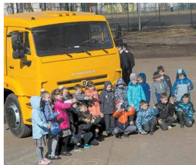
Исследовав большегруз, школьники убедились: КАМАЗ — отличная машина

Испытания на прочность продолжались в классах. Но тут тон задавали уже ризовцы. Десятиклассники всматривались в экран, где демонстрировались возможности нового флагмана 54901, отвечали на вопросы интеллектуальной игры. Самой осведомлённой оказалась команда 8 «Г». Когда предложили собрать свой КАМАЗ, сразу взялись за дело, не особо вникая