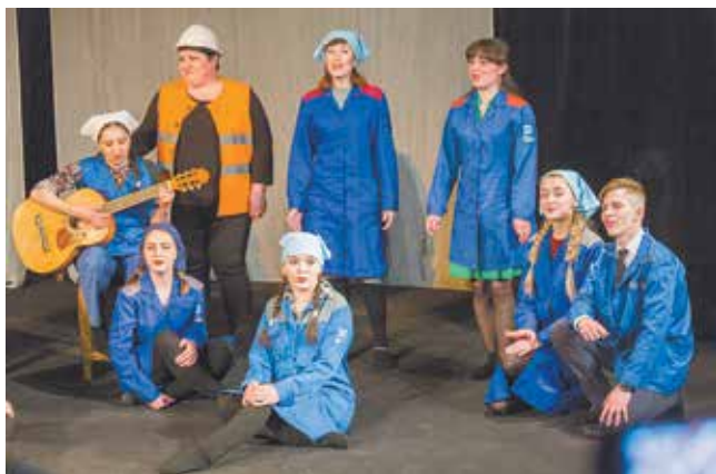
Творческий коллектив АвЗ запекает «нашу, заводскую» на мотив знаменитой «Надежды»