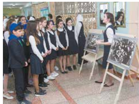
Юные экскурсоводы справились со своими обязанностями на «отлично»

представили номер, с которым участвовали в городском конкурсе «Мир профессий». Для подготовки выступления школьники в марте побывали