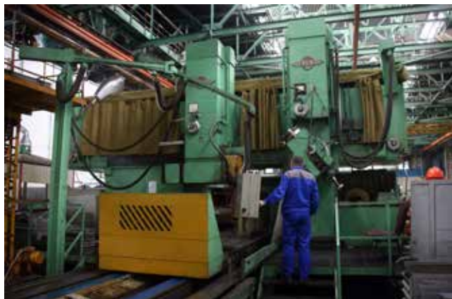
На гигантском станке и детали шлифуются немаленькие

Самые глубокие порезы — 1,5-миллиметровые — шлифуются на станке не менее трёх смен. Порядком изношенные поверхности