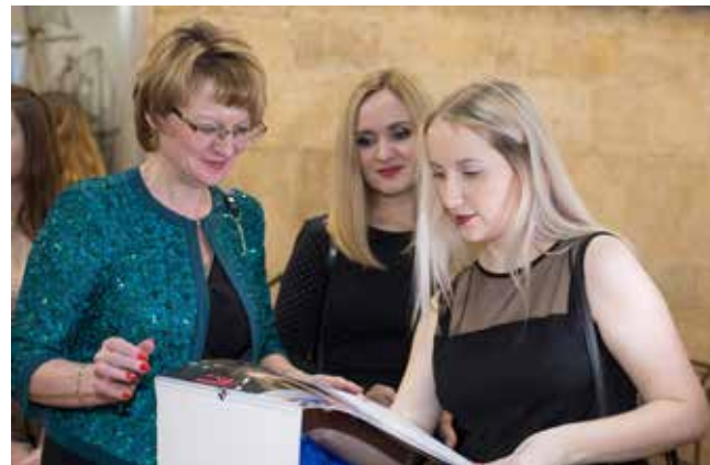
Приятно увидеть себя на страничке календаря

Фото и видео всех участников проекта — на портале vestikamaza.ru