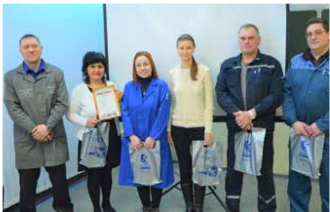
Интеллектуалы «Республики ШИК» оказались на высоте

формула, но вместо знаков и цифр в ней — картинки. Задача игроков была понять, что их роднит по смыслу или каков результат сложения. Например, половина команд догадались, что три картинки: район мегаполиса с небоскрёбами, новогоднюю ёлку и магазинную упаковку мужской рубашки объединяет слово «новый». Таким образом заводским интеллектуалам предстояло разгадать 23 ребуса-вопроса, на поиск ответов отводилось 40 се-