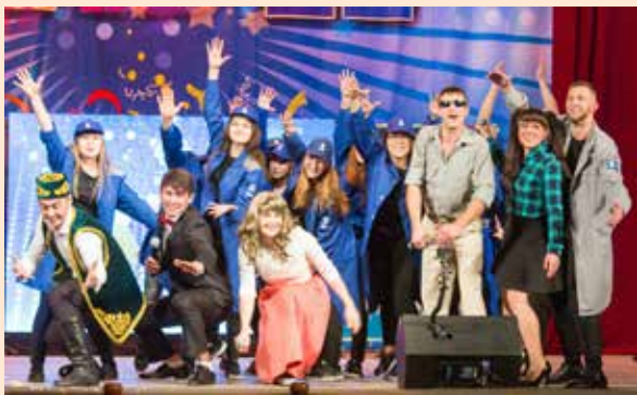
Наши любимцы уже готовят новые шутки

В первый день участники продемонстрируют визитки команд, во второй покажут домашние задания. Тема — 50-летие «КАМАЗа». В играх примет участие и команда председателей профкомов «Семь кадров». Также на сцену выйдут руководители заводов и подразделений. Традиционно команды встретятся в ДК «КАМАЗа».