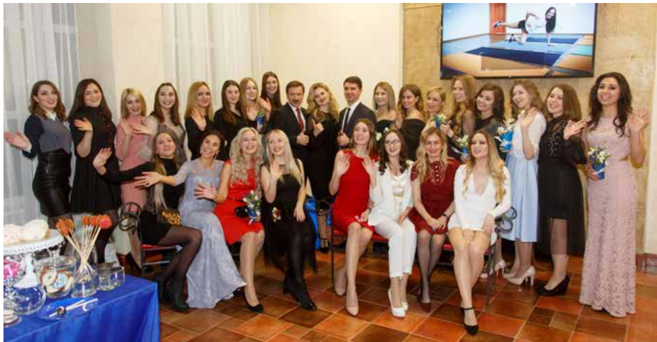
Красивые, милые, загадочные. Среди них медсестра, модель, певица, картингистка, переводчик и будущая мама... Какой потенциал!