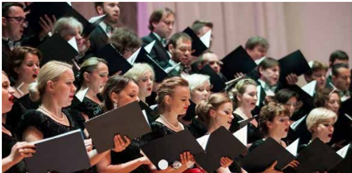
Возможности академического хорового пения просто безграничны