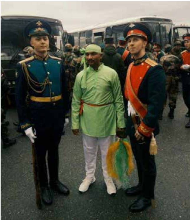
После парада с индийцами

стоять, как влитые, и блестеть, как зеркало. Важно было не ударить в грязь лицом и во время церемонии: одно дело — торжественный марш и дефиле с показательными упражнениями, другое — многочасовой строй роты Почётного караула.