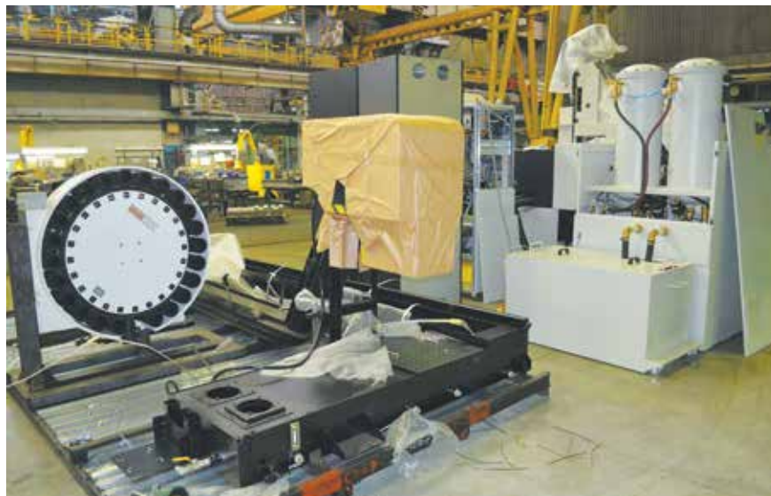
Скоро всё это заработает