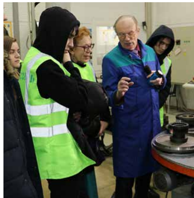
Лучше один раз увидеть на производстве, чем много раз услышать в аудитории

Обучение профессии термиста в Техническом колледже началось по инициативе «движков» в 2013 году. На заводе трудоустроено более 20 молодых термистов из числа выпускников.