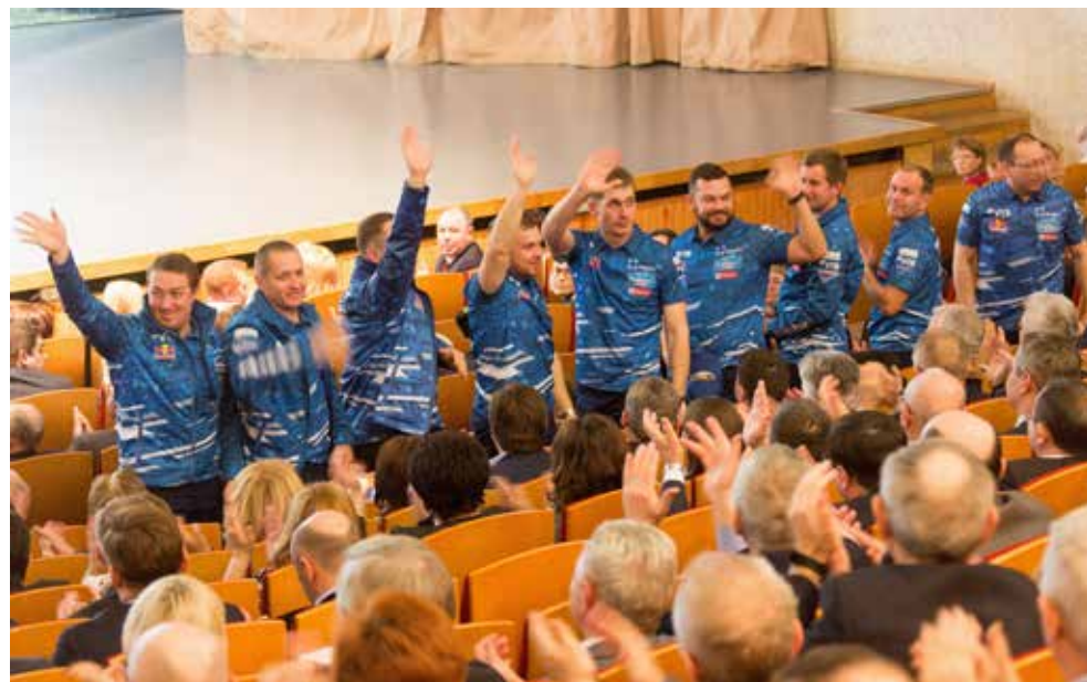
Зрители не скупились на аплодисменты для команды «КАМАЗ-мастер», задавшей победный тон с начала юбилейного года

Камского строительного колледжа им. Батенчука, Набережночелнинского политехнического колледжа и