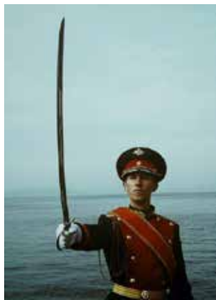
Враг не пройдёт!

Программа «Мать и дитя» проводится при поддержке администрации и профкома. За путёвкой заводчанки могут обратиться в профком по месту работы.