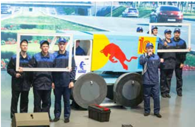
Студенты Набережночелнинского политехнического колледжа, перевоплотившись в слесарей, механиков, сварщиков, собрали на сцене грузовик

номера, рассказывающие о различных заводских специальностях.