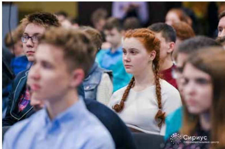
Школьников интересовала конкурентоспособность нашего транспорта