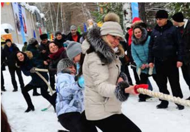
Настроение боевое. Неужели перетянут?

Сразу после официальной части руководителям пришлось уступить место на сцене сказочным героям и артистам. Зиме, восседающей на троне, был зачитан указ о наступлении Весны. Компанию любимым артистам АвЗ составили дети заводчан. В конкурсе «Народные таланты» они