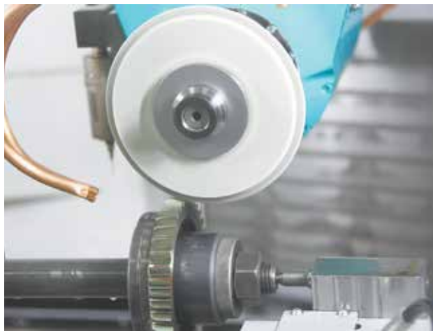
Высокоскоростная обработка — основное преимущество технологии скайвинга

Стоимость камазовского инструмента, аналогичного импортному, существенно ниже при сравнимой работоспособности.