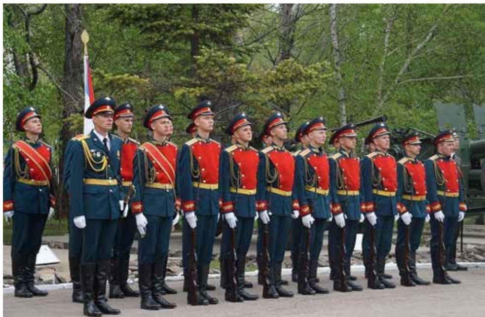
Бойцы как на подбор