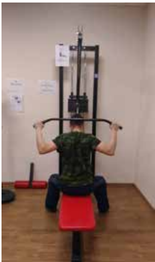
Кинезитерапия — это лечение без лекарств

Специалисты оздоровительного центра рекомендуют чередовать сеансы кинезитерапии с посещением бассейна и кардиозала.