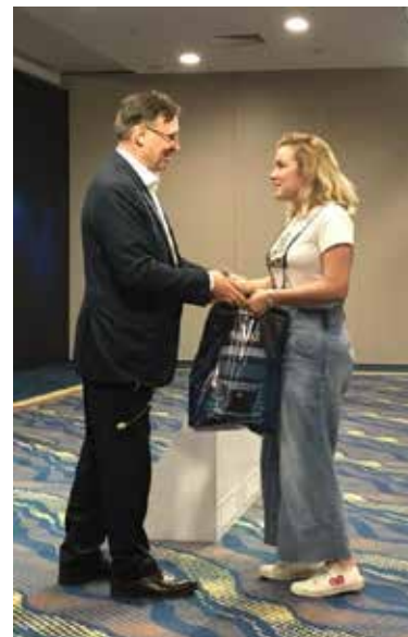
За лучший вопрос — памятный подарок из рук гендиректора «КАМАЗа»

Один из вариантов подсказал на мастер-классе «Программирование