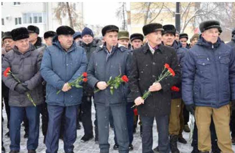
Возложение цветов к Вечному огню — незыблемая традиция

После митинга ветераны боевых действий побывали в историко-краеведческом музее на выставке, посвящённой 30-летию вывода