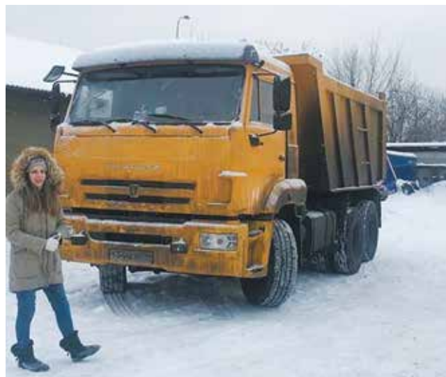
Хрупкая девушка и КАМАЗ, оказывается, совместимы!