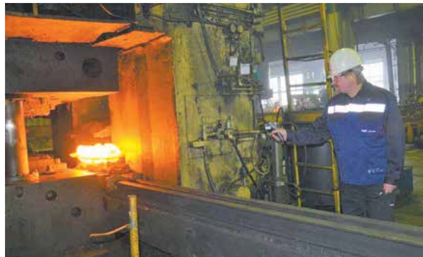
Все участки тщательно проанализированы