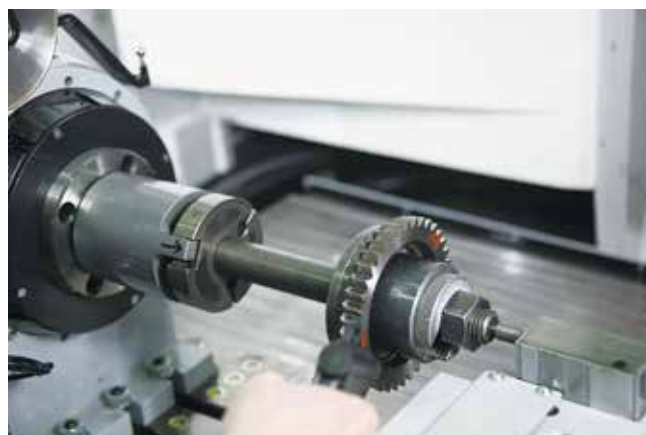
Идёт освоение скайвинг-технологии

числе многошпиндельных гайковёртов), с разработкой и изготовлением шасси для автобусов НЕФАЗ и пожарных автомобилей, вибраторов для литейного завода и многих других технологий. Все они поначалу в нашей