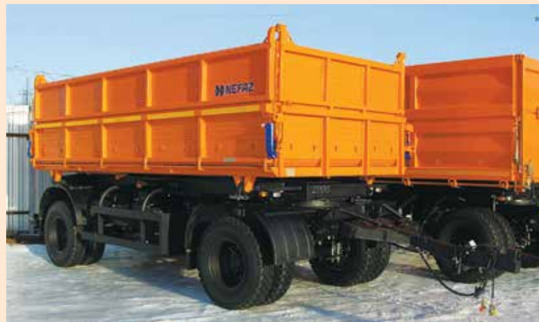
Прицеп НЕФА3-8560-0704082-02 стал актуальным дополнением широкой линейки самосвальных прицепов НЕФА3

Новый прицеп оснащён надёжными осями НЕФА3 с двускатной ошиновкой. Объём платформы с надставными бортами составляет 15 куб. м, боковая разгрузка позволяет производить разгрузку как влево, так и вправо.