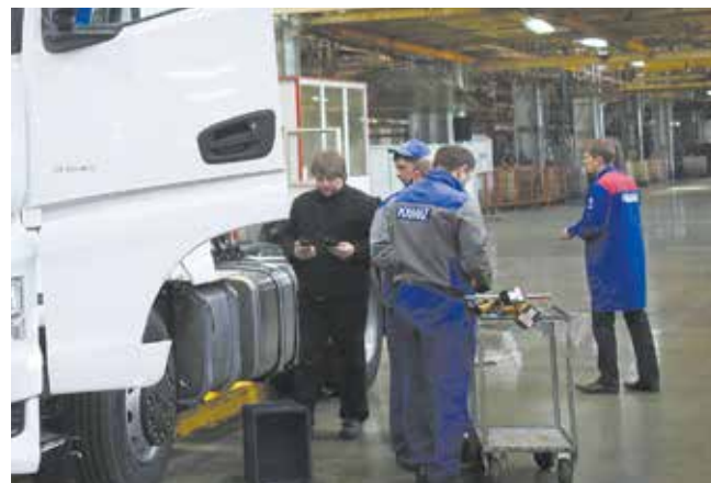
Осталось закрепить пару деталей...

Следующую партию К5 на Ав3 планируют собирать уже на конвейере. В темпе сборочного потока будут решаться задачи пе-