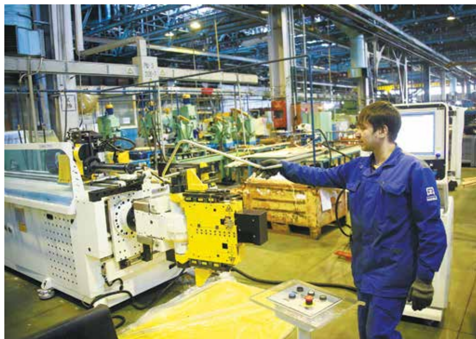
Трубогибочный станок на АвЗ работает с тактом 37 секунд