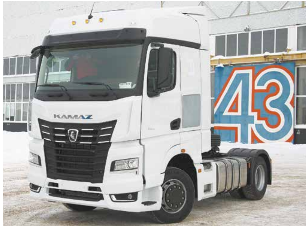
...и спустя 43 года — через ворота № 43. Символично!

Все работники Ав3, принимавшие участие в сборке, старались заглянуть в кабину. Рабочее место водителя 54901 по комфортности не уступает лучшим представителям сегмента легкового автопрома. Жизненное пространство — 9 кв. метров, удобное эргономичное кресло, снижены уровни вибрации и шума. Новый интеллектуальный большегруз оснащён системой мониторинга со-