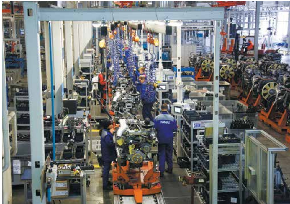
На новой линии с сентября агрегаты проходят стыковку, доукомплектовку, мойку, окраску

В рамках проекта «Тибет» был построен современный склад на 5000 кв. метров. На нём хранятся силовые агрегаты, комплектующие и мелкосерийная продукция. В помещении отремонти-