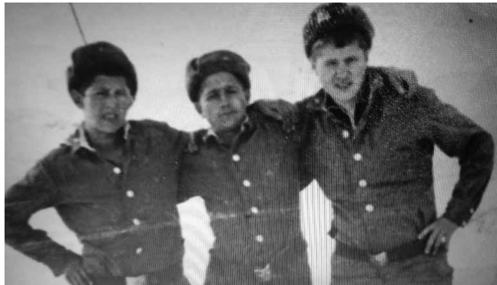
Самые дорогие кадры сделаны в минуты затишья в Афганистане. Сири — первый справа