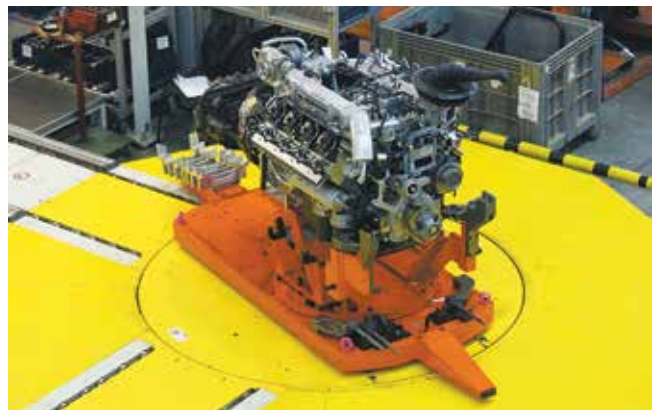
Новый конвейер позволяет стыковать разные типы двигателей и КПП

ным. Ведутся работы по внедрению новых технологий: лазерной сварки деталей КПП и раздаточной коробки вместо устаревшей электронно-лучевой.