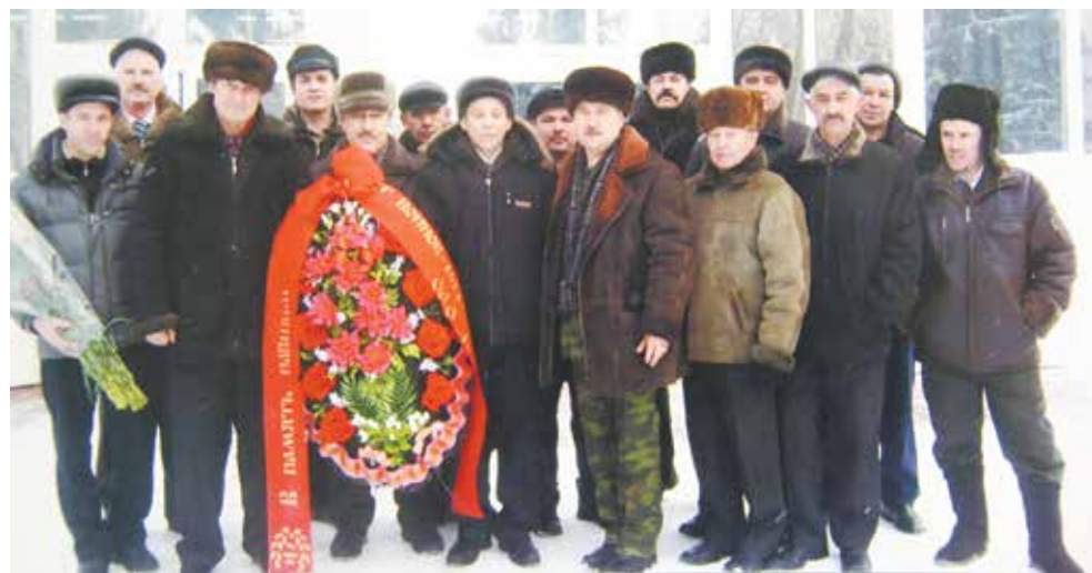
Чтить память погибших товарищей для них — дело чести

устали хоронить наших ребят, искать слова утешения для их матерей. За время боевых действий на земле Афганистана погибли 34 молодых человека. Сражались в составе ограниченного контингента 2000 человек.