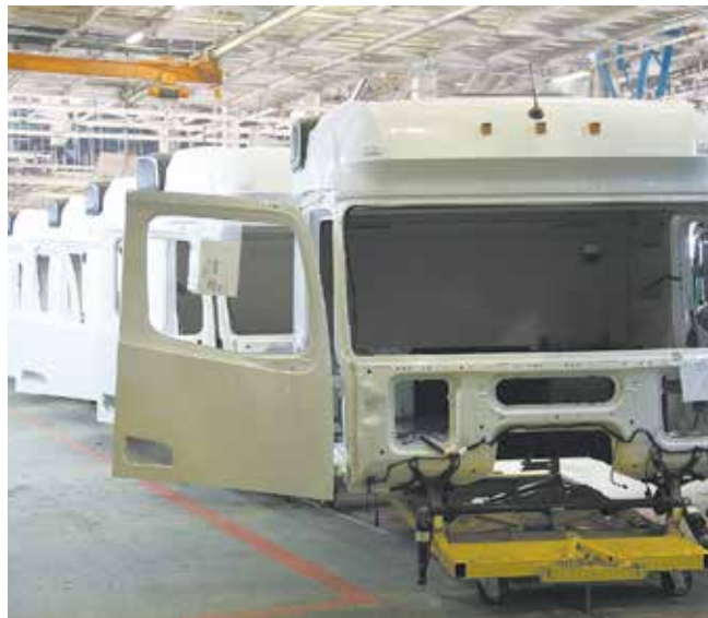
Каркасы кабин для первой серии К5 готовы к сборке в режиме конвейера

— Заказы очень нужны, — откликаются рабочие.