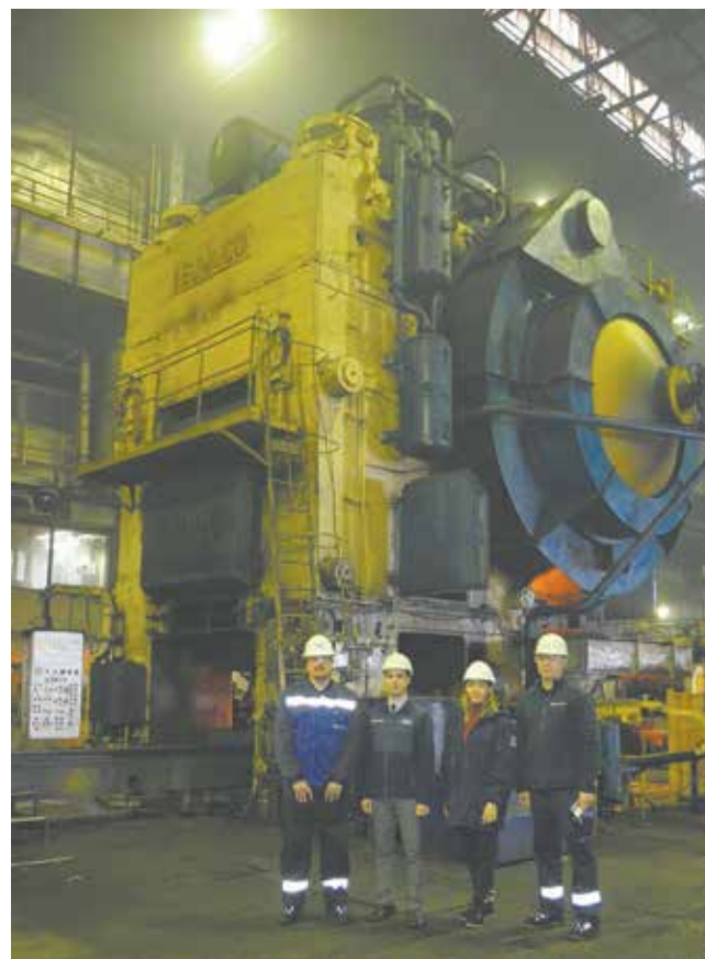
Подобных линий в мире всего пять

— Приятно удивлён российской ментальностью, деловым подходом. Каких только рассказов нет о русских и немцах — и большинство неправда. Очень порадовала находчивость рабочих, мы заметили, что руководство их поддерживает в этом плане. Оценили