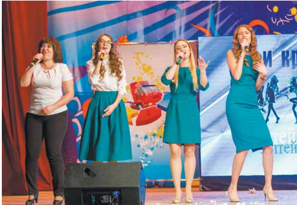
«Мои красавицы» — весёлые, находчивые, прекрасные

Вместе с тем, название накладывает на команду некоторые ограничения. «Часто редакторы игр во время прогона не пропускают часть шуток, говорят: «Вы красавцы, должны быть во всём идеальными. Это не ваш уровень». А мы хотим быть обычными работягами», — добавил он.