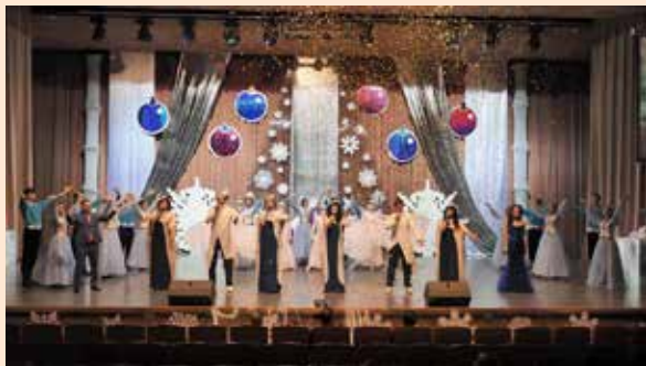
Гимн — это благодарность коллективу ЗЗЧИК за труд

Наш труд и вдохновение — в коробках передач. Мы верное решение найдём для всех задач. Заводу каждый важен, и с гордостью мы скажем: «Одной семьёй мы стали с тобой. Здесь каждый на месте. Мы — сила! Мы вместе!»