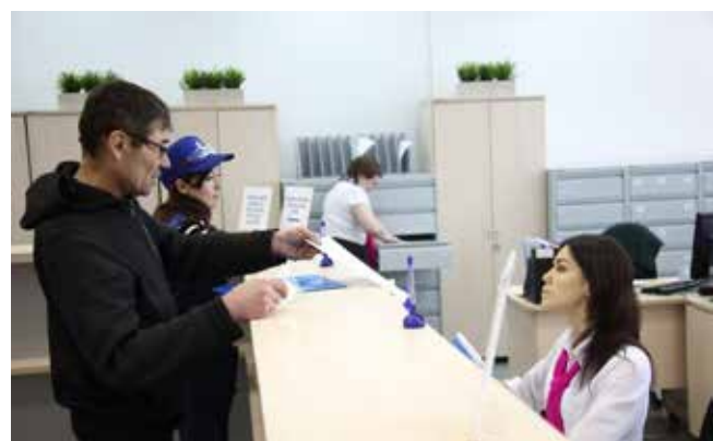
Сотрудники литейного завода приходят во фронт-офис лишь однажды — и уже за готовыми документами

Те, кто ещё не установил мобильное приложение, смогут сделать это, воспользовавшись инструкцией на сайте «КАМАЗа» (см. раздел «Карьера/Мобильное приложение»), или обратившись во фронт-офисы центра кадрового администрирования и оплаты труда ЦОБ.