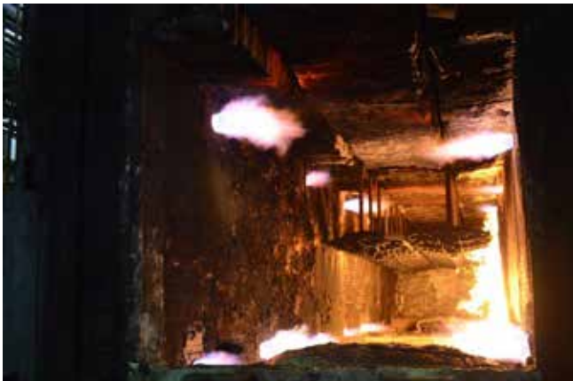
Успешно заменена футеровка в закалочной печи

больших и маленьких ролей, руководство кузнечного завода не привыкло делить поломки на большие или малые: ведь любой час простоя — это потери. Свою миссию ремонтники как раз видят в том, чтобы их было как можно меньше. По крайней мере на ближайший полгода.