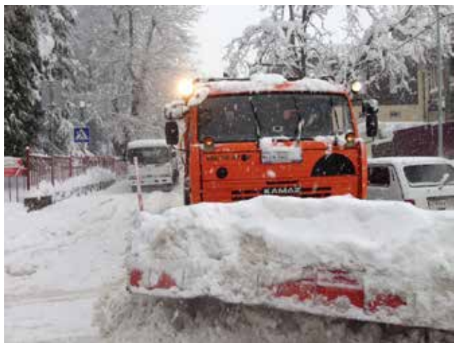
Дружить с такой техникой зимой в России просто необходимо

Калуга», АО «ТоМеЗ» из г. Тосно Ленинградской области и ООО «Завод КДМ» в Смоленске. В недавних телесюжетах, рассказывающих о том, как Москва сражается со снегопадом, зрители могли видеть, что спасают столицу от завалов КАМАЗы, из-за своего дизайна прозванные «божьи коровками». Это как раз машины, уточняют