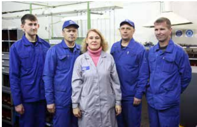
Бригада готова поддержать своего мастера и на производстве, и на сцене