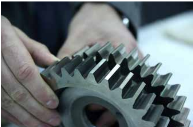
Справа — заготовка, а слева — уже готовый инструмент с заточенными кромками