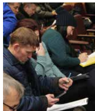
В анкетах мастера указали, что собираются вскоре применить полученные от директора знания

Организаторы уверены — идеи команд второго призыва более качественные, зрелые. За две недели до первого отбора на комитете их нужно отшлифовать. Ведь даже если проект внутренний (а таких большинство), он тоже должен быть полезен бизнесу компании.