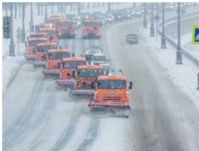
Вот она, колонна скорой техпомощи, идёт на борьбу со снежными барханами