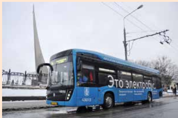
Движемся по «зелёной улице»

По словам руководителя «КАМАЗа», электробус КАМАЗ-6282, созданный по сложнейшему техзаданию «Мосгортранса», стал одним из самых высокотехнологичных продуктов среди мировых образцов автотехники такого рода. Напомним, в 2018 году «КАМАЗ» выиграл аналогичный тендер на поставку 100 электробусов, почти половину из них компания уже передала столице, остальные планируется поставить нынешней весной.