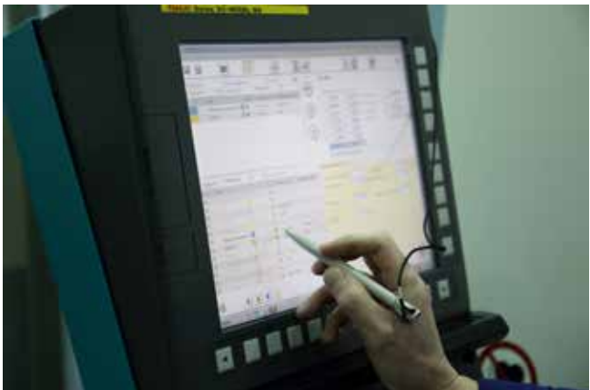
У программного обеспечения новой установки понятный интерфейс