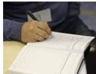
Все идеи и советы, появившиеся в мастерской, пригодятся для подготовки финальной презентации

На мастер-классе, посвящённом навыкам успешной