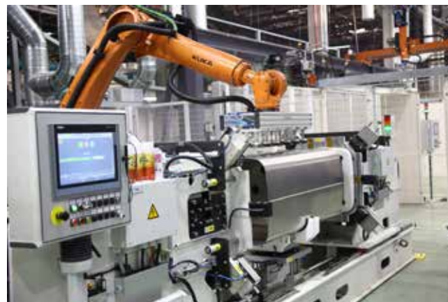
Самую сложную и трудоёмкую часть работы взяли на себя роботы

Роботизированная линия может изготавливать 10 типов алюминиевых баков и три — стальных. Параметры производства каждой модели программируются на роботизированной линии. Уже освоены 300-, 450-, 600- и 800-литровые топливные резервуары. Реализация проекта идёт по графику, и у