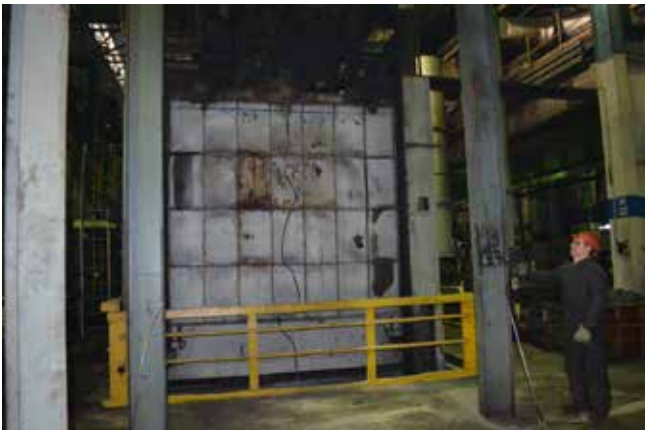
При любом ремонте безопасность — превыше всего

Помимо таких крупных работ, успели в каникулы заменить полы на ряде рабочих мест, а всё, что касается мойки-чистки-покраски оборудования, — из разряда уже стандартных дел. В среднем ежедневно на кузнечном выходили на работу в каникулы до 140 механиков и более 50 энергетиков.