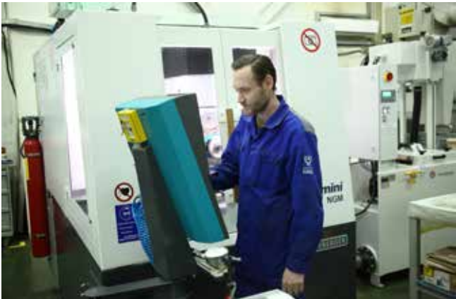
На новое оборудование ризовцы возлагают большие надежды

— Всё дело в сложной конструкции долбяка. У каждого профиля зуба с режущими кромками не менее 10 параметров, которые требуется выдержать с точностью до тысячной доли миллиметра, — по-