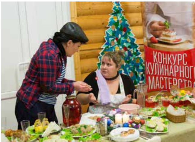
Если жена сказала: «Нужен горошек», значит, муж обязан достать продукт даже в разгар новогодней ночи