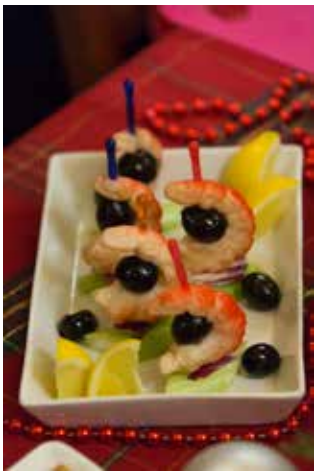
Креветка в умелых руках превращается в парус

Однако самой рачительной оказалась команда столовой ПРЗ — её повара уложились в 1300 рублей. Кто бы мог подумать, что красиво подать можно даже мойву? Просто