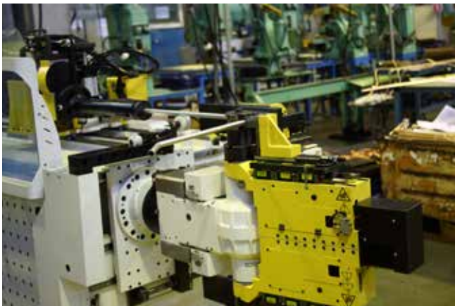
Новая установка гнёт трубки аккуратно и быстро

Сейчас в цехе оригинальных деталей выпускается 1500 наименований разной продукции из латуни, бронзы, металла, и номенклатура продолжает увеличиваться. По расчётам руководителей, новая установка возьмёт на себя пятую часть ассортимента. Самую сложную и ответственную часть продукции.