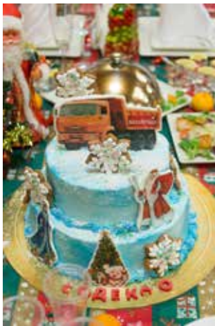
Нежный сметанный торт стал гвоздём кулинарной программы команды гендирекции

Команда «Вечный двигатель» решила сделать ставку на простой и быстрый рецепт. Они накормили судейскую коллегия супом-пюре с сыром, предложив на