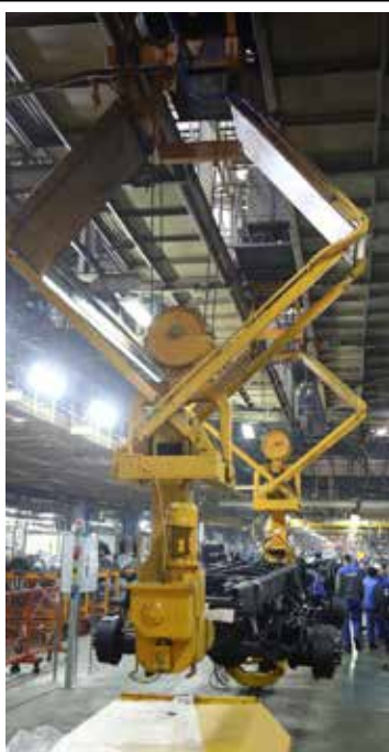
От надёжности кантователя зависит ритм ГСК

Большое внимание энергетики уделили литейному заводу — там было выполнено 13 видов особо важных работ, и АвЗ.