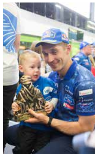
«Вырастешь — такого же получишь, сынок!»