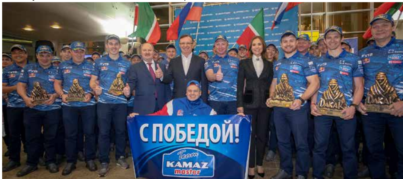
Победа в гонке — радость всеобщая