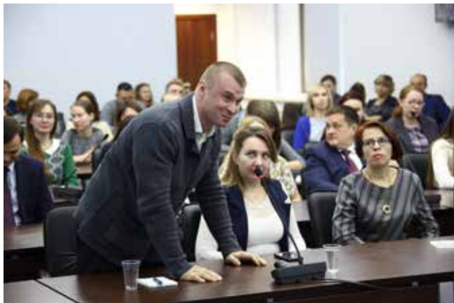
«А я смогу, как вы?..»

ния. Он решил закрепить позиции с помощью изучения языка Паскаль, познакомился с программистами литейного