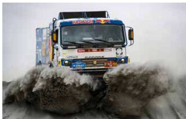
Песчаная ловушка поджидала гонщиков в любой момент