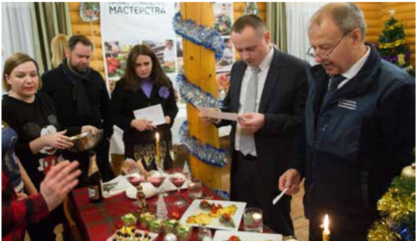
Жюри в раздумье — как оценить такую вкусноту?