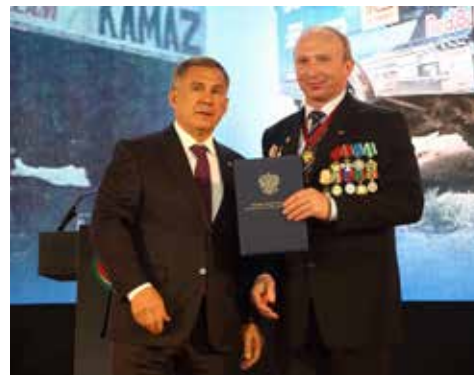
Благодаря успехам команды «КАМАЗ» знают во всём мире», — отметил Президент Татарстана

кое «КАМАЗ-мастер» для нас? Это парни с нашего двора, которые умеют ставить высокие цели и добиваться их. В этом вопросе для меня много личного, я был в юности профессиональным спортсменом, и знаю, что такое подняться на верхнюю ступеньку пьедестала. Это невероятно трудно. И ещё тяжелее удерживать эти достижения. У наших парней есть характер, чтобы делать и лучшие автомобили, и удерживать много лет подряд передовые позиции в спорте. Заводская команда стала сборной России! Мы очень гордимся нашими достижениями и несём флаг страны и Татарстана очень высоко».