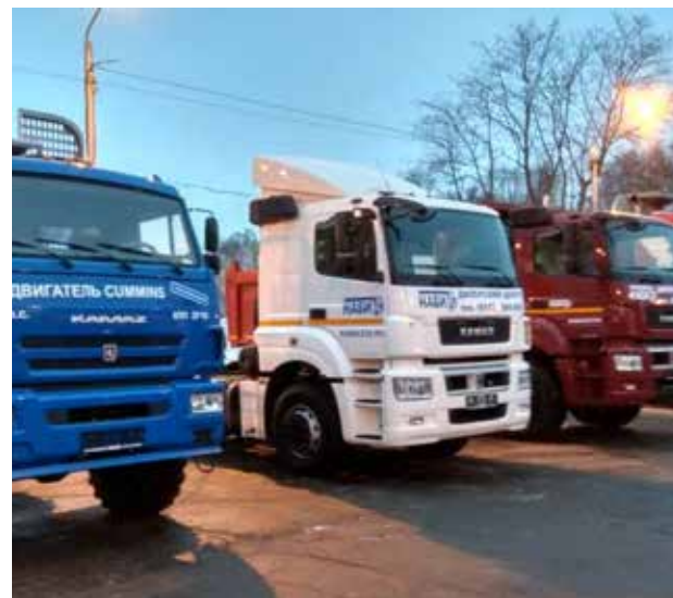
Для лесозаготовителей и лесоперевозчиков камазовская техника — хорошее подспорье

Свою продукцию на выставке демонстрировали более 200 предприятий из 22 регионов России, а также из-за рубежа. За три дня выставочные площадки, семинары и «круглые столы» посетили свыше 4000 человек. Эффективность производственно-коммерческого спектра «Российского леса-2018» отметил, подводя итоги, заместитель губернатора Михаил Глазков.