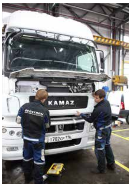
Один из тягачей КАМАЗ-5490 уже получил интеллектуальную начинку

В будущем ИТИС-КАМАЗ получит новые возможности: удалённой диагностики и оценки остаточного ресурса автомобиля. При поломке в дороге система оценит степень неисправности и даст рекомендации водителю: ждать эвакуатор, самостоятельно отправиться на ремонт или сначала закончить маршрут, а потом уже ехать в сервис. При этом ещё и подскажет, в каком из ближайших автоцентров имеется требующая замены деталь. Впрочем, как известно, профилактика лучше лечения, поэтому систему