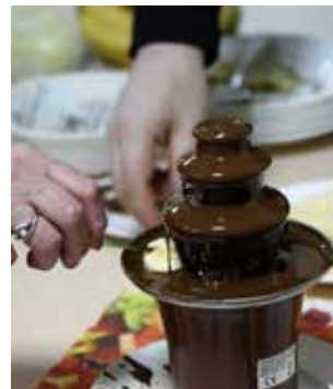
Ты попробуешь на вкус шоколадный поток, а фонд ярмарки увеличивается

Когда верстался номер, в ТФК «КАМАЗ» подсчитали: общая выручка составила 77850 рублей.