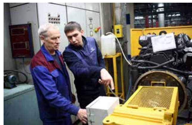
«Вон тот узел заменили!» После доработки стенд холодной обкатки двигателя — как новый

И вот теперь — ровно год отделяет камазовцев от «золотой» полувековой даты. И прожить его, наш 50-й, надо так... Чтобы он запомнился!