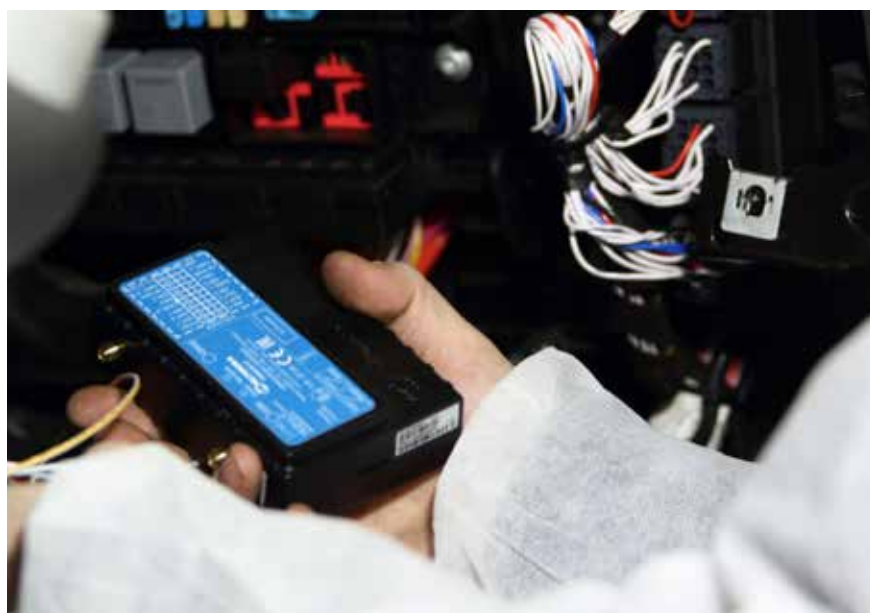
В этой маленькой коробочке спрятан большой функционал

планируется научить прогнозировать момент выхода из строя того или иного узла. В НТЦ рассчитывают, что этот функционал будет доступен через два-три года.