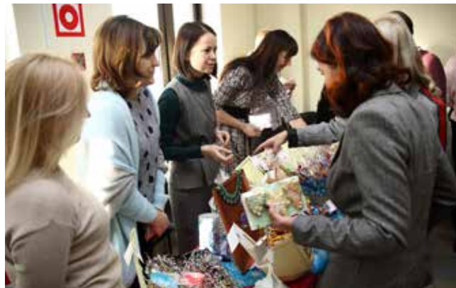
Торговля в разгаре

ура расходуется выпечка, варенье, мёд, травяные чаи... А как пройти мимо, если на столе бьёт натуральный шоколадный фонтан? Женская половина ТФК дивится мастерству коллег-рукодельниц, в считанные минуты «улетают» подставки под горячее, рукавички, мочалки, умиляют вязаные пинетки и тапочки, а на украшения, лёгкие ажурные накидки и свитера и вовсе можно любоваться как на произведения искусства. Новогодняя тематика тоже уже подступает, волнует и действительно отсылает за