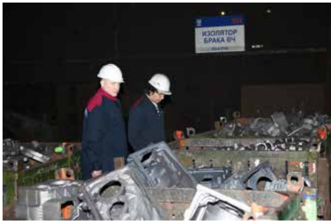
Предотвращению брака — особое внимание

— Подобрались специалисты и руководители, ориентированные на завод, проникнутые общими целями. Все понимают меру ответственности: литейный — основа, с которой на «КАМАЗе» начинается всё, а чугунное производство на нём — самое крупное. Осознавая, что риски ошибок скажутся не только на показателях чугунного производства, но очень существенно отразятся на всём литейном заводе (нигде так легко, как здесь, тонны не конвертируются в рубли!), никто в этом смысле не считает с личным временем. Максимум внимания самым тяжёлым и массовым отливкам. Для нас нет количества, если нет качества, сейчас особенно сконцентрированы на работе по предотвращению брака. Нас можно сравнить с врачами: поставив верный диагноз, важно выписать нужный рецепт, но ещё лучше — создать условия,