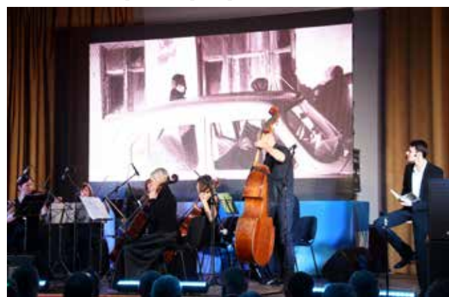
Литературно-музыкальная композиция перенесла зрителей в годы строительства «КАМАЗа»