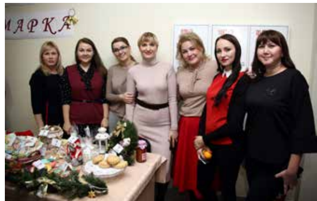
От каждой мастерицы — по творению. И готова ярмарка!