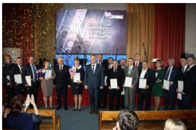
На почётных мастеров и бригадиров в момент награждения пролился золотой дождь