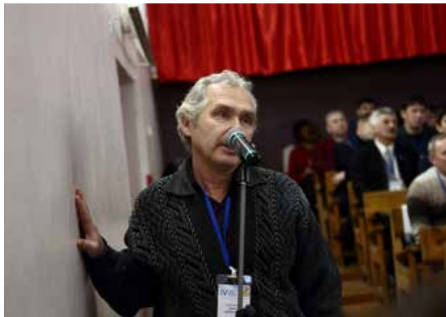
Мастера старались узнать ответы на все волнующие вопросы