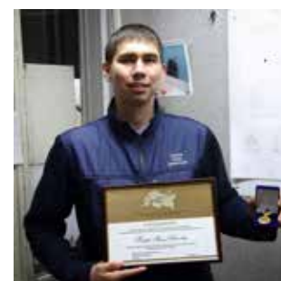
У молодого рационализатора уже несколько заслуженных наград