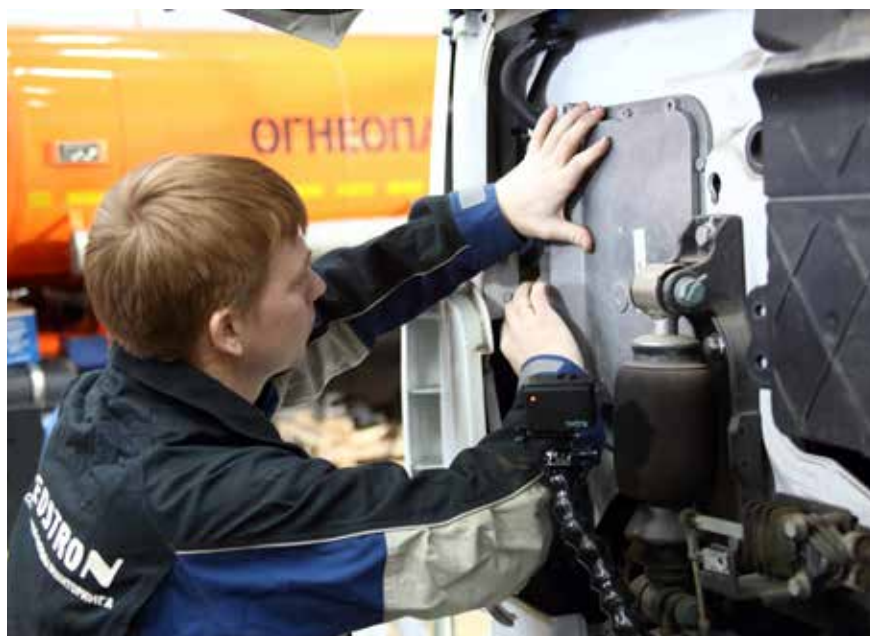
Обучающий фильм по установке ИТИС-КАМАЗ получают все сервисные центры

В начале декабря трекером и ДУТ обзавёлся любимец школьников и студентов, без которого не обходятся «Дни КАМАЗа» в образовательных учреждениях, тягач 5490 Т5. Процедура установки была записана на видео. Обучающие фильмы направят в сервисные центры «КАМАЗа». Дилеры смогут устанавливать систему по желанию клиентов на любые модели.