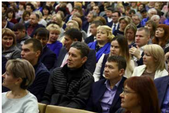
На церемонии подписания нового Колдоговора собрались почти 400 камазовцев

Уточнён порядок оплаты донорских дней по фактическому результату участия. Если по каким-либо причинам