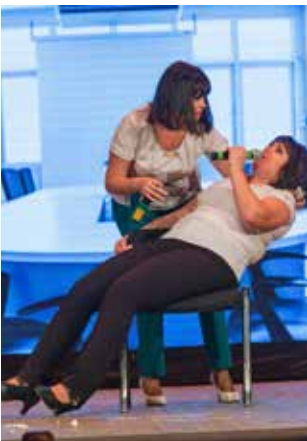
«Мои красавицы» с ЛЗ обыграли войны за климат, разворачивающиеся в офисах после подачи отопления