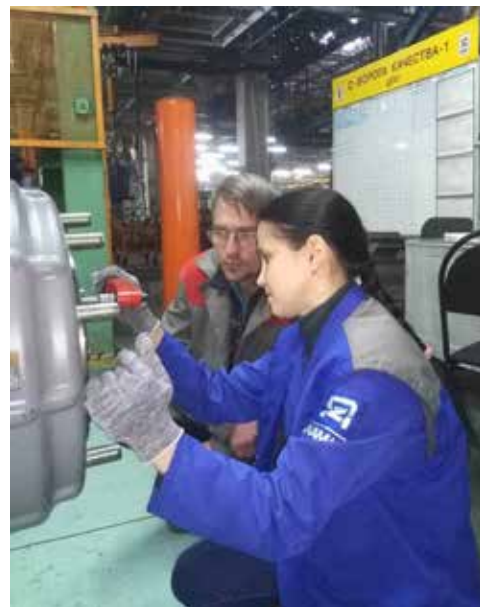
Один из главных этапов обучения — стажировка на производстве

— Фактически мы смогли уйти от дефектов, повторяющихся из года в год. Но