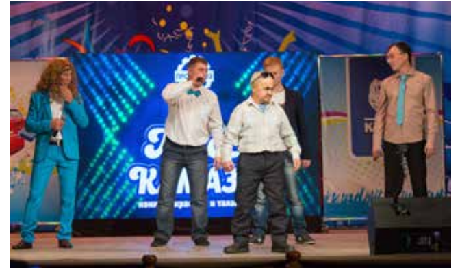
Кого отправить на конкурс красоты, если в коллективе одни мужчины? В команде «ЧВК» выбрали самого обаятельного претендента — живое воплощение шутки о росте дотации на питание

Гран-при фестиваля и кубок достались команде «Далай-рама». Победителями в номинациях стали: «Челныводоканал» — за актуаль-