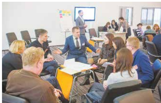
Выработка стратегии корпоративного и правового управления — процесс ответственный

В программе стратегической сессии впервые сделан упор на вовлечение и активную работу участников по выработке стратегии корпоративного и правового управления. Собравшихся объединили в группы по