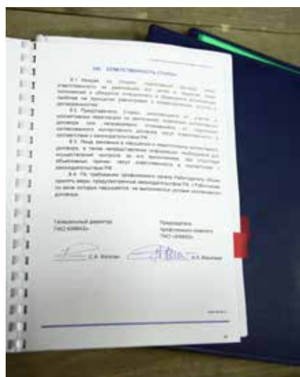
В этом документе прописаны такие привилегии камазовцев как путёвки в санатории и детские лагеря, компенсация на питание, «мамин день» и прочее

Сумма затрат по Коллективному договору год от года возрастает. Если на реализацию социальной политики в 2017 году было направлено порядка 865 млн рублей, то в 2018-м сумма составляет 923 млн рублей. А в бизнес-плане на 2019 год определено финансирование социальной сферы в размере 942 млн рублей.