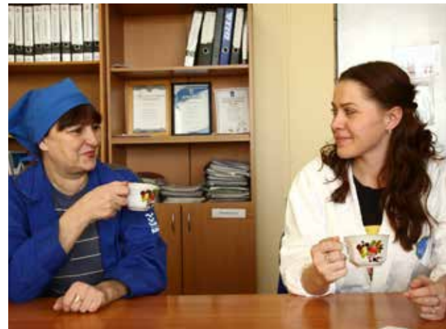
Какие у матерей разговоры? Конечно же, о детях

— Я рада, что мои дети достигли тех целей, что ставили перед собой. Сын вырос настоящим мужчиной, надёжным, сильным, к тому же мастер на все руки. У дочки тоже всё складывается хорошо. Недавно дети мои обзавелись семьями, жду внуков. Говорят, их любят ещё сильнее.