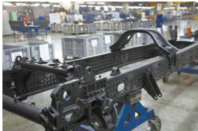
Рама есть — будет и автомобиль

ния всех возникающих в процессе сборки вопросов на площадке будут органи-