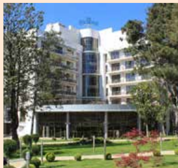
В «Приморье» гостям рады и летом, и зимой

В январе, во время корпоративного отпуска, отдыхать в пансионате по путёвкам можно будет не только 10 дней, но и две недели. Вместе с тем, камазовцам начали предлагать приобрести к путёвке авиабилеты — дни отпуска теперь не «сгорят» в дороге.