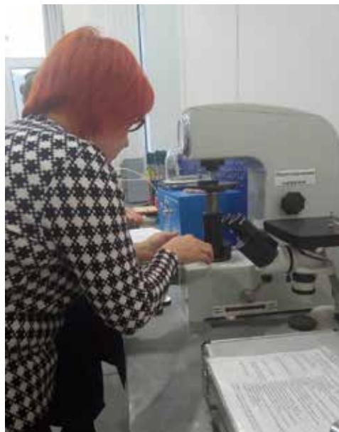
Незаменимый помощник контролёра по качеству — современное оборудование

С декабря первые контролёры по качеству заступают на свои рабочие места.