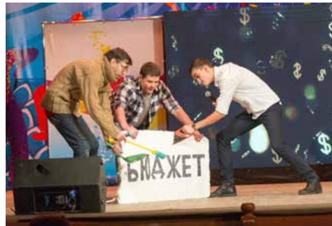
Номер команды ПРЗ «Далай-рама» про распил бюджета встретил живой отклик в зале. «Опять шоу за счёт бюджета!» — возмутился один из участников сценки, когда выбрали едва собранные в совок крошки «на образование»