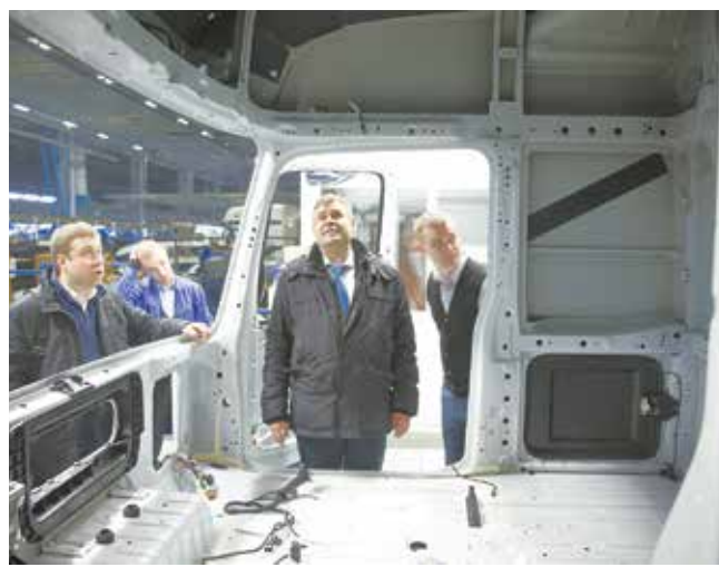
Новая кабина — новые надежды