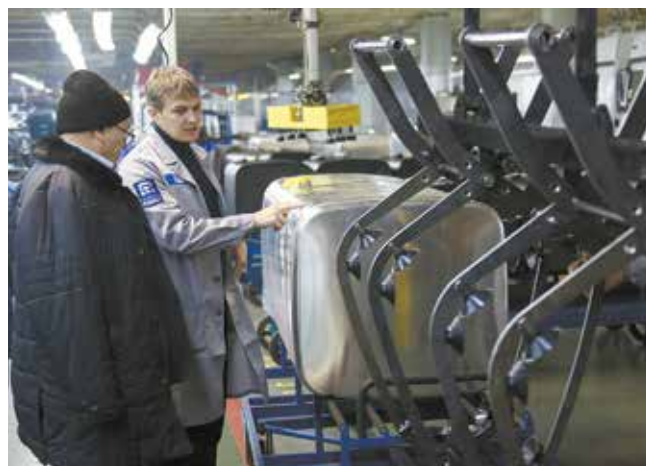
Алюминиевый топливный бак добрался до Ав3 на специальном приспособлении