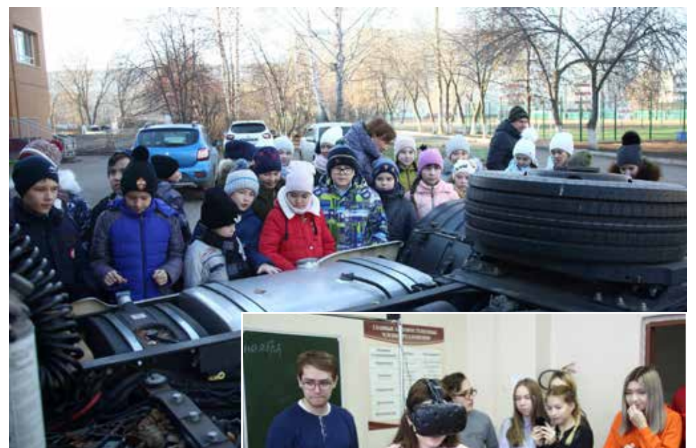
Кто-то восхитился реальным КАМАЗом...

В конце встречи ребята не только увидели, но и потрогали, и сфотографировались на память с популярной моделью грузовика.