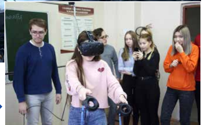
...а кто-то побывал в виртуальной реальности