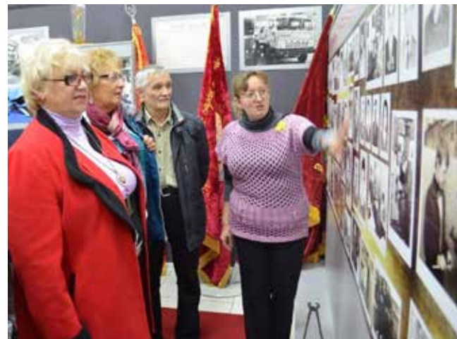
Узнаёте эти лица?