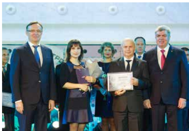
Вручение наград лучшим машиностроителям Татарстана

Среди них — самосвал КАМАЗ-6580. Самой масштабной была автогруппа, подготовленная ТФК «КАМАЗ»: седельные тягачи КАМАЗ-5490 NEO, -65206, -65209, -65806, самосвалы КАМАЗ-6580, -65801, -65802, -6520 люкс, бортовой КАМАЗ-65207 и бортовой автомобиль с КМУ на шасси КАМАЗ-5325, всего 10 единиц. Сотрудники ТФК рассказали о технических параметрах, выгодных условиях покупки техники, предлагаемых «КАМАЗом» программах и услугах.