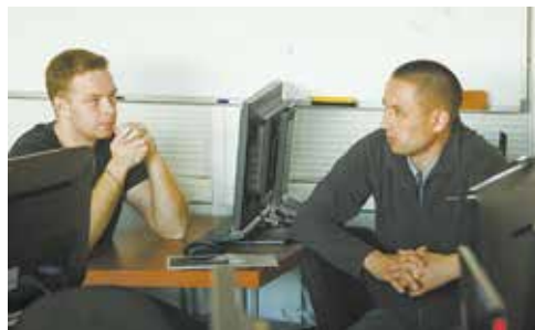
Программа поможет проложить логистический маршрут, а обмен мнениями его скорректирует

Старания бригады по приведению в эталонный вид оценены по чек-листу на 27 баллов из 30-ти — это высокий показатель. В числе прочих улучшений — разработка стандартных операционных карт, улучшение эргономики рабочих мест, внедрение передовых практик (каракури, многостаночное обслуживание, супермаркет), нанесение напольной разметки и др. До конца года статус эталонных планируют защитить ещё три бригады ТГП.