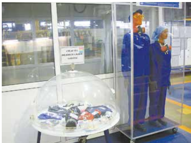
Каждой профессии — свои СИЗ

«Лифтёр». Гальваникам пришлось открывать в себе художественные способности, чтобы рисовать от руки изображение детали на обратной стороне сопроводительного документа.