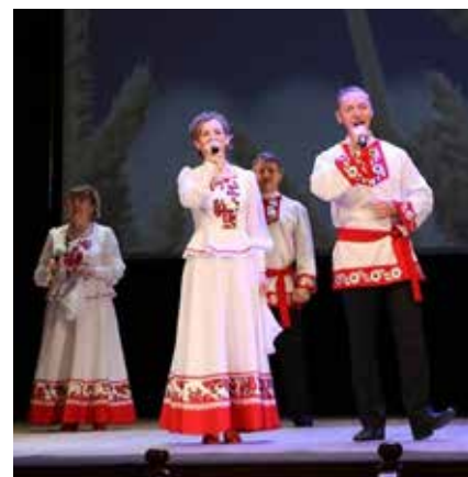
Как не подпеть таким исполнителям?

А в исполнении вокального ансамбля «Рябинушка» прозвучали хорошо знакомые народные песни.