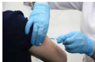
Доза вакцины — и есть шанс, что зиму проживёшь без инфекции

Как сообщает территориальный отдел Управления Роспотребнадзора по РТ, в регионе зафиксирован подъём сезонной заболеваемости острыми респираторными вирусными инфекциями. На долю гриппа и ОРВИ приходится более 85% всех регистрируемых инфекционных заболеваний в нашем городе.