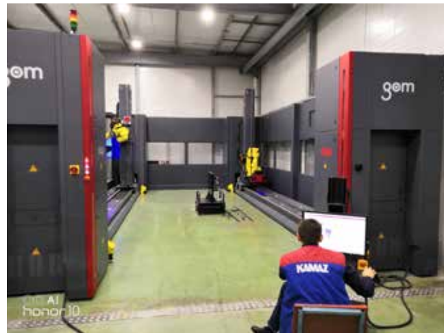
Конструкция деталей усложняется, мерить их универсальным способом невозможно. Новая оптическая измерительная машина, со своей стороны, тоже работает на качество