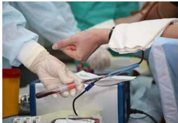
Желание спасти жизнь должно поддерживаться государством

Законопроект находится на рассмотрении Комитета Госсовета РТ по социальной политике, к компетенции