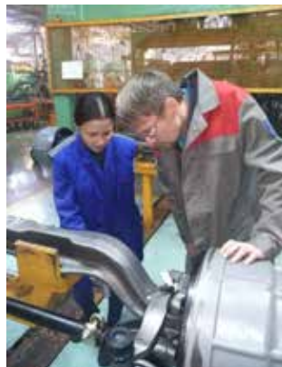
На рабочем месте разговор получается более предметным

Краткий курс материаловедения, метрологии,