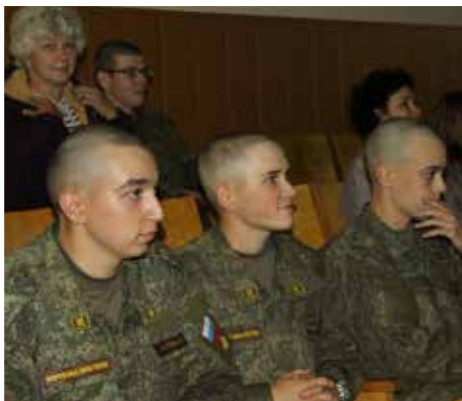
Приезд гостей для солдат — всегда радость