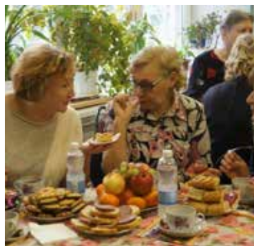
Через год на этом же месте!

На чаепитии для пенсионеров «КАМАЗ-Энерго» родился гимн родному предприятию.