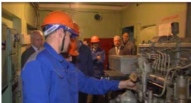
Дизельная электростанция полностью обеспечит электричеством пункт управления в особый период

Высокую оценку защитному сооружению завода двигателей обеспечило подтверждение всех характеристик, заложенных в паспорт объекта в 1979 году при вводе