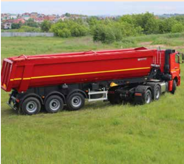
Так выглядит хит продаж

Кроме того, недавно на рынок вышла облегчённая версия самосвального полуприцепа НЕФА3 9509-0360123-30. В отличие от стандартной модели, её платформа имеет уменьшенный объём — 23 кубометра. Применение высокопрочной стали, платформы и рамы оптимизированной конструкции позволило снизить снаряжённую массу полуприцепа всего до семи тонн. Модель особенно актуальна в свете последних мер по ужесточению весового контроля на дорогах и повышению штрафов за перегруз.