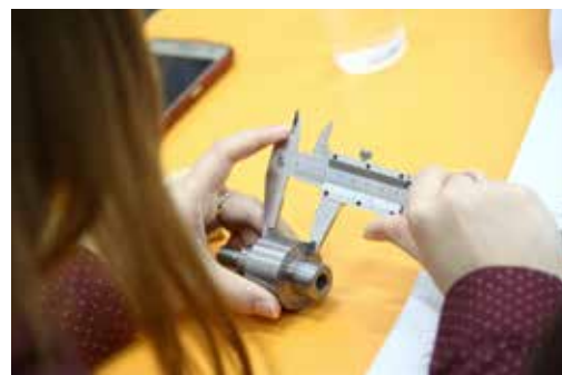
Руки к инструменту должны привыкнуть

та качества, практиканты проводят инспекционный контроль мостов, кабины и автомобиля, ежедневный аудит процесса сборки по ключевым параметрам. На рабочих местах проще определить пробелы в знаниях и взять на заметку внутренние проблемы — будь то сквозняк на посту, большая текучесть кадров, повышенная нагрузка. Отсюда проще проследить и судьбу каждого дефекта, занесённого в чек-лист. Многие стажёры судивлением узнали, насколько важна точность зафиксированной и переданной информации для руководителей разного уровня, конструкторов, технологов. На совещании по качеству (участие в них тоже входит в программу стажировки) почти никто не растерялся, курсанты, исходя из своего опыта, предлагали свои пути решения проблем. Осталось только словарь терминов выучить.