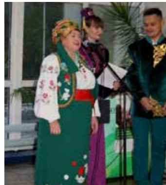
Люди постарше чтят национальные традиции

Приглашая в гости пенсионеров, руководство и профком предлагали им принять участие в Дне национальных культур. Программа получилась загляденье — звучали русские, татарские, украинские, башкирские и чувашские песни. А традиционный частушечный батл зарядил энергией всех заводчан. Перевести дух пенсионеров пригласили на концерт, а потом гостей ждали встречи с коллегами и радостные открытия — завод меняется на глазах.