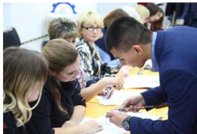
Пробелы в знаниях лучше заполнять вместе с преподавателем

На теоретические занятия отведено 65 часов. Другая часть программы, 45-часовая, отведена под стажировку. Вместе с инструктором, специалистом департамен-