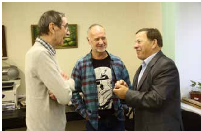
Каждый из них — просто кладёз знаний и историй

После экскурсии бывших логистов пригласили на чаепитие в Совет ветеранов «КАМАЗа». Радуюсь встрече, люди не сдерживали эмоций: пели русские и татарские песни.