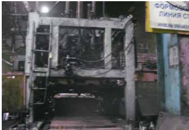
Здесь, на формовочной линии, и произошла трагедия

Самое первое уже сделано — проведён внеплановый инструктаж всех рабочих-ремонтников. Обстоятельства несчастного случая ещё не раз будут разбираться на собраниях и совещаниях. А руководителям надо напомнить рабочим, чтобы те, прежде чем браться за дело, думали о своей безопасности.