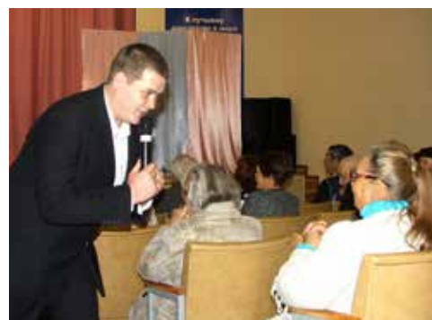
Ну же, подпевайте!

В актовом зале «Прогресс» собрались не только приглашённые пенсионеры, но и дизелисты, которые пришли повидаться со своими наставниками и бывшими коллегами. Артисты творческого коллектива «Гармония души» исполнили песни и танцевальные номера. А за праздничным столом поздравили 52 юбиляров завода, вручили им памятные подарки. Завершился праздник общением за чашкой чая. Бывшие заводчане делились новостями и воспоминаниями о молодых годах. Покидая завод, гости благодарили коллектив за внимание и тёплый приём.