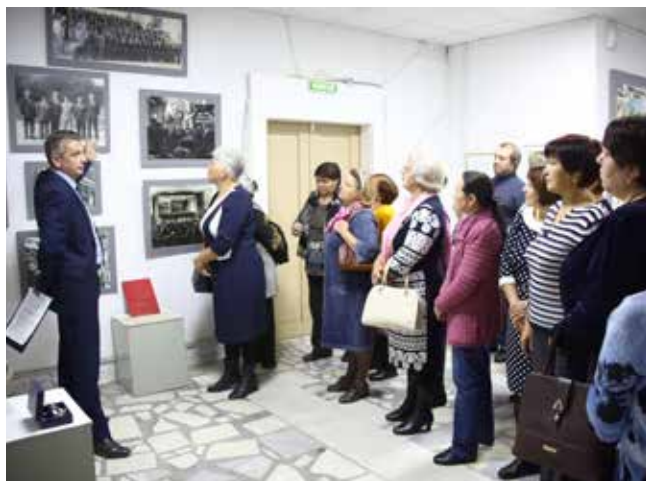
Сколько нового о прошлом можно узнать от директора музея «КАМАЗа»!

Каждый верен себе, неповторим и неподражаем, многие по сей день в строю. Одним по душе пришёлся статус фрилансера, другие охотно занимаются общественной деятельностью. Замыкаться в четырёх стенах — не та натура, к такому «формату» могут обязать только серьёзные обстоятельства. Досадно, что не все бывшие коллеги смогли прийти, сожалеют участники. Благодаря преемников, что не забывают, и прощаются до новых встреч. Совсем скоро — 50-летие «КАМАЗа». Стоит ли говорить, как много значит для них эта дата!