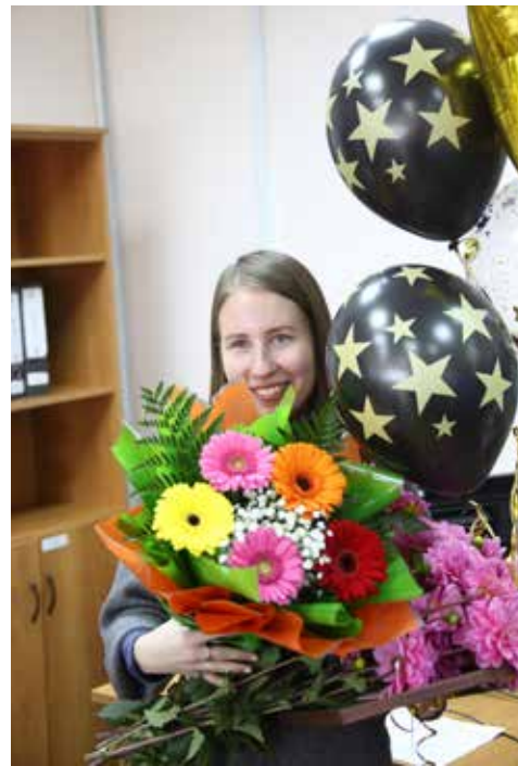
На «Звёздном пути» возможны осадки в виде приятных подарков

Сейчас в «Звёздном пути» 400 игроков. Следующий этап — «Планирование и организация деятельности». Отрыв лидера составляет 30 баллов. Нагнать и обогнать его несложно, для этого нужно активнее принимать участие в очных командных тренингах и конференциях. Ну а молодой