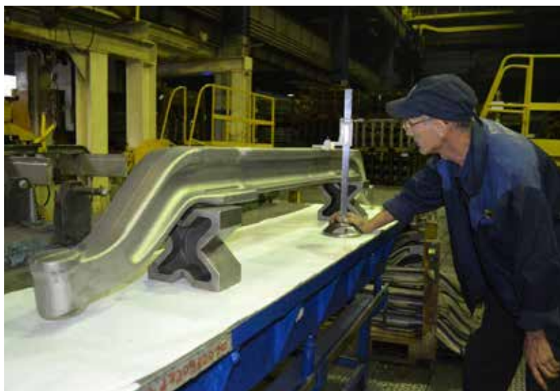
Новая поковка уникальна по своим габаритам и массе

В рамках проекта, включает главный инженер, подготовлен план работ по модернизации транспортных систем и термоагрегатов. Модернизации требуют нагревательная установка и система контроля. Планируется