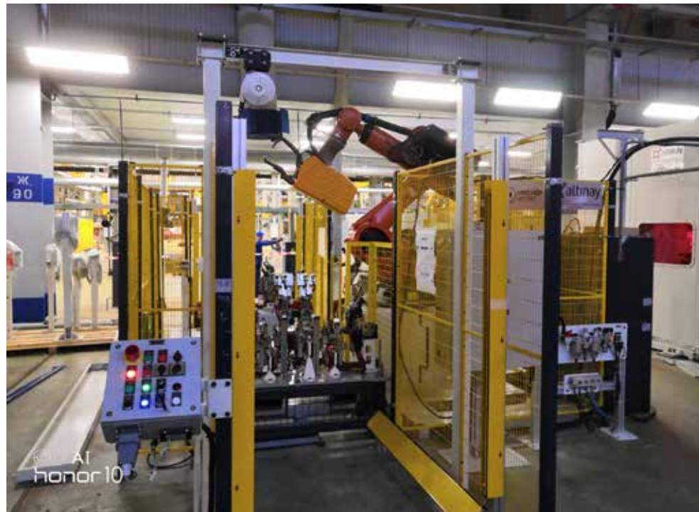
В режиме пуска наладки сейчас обживаются на ПРЗ новые роботы на линии сварки кабин К5

— Новым инструментом в нашем арсенале стала практика решения проблем в формате QRQC — на уровнях начальников цехов, начальников производств, директора завода. Полчаса на качество, а результат осязаемый. С начала года руководителями было открыто 85 досье проблем, на сегодня 48 — в работе, 37 решено. Принцип тот же: решать с привлечением рабочих. Была у нас проблема «малых цветов». Не вопрос — заправить восемь тонн эмали и покрасить каркасы кабин в автоматическом режиме. Но вот заказ