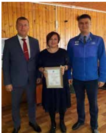
Награда — лучший подарок к празднику

После церемонии чествования линейный персонал решили испытать на сообразительность, наличие чувства юмора и, конечно, проверить уровень физической подготовки. Со всеми заданиями инструментальщики справились на отлично: производственная практика помогла.