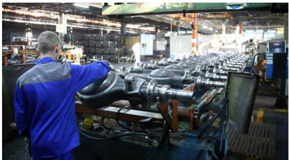
Благодаря молодёжным проектам эффективность производства картеров значительно повысилась