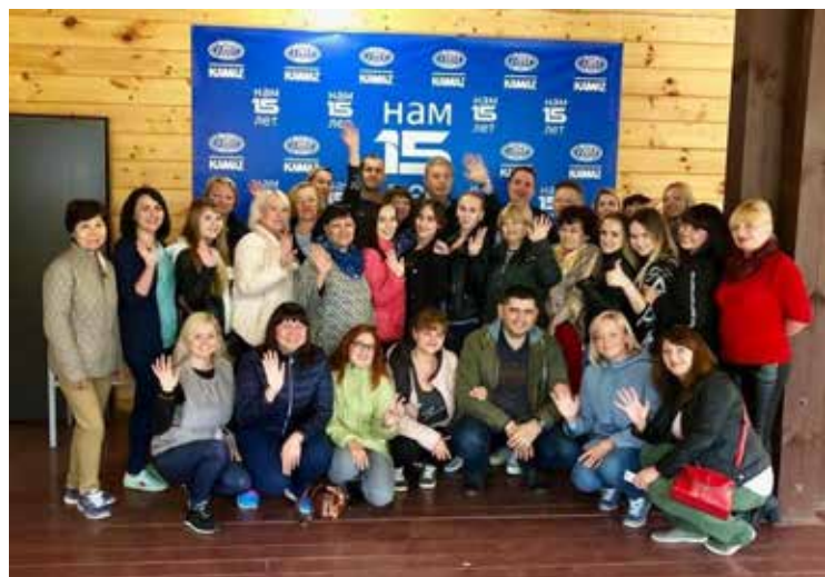
15-летие — важная веха

На протяжении этих лет компания успешно занимается централизованной доставкой грузов на территории РФ, а также стран ближнего зарубежья (Казахстан, Узбекистан, Азербайджан). У 220 сотрудников в планах не останавливаться на этом и выйти на международный рынок перевозок. День рождения компания отпраздновала на базе отдыха «Лесная сказка». Искренние и тёплые слова поздравлений прозвучали от партнёров и коллег.