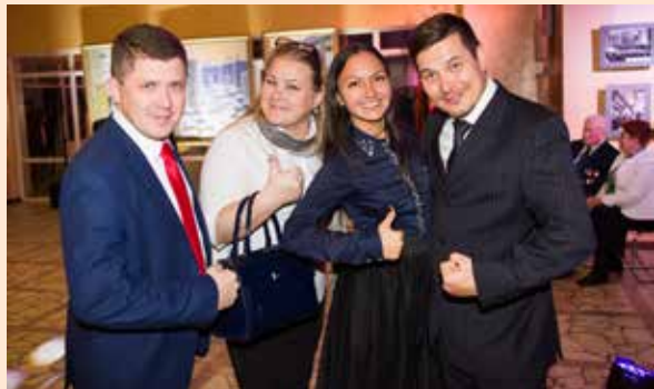
С нетерпением ждём праздника!

Чествование лучших работников продолжится и на предприятиях «КАМАЗа». На АвЗ вместе с лучшими слесарями, наладчиками, технологами будут награждать династии завода. На кузнечном и литейном заводах, заводе двигателей, РИЗе готовятся праздничные концерты, а на ПРЗ — фестиваль национальной культуры.