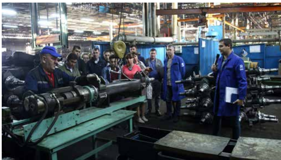
Эту установку успели спроектировать и изготовить за три месяца

Прессоворамщики убедились: за идеями проектов далеко ходить не надо, главное — собрать команду и детально проработать план реализации перед подачей заявки. Следующее практическое занятие на АвЗ решили провести для молодых работников завода двигателей. А потом познакомиться на месте с проектами литейщиков и кузнецов.