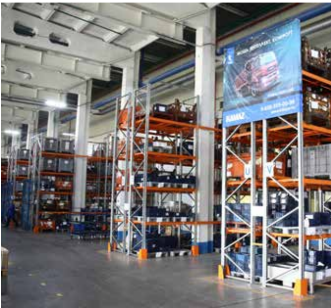
Вся продукция хранится на пятиэтажных стеллажах с буквенно-цифровыми обозначениями

В декабре на складе будет внедрена СУС с использованием штрих-кодов, и условия работы логистов станут ещё комфортнее. Каждому виду поступающей продукции компьютер будет присваивать ячейку, и оператору не придётся тратить время на хождение по складу и поиски — система подскажет, где что находится. «Сейчас