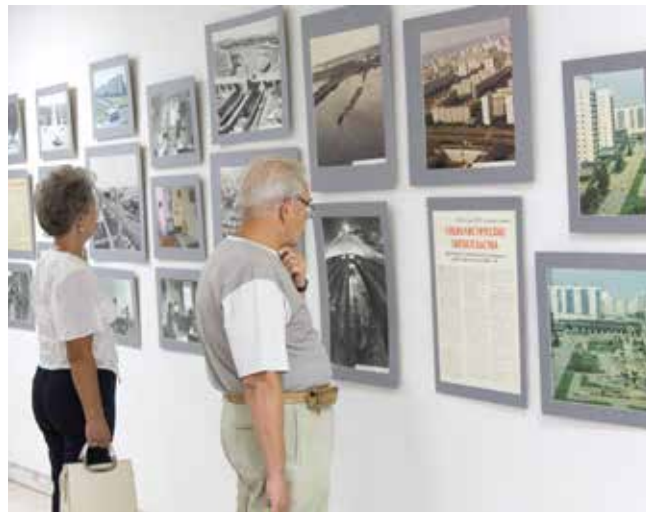
Ветераны помнят, как прокладывали широкие проспекты в чистом поле