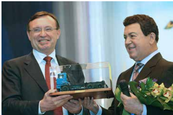
С «КАМАЗом» Иосифа Давыдовича связывала настоящая дружба

Иосиф Кобзон скончался 30 августа на 81-м году жизни после продолжительной болезни. Проститься с ним в Москве в Концертный зал имени Чайковского пришли более шести тысяч человек.