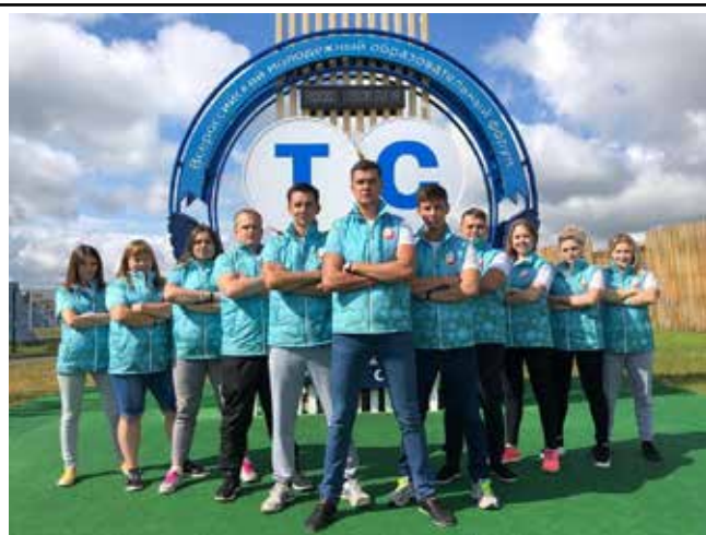
Молодёжной команде по плечу любая задача

Участница форума уверена: своя площадка для обмена опытом должна быть