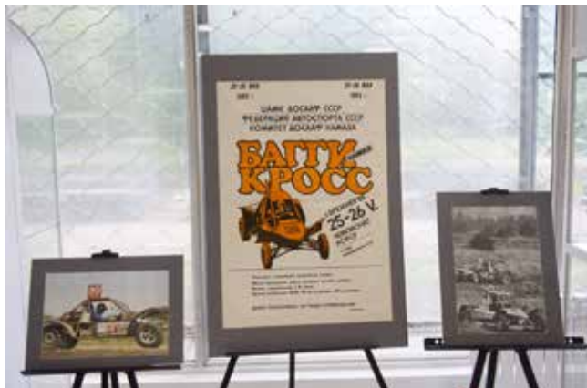
История команды «КАМАЗ-мастер» начиналась с клуба багги