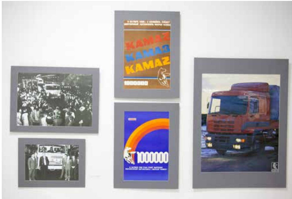
К выпуску миллионного автомобиля «КАМАЗ» успел подготовить новую модель 5425, но...