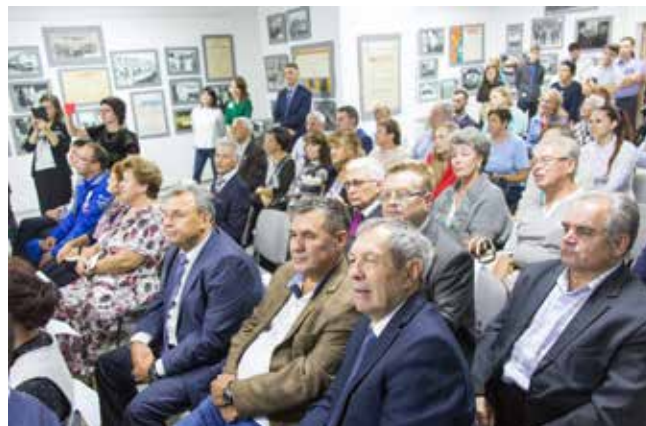
Стихи и песни 80-х тронули ветеранов до глубины души

были годы, задачи — фантастическими, в отпуск по пять лет не ходили, а в душе светлая радость: «КАМАЗ»-то выстоял!