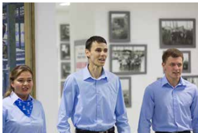
На открытии выставки молодые камазовцы презентовали свой подарок — музыкально-поэтическую композицию