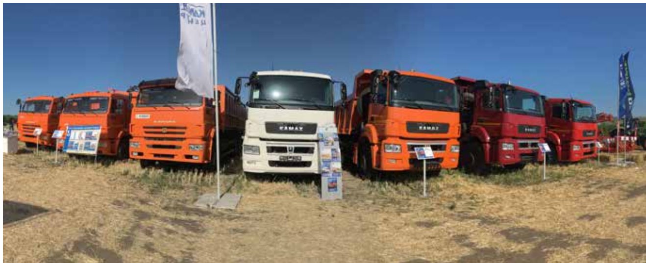
Техника, представленная на Сельхозфоруме «Саратов-Агро. День поля»

Лето завершилось, но осень не случайно называют урожайной порой: не менее напряжённым для ТФК станет сентябрь.