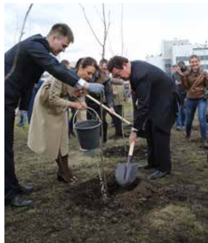
На памятной рябиновой аллее растёт деревце, посаженное Иосифом Кобзоном

Ещё в период строительства автогиганта на Каме, в 1969 году, Кобзон приезжал на «КАМАЗ» поддержать первопроходцев. Патриотичный репертуар и неповторимая манера исполнения помогли укрепить дух и настрой строителей.