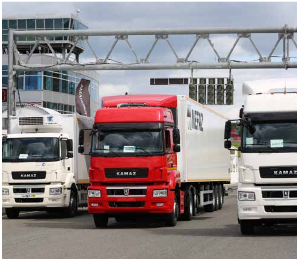
Динамический показ: испытать камазовские новинки могут все желающие

Выступали наши автомобили не только в других городах. В рамках камазовского форума «PROFдвижение» молодёжи показали седельный тягач КАМАЗ-65206 с комфортабельной кабиной для магистральных и пригородных перевозок, самосвал 6580 для перевозки сыпучих грузов и стройматериалов и, конечно, КАМАЗ-5490 NEO. На автокарнавал, на фестиваль грузовых автомобилей «УРАМ-FEST» в рамках Дня республики и Дня города 30 августа главное пред-