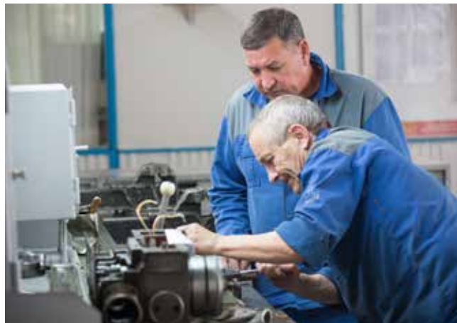
Ремонтники работают аккуратно и быстро

Следующий шаг — модернизация стенда обдува, на котором детали прочищаются и сушатся после мойки. Шкаф для этой операции увеличили в объёме, чтобы можно было обрабатывать более габаритные детали, установили на него защитный экран. На щитке наклейка-напоминание о необходимости надеть маску перед работой, средства защиты тут же под рукой.