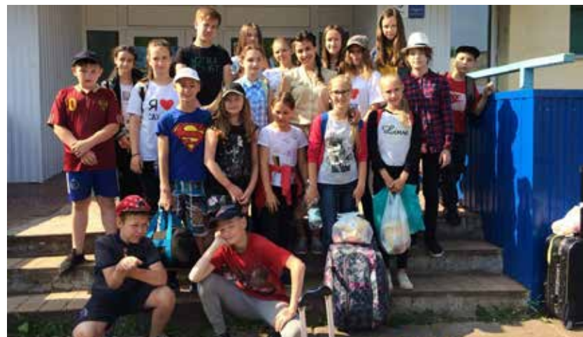
До встречи следующим летом!