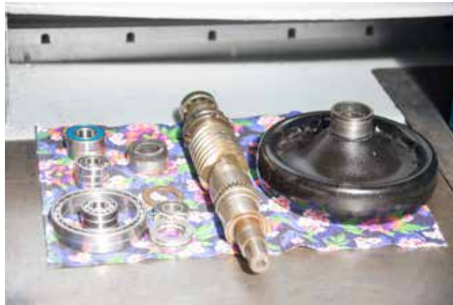
Причины неполадок и повреждений на салфетке отлично видно

Опыт коллеги взяли на вооружение другие ремонт-