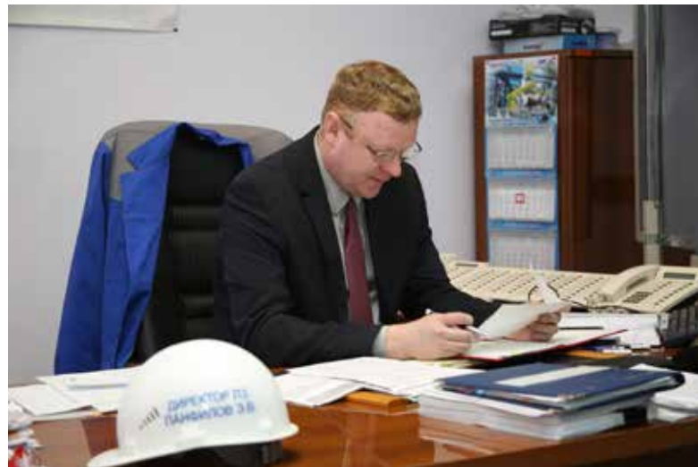
Каска и халат при директоре всегда — и в кабинете, и в машине