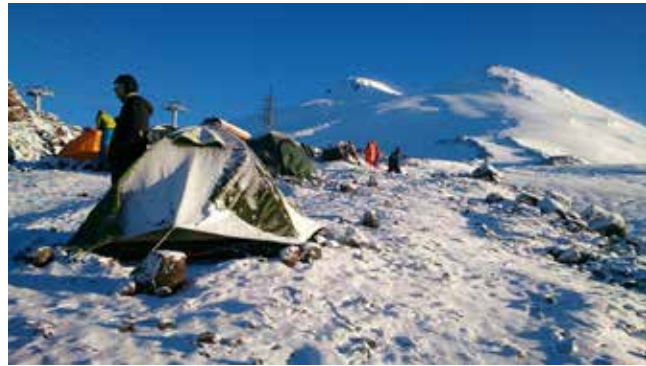
Это только на первый взгляд вершина близко, но поподробней-ка дойди!

давление, нехватка кислорода могут вызвать головные боли. А выше 4000 дуют сильные ветра, ночью температура воздуха опускается ниже нуля, спать в палатке становится холодно», — рассказал он. На вопрос, почему люди терпят такие лишения во время отпуска, Сергей ответил, что всё искупает возможность подняться над суетой, отдохнуть от будней, насладиться потрясающими видами.