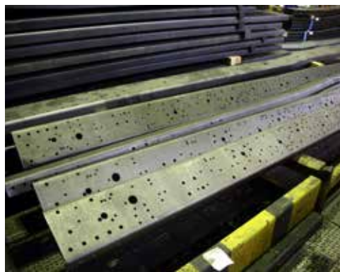
Это лонжероны, из которых собирается рама сейчас

подготовку поверхности изделия, катафорезное грунтование, электростатическое напыление порошка и финальную операцию — контроль качества и исправления дефектов. Главные преимущества порошковой окраски — прочность, экономичность и экологичность покрытия. Порошковые краски поставляются в готовом