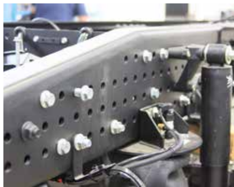
А вот так силовая конструкция для рамы будет выглядеть через полтора года

Новая технология обеспечивает образование ударо-