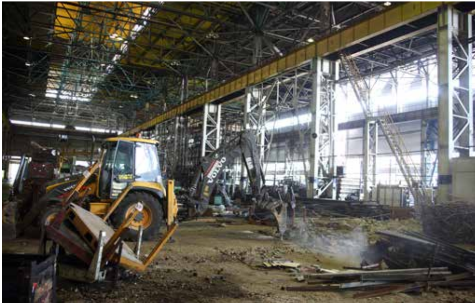
Строительная техника в цехах ПРЗ расчищает площадку для нового оборудования

Новая технология включает в себя обезжиривание (мойку), дробемётную обра-