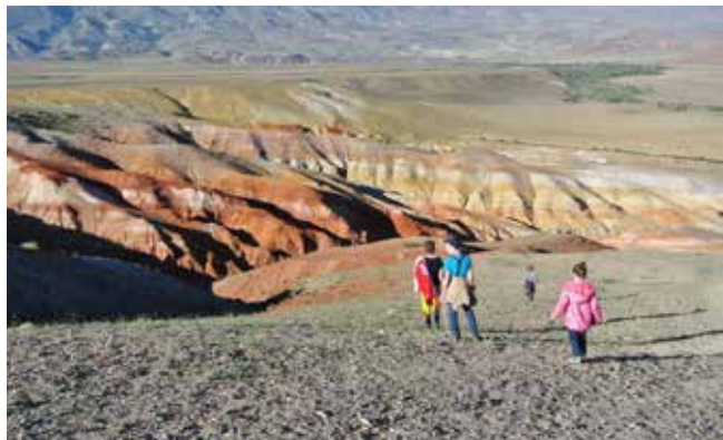
Почувствуй себя марсианином