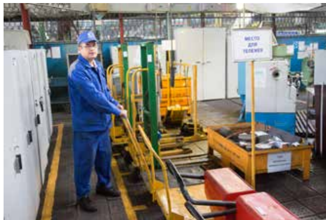
За тележкой далеко ходить не надо, транспорт ждёт на специальной площадке

ники. Когда навели порядок на своих рабочих местах, начали думать, как оптимально использовать территорию участка. Решили сделать площадку для хранения средств малой механизации, тут же установили стеллаж для хранения винтовых пар оборудования.