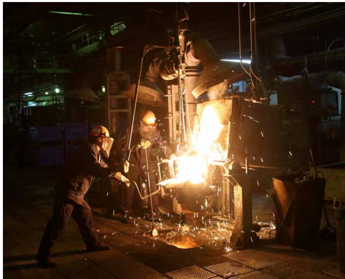
Литейка, как она есть: суровая и красивая

— Если в двух словах — наводили порядок на всех фронтах, разгребали накопившиеся за много лет завалы. В первую очередь — говорили с людьми. С каждым увольнявшимся — лично. С тех пор у меня приёмы по личным вопросам дважды в неделю стали традицией. Чугунное производство включает в себя более 200 ленточных конвейеров, различных сложных систем, элеваторов. За две недели сделали ревизию каждого литейного конвейера поиндексно, за месяц процентов на 90% привели всю систему в нормальное, работоспособное состояние. Но переломным был момент, когда почувствовал, что люди переступают порог недоверия. Это произошло, наверно, через год: увидели, что нерешаемые задачи начинают решаться. Директорский кабинет в этом смысле всегда открыт.