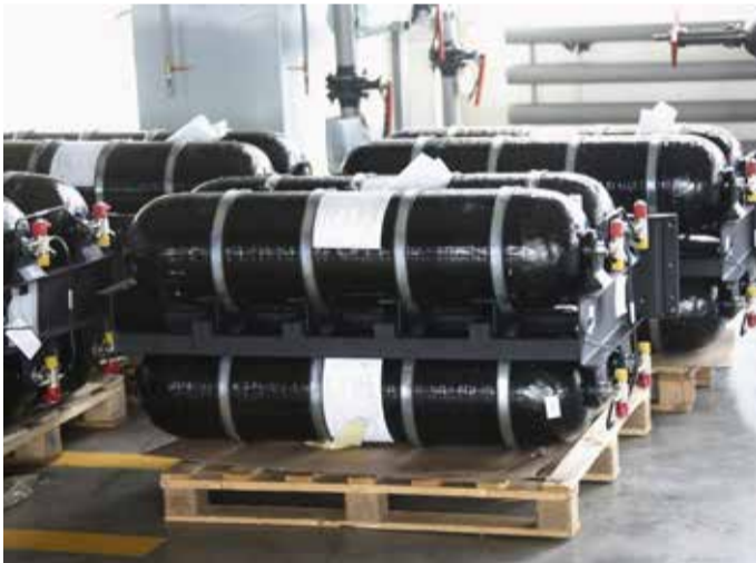
Поддоны с баллонами располагаются компактно