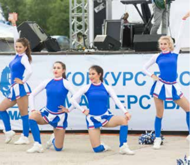
Зажигали не только водители, но и казанская танцевальная группа «Бархат»