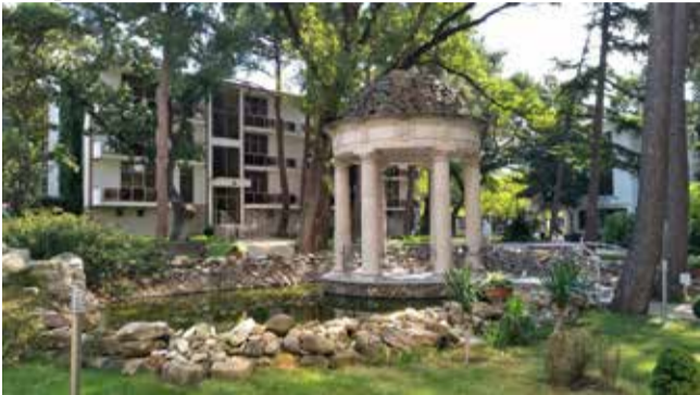
Каждый уголок на территории пансионата уютен

тят 167 тыс. рублей. Тот, кто готов выложить такую сумму, наверняка и добираться к морю захочет с комфортом. За авиабилеты с багажом на двоих из Бегишево в Геленджик