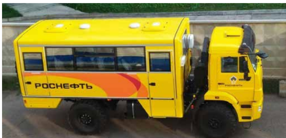
Техника для корпорантов-нефтяников узнаваема издали: по заказу Роснефти, все КАМАЗы окрашиваются для них в фирменный жёлтый цвет

Пусконаладочные работы продолжатся на предприятии до ноября. Осенью на площадке будет запущено производство в тестовом режиме, а в апреле 2019-го — уже в серийном.