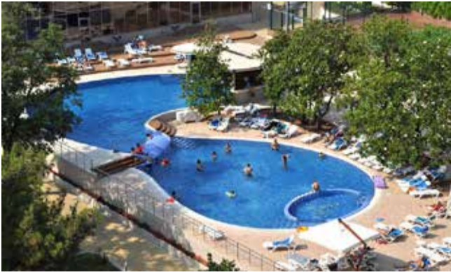
Открытый бассейн с морской водой — просто спасение в жаркие дни

Для сравнения мы подсчитали, во сколько обойдётся отдых в «Приморье» без камазовских и профсоюзных льгот. Так, десятидневное пребывание в двухместном стандартном номере люкса с трёхразовым питанием и лечением для одного гостя стоит, согласно прейскуранту на сайте пансионата, 135 тыс. рублей. Двое туристов запла-