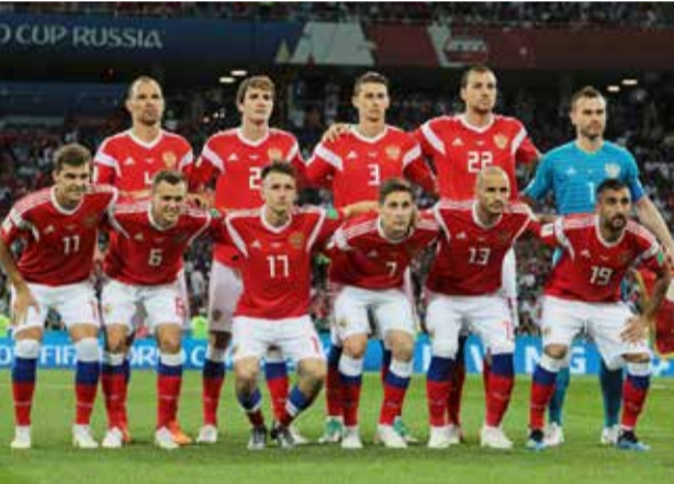
Наша сборная доказала — в России футбол есть

Мы прощаемся с командой России на чемпионате мира, но ненадолго. Уже через два года состоится чемпионат Европы, а в 2022-м — чемпионат мира в Катаре. Понятно одно — российская команда вышла на новый качественный уровень. Желаем, чтобы она устремилась ещё выше.