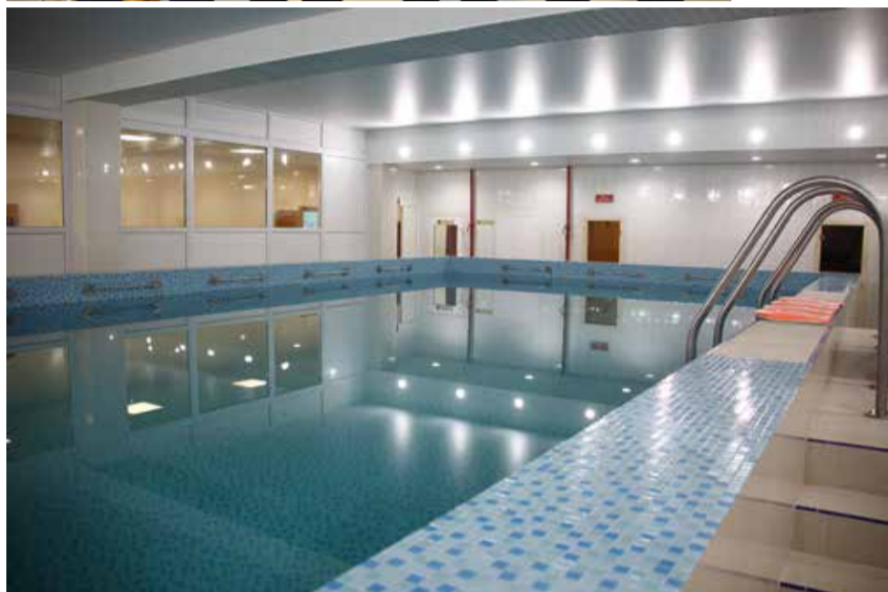
Длина бассейна 11 метров, ширина — 7, глубина — от 1,65 до 2,2 метра. В отдельной комнате установлена современная компьютеризированная система очистки воды

Уже на следующий день оздоровительный комплекс принял первых посетителей.