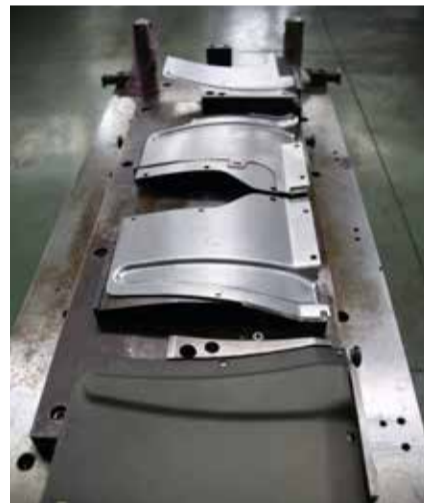
Теперь две операции можно делать на одном прессе

Сейчас комплектующие изделия для мостов автомобилей тяжёлого ряда изготавливаются по новой технологии. Изменение обернулось звонкой монетой — за год экономический эффект составил 663 тыс. рублей.