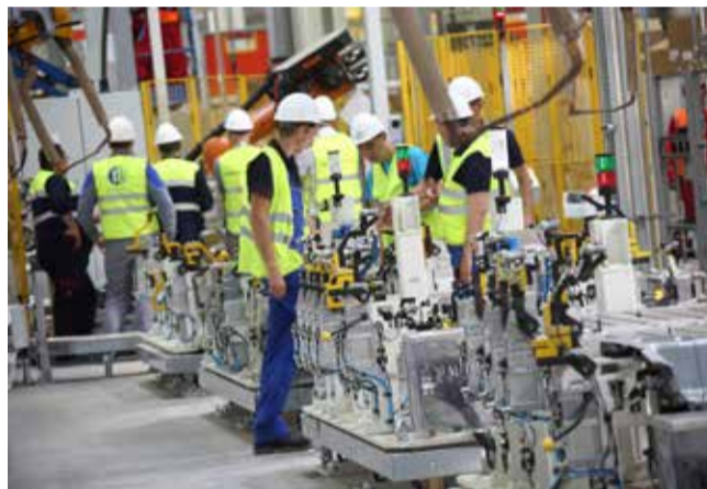
Наладка оборудования — первый шаг к запуску

ны четыре робота, которые опять же в автоматическом режиме будут изменять геометрию каждого каркаса. Проверка одного экземпляра займёт четыре минуты.