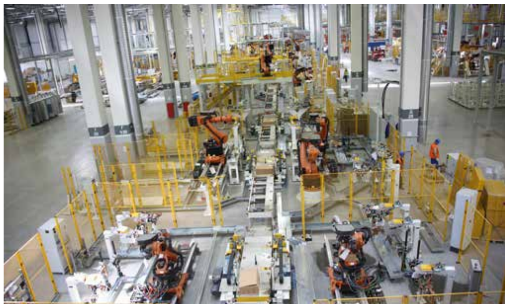
Главная «артерия» цеха — конвейер сборки каркасов кабин