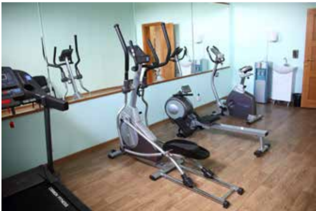
В кардиозале представлены все популярные виды тренажёров: беговая дорожка, эллипс, гребной и велотренажёр

Примеру литейного могут последовать и другие заводы, которые тоже начнут открывать для своих работников оздоровительные комплексы, считают руководители. Цена вопроса — около 5 млн рублей. Во столько обошлись отделка помещения и закупка инвентаря.