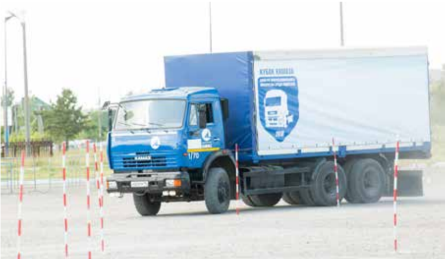
Проехать трассу быстро и заработать штрафные секунды или аккуратно, не задев столбики, но потратив больше времени — нелёгкая дилемма. Зрителям же хотелось зрелища, и поэтому они постоянно гнали вперёд участников громким скандированием: «Газу, га-а-азу давай!»