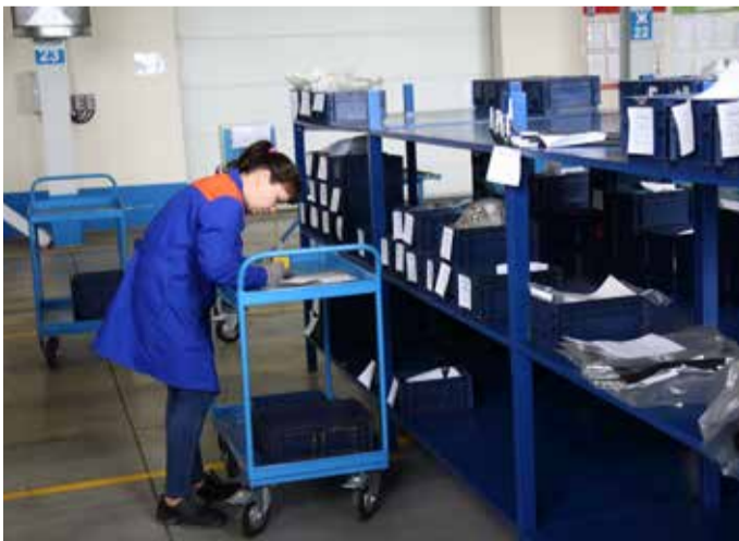
Ручная тележка — надёжная помощница при раскладке комплектующих