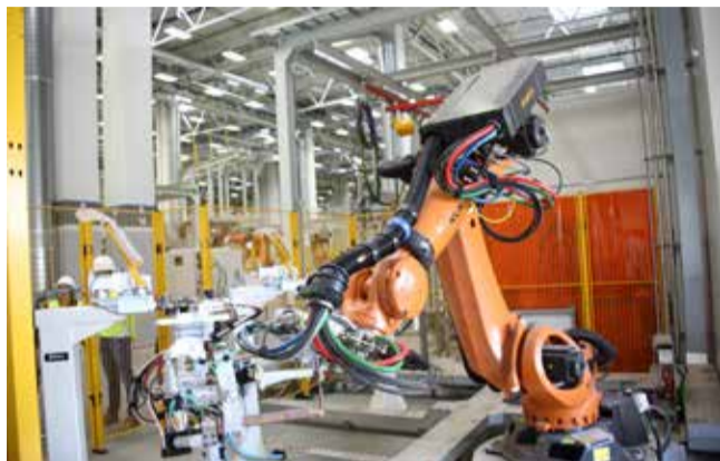
Первым запустили робота в учебной ячейке

Увлечение построением непрерывных систем прошло. Сейчас важно сохранить место для манёвра — как технологического, так инвестиционного. Сварку крупных