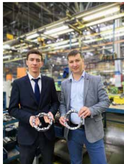
Аудиторы с технологическим образованием знают, как сэкономить средства

технологической подготовки производства — подбор режущего инструмента, режимов резания, а с экономистами решались вопросы финансовых параметров проекта.