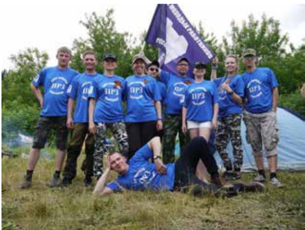
Команда ПРЗ готова к любым испытаниям

Команды ПРЗ и РИЗа, участвовавшие в соревнованиях, оказались на высоте практически во всех номинациях. Соперников они сразили не только умением проходить военизированный городок, но и артистическими способностями — были лучшими и на сцене слёта. Театрализованное представление о начале войны в конкурсе «Визитка» в исполнении прессоворамщиков растрогало до слёз всех участников. Ризовцы за две недели сумели создать настоящий вокальный ансамбль. Песня «Белые берёзы» стала одним из лучших номеров импровизированного концерта. По итогам соревнований ПРЗ занял второе место, РИЗ — третье.