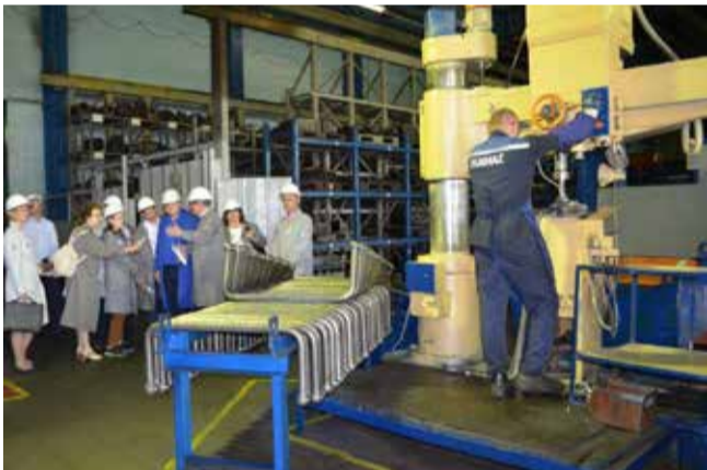
После презентации в учебном классе авторы, эксперты и руководители отправились на производство, чтобы собственными глазами оценить, «как это работает»

Это и установка оптических датчиков в зоне работающих механизмов для безопасности наладчика, и оригинальная универсальная подвеска для перевода операции дробеочистки с устаревшей установки на более технологичную, и приведение к требованиям эталонного рабочего пространства в корпусе.