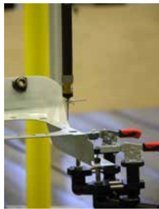
Точность сборки проверят в лаборатории точных измерений

В камере также впервые будет производиться очистка от паров краски с помощью мощного потока воздуха. Исключительная чистота будет царить во всём помещении окрасочного