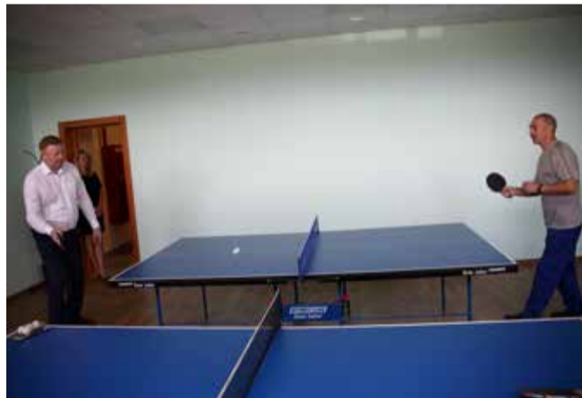
Партия в настольный теннис с директором завода