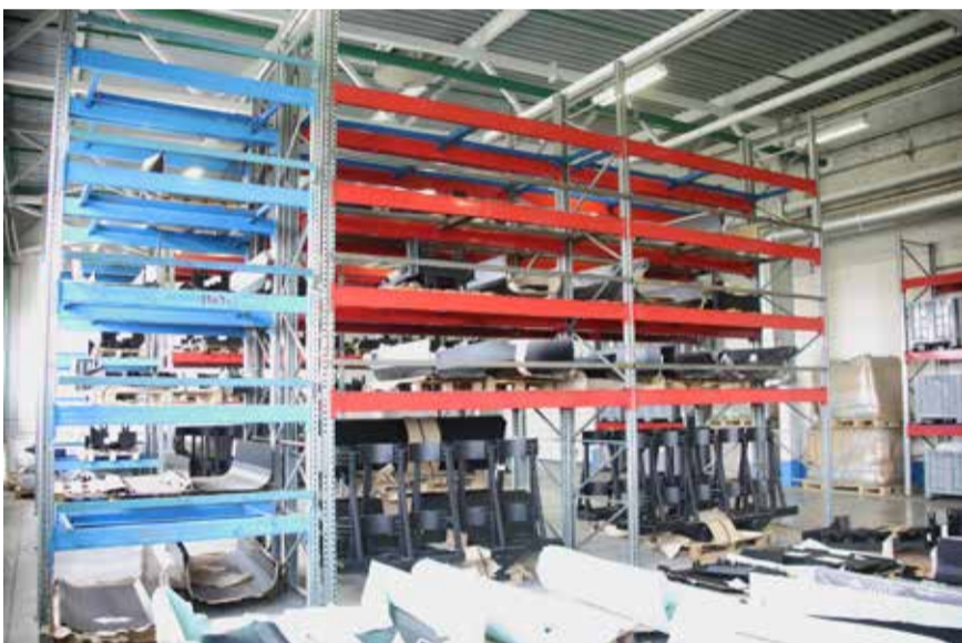
Фронтальные стеллажи способны выдерживать нагрузку до двух тонн

на склад, где сотрудники с помощью ручных тележек раскладывают всё по ячейкам (захочешь — не спутаешь, визуализация не подведёт) — тоже в КЛТ-тары, но соответствующие по