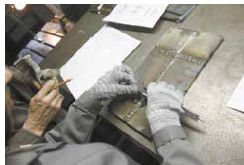
Жюри аккуратно замеряет каждый шов