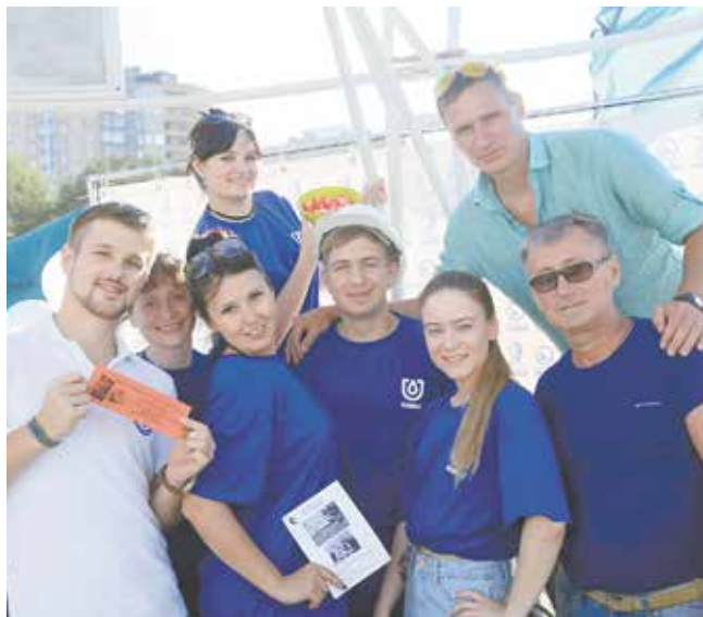
Камазовская молодёжь организовала для гостей праздника профессиональные пробы

На площадке кузнечного завода можно было вылепить из пластилина коленвал, используя заранее подготовленную форму. Испытать себя в роли машиниста тепловоза можно было на площадке «ПЖДТ-Сервиса». Азы профессии электромонтёра участники постигали на стенде «КАМАЗ-Энерго» — нужно было собрать электриче-