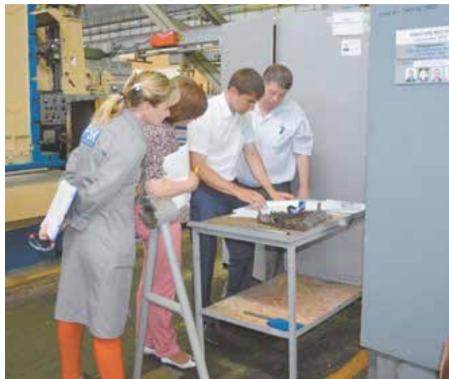
Сверка положения дел с требованиями чек-листа — одно из важных условий теста на эталонность

Надо заметить, что ШИК — пока первая ласточка. Руководство завода намерено по такой же схеме довести до образцового состояния и другие цеха и корпуса.