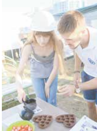
Литейщики раскрыли суть своей деятельности на мастер-классе по изготовлению парафиновых свечей

скую цепь так, чтобы загорелась лампочка. Сотрудники логистического центра продемонстрировали работу склада, предложив гостям отыскать нужные детали и собрать из них грузовик.