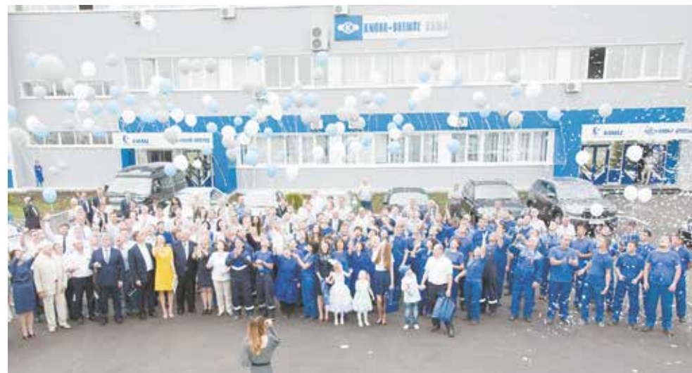
Высокие пожелания, высокие

нам надо очень постараться, — заявил он, обращаясь к партнёрам и коллективу.