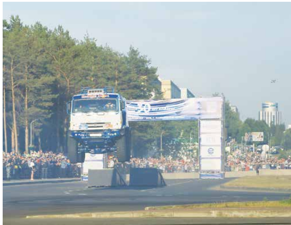
«КАМАЗ-мастер» впервые показал в Челнах шоу «летающих» грузовиков

После шоу на площадку выехали боевые машины, которые участвовали в международных ралли-рейдах. Выставка иллюстрировала