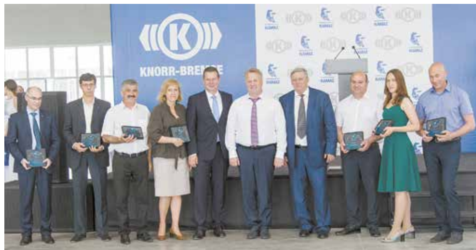
Памятные награды вручены и работникам предприятия

— В последующие годы компания выйдет на торговый оборот в семь миллиардов рублей, но для этого всем