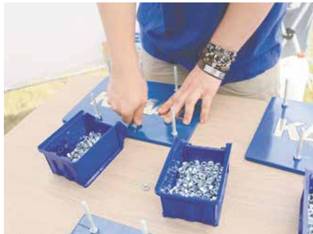
Профпроба на слесаря МСР — закручивание гаек на скорость