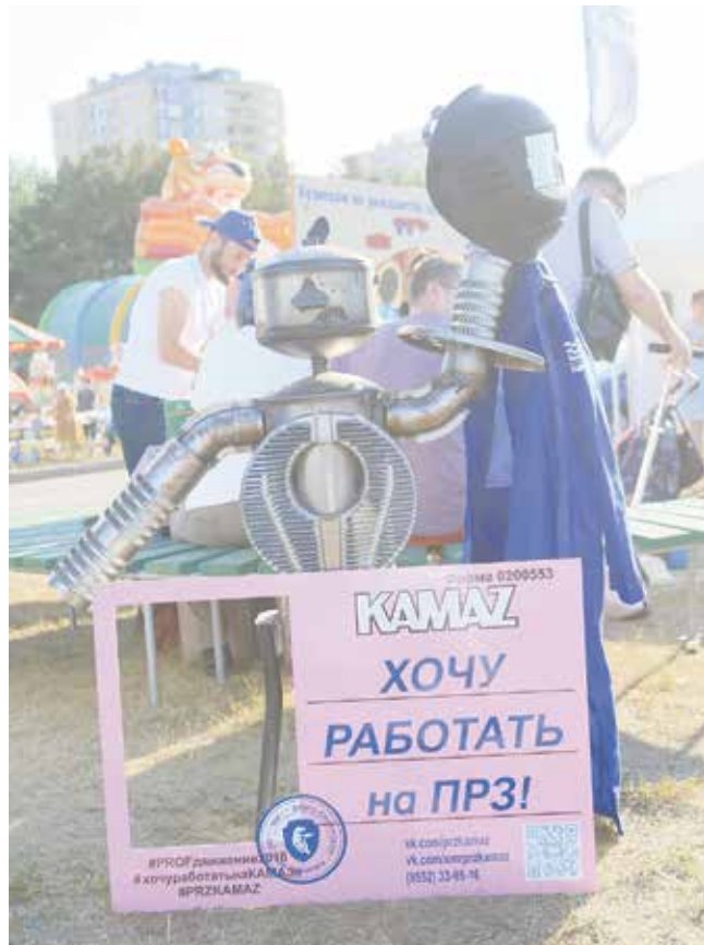
Желающие с удовольствием фотографировались со сварочным роботом с ПРЗ