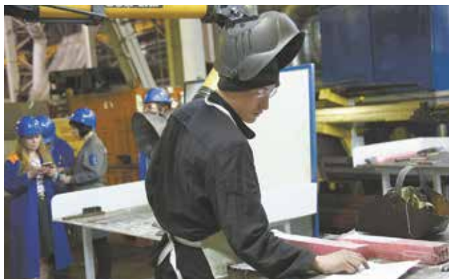
Перед началом работы каждому конкурсанту надо внимательно изучить чертёж

Победителю будет повышен разряд. Остальные участники получили утешительные призы и опыт участия в конкурсе. Самые упорные смогут попытаться счастья ещё раз, правда, уже в следующем году.