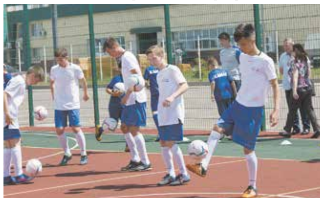
Будущие звёзды российского футбола с удовольствием выполняют и обязательную, и показательную программы

Журналистов интересовали не только возможные изменения в Совете директоров и какой процент акций «КАМАЗа» готов «оторвать от сердца» Ростех, но и за кого на ЧМ болеют топы — «кроме наших». Гендиректор «КАМАЗа», дипломатично напомнив о зарубежных акционерах компании, признался и в личных искренних симпатиях команде Германии, посожалев о её сенсационной неудаче. Предпочтения главы Ростеха остались за кадром,