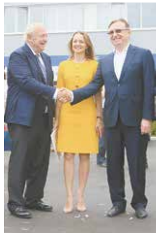
Впереди много важных проектов

Совместное предприятие «КАМАЗа» и немецкой компании «Кнорр-Бремзе АГ» появилось на свет как раз накануне масштабного