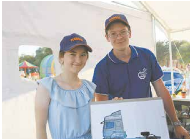
НТЦ представил специальность инженера-конструктора — гостям предлагалось собрать грузовик из паззлов

Многих посетителей привлёк стенд КАИ. Особенности конструирования и програм-