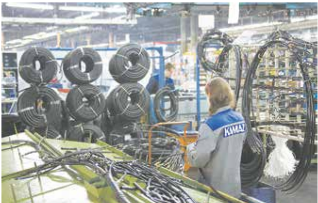
В цехе пучков и проводов травм не было десять лет. Стабильность нарушила несоблюдение требований охраны труда

— Сегодня в предупреждении травм главная роль отводится мастерам, начальникам цехов, руководителям производств. Они должны понимать: рабочие не нарушают требования охраны труда, если на предприятии есть постоян-