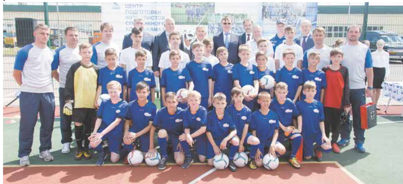
От высоких гостей ребята получили подарки и сфотографировались на память