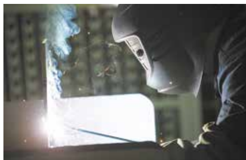
Процесс сварки — просто волшебство