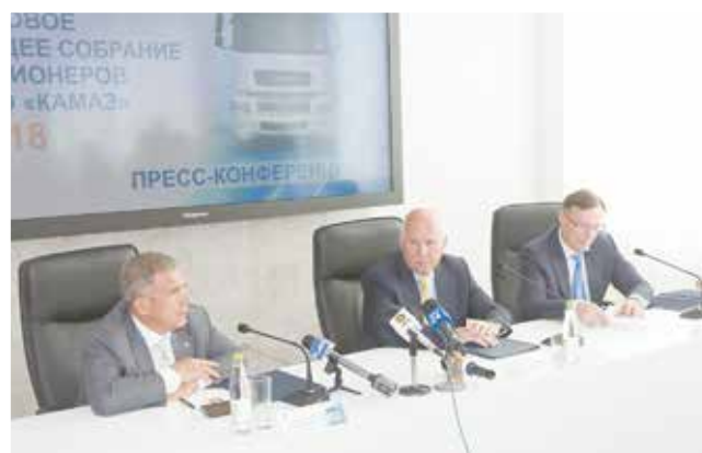
За что журналисты ценят брифинги — так это за возможность получить информацию из первых рук

Весь генералитет и пресса в период собрания перемещались по маршрутам на двух электробусах КАМАЗ