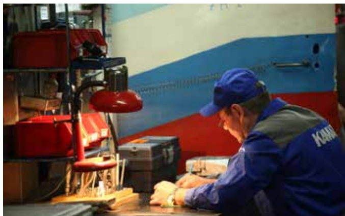
Оформление рабочего места эстетично вписывается в интерьер лаборатории сборки разворота и испытаний турбокомпрессоров