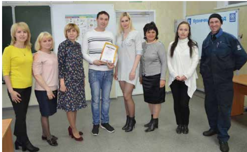
Одна игра — два победителя: «АПРико» и «Республика ШИК» уже не соперники

участвовавших в военных операциях, поэзию тех лет и даже те три замечательных продукта, которые по рекомендации главного интенданта царской армии появились в рационе советских солдат, ведущих бои в 41-м под Москвой (сало, спирт, сухари). К финалу две команды, «Республика ШИК» и «АПРико», пришли с большим, но одинаковым количеством баллов. Обе получили памятные призы от профсоюзной организации завода, а все остальные участники — сладкие подарки.