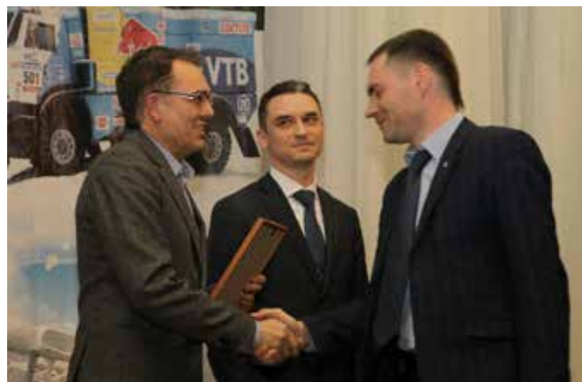
Только почётные грамоты «КАМАЗа» получили 10 сотрудников, а всего награжденных было 22

А по завершении праздника некоторые его участники вернулись... в НТЦ, на работу. Видимо, новые конструкторские находки (ну конечно они, а вовсе не долг присутствия на совещании!) озарили кое-кого прямо на профессиональном празднике!