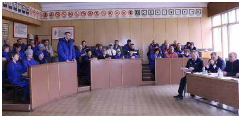
Важно, чтобы после разговора несчастных случаев стало меньше

Результат от общего обсуждения причин происшествия есть. Скорость в производственном корпусе ПРЗ водители погрузчиков уже сбавили. Надолго ли?