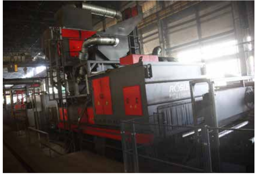
Для восстановления дробеёма пришлось проникать в тесную пыльную камеру «Рёслер»

Немало времени понадобилось на отладку оборуд