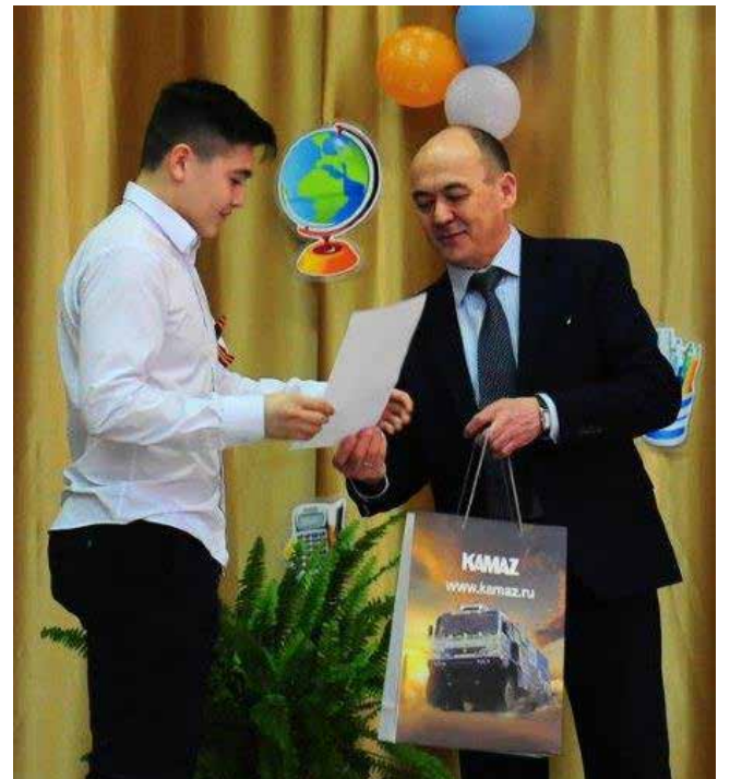
Всех победителей одарили по-камазовски

Очень любят ученики 23-й и рисовать. Впечатления о «КАМАЗе», запечатлённые мелом на асфальте, были