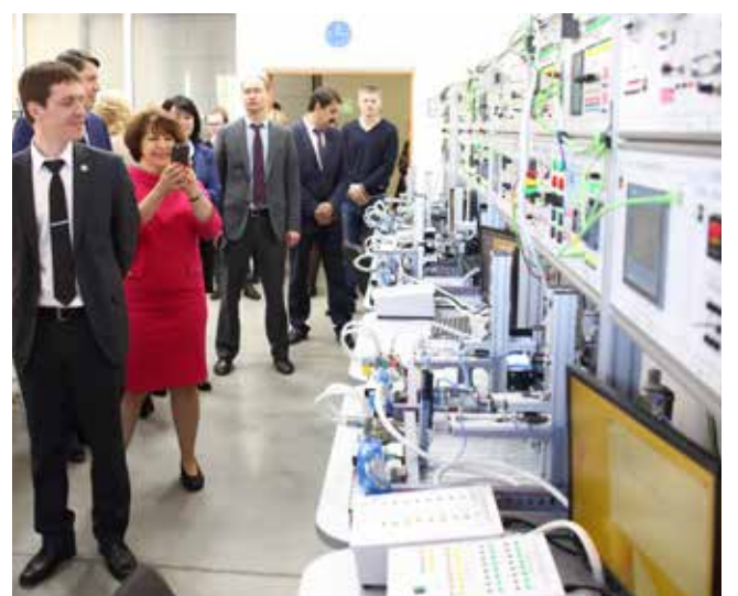
Гостям показали мастерские, в которых проходят обучение рабочим специальностям

На сайте Татарстан-2030 можно внести свою стратегическую инициативу, а также проголосовать за понравившуюся.