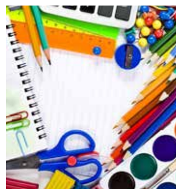
Канцтовары для первоклашек — предметы самые нужные

Напоминаем также, что у подарочных карт, полученных к 1 сентября 2017 года, 31 мая заканчивается срок действия. После этой даты магазины «Нико» и «БрикЦентр» их принимать уже не будут.