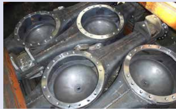
Аудит моек на автомобильном заводе заставляет задуматься: если после промывки на деталях остаются стружка, масло, остатки моющего раствора, можно ли считать их чистыми?

— когда есть техпроцесс? Часто в погоне за новыми техниками мы уходим от простых вещей, которые нужно делать всегда: следить за оборудованием, за моментами затяжек, мыть детали, выполнять измерительные операции... Просто точно соблюдать техпроцесс! Это что — фишка? То же можно сказать и в отношении Системы менеджмента качества: не отступаем от принципов — имеем качественный продукт, в противном случае сами же дискредитируем свою СМК. Мы провели тотальный аудит всех заводских моек, и... Где-то детали не моются вообще, где-то оборудование не обеспечивает должной температуры, давления, концентрации растворов. Лучше всех ситуация на ЗЗЧК. Мы затеяли глобальную работу. При всём том, что перед нами задача перехода к цифровому производству, Индустрии 4.0, такие простые вещи никто не отменял, и без соблюдения этих правил мы никуда не сдвинемся!