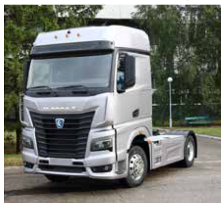
Переход к выпуску автомобилей поколения K5 компромиссы в области качества исключает в принципе

— мотивировать и стимулировать за качество стремимся как рабочих, так и руководителей. Делать дефектную продукцию станет невыгодно. С этого года для рабочих минимальный размер доли премии за качество составит 50% — раньше она размывалась в составе прочих показателей. Кстати, одно из личных впечатлений-огорчений: многие люди, увы, привыкли, что в угоду объёмам, штукам, можно нарушать техпроцесс и выпускать некачественную продукцию. Тем самым дискредитируется принцип ЗНЕ: каждый на своём техническом переделе не производи брак, не передавай, не принимай. Со второго квартала нововведение — 25% премии каждого руководителя, включая членов Правления, зависит от показателей качества, а они будут измеряться с учётом удовлетворённости клиента. Вместе со службой персонала мы прекратили некоторые — бытовавшие десятилетиями! — практики, чтобы исключить