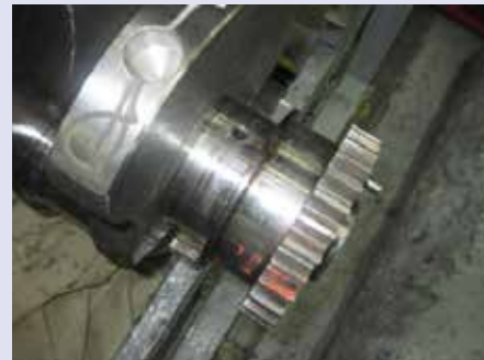
На заводе двигателей на поверхности коленчатого вала — краска от контакта с тарой, СОЖ, стружка. То ли мыли, то ли нет?

диагностики, качества обслуживания и пр. Поэтому все цели Стратегии измеряются КРП не внутренними, а внешними, в основе которых — удовлетворённость клиента. Их четыре: удовлетворённость автомобилем КАМАЗ в момент покупки; удовлетворённость сервисом (два этих показателя планируется довести до 92-95%); количество рекламаций по итогам трёх месяцев эксплуатации автомобиля; количество рекламаций по истечении двух лет эксплуатации. Снизить уровень рекламаций по двум последним пунктам, соответственно, планируется на 30 и на 60%.