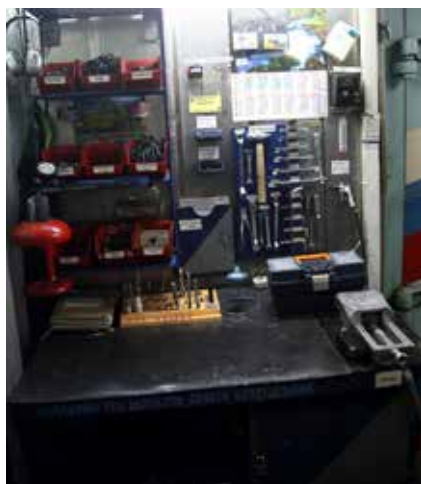
Всё чистенько да аккуратно. Просто загляденье!