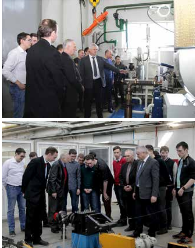
Интерес есть, а в цехе он усилился

Отношения развиваются по принципу «у вас — товар, у нас — купец»: блоку развития нужна «свежая кровь», а университет заинтересован в трудоустройстве выпускников на «КАМАЗ». Осенью в НТЦ на совещании с участием руководства службы главного конструктора по двигателям и представителей кафедры «Тепловые двигатели и установки» был подписан официальный договор о сотрудничестве. При этом, поскольку есть обоюдная заинтересованность сторон, у студента не будет статуса целевика. А впервые обоюдный интерес стороны проявили ещё летом про-