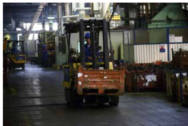
Водителям погрузчика на дорогах производственного корпуса нужно быть очень внимательными

— Никакие нормативные документы не сделают работу человека безопасной, если он сам не будет относиться серьёзно к сохранению своего здоровья и жизни. Для этого необходимо формировать культуру безопасного поведения на рабочем месте, в производственном корпусе. И в этом направлении мы все вместе будем двигаться. Сегодня в предупреждении несчастных случаев основная задача возлагается на руководителей производств, начальников цехов и мастеров. Они должны понимать — рабочие не нарушают требований охраны труда в том случае, если на предприятии есть постоянный системный контроль со стороны административно-линейного персонала.