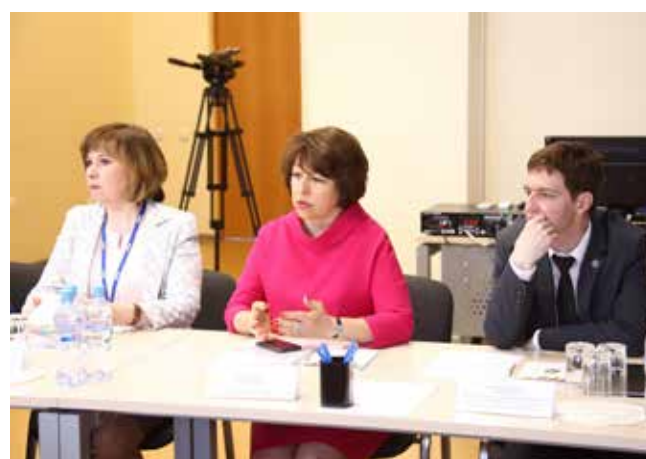
У каждого участника встречи были свои предложения по привлечению сил на промышленные предприятия

Встреча началась с небольшой экскурсии. Впечатления у гостей остались положительные: «МЦПК — максимально практикоориентированный центр, оснащённый современным оборудованием. Здесь всё целосовременно, современно и подчинено предприятию. Это