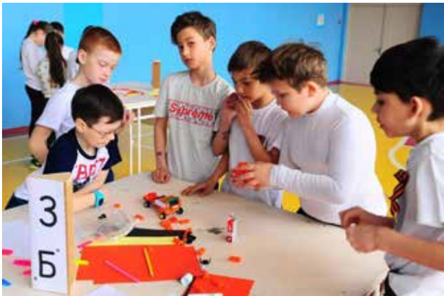
Создание новой машины — дело очень увлекательное

К празднику в учебном заведении подготовились основательно. Первоклашки написали стихи и выставили рисунки на конкурс «Мой КАМАЗ», ребята по-