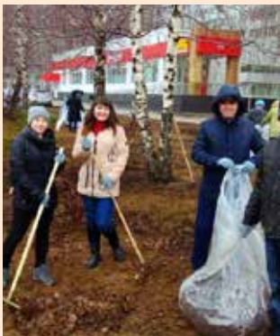
Наведем чистоту своими руками

Санитарно-экологический двухмесячник продлится до 31 мая.