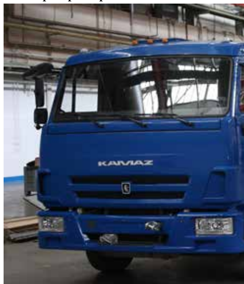
Прототип «Одиссея» уже изготовлен

Компьютер «Одиссея» разработан силами специалистов НТЦ и партнёров «КАМАЗа» из КФУ — университет является партнёром проекта