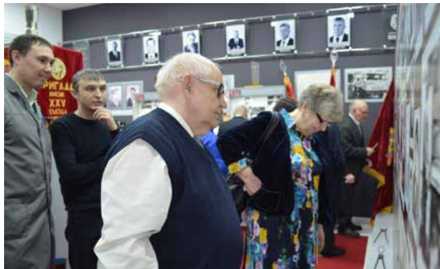
Экспонаты музея оживают, когда о них начинают говорить очевидцы

темы для разговора неисчерпаемы, а значит, будет повод собеседникам увидеться снова.