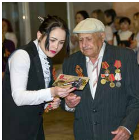
Дорогим гостям — особое внимание

Празднование продолжится и после 9 Мая. В музеях и библиотеках в мае будут организованы выставки и тематические экскурсии. В Совете ветеранов пройдёт вечер военной песни, а в День памяти и скорби камазовцы возложат цветы к братской могиле в посёлке Тарловка. Читая фамилии бойцов, умерших от ран, каждый вспомнит своих героев и пожелает долгих лет победителям.