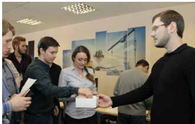
Жребий определил, под каким номером будет выступать участник конкурса...