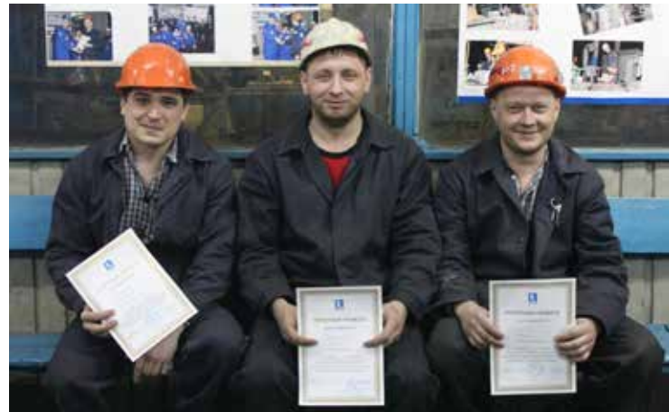
Трое победителей. Уставшие, но счастливые

переполоха стал конкурс профессионального мастерства. Ради него привычное планирование смены было заменено небольшой приветственной церемонией.