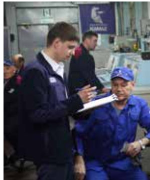
На осмотр одного конкурсного места уходит примерно 30 минут

Комиссия оценивает рабочие места по пяти критериям — сортировка (только необходимые ин-