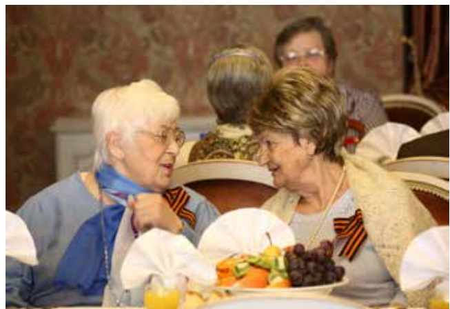
Что может быть лучше доброй дружеской беседы?