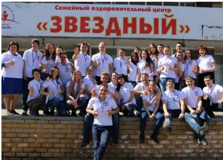
Молодёжный семинар собрал 50 участников из всех подразделений «КАМАЗа», а также с дочерних предприятий