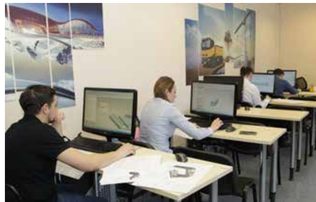
...а потом все начали проектировать в 3D экскаватор с «творческим» ковшом