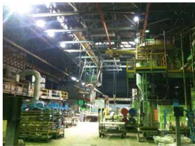
Стержневой участок в ПЧЛ после замены ламп заметно преобразился

Практически каждый второй человек, попадающий в производства литейного завода, наряду с шумом и пылью отмечает нехватку света. И это не просто субъективное ощущение. Проблема освещённости рабочих мест действительно есть. Решить её на предприятии стараются всеми доступными способами. К примеру, в 2017 году здесь инициировали инвестиционный проект «Модернизация освещения ЛЗ» с целевым финансированием в 16 млн рублей. Буквально на днях работы были завершены.