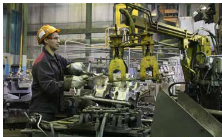
Главное — сосредоточенность

Казалось бы, ещё только семь утра, а в бытовке уже собралось руководство и представители заводских служб. Причиной