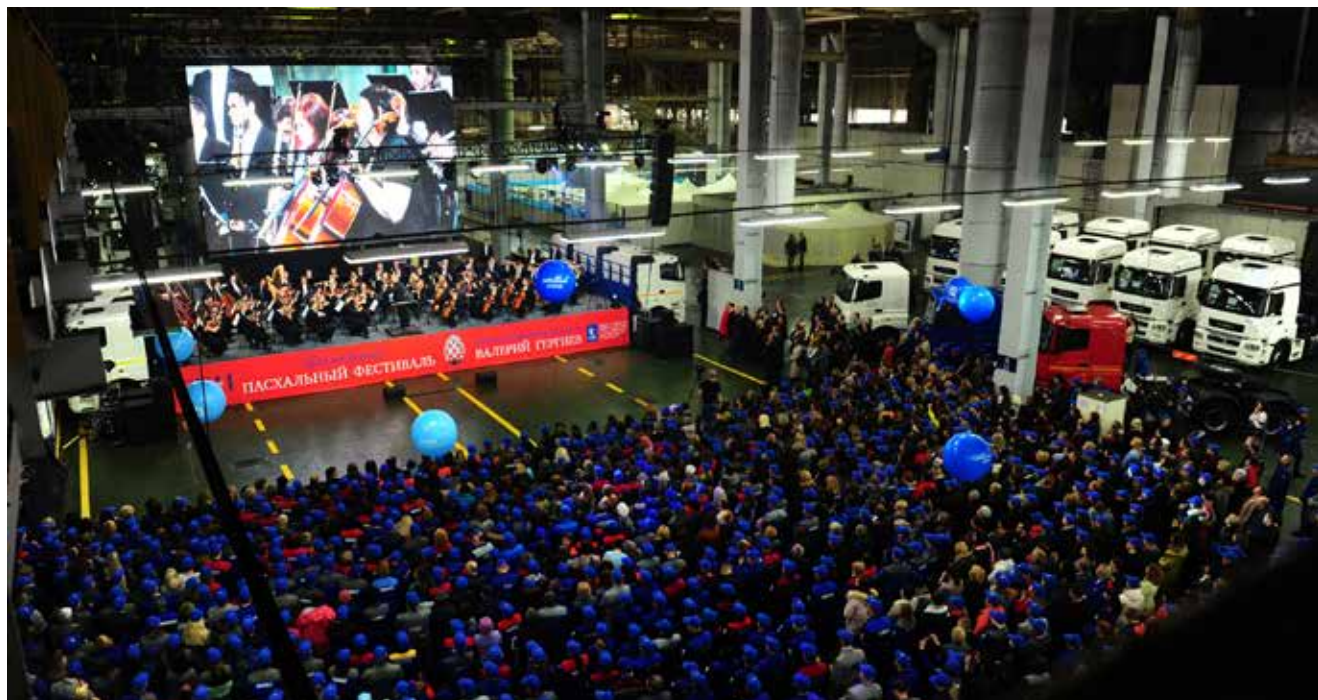
Современные технические средства передачи изображения (огромный экран, на который транслировался весь концерт) и живого звука создавали непередаваемую атмосферу

Овацией встретили зрители музыкантов, восторженно рукоплескали «Вальсу цветов» и «Адажио» из «Щелкунчика» Чайковского и «Картинкам с выставки» Мусоргского. И если кое-кому покажется преувеличением, что величавый финал — «Богатырские ворота» — ассоциируется с воротами, из которых водители-испытатели ЦКиСА каждый день выводят «в свет» новенькие КАМАЗы, то оно совсем небольшое!