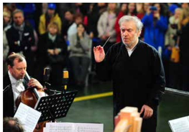
Из сотни программ оркестр показал «некоторые богатства своего репертуара»

Несомненно, этот концерт войдёт в историю оркестра, он отвечает нашей идее фестиваля — Светлого праздника, и это не праздник для одних без других: