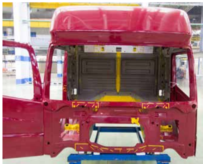
В каркасе кабины много деталей, сделанных на ПРЗ

В рамках проекта для 80 фрагментов каркаса кабины были разработаны и изготовлены 240 штампов. Конструкторы, технологи и рабочие трудились в одной