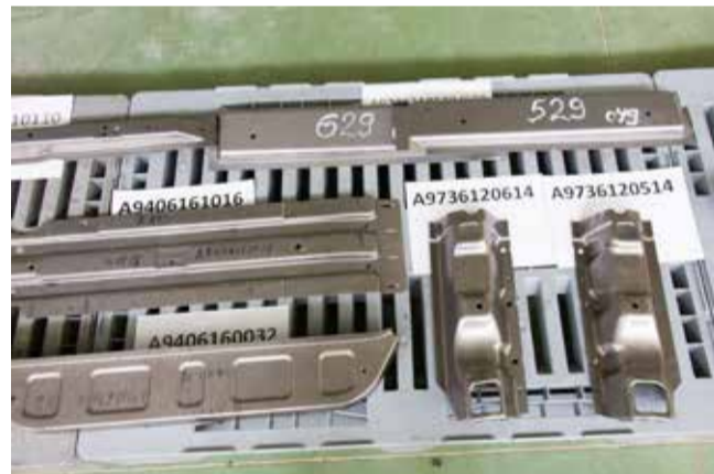
Для изготовления деталей со сложной конфигурацией необходимо сразу четыре штампа