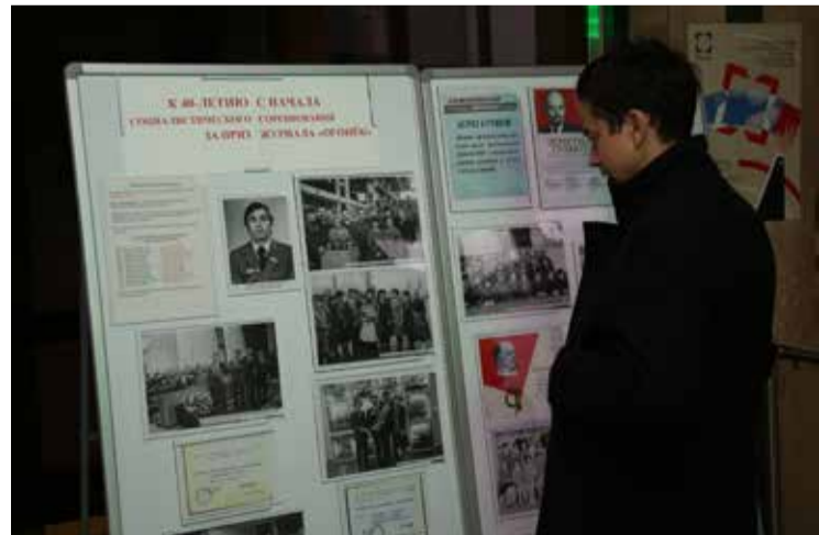
40 лет назад камазовцев вдохновляли победы в соревнованиях