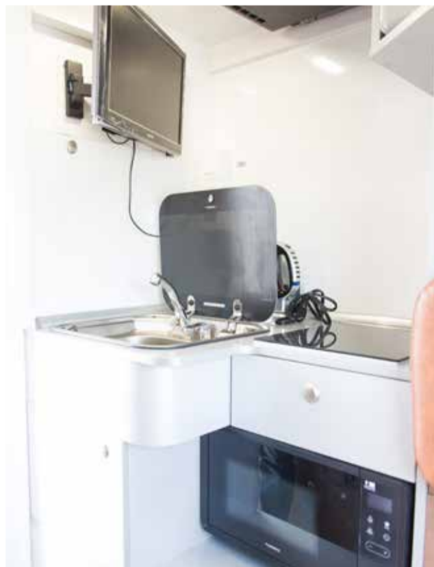
В жилом модуле можно находиться неделю и больше. Всем необходимым он оснащён