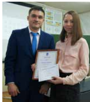
Все студенты, принявшие участие в конкурсе, показали себя достойно

РИПТиБ планирует и дальше повышать доступность обучения. В планах на 2018 год — разработка аудиокниг по сервисному обслуживанию и эксплуатации камазовской автотехники. Это ещё один из инструментов дистанционного обучения, наряду с учебными пособиями online. Кроме того, запланировано перевести в дистанционный формат курсы по продажам автотехники и запчастей. Новые формы обучения разрабатываются с учётом пожеланий дилеров. Тесное сотрудничество РИПТиБа с дилерскими центрами позволяет создавать уникальные учебные курсы по автотехнике «КАМАЗ», которые не имеют аналогов в России и за рубежом.