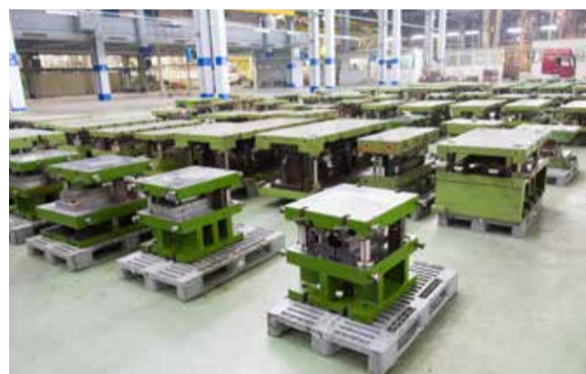
Оценить объём проделанной работы можно по количеству штампов

Сравнить оригинальные и локализованные комплектующие можно в цехе сборки-сварки кабин. Друг от друга они не отличаются, а значит, прессоворамщик и эта задача оказалась по плечу!