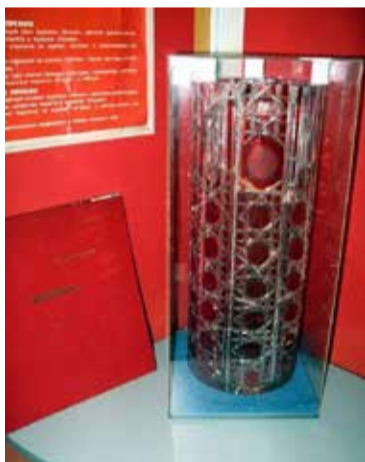
Хрустальный приз, борющийся за который шла 10 лет

По итогам 1978 года в финал вышли семь бригад с разных предприятий «КАМАЗа». В церемонии чествования участвовали камазовские руководители, партийные, комсомольские и профсоюзные лидеры. На