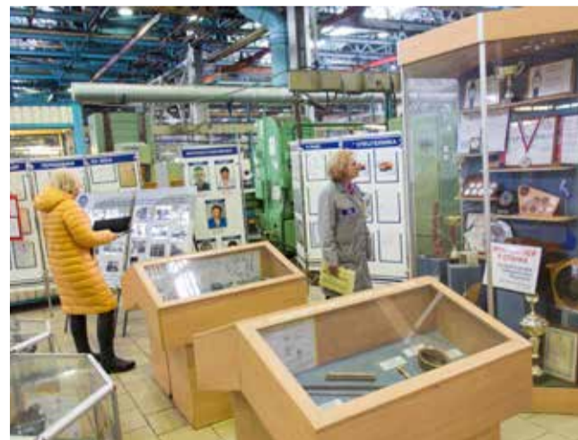
На небольшой площадке собраны все награды РИЗа

Оказалось, сомнения были напрасными. От пыли дипломы, вымпелы и фото защищают стёкла, а от вандалов — ризовское воспитание. За три месяца на производственной площадке не было ни одного случая покушения на заводскую сокровищницу. Зато в перерывах заводчане заглядывают сюда с большим удовольствием. Фото лучших в своём деле специалистов и оригинальные решения, придуманные технологами и опытными рабочими, вдохновляют.