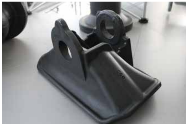
Отливка под названием «Головка колокола» из первого пакета заготовок уже отлично зарекомендовала себя