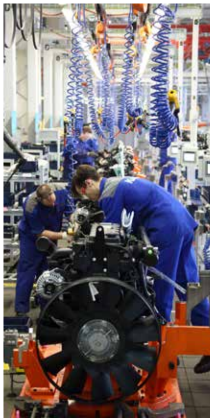
На новой линии планируется создать 71 рабочее место

В ближайших планах — локализовать производство всех комплектующих для Р6 в одном месте. Подготовка площадей для него в разгаре.