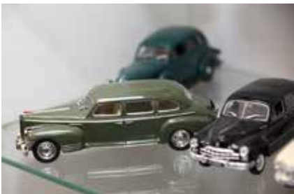
Модель автомобиля, на котором ездил Сталин