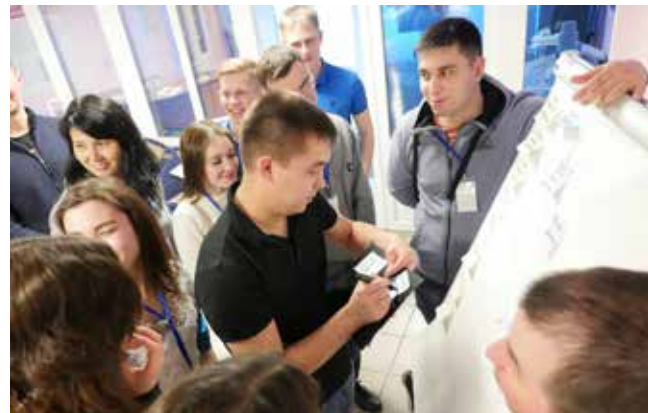
Работа форума была построена так, чтобы участники смогли получить необходимые знания и компетенции по решению предложенных задач

многочасовые, до четырёх часов, мозговые штурмы, проводили различные тренинги и групповые упражнения, необходимые для профессионального и личностного роста. Были организованы и другие задания: к примеру, если в прошлом году форумчане могли попробовать себя в роли строителей моста, то в этом они попрактиковались в конструировании самолётов нового поколения. Ещё одним любопытным заданием стала Фабрика процессов. Каждый форумчанин получал должность — от простого бухгалтера до директора фирмы. Задачей было симитировать процесс подготовки отчёта для гендиректора. Такой тренинг даёт представление