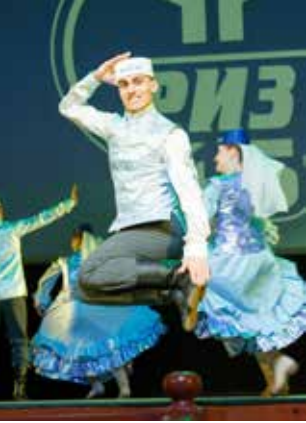
Оцените удаль джигита!

Самый красивый проект портала «Вести КАМАЗа» уже набрал популярность в Сети и по просьбам читателей перебирается на страницы газеты. Итак, встречайте: