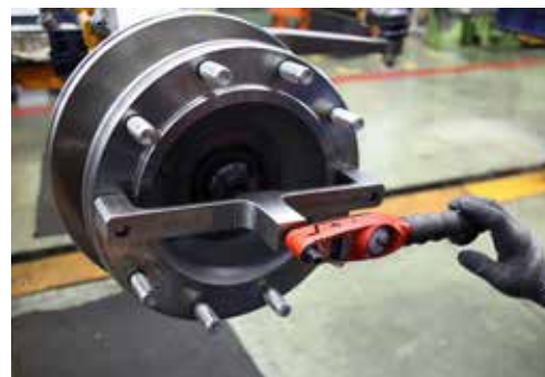
Вместо ручной настройки будет автоматизированная

электронным инструментом. Модернизация ждёт и окрасочное производство АвЗ, после неё улучшится качество лакокрасочного покрытия.