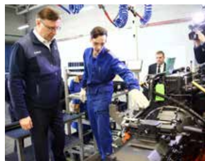
Молодой движковец уже освоил работу с новеньким Р6

Гендиректор «КАМАЗа» отметил: «Производство нового двигателя Р6 — это самый сложный инвестиционный проект нашей компании, и мы возлагаем на него большие ожидания. Стараюсь раз в месяц приезжать, знакомиться с ходом работы. Пока всё идёт по графику.