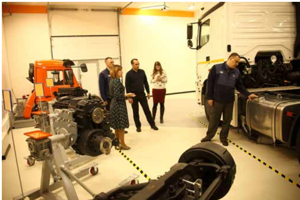
Новенький КАМАЗ-5490 в холле МЦПК неизменно привлекает внимание экскурсантов

Преимущества покрасочного 3D-тренажёра в том, что на нём можно отработать технику окрашивания до автоматизма. И краски при этом не уйдёт ни грамма!