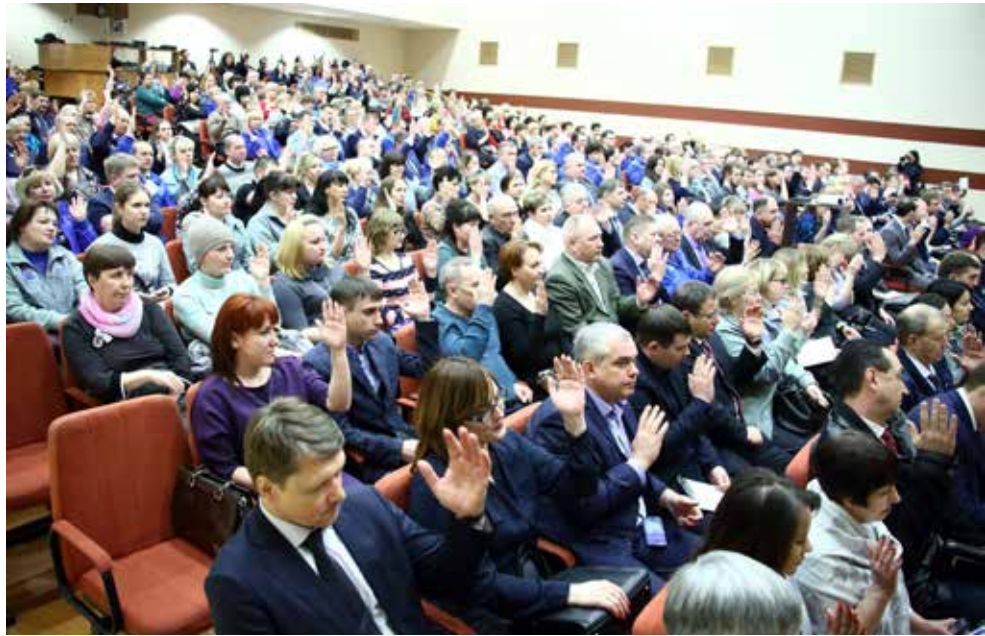
Делегаты голосуют за дальнейшее развитие компании