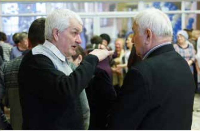
Ветераны РИЗа понимают друг друга с полуслова

Под аккорды финальной песни на участников праздника выпали сотни белых шаров с памятной надписью «РИЗ — 45». Их ловили и уносили с собой как напоминание о светлой и счастливой странице жизни.