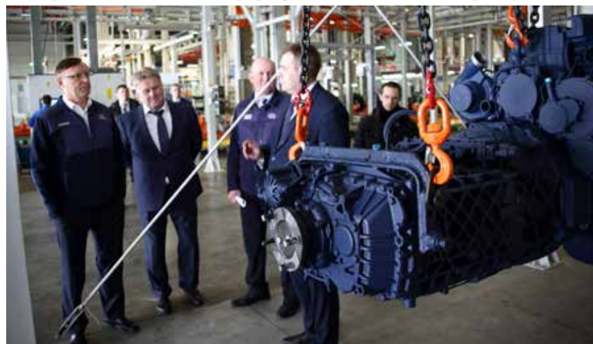
Вот он, готовый агрегат