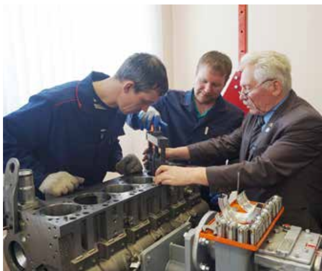
Опыт мастера — лучшая наука

Особенность мастер-классов состоит в том, что учебные группы комплектуются всего из трёх специалистов, которые на несколько дней погружаются в практику по максимуму. В результате такого индивидуального, если не сказать эксклюзивного, подхода достигается