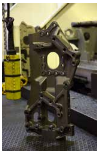
Для обработки этих кронштейнов будет закуплено новое оборудование