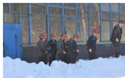
Эвакуация персонала из КПК-3 заняла ровно пять минут