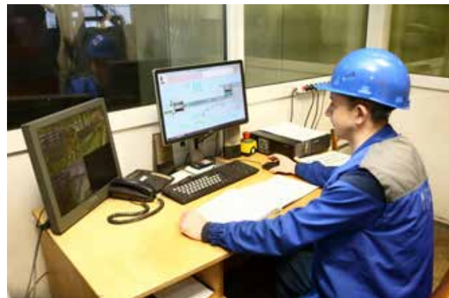
Переналадка режимов работы линии производится с пульта управления, то есть с этого рабочего места