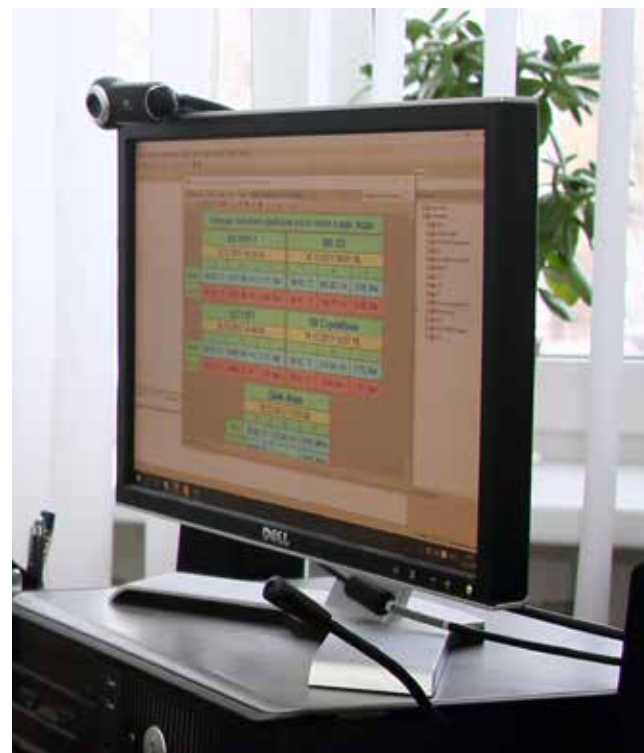
На мониторе отражаются показатели теплоснабжения всех камазовских подразделений

Для снабжения газом образным азотом высокого качества построили блок