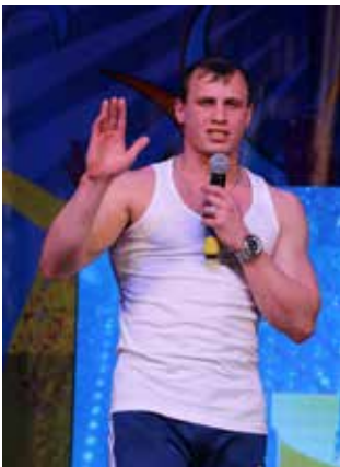
Крепкие уральские парни украсили камазовский фестиваль КВН