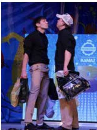
«Полный привод» показал, что мужчины в душе остаются детьми: вроде всё в магазине по списку жены закупил, но вдруг тебя охватывает веселье — и начинается стрельба из пулемётов, бауки, футбол... В ход идут все покупки к Новому году!