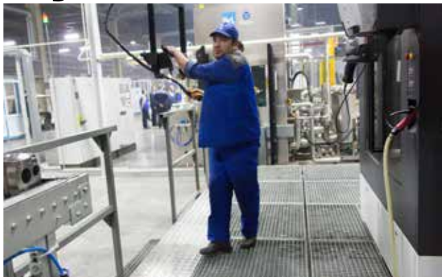
Один из пунктов программы конференции — экскурсия на конвейер стыковки силового агрегата на новой линии Р6 завода двигателей

1700 эргономичных рабочих мест организовано сегодня на заводах «КАМАЗа» с применением каракури — использованием механизмов, движимых силами гравитации, стоит задача перехода от