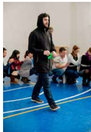
Команды прошли испытания, в которых без крепкого плеча и сильной руки друга просто не выжить

Кроме этого, в рамках форума были проведены тренинги по эффективной коммуникации приглашёнными гостями — представителями МЦПК. По окончании форума молодые кадровики делились своими впечатлениями от мероприятия.