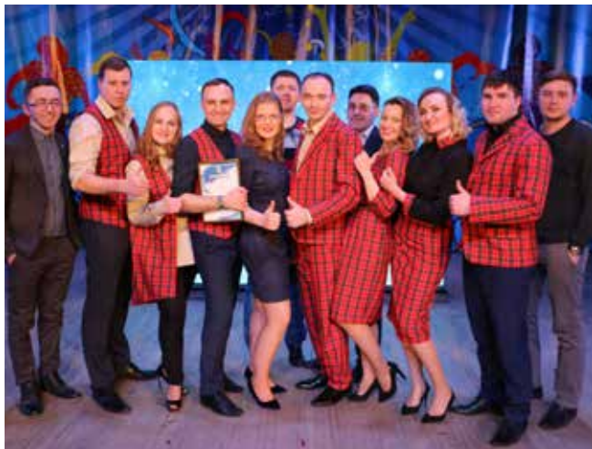
Хотя сборная гендирекции — команда молодая, в этом году заняла первое место

В ДК «КАМАЗа» 15 декабря отгремел зимний фестиваль КВН, организованный профкомом. В нём приняли участие девять подразделений и заводов компании, а также гости из Миасса, команда АО «Автомобильный завод «Урал», выступившая вне конкурса.