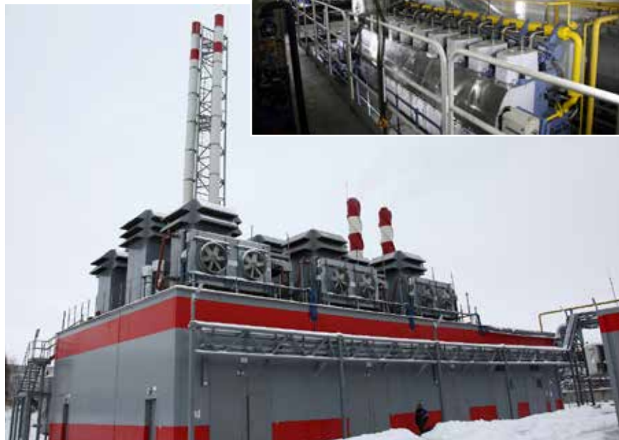
Строительство мини-ТЭС началось в сентябре 2016

Мощность каждой газопоршневой установки 4,2/МВт