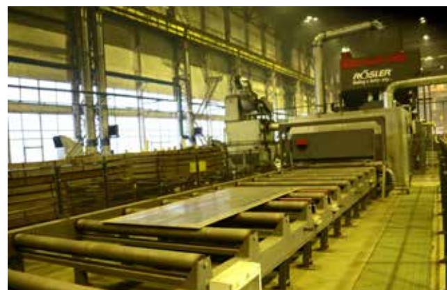
Усовершенствовать можно даже немецкую линию