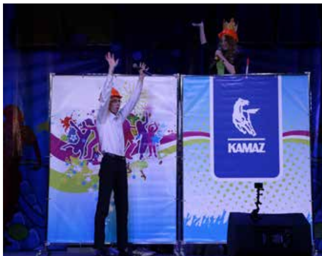
Девушка-крановщица с ПРЗ никак не могла найти себе пару: какие-то проблемы всегда сваливались на бедные головы тех мужчин, которые ей нравились