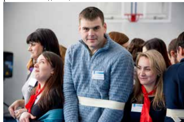
Каково оно — быть в одной связке?