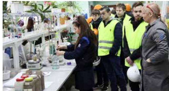
Желающие попрактиковаться в ЦЗЛ есть