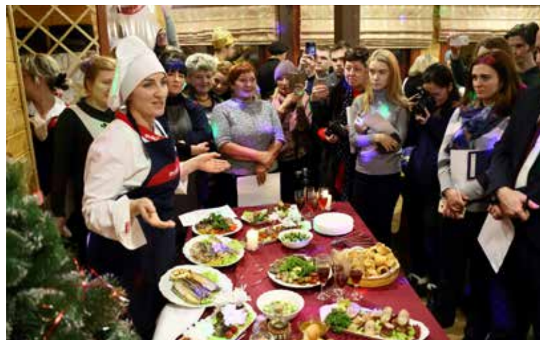
Победители — «Бабка и Ко» ПРЗ — высказали Деду Морозу смелое пожелание пройти стажировку у лучших поваров Франции. Интересно, исполнит?