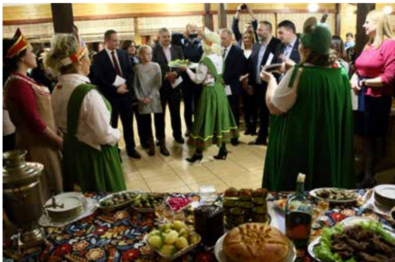
Угощение от команды «Лягушка и подружки» щедро раздавалось гостям