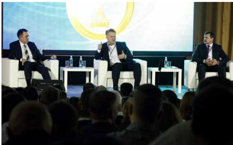
Топ-менеджерам скучать в удобных креслах было некогда

В тактическом плане развития Совета мастеров и бригадиров-2018 уже есть несколько разделов. Один из них посвящён более детальному изучению опыта партнёров. Сотрудничество будет продолжаться.