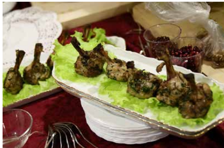
Важно не только приготовить еду, но и красиво её подать