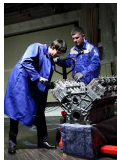
Затяжку гаек мотора гендиректор проверил лично

Звучала музыка, пела скрипка, юбиляры аплодировали вокалистам и танцорам. Но тут на сцену явился... ну конечно же, тот самый