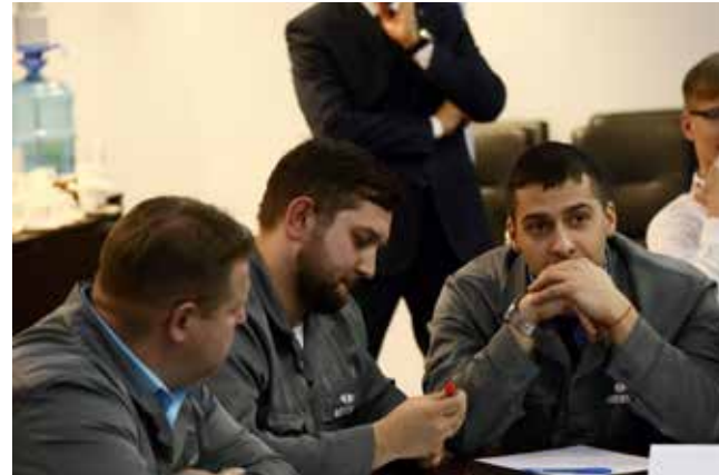
Формулировки известных понятий заставляют задуматься

Первой начала пробуксовывать команда «Татнефти», а потом камазовцы сделали решительный шаг вперёд. Всего на викторине было задано 43 вопроса. Представители «Татнефти» ответили на 19, концерн «Калашников» — на 23, «АвтоВАЗа» — на 26. Лучший результат у кузнецов: