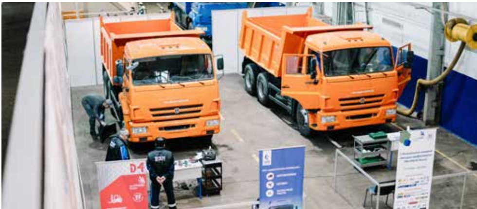
Площадка для соревнований готова