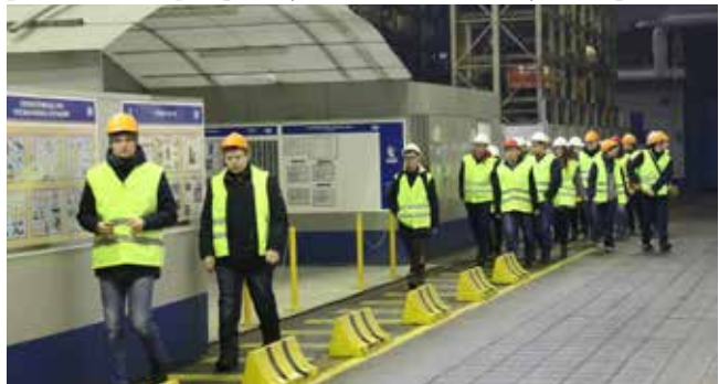
На кузнечный студенты пришли уже во второй раз