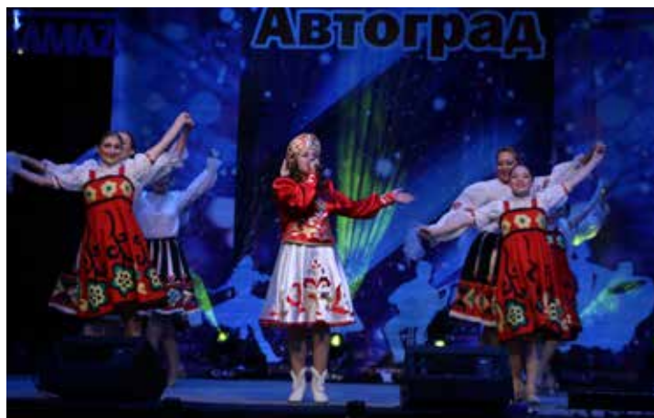
Русское народное поурри в исполнении литейщиков