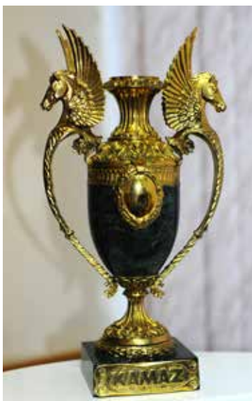
Кубок директора на год останется в цехе тормозов

Награждение победителей состоится на профсоюзном совещании. Кубок будет переходящим, в следующем году право на его обладание снова нужно будет отстаивать в футбольных баталиях.