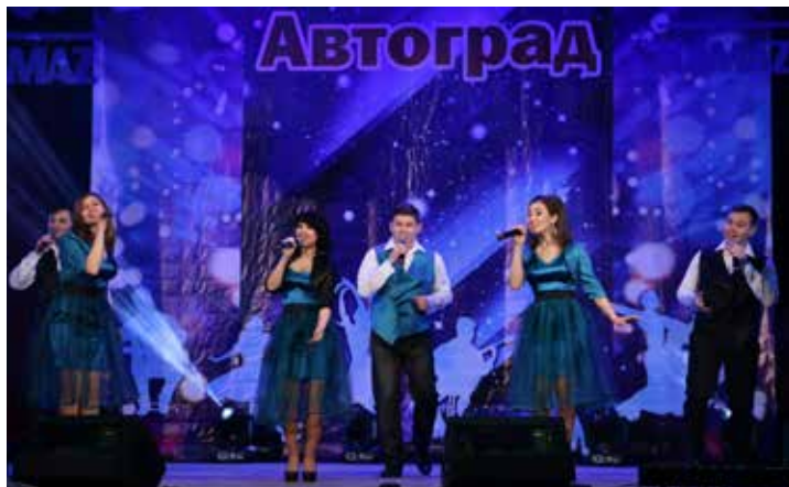
Вокальный ансамбль ПРЗ выступил в ритме джаза

По итогам фестиваля «Автоград» первое место завоевал творческий коллектив литейщиков. «Серебро» досталось пресово-рамному заводу. А третье место поделили завод двигателей и кузнечный. Не остались без внимания и сами артисты: индивидуальные награды были вручены в 13 номинациях.