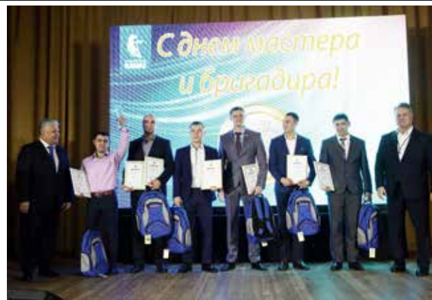
В этом году переходящий кубок завоевали кузнецы

В этом необычном ансамбле играют дети, которые не видят инструментов. При этом каждый из них за время выступления показал навыки владения гитарой, флейтой, перкуссионными колоколами. «Проснись и