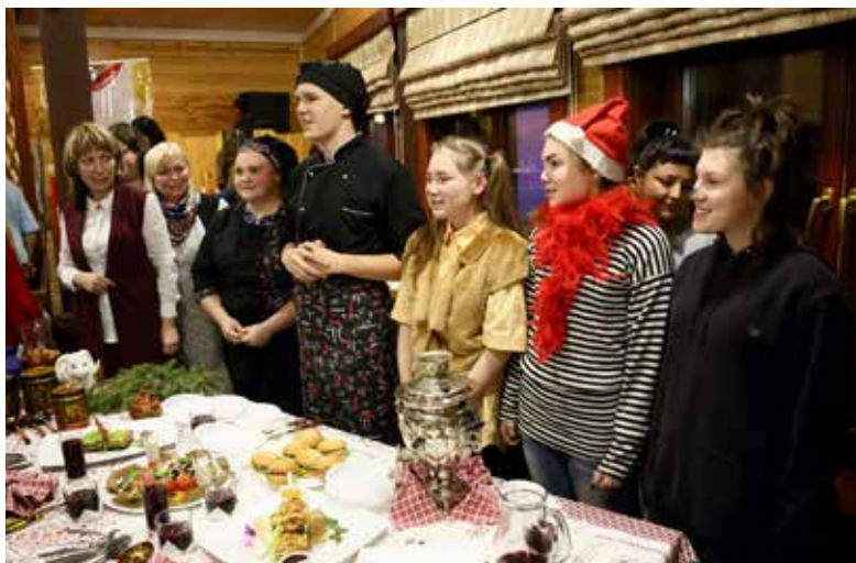
Хотя студенты НГТТИ пока только учатся поварскому мастерству, со своими старшими коллегами в конкурсе они состязались на равных

признало «Суперповарёшек» АвЗ, поэтичными — поваров из гендирекции, а движковцы отметились необычным блюдом.