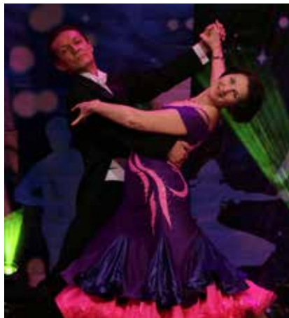
Грация, отточенность движений — это танцевальный дуэт с литейного