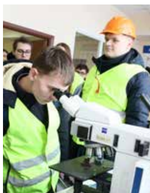
Образцы стали рассматриваются под микроскопом