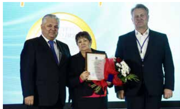
Производством на участках «КАМАЗа» командуют и женщины-мастера