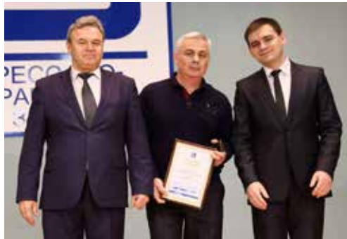
Признание заслуг важно для каждого мастера

Музыкальными подарками стали лучшие номера заводской художественной самодеятельности.