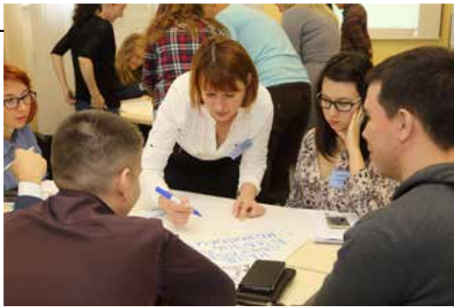
На разминке по командообразованию ребята готовили презентацию своей компании