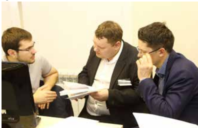
Найти выход из тупика помогла консультация эксперта

бок найдут эксперты и тем больше сумеете исправить.