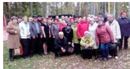
Собрались все свои

Подняли настроение ветеранам любимые песни, которые они дружно исполнили хором. Пенсионеры поблагодарили руководство и профком за тёплую встречу.