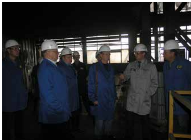
Изготовители — производственники, технологи, эксперты по качеству — могут держать ответ за свою продукцию

Результатом пятичасовой работы стали протоколы, закрепившие принятые решения, которые включают в себя как оперативные шаги, так и долгосрочные программы по повышению качества литья.