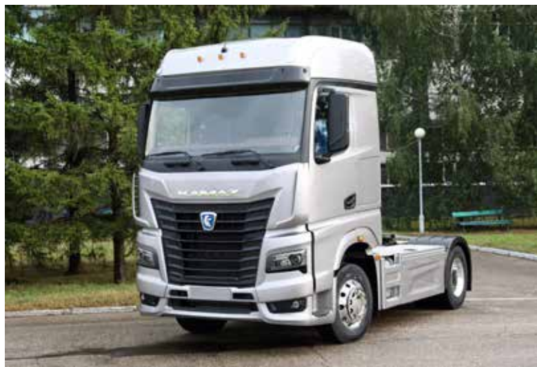
Уже есть желающие взять первые 200 автомобилей 54901 в эксплуатацию

Рост реализации автомобилей КАМАЗ на российском рынке за 9 месяцев 2017 года по сравнению с тем же периодом 2016 года составил 20%. Своё 20-летие ТФК «КАМАЗ» отметит 25 октября.