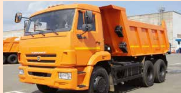
Выбор клиента в пользу грузовой автомобильной техники марки «КАМАЗ» не случаен: ему способствуют конкурентоспособная цена, технические и эксплуатационные характеристики продукта

ООО «Транс-Регион» обращается в лизинговую компанию «КАМАЗ» впервые. Компания занимается перемещением грузов по Чувашии и Марий Эл. Сейчас «Транс-Регион» готовится к реализации крупных проектов и планирует увеличение автопарка за счёт автомобилей КАМАЗ.