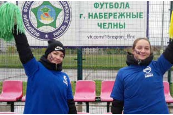
Фанаты задают настрой любой игре