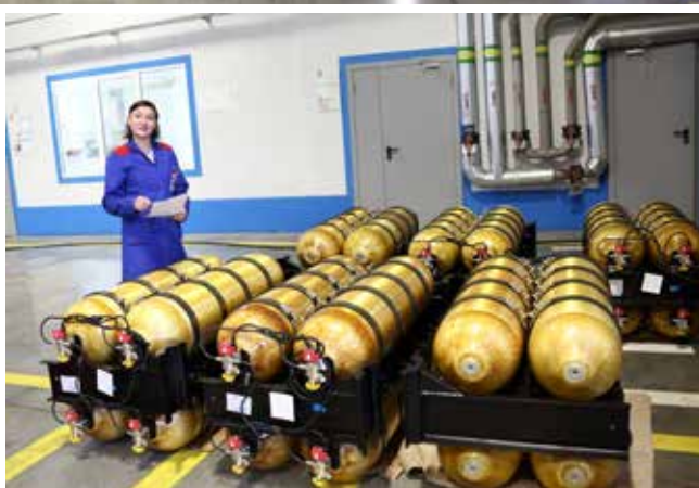
В корпусе гарантируют надёжность и безопасность газовых модулей