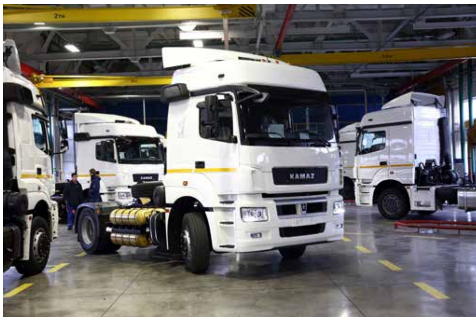
Газодизель КАМАЗ-5490 NEO имеет хорошие перспективы на рынке

Это совместный проект «КАМАЗа» и техноцентра «Восток» — дилера из Санкт-Петербурга. Тягач, адаптированный под установку газобаллонного оборудования, собирается на главном сборочном конвейере. В корпусе газовых автомобилей на машину устанавливаются баллоны и сопутствующее оборудование, настройку