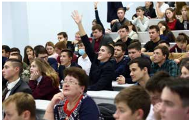
Лекция увлекает, когда речь идёт о перспективах автомобилестроения