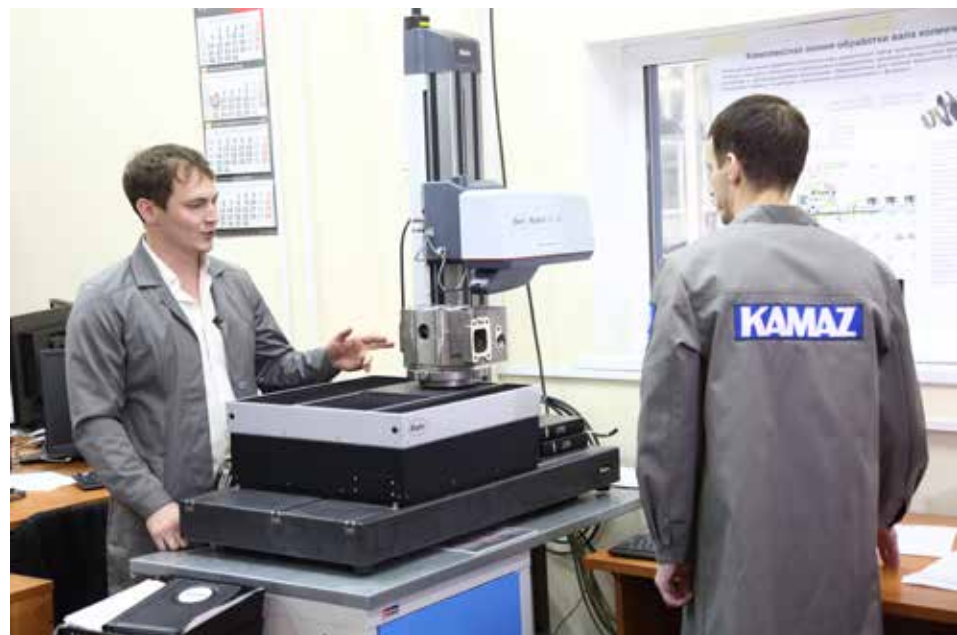
Насколько гладко обработаны поверхности головки блока цилиндров, проверит контурграф

Интересно, что на всю высокоточную измерительную лабораторию требуется только один оператор. Всё производство выстраивается по принципу статистического контроля (SPC). Это означает, что анализируя тенденцию изменения процесса, можно будет не только выявить брак, но и своевременно его предупредить.