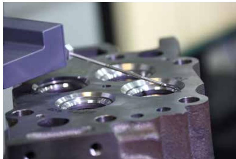
Измерительная машина Mahr единственная на заводе

Контурграф также будет участвовать при проведении приёмки линии механической обработки ГБЦ, во время которой будут измерены все обработанные детали. Таким образом, будет выявляться анализ соответствия линии требованиям стабиль-