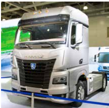
Первый камазовский грузовик поколения K5. Начало есть!