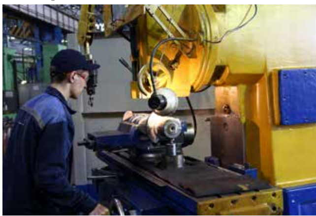
Сделать труд более эффективным — вот основная задача на кузнечном

показатель, как производительность труда. Улучшить его, отметил директор, возможно благодаря качеству