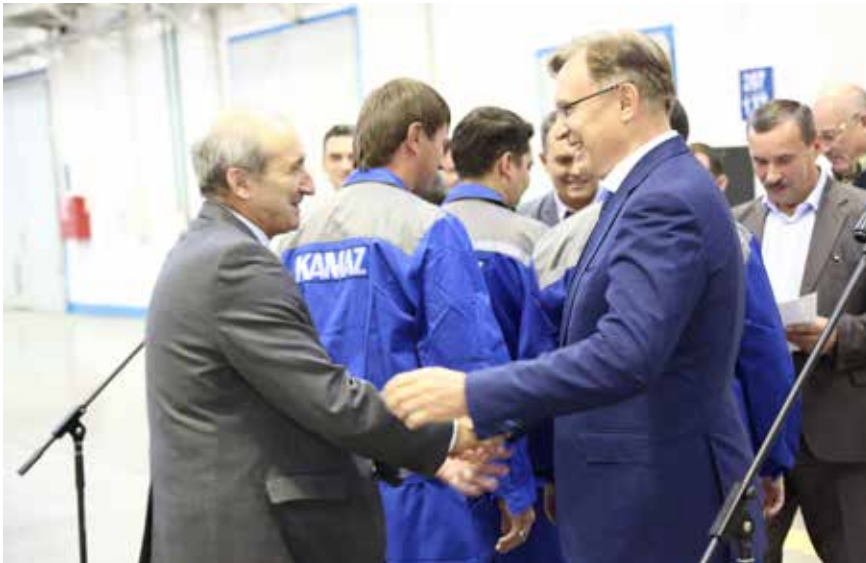
Но тёплые слова были сказаны всем без исключения

кто воплощает конструкторские разработки в железе — работники самого ОПП, группа обеспечения и представители партнёрских фирм.