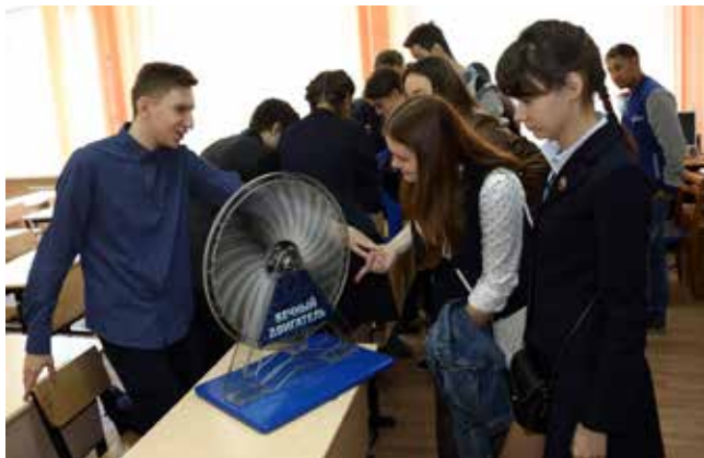
Неужели и впрямь вечный?