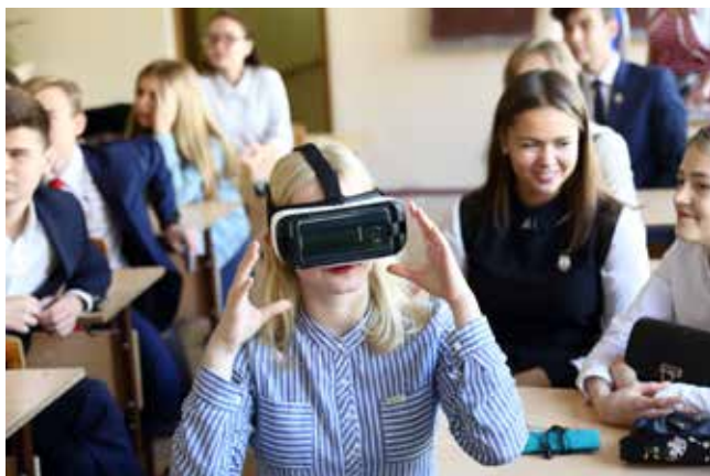
Что там, в виртуальной реальности?