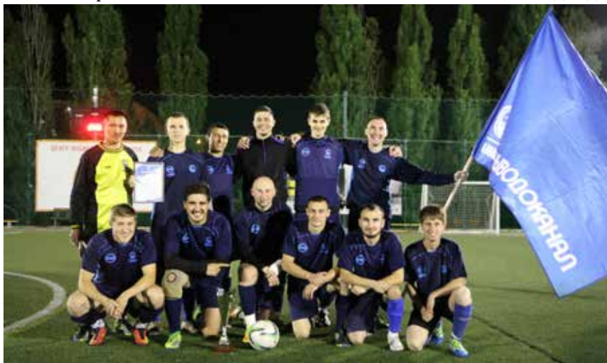
«ЧВК» — команда-победитель-2017