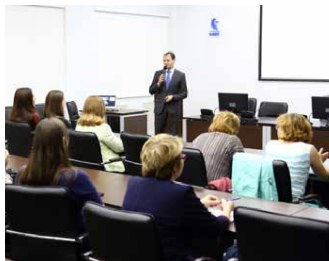
Курсы повышения информированности начали с выступления самых осведомлённых — пресс-службы

Учебный год для камазовцев продлится до следующего сентября. К выступлениям готовятся топ-менеджеры компании и руководители подразделений. Всего запланировано 24 лекции.