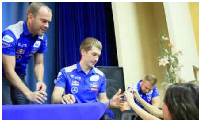
Пилотов долго не отпускали — каждому нужен автограф на память