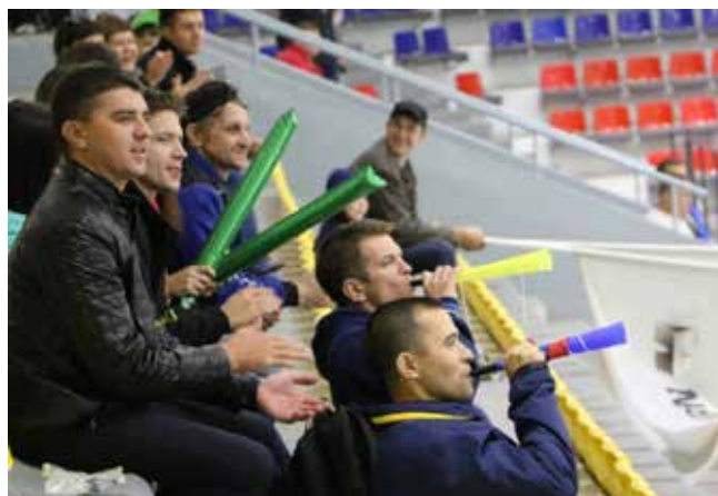
При такой поддержке показать плохую игру было просто невозможно!