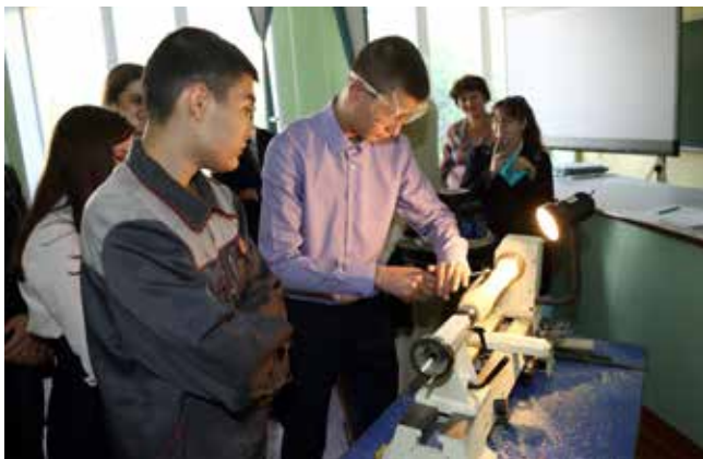
Учимся работать на деревообрабатывающем станке

Для того, чтобы получить достойное образование, не обязательно ехать в Петербург и Москву, тратить большие деньги на проживание в чужом городе, можно и в Набережных Челнах полу-