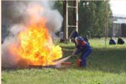
При тушении огня счёт идёт на секунды

Соревновались в скорости и ловкости семь команд. Желая победить, они ловко преодолевали барьер в виде стены, тушили очаг возгорания,