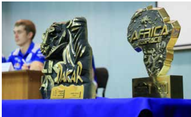
Награды 2017 года с трёх континентов