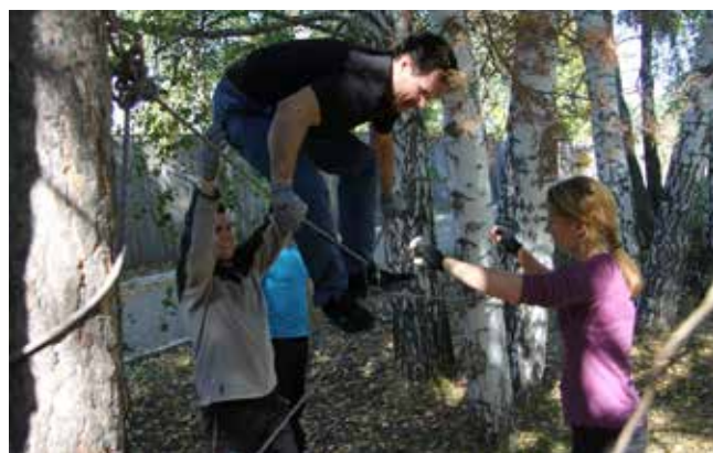
Сила, ловкость — всё при нас