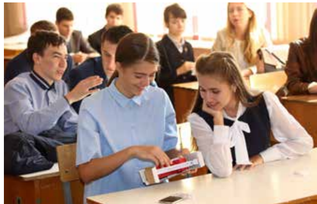
Покажи-ка КАМАЗ в миниатюре

Стоит отметить, что все школьники готовились к этому дню, рисовали, мастерили поделки. Каждого участника творческого конкурса наградили грамотой, а победители, к большой их радости, получили ещё и ценные подарки.