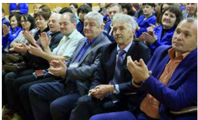
На ПРЗ пристально следят за успехами гонщиков