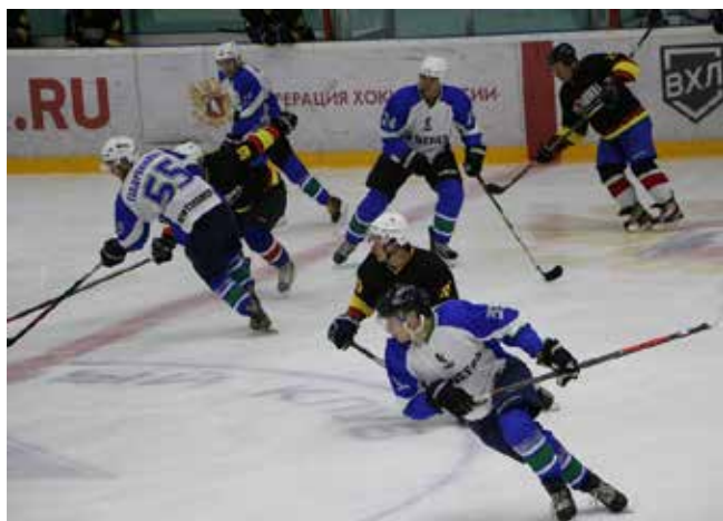
Страсти на льду кипят нешуточные

команды. Матч получился жёстким и нервным. Многие болельщики к концу игры даже охрипли, но это того стоило! Счёт в первом периоде открыли камазовцы, во втором шайбу снова доставали из ворот хозяев турнира. Исход встречи решили последние 20 минут, а третья шайба в воротах «НЕФАЗа» дала понять, что «Профсоюз КАМАЗа» не только выиграл, но сделал это всухую — 3:0. Так что теперь титул и кубок на какое-то время переезжают в Набережные Челны.