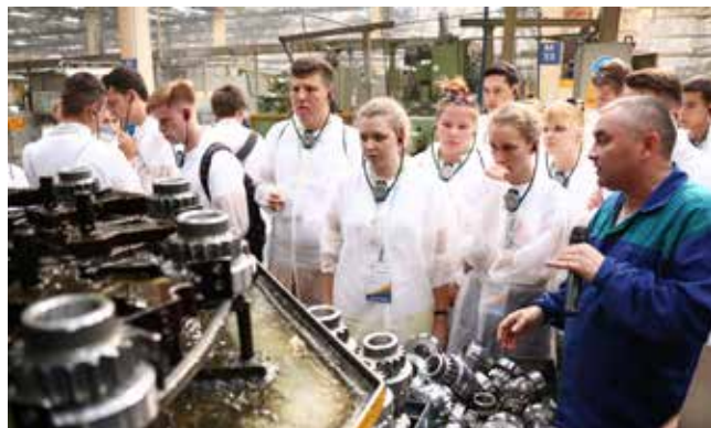
Чтобы создать идеальный участок на бумаге, нужно познакомиться с реальным на заводе двигателей

Форум «PROFдвижение» закончился накануне нового учебного года, а 200 участников до сих пор не могут остановиться. В социальных сетях продолжается обмен впечатлениями, фотографиями, видео. Благодарности за открытый мир интересных и полезных знаний сыплются из всех городов России. «Вести КАМАЗа» пригляделись и к итогам форума и его победителям.