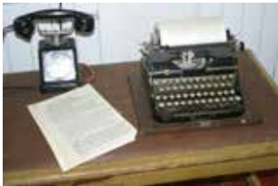
Любой предмет, отражающий эпоху, станет достойным музейным экспонатом

График работы операционного зала инспекции для физических лиц: Понедельник — пятница — с 8 до 17 часов. Вторник и четверг — с 8 до 19 часов. Суббота (вторая и четвертая неделя месяца) — с 10 до 15 часов.