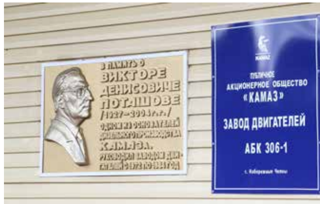
Имена КАМАЗа должны звучать на весь город, а не только у заводских проходных

В канун своего 50-летия «КАМАЗ» объявляет акцию «Имя КАМАЗ». Именно личности творят историю. В новой рубрике мы вспомним и расскажем о тех, кого назы-