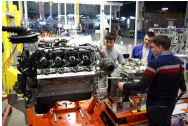
Всего в проекте по созданию двигателей Р6 будут работать 111 человек

По словам руководителя, через месяц-полтора на этой линии всё заработает, как единый организм, будут изготовлены первые опытные детали. Что ж, поживём — увидим.