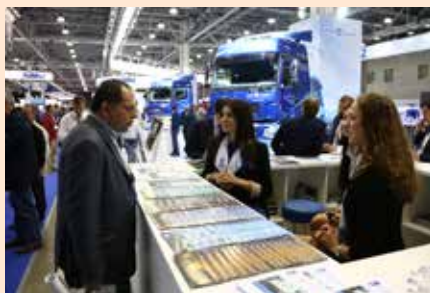
Предложения «КАМАЗа» интересны посетителям выставки

Новая программа может быть совмещена с уже действующей акцией «Царское предложение», по условиям которой при покупке самосвалов на шасси КАМАЗ основного и нового модельного ряда лизинг рассчитывается по сниженной ставке — минус 2%. Программа «Царское предложение» продлится до 31 октября 2017 года.