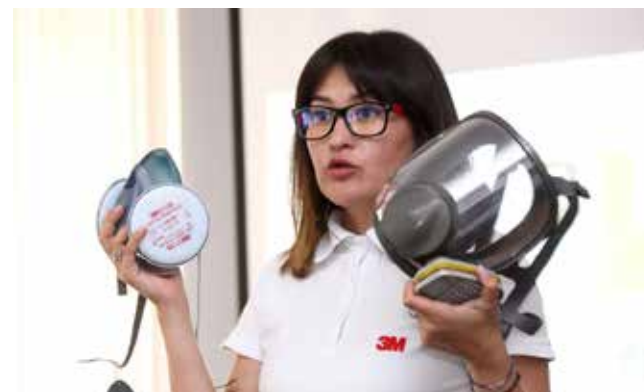
Специалисты «3М» оставили для испытания в условиях производства очки и респираторы

Представители фирмы-производителя также обратили внимание на правильное хранение СИЗ. Так, респираторы во время регламентированных перерывов