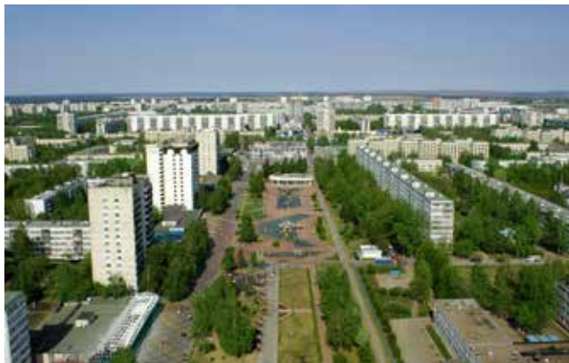
В Набережных Челнах 406 улиц, переулков, бульваров, проездов и проспектов