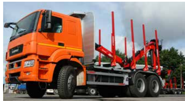
Крюковой погрузчик на камазовском шасси — техника надёжная

числе — в условиях высокой нагрузки и с учётом российского климата.