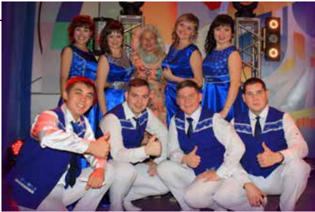
Камазовские артисты несколько лет привозили с фестиваля первые места и даже становились обладателями гран-при

валю пройдёт 6-7 октября в Набережных Челнах в ДК «КАМАЗа», а финал — 15-16 ноября в Казани в концертном зале Поволжской академии физической культуры, спорта и туризма. Завершится «Наше вре-