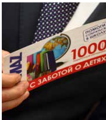
Канцтовары для школьника — вещи первой необходимости

Подарки от автогиганта в этом году получили 8109 детей, из них 1262 — камазята. При этом если сертификат для горожан рассчитан на 500 рублей, то для своих сумма в два раза выше — 1000 рублей, а благодаря корпоративной программе лояльности, в которой участвует ООО «Нико», на него можно приобрести товаров на 1176 рублей.