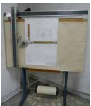
Кульман, на котором конструкторы «КАМАЗа» создавали чертежи будущих автомобилей