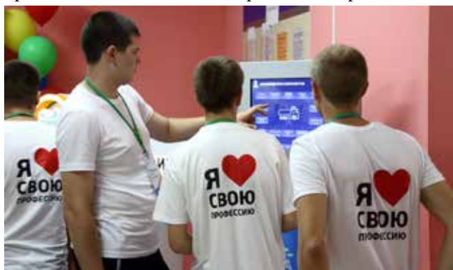
Информат пополнит знания о «КАМАЗе»

ценные призы и сертификаты на преимущественное право трудоустройства на «КАМАЗ». Ребята смогут обратиться в заводской отдел кадров через три или пять лет. Когда вместе с документами об образовании они протянут специалистам службы персонала свои награды, те сразу поймут — к ним пришли устраиваться на работу лучшие участники «PROFдвижения».