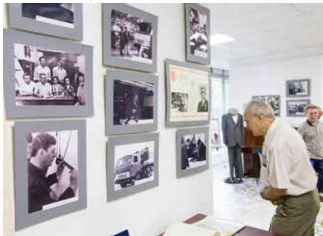
Выставка привлечёт представителей всех поколений

Первый совместный проект «КАМАЗа» и города воплощён в жизнь 10 августа. В большом зале картинной галереи открылась выставка под названием «Город машиностроителей. Начало. 1969–1976». Действовать она будет до конца сентября, обязательно сходите. А пока полюбуемся некоторыми её экспонатами.