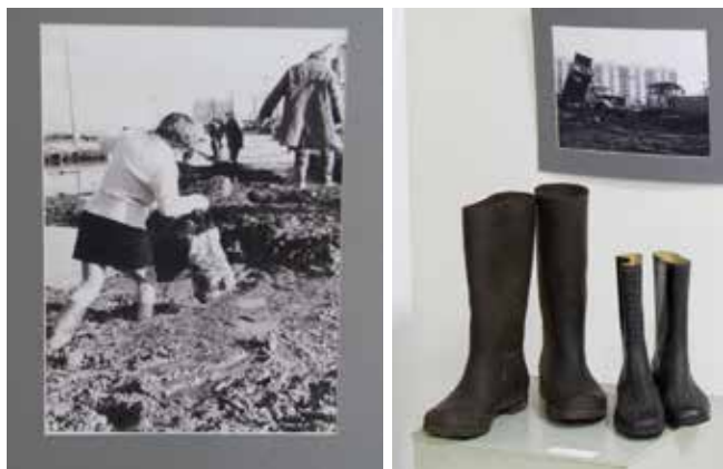
Резиновые сапоги — предмет первой необходимости приехавших на стройку