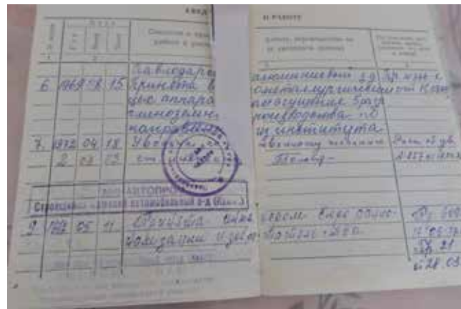
Трудовая книжка «без гнева и пристрастия» зафиксировала событие 45-летней давности

шить ситуацию, расшить узкое место. По сей день сожалею, что первую заявку Горелова не удалось отстоять. Правда, чуть позже я узнала «волшебное слово» — экономический эффект. Его предложения такой эффект давали. И документы стали проходить.