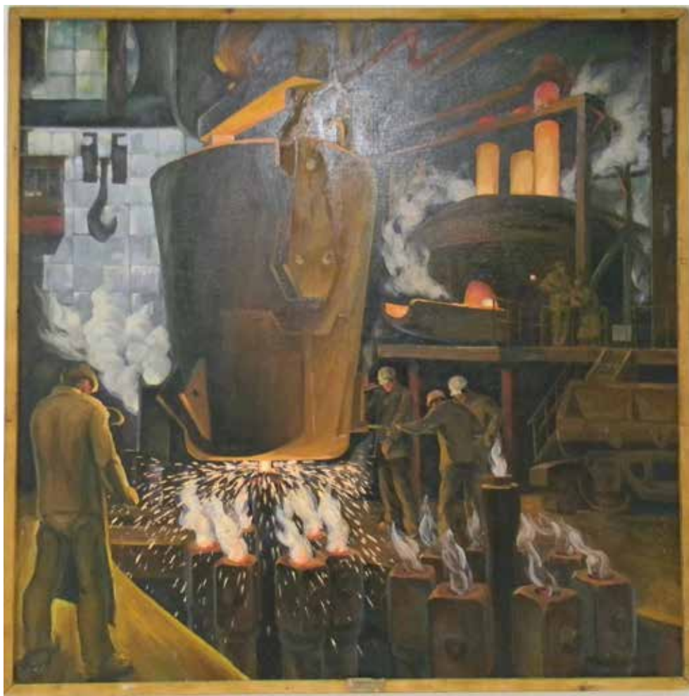
Литейное производство вдохновило О.Г. Комракова на создание картины «Разлив стали»