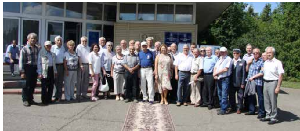
Митинг — хороший повод собраться вместе