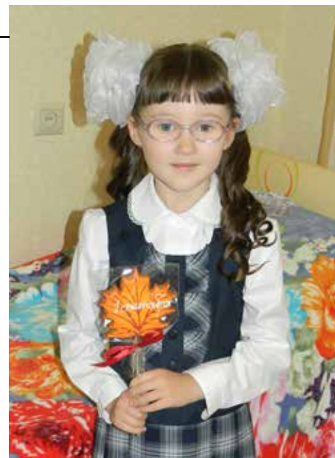
Правильно экипированный ребёнок в учёбе будет успешнее

Таким образом, из семейного бюджета на сбор ребёнка в школу было потрачено 11290 рублей. На комплект для мальчика, думаю, уйдёт приблизительно столько же. Добавим ко всему вышеперечисленному стоимость канцелярских товаров, рабочих тетрадей, бантиков, цветов учителю и т.д. — получается ещё более внушительная сумма. Очень легко она достигнет 15000 рублей. Итог солидный, поэтому не забывайте: сэкономить поможет корпоративная программа лояльности и карта члена профсоюза. Полный список магазинов и размер скидки ищите в КИС «Комета» и на сайте профсоюза.