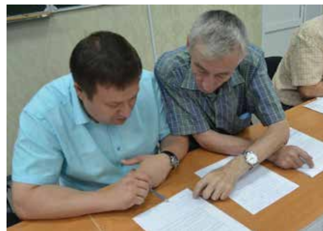
Жюри за работой

Но вот время истекло. Разбирая работы, члены