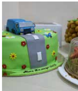
Кулинарные творения участниц конкурса

не только внешние данные конкурсанток, но и артистизм, умение держать себя на сцене, вокальные и хореографические таланты. И тут девушки не подвели: были визитки, выполненные с помощью 3D-графики, звучали стихи, иностранная речь и даже песни на китайском языке. В общем, потенциальные мисс дали понять, что на «КАМАЗе» работают не просто красавицы и спортсменки, а очень даже одарённые и талантливые девушки. Они не только поют и танцуют, вяжут или мастерят поделки, но и удивительно готовят. Необыкновенный торт, украшенный кондитерским КАМАЗом, как и