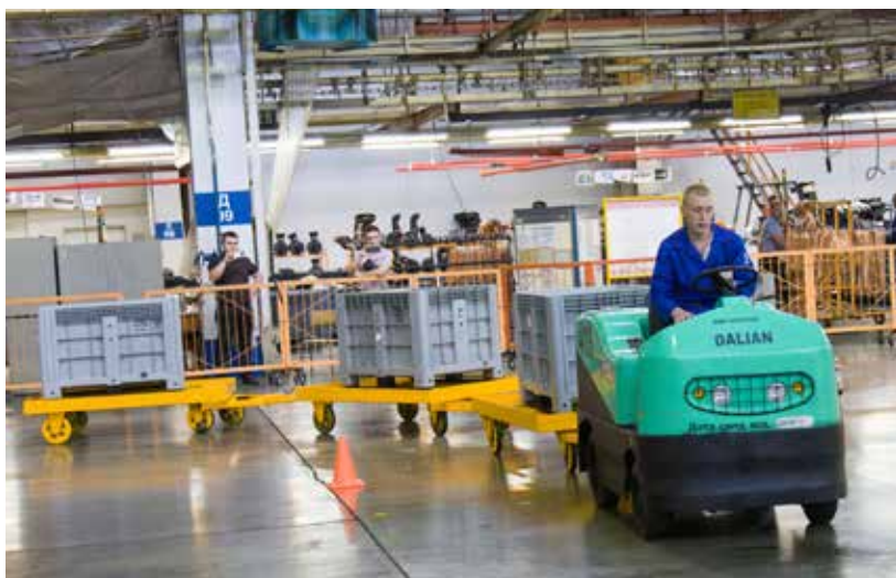
Выполнить «змейку» на тягаче с тремя прицепами, не сбив ни одной стойки, может только профи