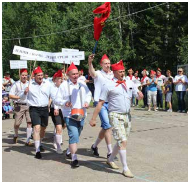
Кто шагает дружно в ряд?