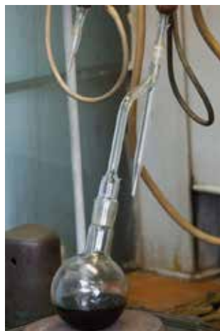
Проверка температуры закалочного масла

вспышки масла. Это очень интересные процессы. В общем, одних только масляных анализов здесь делают около 50 в неделю. Уже после закалки все детали двигателя проходят процесс мойки. И тут лаборантам химической группы тоже работы хватает. Они проверяют концентрацию моющего раствора, в котором содержание лабонида должно быть в пределах нормы, внося свою лепту не только в качество, но и в чистоту изделия, чтобы «сердце» КАМАЗа работало как часы.