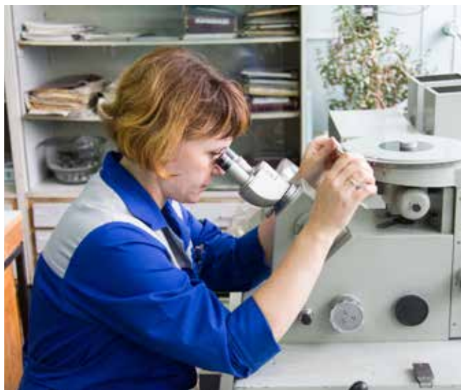
Лаборанты под микроскопом исследуют структуру металла

Увлечённая своим делом женщина уже 37 лет на посту. Говорит, что на первый взгляд её работа кажется однообразной, но на самом деле каждый день удаётся открыть для себя что-то новое: «А вы видели, Анна, когда-нибудь структуру металла под микроскопом? Посмотрите, какая красота!» — восторгается шеф лаборатории, перелистывая файлы на компьютере и показывая печатные фотографии минувших лет. И вправду, удивительные кадры, чем-то напоминающие снимки из космоса.