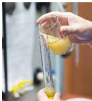
Определение концентрации лабонида в моющем растворе

А ещё работники химической группы ежедневно проверяют качество закалочного масла: на содержание воды (которой, конечно, в нём быть не должно); на кинематическую вязкость — если она завышена, детали не получают нужных свойств; определяют температуру