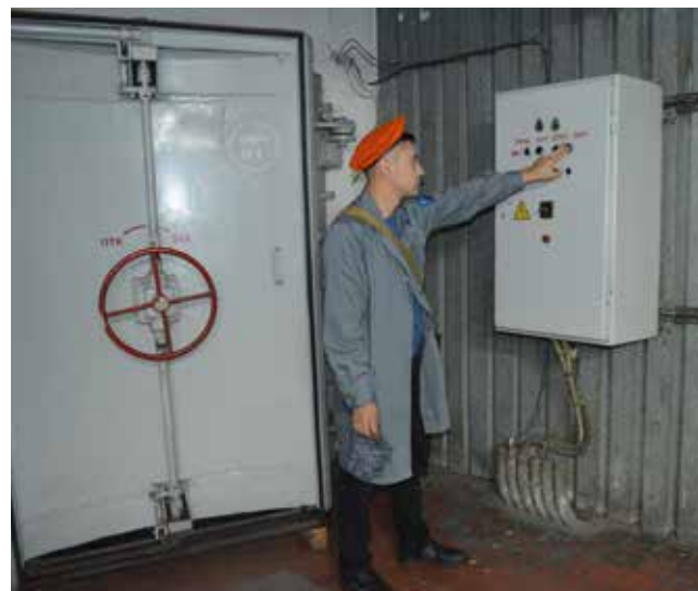
Укрытие готово к приёму людей в случае нештатной ситуации

Победа стала для кузнецов путёвкой на участие в республиканском соревновании. Сегодня на заводе полным ходом идёт подготовка зданий и сооружений уже к финальному этапу: 1 августа кузницу посетят специалисты из МЧС РТ и Министерства строительства, входящие в состав жюри. Им предстоит выставить свои баллы в конкурсном оценочном листе. Окончательные же итоги республиканского смотра-конкурса будут оглашены осенью.