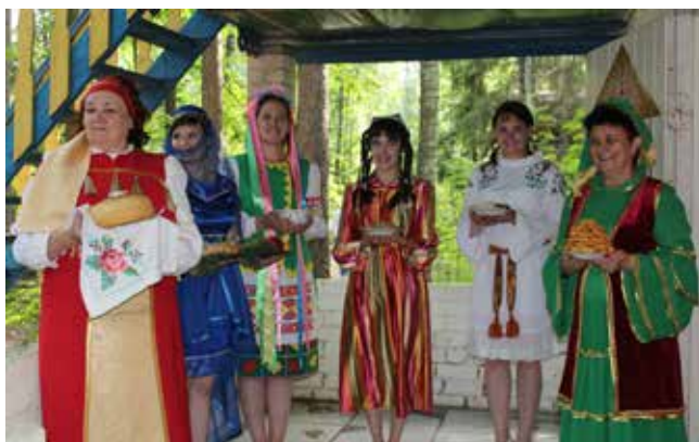
Хлеб-соль от республик СССР