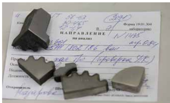
Всё как у людей: детали получают направления на анализ...