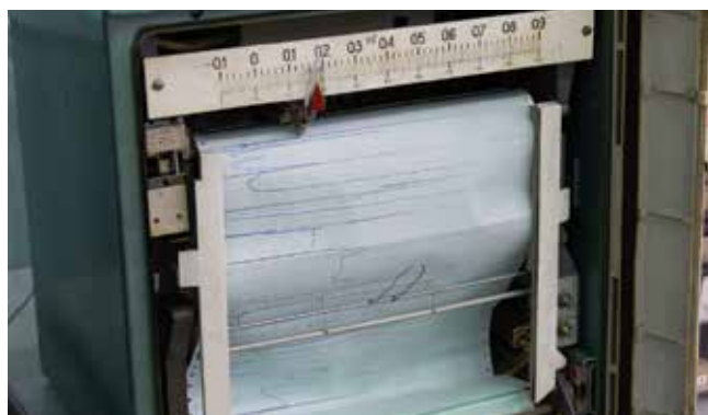
...а результат замера печной атмосферы схож с кривой электрокардиограммы