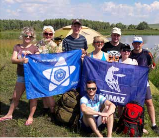
День, которого ждали

на. Предварительный диагноз — сотрясение головного мозга, перелом лобной кости. Расследованием несчастного случая занимаются специально созданная комиссия охраны труда и представители Госавтоинспекции.