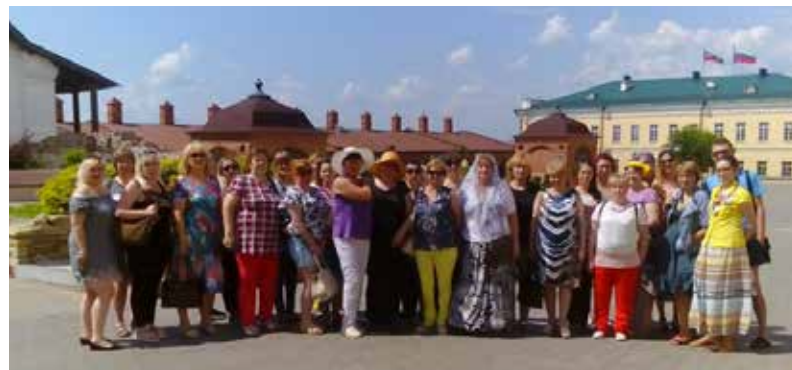
Кузнецы и логисты не встретились только потому, что мест в Казани, которые хочется посетить, предостаточно

профком. Обзорная экскурсия по городу, пешие прогулки с осмотром зданий,