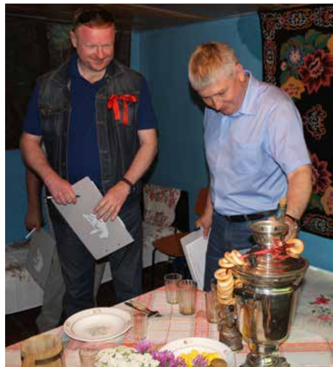
Директора двух заводов тоже оценили советский уют