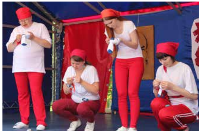
Как и положено советской девушке, каждая была «спортсменка, комсомолка и просто красавица»