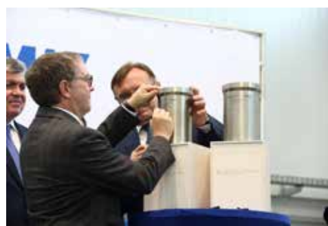
Автографы на память

директор Federal-Mogul Powertrain Райнер Юкшток. — Мы открывали литейное производство в разных странах, и площадка в Набережных Челнах соответствует самым современным требованиям. Развитию предприятия способствовал инвестиционный климат и возможности получения сырья от местных поставщиков. Я надеюсь, мы произведём здесь миллионы тонн продукции, которая будет поставляться различным компаниям по всему миру.