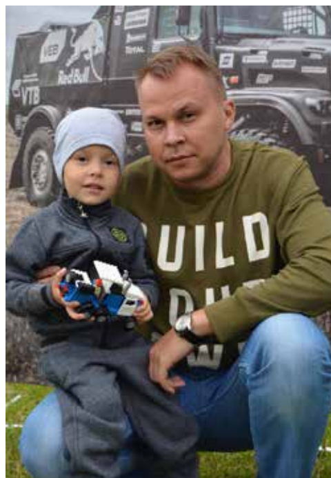
«Я лениться не привык, собрал с папой грузовик»

В целом праздник получился очень позитивным. Несмотря на название, он объединил и молодых, и пожилых, и совсем юных жителей нашего города. Они танцевали, пели, играли в футбол, шахматы, демонстрировали на спортивной площадке свою физическую подготовку — сдавали нормы ГТО, разбирали и собирали автоматы... Одним словом, делали всё, что молодой душе угодно. Завершился этот приятный день зрелищным салютом.