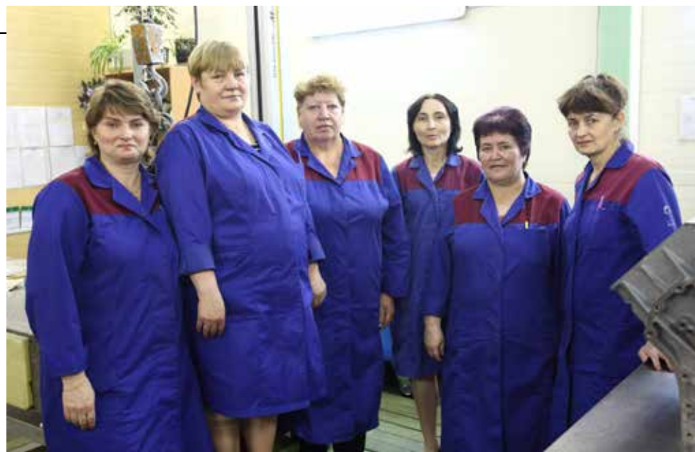
Женская бригада — средоточие дисциплины и трудолюбия

отверстиях. В результате многочисленных проверок на соответствие всем параметрам выносится вердикт: годная деталь получает порядковый номер, упаковывается в специальную тару и отправляется на ГСК, а та,