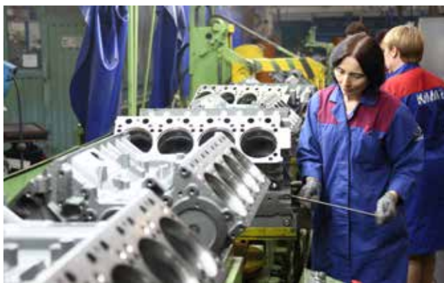
Протяжённость автоматической линии «Ингерсол» 600 метров. На последней, седьмой нитке проводятся контрольные проверки, после которых блоки цилиндров отправятся на ГСК

Прежде чем попасть на главный сборочный конвейер, все блоки цилиндров двигателя проходят через автоматическую линию «Ингерсол» протяжённостью 600 метров. На последней, седьмой нитке этой линии, деталь проходит контрольную операцию, где контролёр визуально осматривает блоки на наличие литейных дефектов и полноту выполнения операций согласно техпроцессу механической обработки. Мы застаём контролёров в тот момент, когда с помощью оправок (специальных трубок с магнитным наконечником) они проверяют наличие стружки в маслоканалах и резьбовых