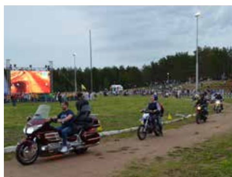
Мотошоу — громко, пыльно, потрясающе!

внесла и погода. Перед концертом заметно похолодало, пошёл дождь, поэтому певица предпочла остаться в тёплом комплекте одежды. С большим восторгом челнинцы приняли известную песню Ёлки «Прованс».