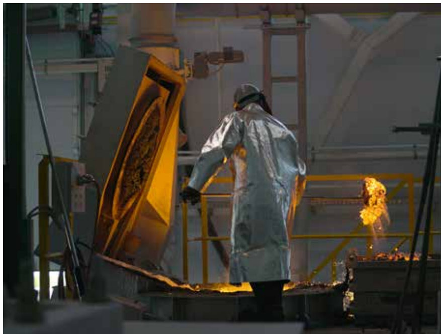
Рабочие места в цехе литья оборудованы по последнему слову техники