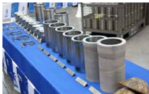
На выставке продукции отражена вся технологическая цепочка: от передельного чугуна до гильз цилиндров, поршней и поршневых колец

В честь праздника гости могли ознакомиться как с новыми технологиями, так и с продукцией предприятия. После экскурсии руководители пытались сохранить невозмутимые лица, удивление выдавали лишь глаза — литейное производство было