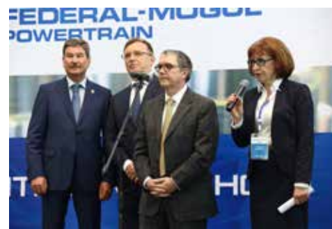
Расширение завода в Набережных Челнах свидетельствует о долгосрочных намерениях партнёров

— Для меня открытие литейного производства — знак доверия между компаниями Federal-Mogul и «КАМАЗ». Решение о строительстве и открытии было принято в самое тяжёлое для автомобильной промышленности время, но мы продолжаем развивать наше сотрудничество. Новый шаг — открытие литейного производ-