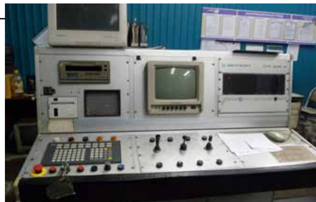
Так рентгенотелевизионная установка выглядела в ПЦЛ на протяжении 22 лет

После сложного процесса подбора мониторов рентгенотелевизионную установку удалось модернизировать. Вместо маленьких экранов на ней появились качественные широкоформатные мониторы, а также возможность цифровой записи изображе-