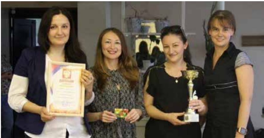
В теме экологии девушки из «Ультрафиолета» лучшие

В итоге победителем брейн-ринга стала команда отдела реализации «Ультрафиолет» — постоянный участник камазовских и городских интеллектуальных игр. За их хрупкими плечами — уже немалый опыт результативных игр. Девушки под аплодисменты всех участников унесли с собой переходящий кубок брейн-ринга. Второе место заняла команда аппарата управления. На третьем месте — команда информационной службы.