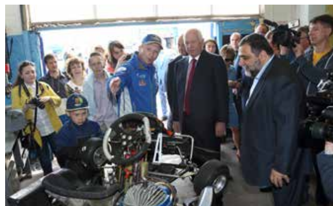
В мастерских есть что показать

Дух захватывает от выражений юных бесстрашных гонщиков. Которых, конечно же, страхуют опытные наставники.