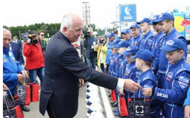
Подарки юным картингистам от главы Ростеха