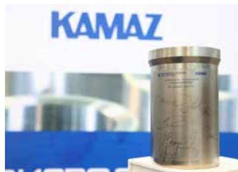
Гильза из первой партии — символ взаимовыгодного сотрудничества и развития

— Расширение завода в Набережных Челнах свидетельствует о наших долгосрочных намерениях, — заявил генеральный