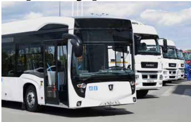
Образцы новой камазовской техники — достойная демонстрация результатов работы

возможность пройти новыми маршрутами. О самых интересных, на наш взгляд, моментах этого наполненного событиями дня, — устами и глазами наших корреспондентов.