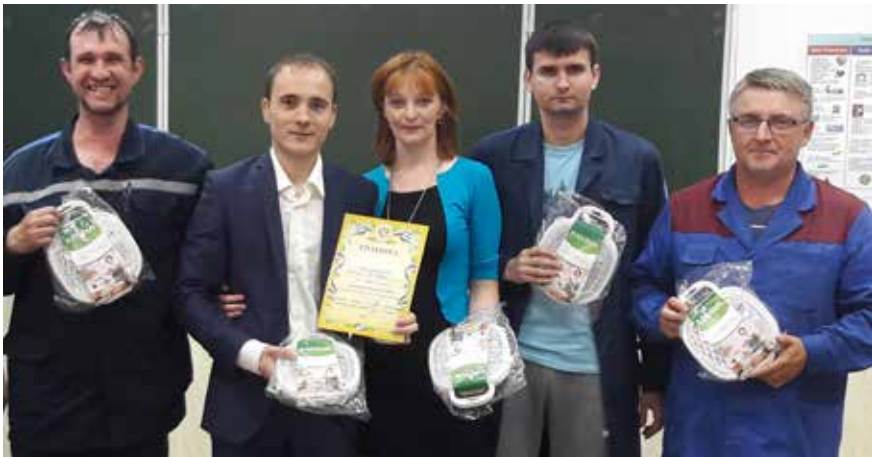
Команда «Пучок» — это сочетание эрудиции, логики и юмора

Час интеллектуальной разминки оживил участников, добавив настроения и обогатив каждую «коробочку» новыми знаниями.