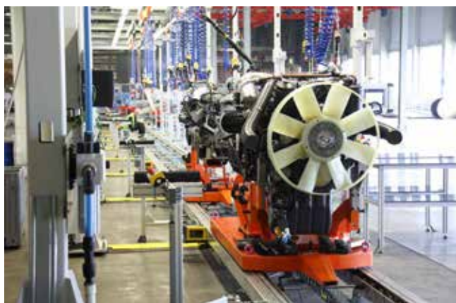
Мощность новой линии — 12 тыс. моторов в год