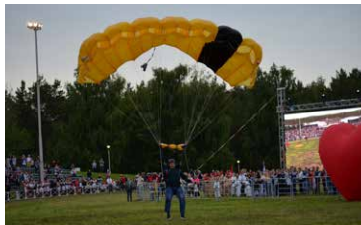
Интерактивную площадку организовала молодёжь «КАМАЗа»

Надоело разрисовывать стены? Вот вам камазовская cabina!