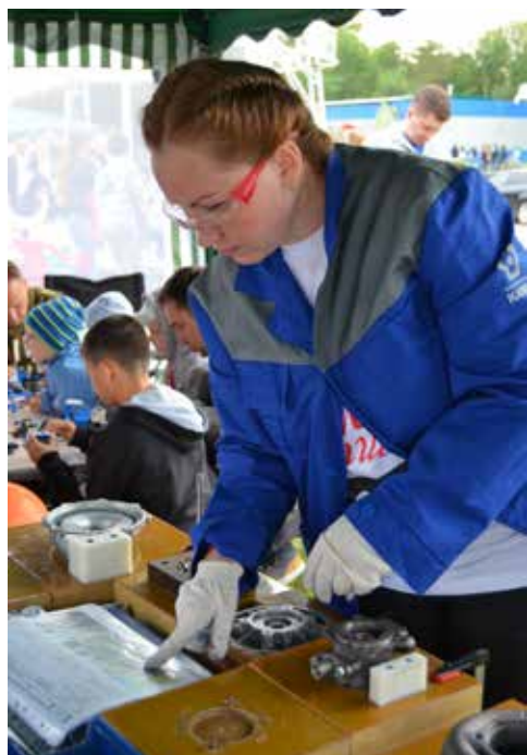
Профессией слесаря МСР интересовались даже девушки

А дальше в вечернем меню была Ёлка. Она вышла на сцену с песней «Город обманов» — в черном костюме, с собранными в хвост волосами, в ярко-красной помаде и красных кроссовках. Певица призналась, что привезла туфли, но не вышла в них, чтобы быть ближе к молодёжи — прыгать и бегать по сцене: «Не волнуйтесь о том, что о вас думают другие, особенно если в этот момент вы счастливы», — сказала она. Однако свою лепту в праздничный наряд певицы