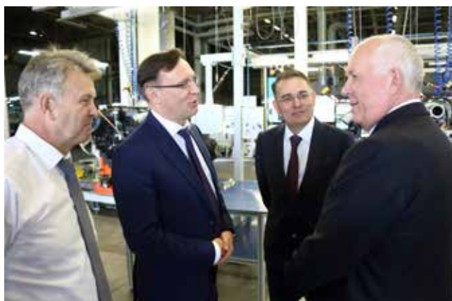
Вопросы Чemezova камазовским руководителям сугубо по существу