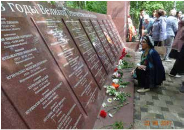
Цветы — победителям

также пришедшие в этот день почтить память бойцов. Вместе с камазовцами они обещали помнить о подвиге, совершённом в годы Великой Отечественной войны.