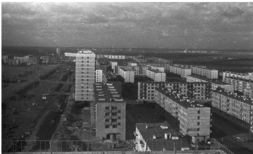
И вот уже мы видим город, где строится завод «КАМАЗ»

комплексов. Виктор Забровский снимал кадр за кадром на чёрно-белую плёнку (цветная тогда ещё была редкостью) в надежде, что пригодится. И пригодилось. Люблюемся!