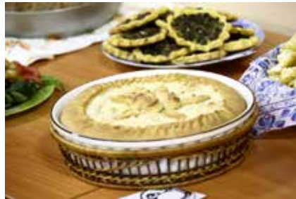
Шедевры конкурса национальных блюд