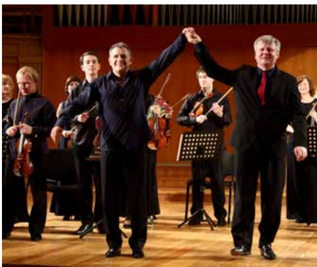
Роману Перуцки — аплодисменты

На закрытие своего 12-го концертного сезона Органный зал пригласил 16 июня польского музыканта Романа Перуцки. Это уже второй визит главного органиста Гданьской филармонии в Челны. Днём раньше артистам аплодировал Большой зал Казанской консерватории.