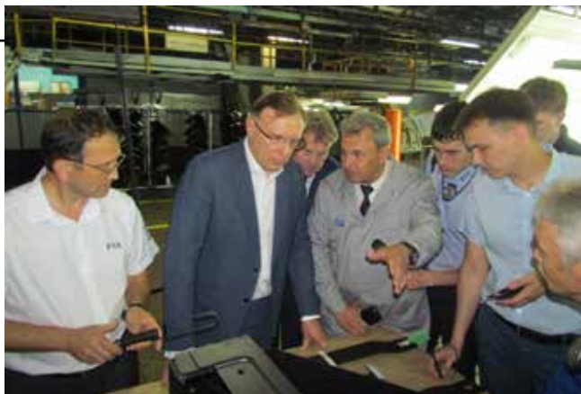
Многое сделано на заводе для мониторинга толщины слоя лакокрасочного покрытия. Испытания на стойкость проводятся в соляном тумане

Дефектам, выявляемым с помощью инспекционного контроля (непрокрасам, нарушениям ЛКП), пересортице и прочим здесь объявили нешуточную войну. Жетоны, идентифицирующие исполнителя, изменение схемы