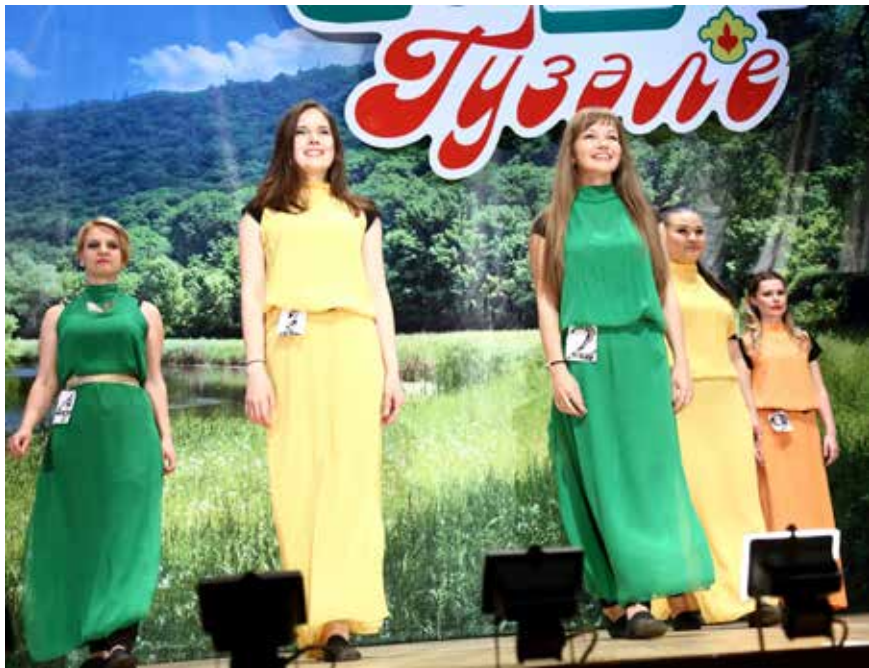
Вот такие красавицы работают на ПРЗ!