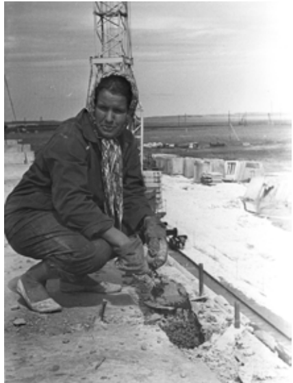
Женщины на строительстве не боялись никакой работы...