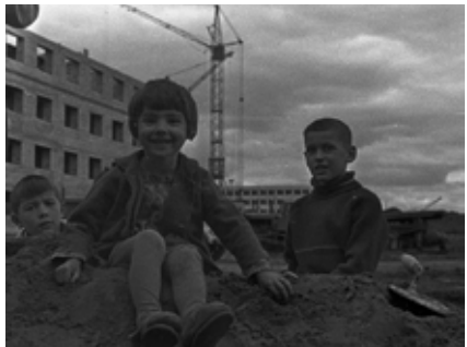
...а дети — никакой грязи. И выглядели вполне счастливыми!