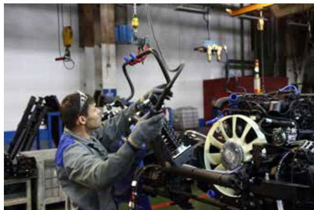
Заднюю пневмоподвеску кабины теперь устанавливают с помощью кран-балки