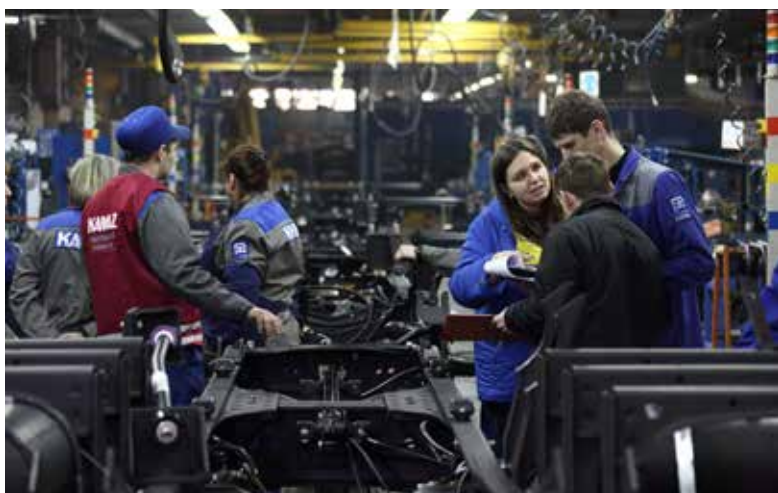
«КАМАЗ» готов принять работников дефицитных специальностей

Вопрос читателя: хочет человек из комплектовщиков, скажем, перейти фрезеровщиком. Каков механизм? — Во-первых, должна быть вакансия. Только тогда, пройдя специальную переподготовку, получив удостоверение на право работы в новом качестве, можно заступать на новое место.