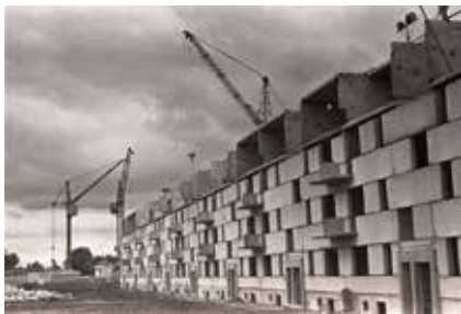
Строительство домов для челнинцев

Чтобы объять необъятное, москвичи вставали рано утром и работали до позднего вечера. Они с восхищением разглядывали первые монтажные конструкции первенца «КАМАЗа» РИЗа, сложные работы нулевых циклов на других площадках, строительство жилых