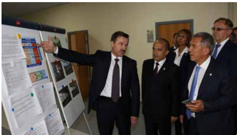
Программы обучения студентов одобрены на высшем уровне