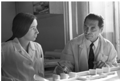
Над макетом будущего города на Каме скрупулёзно работают архитекторы

комплексов. Виктор Забровский снимал кадр за кадром на чёрно-белую плёнку (цветная тогда ещё была редкостью) в надежде, что пригодится. И пригодилось. Люблюемся!