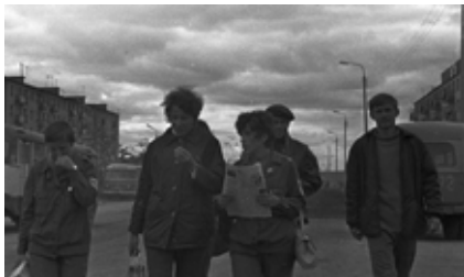
Смена закончилась, а впереди летний вечер: и поужинать успеешь, и газету почитать, и на танцы сходить