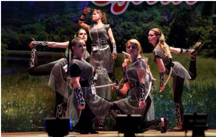
В образе болгарских воительниц девушки были очень убедительны