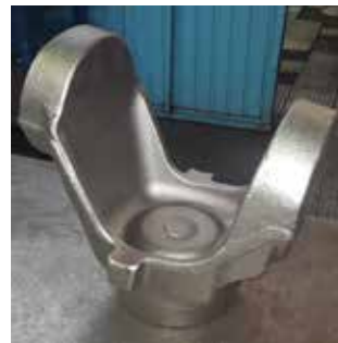
Сложность поковки в том, что она несимметричная и очень габаритная