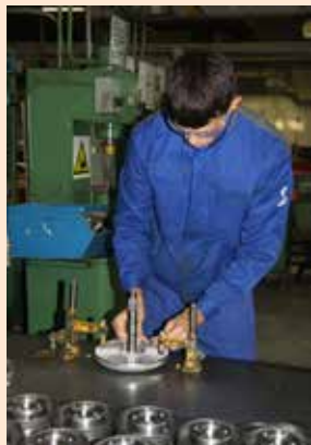
Конкурс — это возможность показать себя как профессионала

Такие заводские конкурсы помогают участникам оценить и показать свои силы и знания, выиграть ценные призы, а также повысить разряд или категорию.