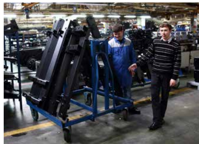
Специальные тележки позволяют сохранить лакокрасочное покрытие

— Эти приспособления избавили нас от ещё одной проблемы — перетаривания на всех этапах подготовки производства, — поясняет