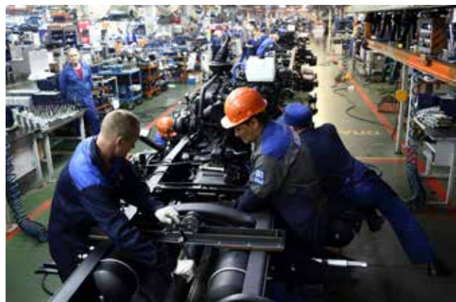
Захват с лебёдкой уменьшил время установки карданного вала

Подгруппе рано подводить итоги, но даже с привычного места сбора видно — ход конвейера выровнялся, а тяжёлых видов работ у слесарей бригады стало меньше.