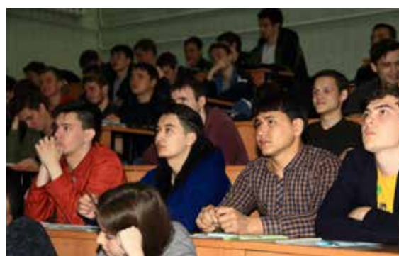
Заказ на работников в первую очередь размещаем в челинских вузах, а также в техникумах, колледжах

— Потому что там говорят о том, что цепляет. О транспортной карте, например: республиканский проект, провайдером которого выступает АО «Социальная карта», к сожалению, затормозился, потому что пока нет терминала, где можно было бы пополнять баланс. Работаем с ними и с банками-партнёрами — Сбербанком, ВТБ, возможно, в августе сможем сделать такую опцию через приложение. Карта не панацея, конечно, просто безмонетарный