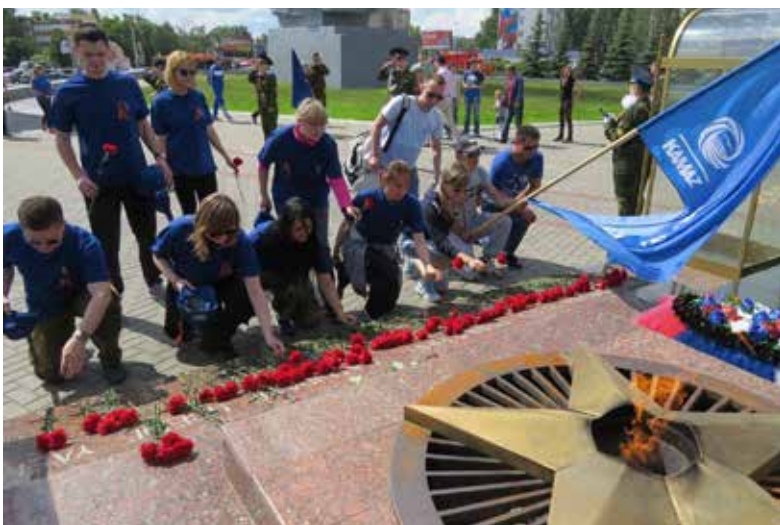
По традиции, открытие слёта состоялось у мемориала «Родина-мать»

набравшая 78 баллов, второе — «Домкор Индустрия» с 72 баллами. Замкнула тройку лидеров команда литейного завода, набравшая всего на балл меньше — 71.