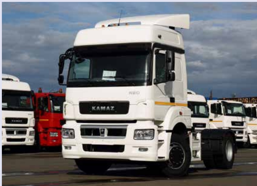
Тягачи к отправке готовы

Обратная связь с потребителем, особенно — мониторинг в плане поведения новинок в эксплуатации, сегодня важная часть политики ПАО «КАМАЗ». Напомним: 5490 NEO — та модель, при создании которой конструкторы постарались учесть пожелания клиентов «КАМАЗа». В ТФК рассчитывают, что первые отзывы об автомобиле с улучшенными потребительскими свойствами появятся при пробеге в 25-30 тыс. километров. Все предложения будут обобщены и проанализированы — для новых улучшений.