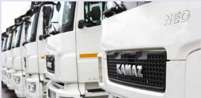
Автомобили со знаком NEO