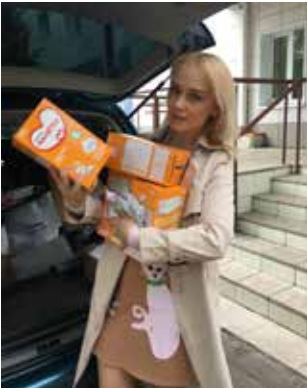
Малышам подарили самое необходимое