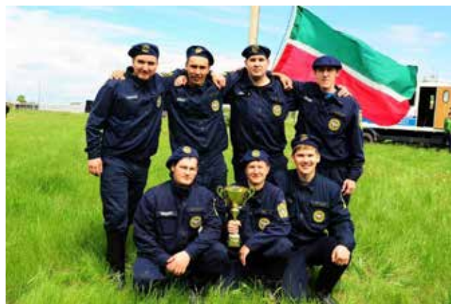
Команда АвЗ — победитель соревнований

После деактивации радиоактивных веществ бойцы закапывают ветошь в землю