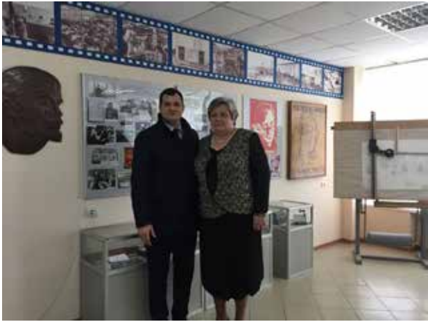
В музее ТМЗ