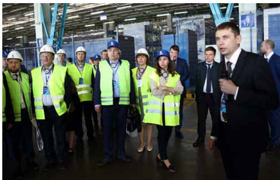
Самая интересная часть конференции — практическая, посещение складов центра закупок, поставщиков и автопроизводства

Более 40 моделей, более 1,5 тыс. модификаций автомобилей КАМАЗ выпускает автомобильный завод. Один час простоя ГСК обходится в 14,5 млн рублей.