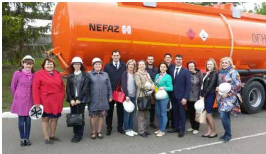
Челнинская делегация визитом довольна

Делегация «КАМАЗа» во главе с заместителями председателя профкома посетила производственные корпуса ПАО «НЕФАЗ» и музей завода. В рам-