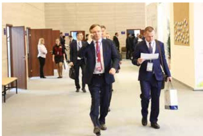
ПМЭФ — это новые возможности сотрудничества

Бизнес-план ПАО «КАМАЗ» 2017 года сейчас пересматривается. Задача, поставленная генеральным директором Сергеем Когогиным, — увеличение продаж на 2-3 тыс. автомобилей, ориентировочно до 38-39 тысяч грузовиков. Однако опыт прошлого года показал, что резко наращивать темп сборки очень тяжело. А раз так, то уже с июля, убеждён Когогин, конвейеру не понадобится никаких дополнительных выходных.