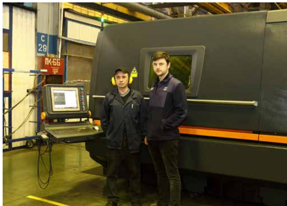
Освоение нового агрегата много времени не потребовало

Теперь на ПРЗ ждут уже другое лазерное оборудование, призванное обеспечить мобильное выполнение задач иного уровня. И это тоже не прихоть: освоение нового продукта требует новых скоростей.