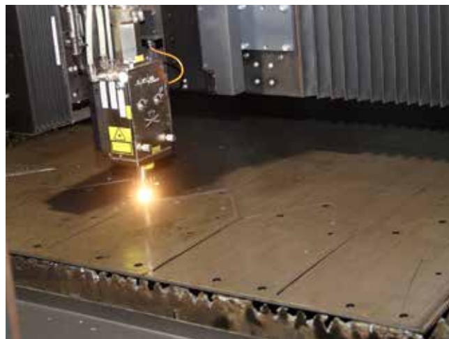
Лазерный луч работает почти круглосуточно