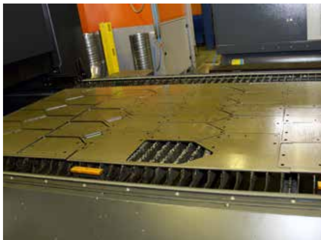
На станке вырезают детали для кабин перспективного модельного ряда