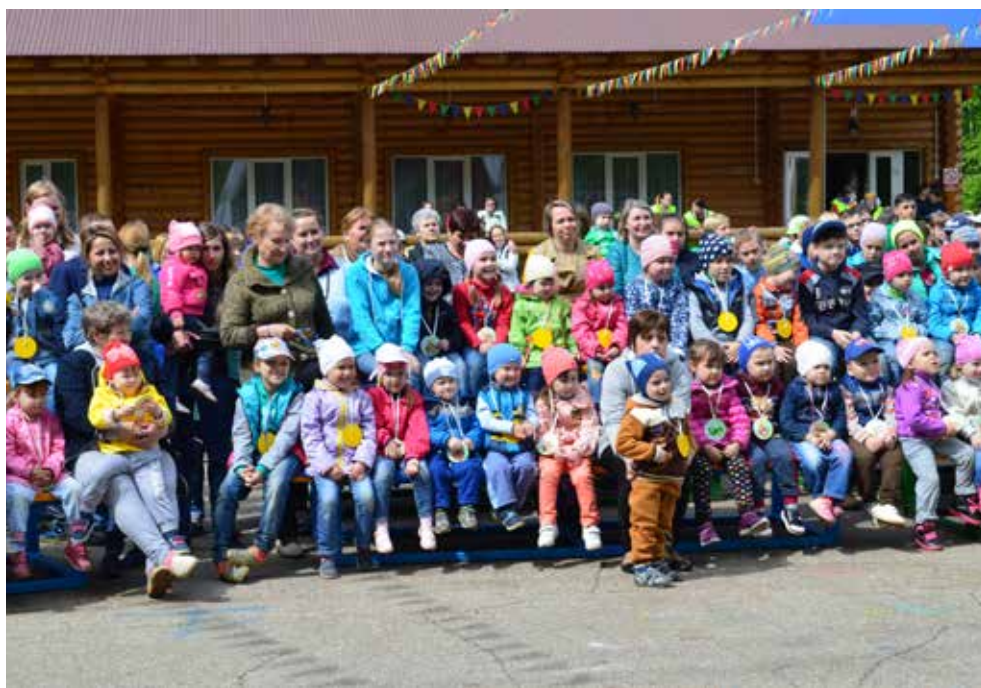
Маленьким гостям в «Литейщике» особенно рады

В удивительное путешествие в страну Насекомую отправились более 300 детей работников кузнечного и литейного заводов. Так профкомы и администрация подразделений «КАМАЗа» организовали добрый праздник, который был приурочен не только к Международному дню защиты детей, но и к Году экологии в России.