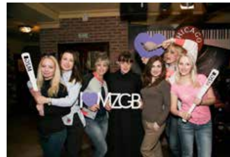
Девушки с кузни не побоялись никакой «МозгоБойни»

Единственная на сегодняшний день в этой игре