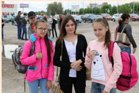
К активному лету готовы!

Навещать детей можно будет по воскресеньям, с 10 до 20 часов.