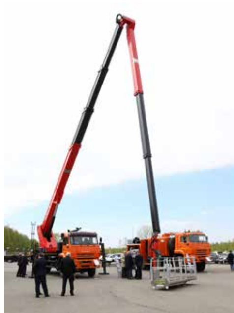
Шагнул на площадку автогидроподъёмника — и уже через пять минут на высоте 51 метр

Кстати, и автогидроподъёмник, и тяжёлый эвакуатор, представленные на презентации, уже нашли своих новых обладателей на одном из горно-обогатительных комбинатов. Также партнёры намерены осваивать в качестве платформ для надстроек и КАМАЗы нового модельного ряда. Эти автомобили уже хорошо зарекомендовали себя у потребителей. Надо быть в тренде.