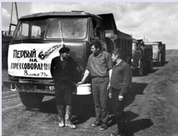
Первый бетон на ПРЗ. Наверняка многие видели фото, запечатлевшее момент доставки первой партии бетона на стройплощадку прессово-рамного завода. Но вот историческая миссия выполнена, и водителям можно просто поговорить