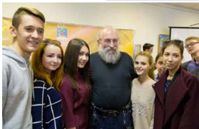
Фотографироваться с почётным гостем — традиция клуба «Интеллект»