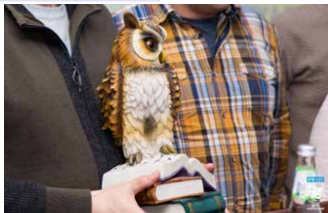
Сову литейщики отдали лучшей команде, но надежда на её возвращение осталась

На память об этой встрече Анатолий Вассерман получил от команд-участниц подарок — вассермантию, сшитую по спецзаказу. Она представляла собой накидку золотого цвета со множеством внутренних карманов. Теперь главный интеллектуал не только умный, но и модный.