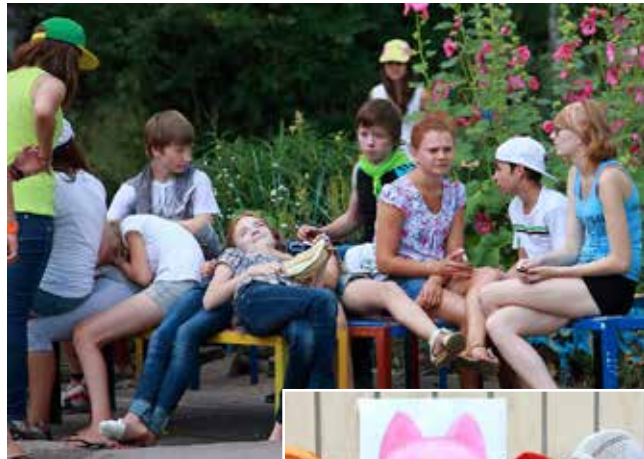
Отдых в лагере — это счастье. Потому что лето, потому что детство...

Между тем на «КАМАЗе» вопросы, кому выделять путёвки, решает комиссия социального страхования. В неё входят представители профкома, администрации. Такая комиссия есть в каждом подразделении. В профсоюзе нам пояснили: «Потребность в путёвках в детские оздоровительные лагеря действительно чуть