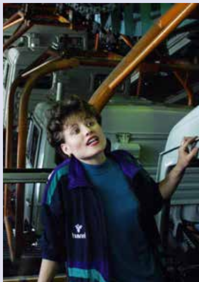
Какие красавицы трудятся на конвейере!