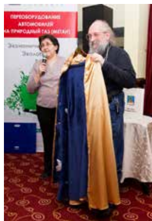
В подарок интеллектуалу — золотая мантия со множеством карманов

27 вопросов по числу команд-участниц. В результате битвы умов победителем чемпионата стала команда «А мы тут так поржать» (ИП Снегирёв) из Лиги работающей молодёжи. Второе место заняла команда «51-я параллель», третье место осталось за прошлогодними чемпионами команды «КамЛит» (обе представляют литейный завод). Команды-призёры получили денежные сертификаты на десять, пять и три тысячи рублей соответственно, а команда-победитель