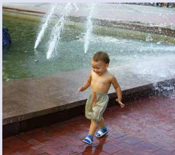
...а так радоваться лету только в детстве