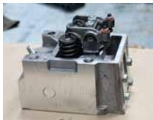
А это уже почти готовый продукт — головка блока цилиндра в сборе

На заводе двигателей в рамках программы «Трансформация качества» проведён восстановительный ремонт автоматической линии Renault. Этот агрегат — дублёр автоматической линии «ЗиО», которая обрабатывает базовые отверстия в головке блока цилиндра на линейке камазовских V-образных двигателей. Из-за физического износа привода поворотного стола оборудование простояло более семи лет. Работавшему всё это время дублёру тоже понадобился ремонт. Поэтому было принято решение о восстановлении Renault. Такой резерв позволит застраховать деталистов от сбоев в работе оборудования.