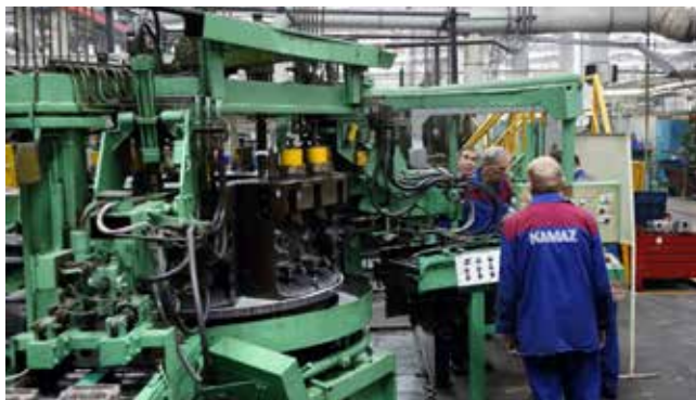
Команда ремонтников из лаборатории технологической точности завода двигателей нашла возможность оживить автоматическую линию Renault. Движение поворотного стола вместо вышедшего из строя электромеханического привода теперь осуществляет гидропривод. Кроме того, в ходе работ были отремонтированы транспортные системы, манипуляторы, узлы агрегата

На автомобильном заводе во время паузы продолжался переоборудование оборудования. На площадку завода запасных частей и компонентов с АвЗ и завода двигателей туда уже