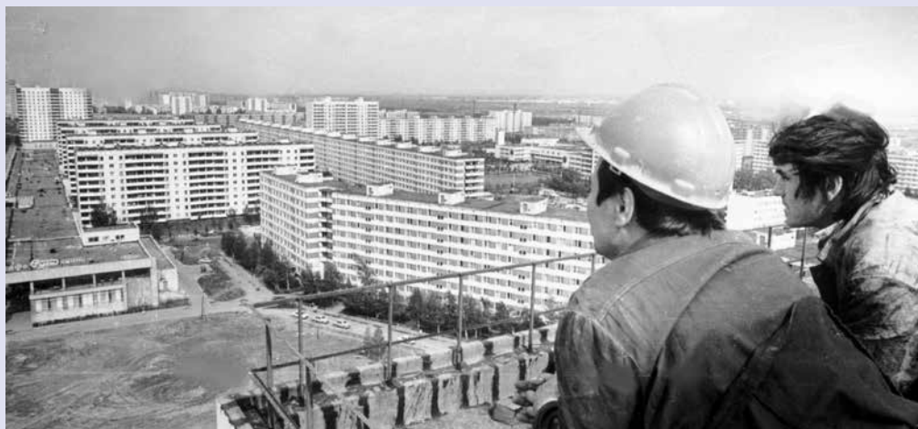
Что может вдохновить строителя сильнее, чем панорама возведённого города?