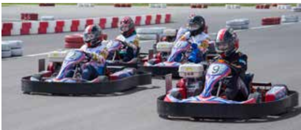
Обгони меня, если сможешь

На старт вышли 24 красавицы. Но победителями в двух классах стала одна и та же тройка участниц. Призовые места распределились следующим образом: