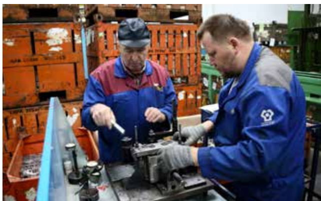
После запуска линии и обработки заготовки необходимо проверить размер всех базовых отверстий

перевезено более 150 единиц оборудования. Ремонтная служба этого предприятия отремонтировала 17 агрегатов, из них два числились в списке особо важных.