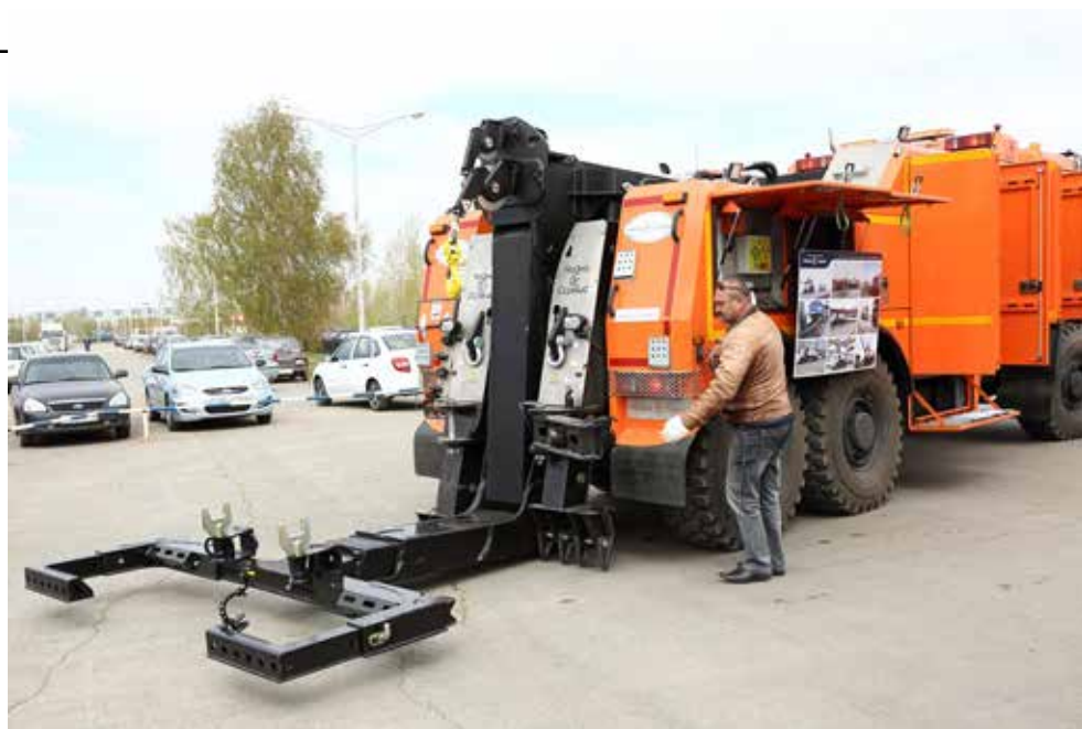
Эвакуатор на базе КАМАЗ-65224 может буксировать даже грузовые автомобили и автобусы

Уровень продаж у партнёров из Нижнего Новгорода скорректировал продолжающийся кризис, но руководители предприятия настроены позитивно. «Везёт тому, кто везёт», — уверены они. В «Чайка-Сервисе» постоянно ищут новые темы и направления,