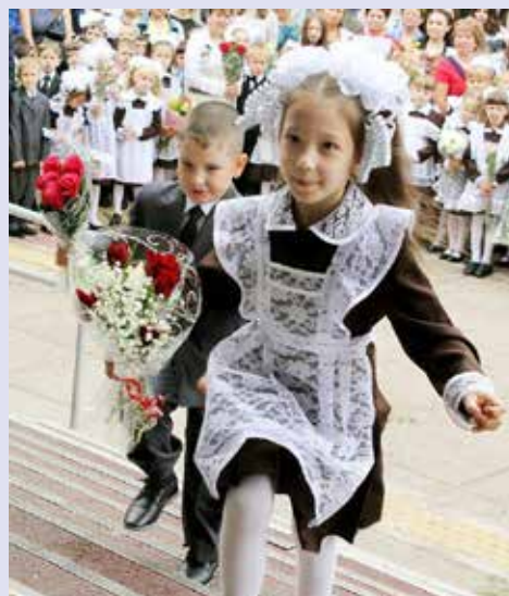
Так бежать в школу можно только в первый раз...