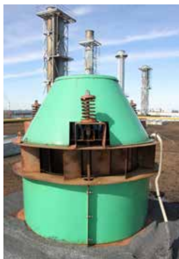
Таких крышных вентиляторов над гальваническим цехом установлено 20