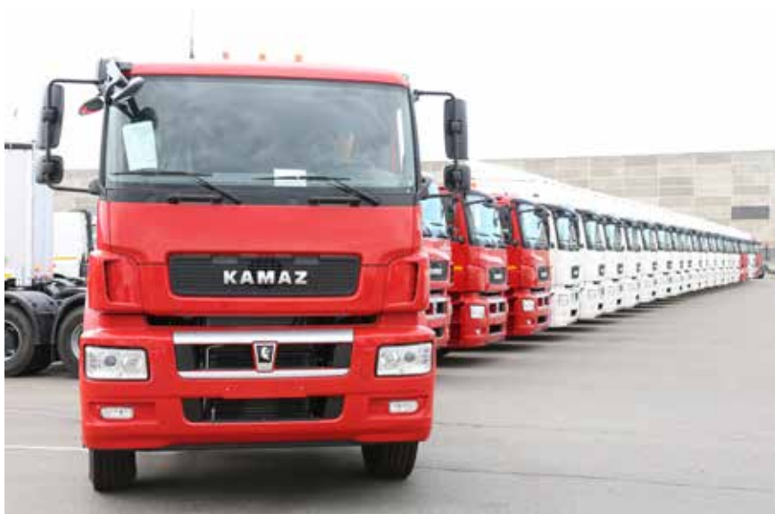
Рост продаж демонстрирует именно новый модельный ряд

— Положительная динамика по продажам налицо, причём во всех регионах — Приволжском, Центральном, Южном и других, но о взрывном росте спроса в целом пока говорить не приходится. Есть оживление строительного рынка и в сегменте магистральных перевозок. Мы очень вовремя выводим новые модели. Анализ продаж говорит о том, что основной рост у нас именно в сегменте нового модельного ряда, по традиционным моделям цифры стабильны. С каждым годом, начиная с 2014-го, растут продажи наших магистральных тягачей