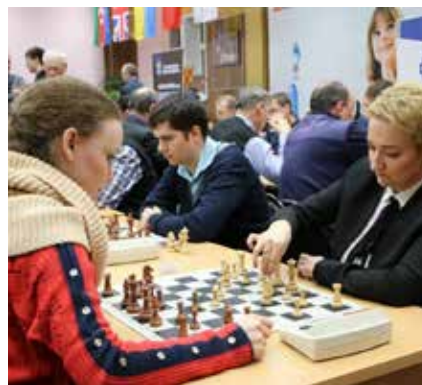
Собратся и выиграть!

Победители и призёры соревнований награждены грамотами и ценными подарками от профкома.