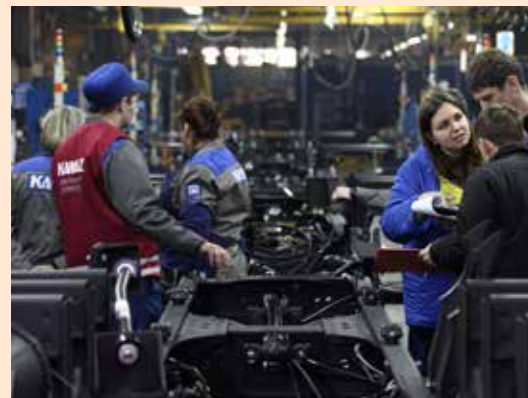
Красный жилет сразу выделяет бригадира