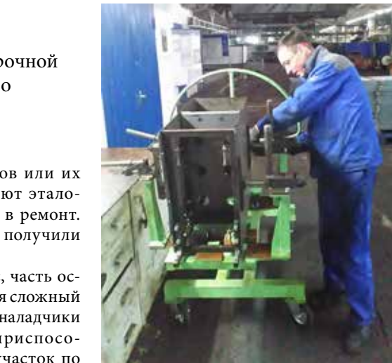
Наладчики цеха шасси самостоятельно ремонтируют 30% приспособлений ственный план, количество деталей соответствует заказу, а их качество значительно улучшилось.

Новшество уже позволило снизить количество сборочных дефектов на 37%.