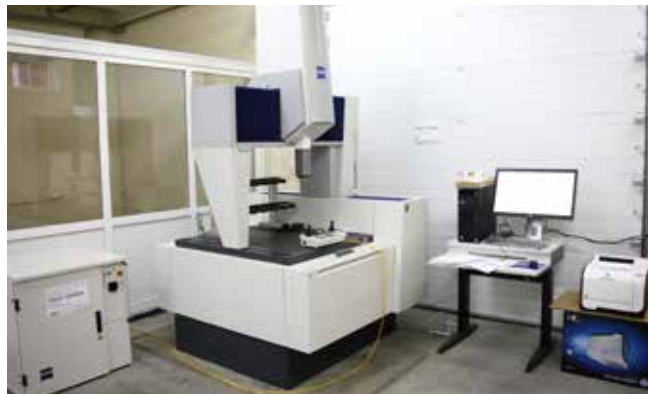
Высокоточная измерительная машина Zeiss сдана в эксплуатацию. В начале мая здесь начнётся обучение специалистов работе на ней