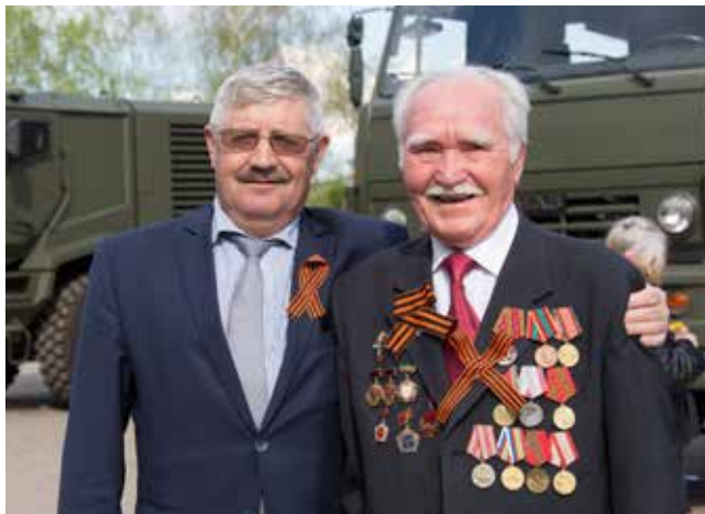
Приходите на праздник, ветераны! Наследникам есть что показать вам

Заводские артисты подготовили спектакль по поэме Александра Твардовского «Василий Тёркин». Размышления народного героя наверняка найдут отклик в душах бойцов, отстоявших независимость нашей Родины. После окончания торжества все его участники получат подарки, а до дома их доста-