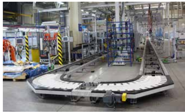
Главная линия конвейера

Кроме нового сборочного конвейера работа продолжается ещё на трёх участках. На линию блока цилиндров приехали специалисты фирмы Heller для проверки качества изготовления полов и фундаментов. Во второй половине мая здесь начнётся монтаж оборудования. На линии головки блока цилиндров уже установлены шесть обра-