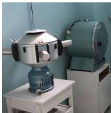
Оборудование в здравпункте