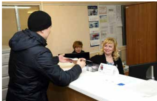
В заводских отделах кадров встретят всегда приветливо

Индексация окладов, тарифов планируется с октября 2017 года в размере 6%. По данным прогноза Минэкономразвития России, инфляция в 2017 году составит 4%. По «КАМАЗу» в 2017 году планируется рост средней заработной платы к 2016 году в размере 8,7% без учёта индексации, с учётом индексации рост составит 10,2%. В 2016 году при уровне инфляции 5,4% рост средней зарплаты к 2015 году составил 13%.