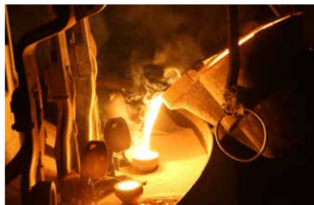
Горячий металл, попадая в формы, превращался в отливки. Они заливались с учётом плана работы на месяц

сплавов: «Мы хотим, чтобы наш завод процветал, чтобы были новые заказы, хорошая зарплата и чтобы с каждым днём росло мастерство наших участников».