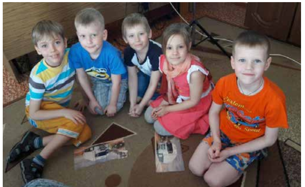
Первый шаг — машина из пазлов

С удовольствием дошколята взялись и за выполнение домашних заданий — шефы их попросили нарисовать КАМАЗ будущего. Ведь именно так рождаются новые машины. Почему бы не попробовать?