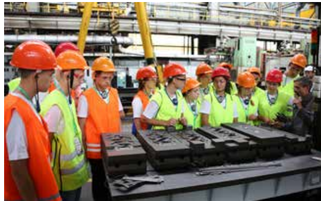
Форум — это возможность получить предложение поработать...

Участие в форуме бесплатное. Срок подачи заявки — до 31 мая. Количество мест ограничено. Не упустите возможность вступить в команду PROFфессионалов!