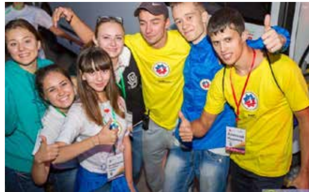
...и найти друзей