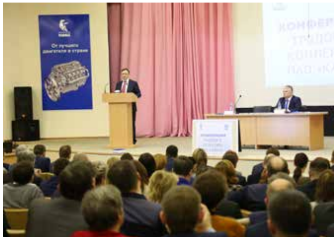
На конференции обсуждалось выполнение обязательств 2016 года