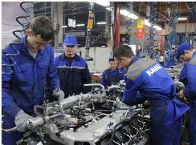
Успех «КАМАЗа» зависит от каждого работника