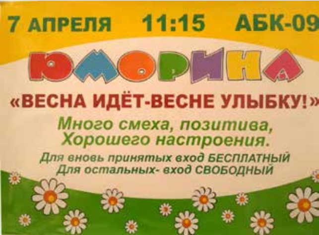
Как не откликнуться на такое юморное приглашение?

Или другой случай. Не работает у вас муж. Уже 10 лет как дома на диване лежит. Вы думаете, это от лени? А вот и неправда. Он бережёт ваши нервы, чтобы вы всегда знали, где