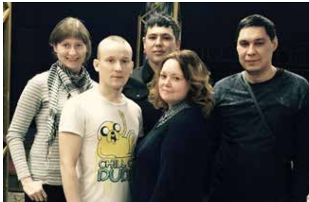
Интеллектуалам «литейки» оказались по зубам все 24 вопроса игры

Всего в интеллектуальной игре приняли участие 24 команды, а это более 140 человек. И не было бы в этих цифрах ничего необычного, если бы не одно обстоятельство. В соответствии с правилами, в рамках одной игры разыгрывается 24 вопроса определённой тематики, и победитель выявляется