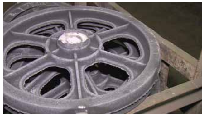
Совсем новое для литейного завода изделие — канатопедущий шкив для лифтовых систем

сроки освоения продукции. У нас есть обширный опыт работы с совместными предприятиями — ЦФ КАМА, Федерал Могул, КНОРР-БРЕМЗЕ КАМА, благодаря