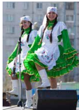
После шествия работники «движков» порадовали всех татарским танцем на площади Азатлык

Дальше в колонне шагали сотрудники «ПЖДТ-сервиса». «Я работаю на «КАМАЗе» не так давно, второй раз прихожу на митинг. 1 Мая для нас — начало новой жизни и нашей