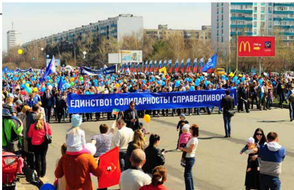
КамАЗовская колонна на демонстрации была самой многочисленной

По граммофону крикнули поздравительное «Ура!». Громче всех ответил на этот лозунг связист «Челныводоканала»