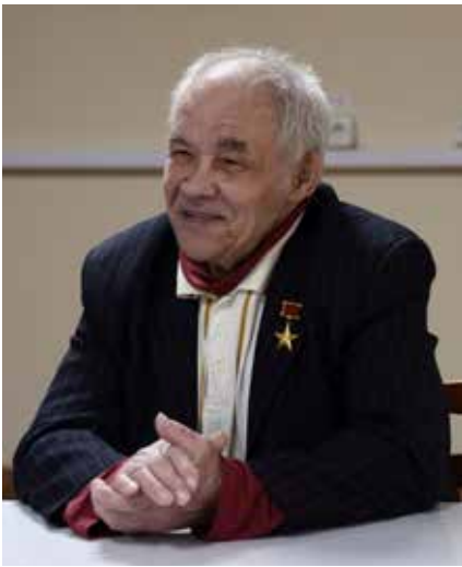
«Про славу думать некогда было, работы было много», — вспоминает ветеран

— Мы работали, не считаясь со временем. Как заходили в цех, так и