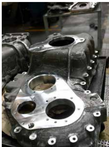
Новые картеры раздаточной коробки

В этом году на заводе двигателей собрали ещё 22 раздаточные коробки из 36 запланированных. Эту работу планируют завершить в конце мая. Одновременно с ней начнётся освоение картера для 631-й раздаточной коробки, но это уже будет совсем другая история.