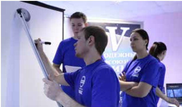
Идёт разработка проекта

разработать собственный проект по совершенствованию профсоюзной работы. Всего было подготовлено шесть проектов. Третье место заняла команда «Сборная гласных», представившая проект по совершенствованию имиджа камазовских уполномоченных по охране труда. Второе место завоевала команда «Мотор», предложившая методы совершенствования информационной работы профсоюза. Первое место у участников команды «Огонь» — они разработали проект по мотивации профсоюзного членства. Победители и призёры конкурса награждены грамотами и сувенирами от профкома.