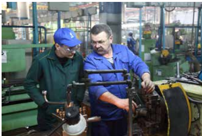
Наставник — практиканту: «Металл чувствовать надо!»

ки студенты за два месяца должны познакомиться со сверлильными, фрезерными, шлифовальными и другими станками. РИЗ такую возможность предоставляет. С начала года стажировку на предприятии прошли уже 23 будущих наладчика.