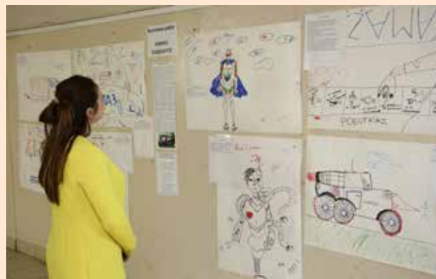
Дни «КАМАЗа» побуждают школьников к творчеству