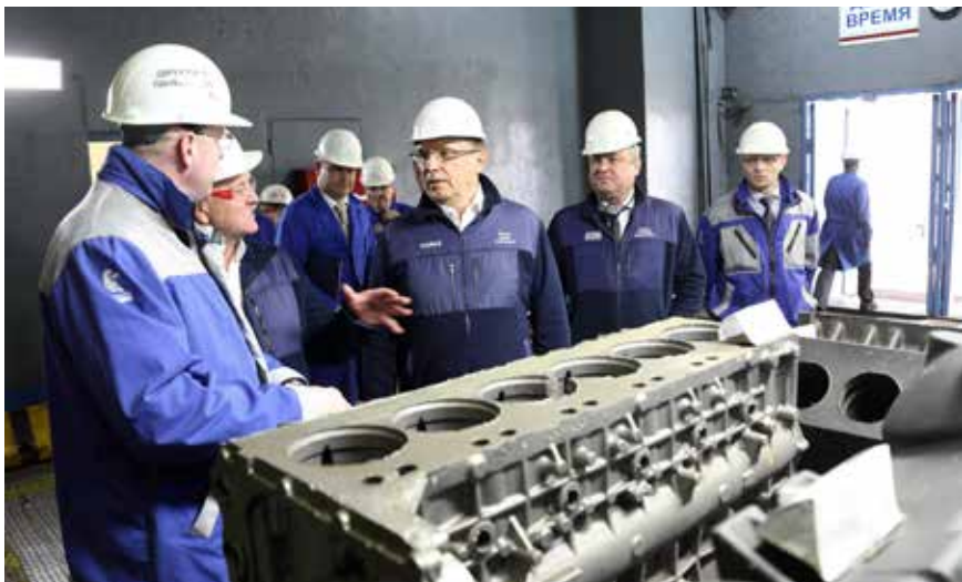
В сравнении с блоком цилиндров для V8 (справа) блок Р6 (в центре) действительно выглядит массивнее

Теперь главная задача — постановка производства на поток. Всё дело в том, что новый блок существенно отличается от блока классической камазовской V-образной «восьмёрки». Эта отливка и выше, и шире, и тяжелее. Вес готового изделия около 380 килограммов, а стержневого пакета и того больше — около 720. Так что основная проблема, которую именно сейчас решают на заводе, — максимальная универсализация и автоматизация производства: