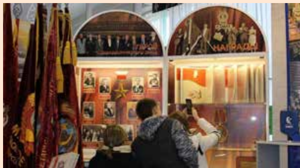
В музее «КАМАЗа» смотрят на историю через призму новых технологий

Как только отметки, которыми служили настоящие экспонаты, попадали в поле зрения камер смартфонов, появлялся вопрос. Правильный ответ приносил призовые баллы.