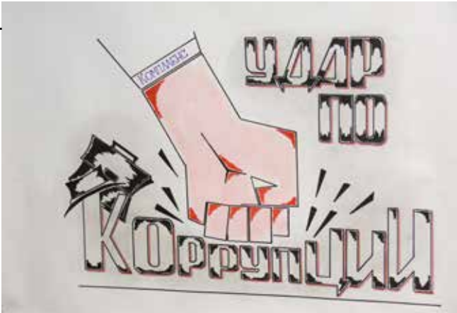
Конкурс лучших работ по визуализации «Горячей линии» сыграл свою роль: людям стало гораздо понятнее, что такое коррупция

По результатам проведённой проверки начальник ПСДО уволен.