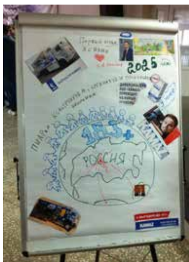
Визуализированная миссия «КАМАЗа» в исполнении нашего отряда

Все участники получили задания визуализировать миссию «КАМАЗа» и роль своего отряда в её реализации. Напомним, миссия нашей компании звучит так: «КАМАЗ», построенный всей страной, — основа транспортной безопасности и достояние России. Предвосхищая потребности, мы поставляем автомобильную технику и фирменный сервис, помогая клиентам достигать вдохновляющие цели. «КАМАЗ» — социально ответственный партнёр, действующий ради долгосрочных интересов акционеров и благосостояния сотрудников».