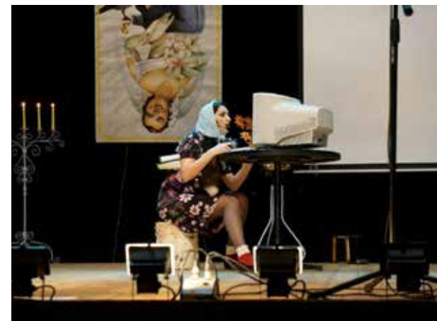
На ПРЗ прекрасных дам к финальной развязке операции «8 Марта» готовили с юмором и любовью. Сначала припомнили милые грешки — устроить скандалчик из любой мелочи, при первой же возможности отправиться по магазинам, поспорить с любимым зятем... А потом восхитились. Ведь женщины быстро обучаются (на фото), работают наравне с мужчинами, спешат домой на каблучках, с сумками за спиной и детьми подмышкой. Гимном красоте и оптимизму заводчанок стал видеоряд, снятый в цехе крупной штамповки под стихотворение Роберта Рождественского «Будь, пожалуйста, послабее...»