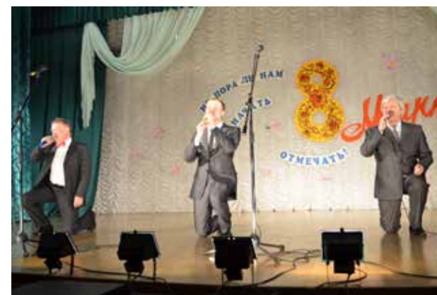
Женская половина кузнечного завода недаром заметила: «8 Марта мужчины любят нас сильнее!» Это читалось во всех концертных номерах — «Начнём сначала», «Девичник», «В монастыре», но поклон мужского трио в финале произвёл настоящий фурор. Свою программу артисты с кузни показали и литейщикам — то был ответный визит вежливости за их концерт к 23 февраля.