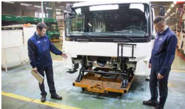
Такой транспорт для перевозки не подходит