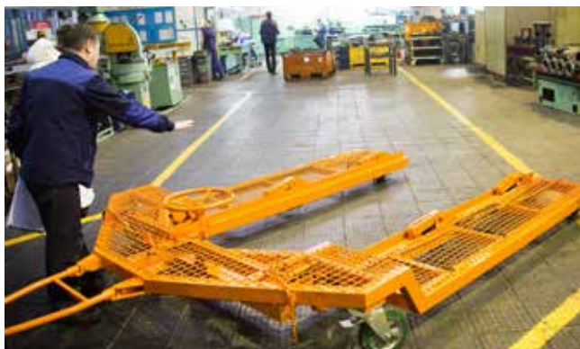
На этом «конкорде» кабина быстро долетит до нужной остановки

магистральных грузовиков 65207, 65208 и самосвалов класса люкс 6520 и 65201. Выпуск моделей перспектив-