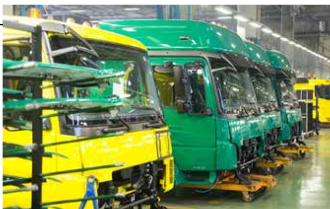
Кабины нового модельного ряда ждут своего часа на сборочных тележках

В свой первый «рейс» новый транспорт отправится на следующей неделе. По плану закладки на ГСК-1 как раз планируется сборка бортовых