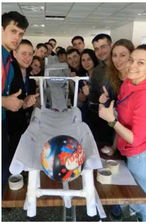
Что нам стоит мост построить?

В заключительной части образовательной программы форума мы получили задание соорудить мосты, имея только бумагу, ножницы и скотч. На строительство мостов отвели 45 минут. На этом этапе все отряды перемешали, разделив на новые команды. В каждой команде был начальник стройки и три бригады с бригадирами. При этом снова были ограничения по коммуникациям: начальник стройки общался только с бригадирами, бригады между собой общаться не могли. В результате мосты, построенные разными бригадами, состыковывались друг с другом. По сооружению должен был проехать мяч и не упасть. У нас всё получилось. Так приятно было наблюдать за результатом командной слаженной работы!