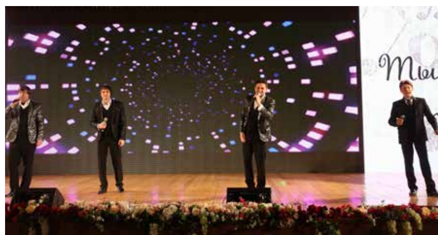
Песни Магомаева в исполнении квартета «Перфомен» звучат свежо и лирично