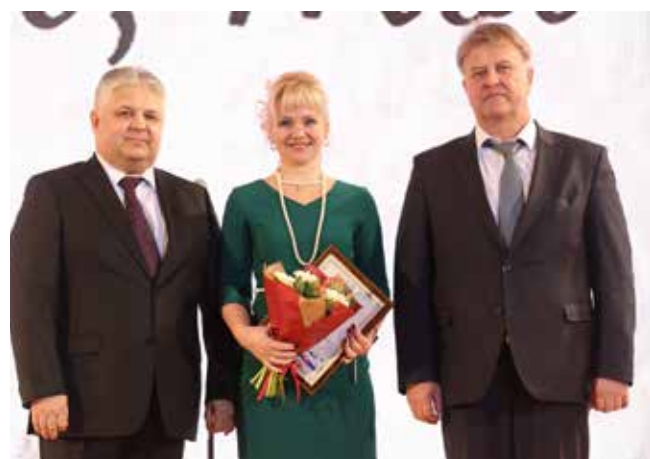
Награды накануне праздника вручили самым умным, красивым, талантливым, активным