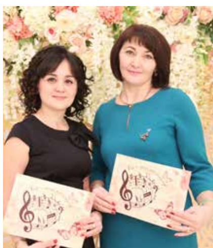
Фото в красивом интерьере — чем не подарок к празднику?

— Мы, мужчины, очарованы вашей красотой и обаянием. Вы вдохновляете нас на подвиги, радуете. И ещё