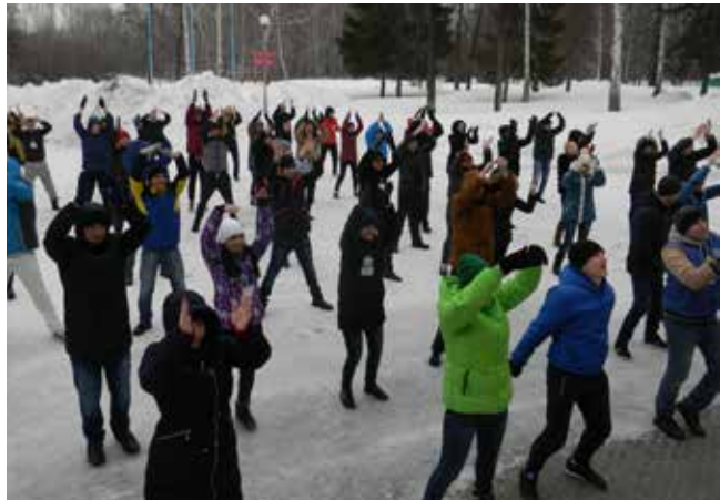
Заряжаемся хорошим настроением, разучиваем танцевальные па

«Звёздный» встретил молодёжь с распростёртыми объятиями. Под заводную песню SeeYa Papito Chocolata состоялся масштабный танцевальный флэшмоб, организованный кураторами. Он позволил всем нам настроиться на позитив и почувствовать себя частью одного сообщества — молодых. «Порядка 30% работающих сегодня на «КАМАЗе» составляет молодёжь до 35 лет. Это немалая цифра. Наша задача — сплотить эту категорию работающих, укрепить горизонтальные