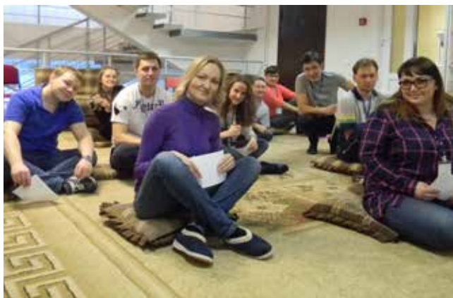
Первый отряд на игре «Почтальон»

как эффективность вертикальных — лишь 20–25%. Потому что друг с другом нам проще договориться», — отметила она.