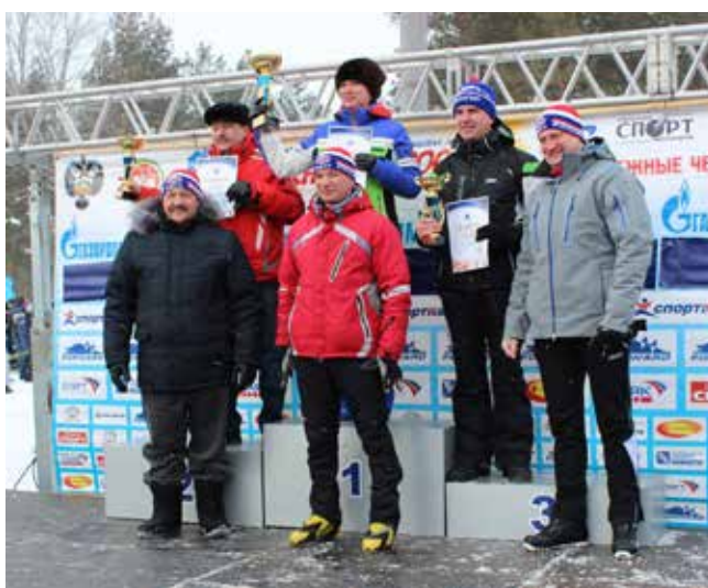
Одна из ступенек пьедестала — камазовская