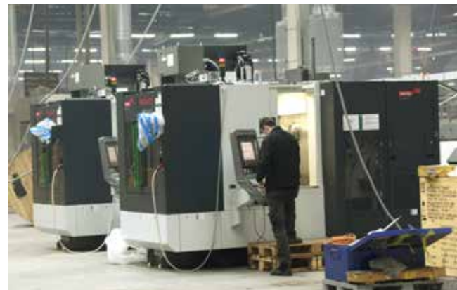
На территории цеха 116 появились первые обрабатывающие центры «Хеккерт»

всех изготавливаемых двигателей КАМАЗ и «Камминз». Поставка оборудования для этих двух линий ожидается в марте-апреле этого года. В целом работа по подготовке к производству нового двигателя объединила сотни камазовцев с разных заводов: штампуются заготовки, закупается металл, инструмент, изготавливается оснастка и т.д. Совместными усилиями необходимо выполнить главную задачу этого года — выпустить с нового сборочного конвейера 200 опытных образцов двигателей. Это позволит проверить стабильность всех процессов, чтобы в следующем году перейти на массовый выпуск продукции.