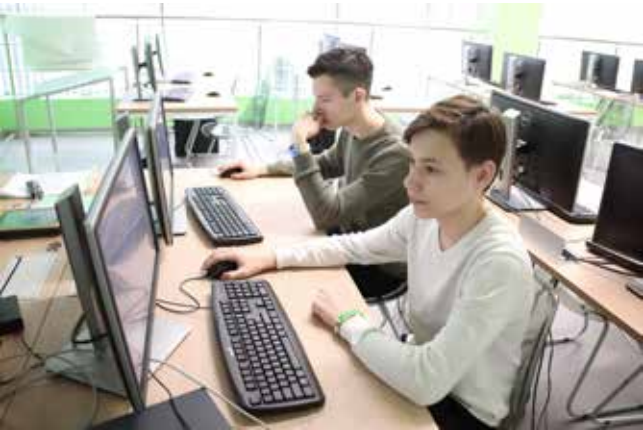
Задания теста заставляют задуматься