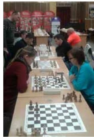
Выявляются сильнейшие шахматисты «литейки»

Итак, сильнейшие игроки завода определены. Они примут участие в камазовских соревнованиях по шахматам, которые состоятся в апреле в ИШК.