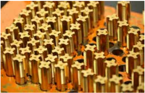
Чёткая маркировка — залог качественного изготовления детали

Скоро гравёру надо будет осваивать ещё одну функцию лазерной установки. На ней можно делать не только обычную гравировку, но 3D-маркировку, то есть клеймо. Такие оттиски широко используются и на «КАМАЗе», и на других предприятиях. РИЗ уже получил заказ на партию новой продукции от ООО «Мефру уилз Россия». Первый шаг сделан.