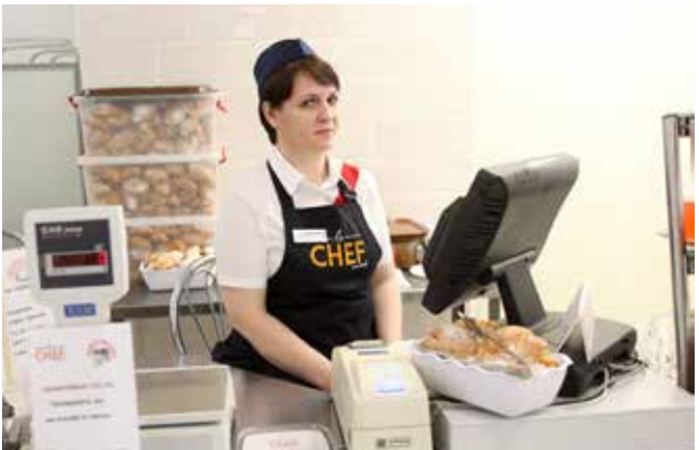
Плюс одна касса — минус очередь