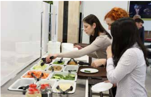
В салат-баре выбор по вкусу