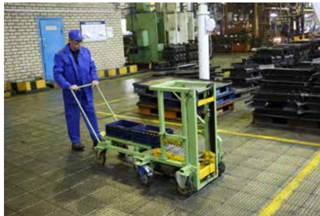
Транспортировка тяжёлых ящиков с комплектующими теперь значительно облегчена

— Такими приспособлениями можно оборудовать рабочие места не только станочников, но и сборщиков, — строит планы начальник цеха сборки рам