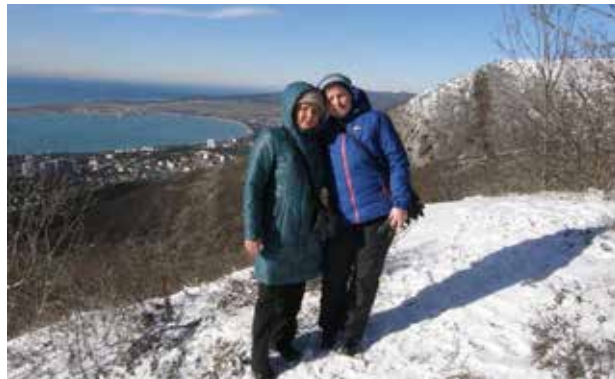
Тех, кто дошёл до вершины, переполняет радость