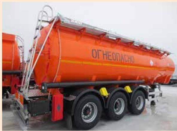
Нефазовская цистерна — лучшая

В Москве прошла торжественная церемония награждения призёров Программы «100 лучших товаров России». В конкурсе приняли участие порядка 1700 отечественных предприятий и около 3000 товаров и услуг. Основные критерии оценки — качество и конкурентоспособность, внедрение прогрессивных технологий, рост объёмов производства и реализации товара, оптимальное соотношение цены и качества. Существенную роль также играют инновационный подход и работа в области импортозамещения.