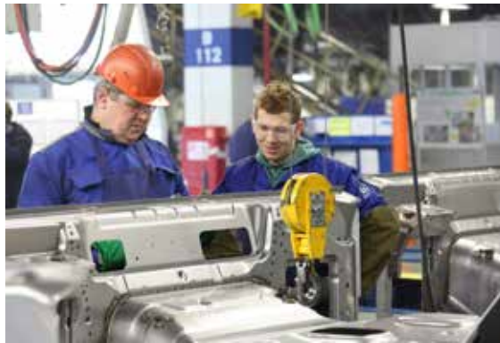
Понимать, в каком направлении следует развиваться, должен каждый

— «Общие требования» будут полезны и мастерам производств — непосредственным руководителям. Те будут видеть, что должен знать и уметь рабочий, и понимать, в каком направлении развивать своих подчинённых. Если, допу-