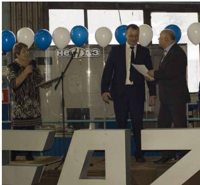
Вручение благодарственных писем за успешный старт