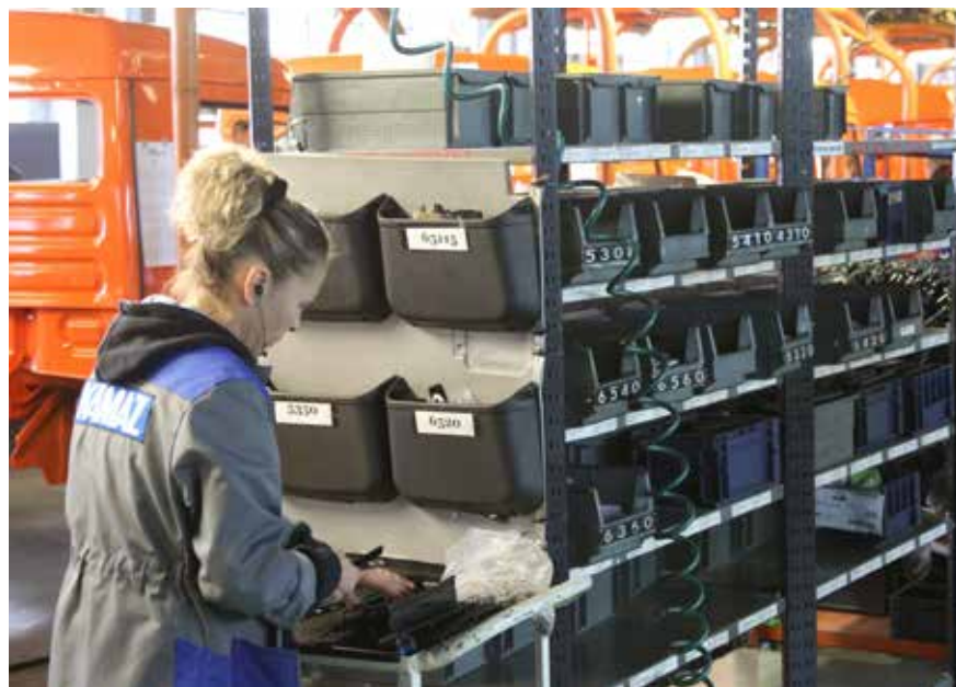
На «КАМАЗе» по системе «5S» организовано 35452 рабочих места

Свыше 40 тысяч кайдзен-предложений поступило от камазовцев за прошедший год, было открыто 1422 кайдзен-проекта. Но в Комитете развития Производственной системы «КАМАЗ» даже более ценными считают другие цифры: 39666 предложений по улучшениям внедрено, реализовано 1094 кайдзен-проекта. Именно на этой позиции, на внедрении, был сделан «акцент года».