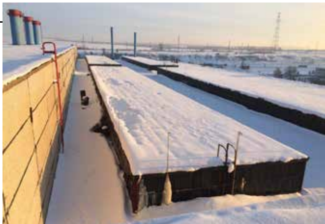
У каждой заводской крыши свой рельеф

Ежедневно на расчистке автодорог, площадок, пешеходных зон работает 20 машин, из них четыре — круглосуточно