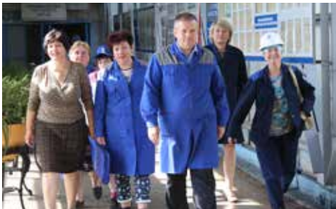
Профсоюзные лидеры в гуще событий

После подведения итогов были озвучены задачи на 2017 год.