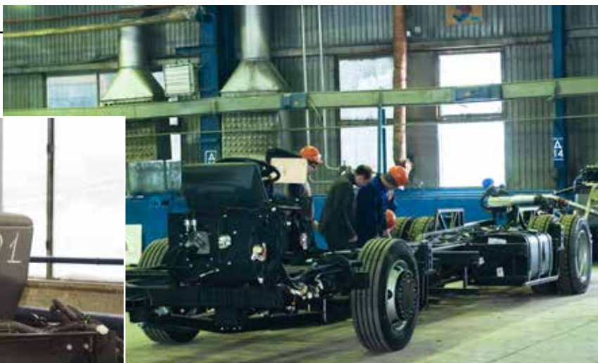
С этого номера начинается отсчёт нефазовских автобусных шасси

какой используется в шасси. Технологические операции новые, но мы можем научиться, уже учимся и, думаю, все задачи выполним. В перспективе — кардинальное изменение технологии. Сейчас шасси собирается отдельно, затем на него приваривается каркас кузова. Мы хотим попробовать сначала собрать и сварить раму шасси и каркас кузова, и только потом, после сварочных работ, осуществлять монтаж всех систем коммуникаций. Думаем, это поможет значительно улучшить качество. Такой каркас уже моделируется в 3D, скоро запустим пробный образец».