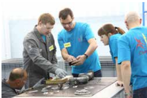
Казахстанская команда «Сырласу»