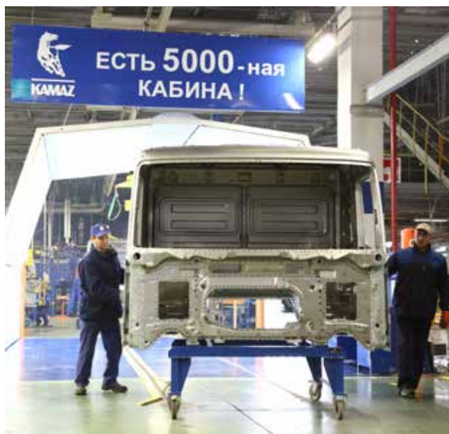
5-тысячный каркас кабины для нового модельного ряда — одно из достижений-2016

— Надо закрепить позиции, завоёванные 5490, расширять выпуск новых автомобилей по различным модификациям — мы же взяли на себя серьёзную задачу в 2017 году произвести и продать 6100 автомобилей нового модельного ряда. Ключевым будет то, что с этой моделью нам нужно выходить уже за пре-