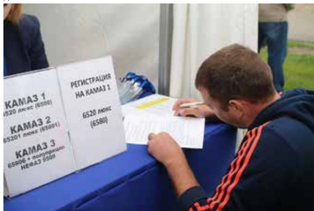
Ключевое событие года — нам удалось убедить клиента, вызвать доверие к нашим новым автомобилям