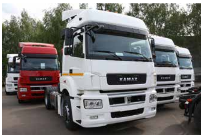
Камазовские грузовики — это безусловное качество и надёжность

В 2017 году нам предстоит произвести 36 тыс. автомобилей и совершить новые шаги в сфере модернизации производства.