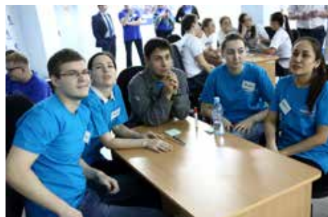
В интеллектуальной игре каисты крайне сосредоточены

— Зато всё честно, без подстав! — парируют камазовцы.