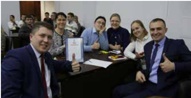
Победителями третьей игры стала команда «Кадры решают всё», БУПиОР

В здании генеральной дирекции 21 декабря прошла третья игра осенней серии интеллектуальных игр, организованных профкомом «КАМАЗа». Помимо 12 команд, состоящих из молодых работников различных подразделений компании, на игру были приглашены ещё две — команды руководителей «КАМАЗа» и профсоюзных лидеров.