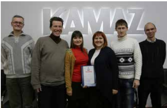
По итогам всей осенней серии интеллектуальных игр чемпионом стала команда литейного завода «Камлит»

С самого начала ведущая мероприятия обозначила главный информационный повод игры — 45-летие профсоюзной организации и задала тематику вопросов: «История профсоюзной организации «КАМАЗа», «История нашего города в год создания профсоюзной организации (1971)», «Мировая история, политика и музыка 1971 года». Четвёртой темой в преддверии праздников стал Новый год.