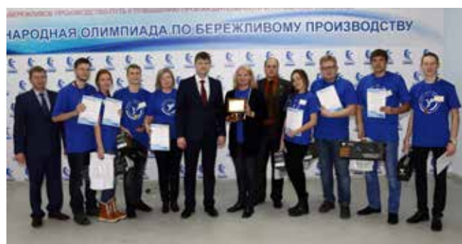
Команда очной магистратуры УдГУ — победители I Международной лин-олимпиады

— Какие виды переналадок существуют в лин на