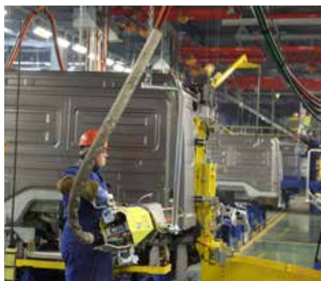
Новая линия сборки рассчитана на выпуск 10 000 каркасов кабин в год

За полгода на прессово-рамном заводе освоен выпуск 30 комплектующих по программе локализации кабины, до конца декабря перечень вырастет до 50. В следующем году параллельно с освоением новой номенклатуры будет расти план выпуска продукции, на новом участке должно быть собрано более шести тысяч каркасов кабин.