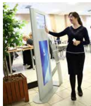
После обеда, остановившись на несколько секунд у инфомата, работники могут поставить ту оценку, которую по их мнению заслужил повар

больше голосующих, тем объективнее оценка!