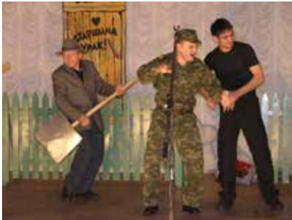
Армия... Эти воспоминания лопатой не раскидаешь!