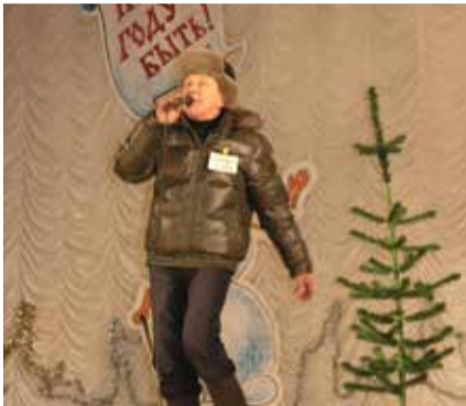
У такого продавца ёлок товар расходуется, как горячие пирожки

научился на производстве, когда ещё трёхмерки компьютерной не было. И всегда, сколько ни работаю, вижу, что у нас не так, что ещё улучшить можно. Наверно, это сцена помогает глазу не замыливаться. Хотя трудно сказать, энергетика — она и в цехе, на производстве, и в фильмах любимых, приключенческих, и в семье, и в песнях... В жизни, в общем! Только примечай.