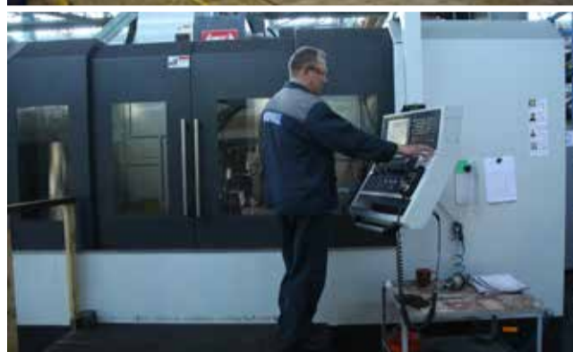
Новое оборудование в цехе рубки металла и в цехе обработки штампов ШИКа позволяет выпускать продукцию совершенно нового уровня качества

программы, на рабочем месте с наставниками — другого придумать невозможно. Работа сама по себе тяжела физически, незря наши люди имеют возможность уйти при выработке стажа на пенсию по первой сетке в 50 лет.