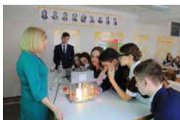
Много интересного в День «КАМАЗа» школьники узнали на уроке воды

На станции «Урок воды» вместо запланированных четырёх уроков было проведено много больше. В перерывах в кабинет заглядывали любопытные и с вопросом: «А у вас тут что? Расскажите нам!», получали утвердительный ответ и подбегали к кафедре, где стояли колбы, стаканы с водой и непонятный аппарат. Учитель физики