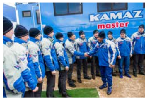
Пожелание удачи от президента нынешним и будущим чемпионам «Дакара»