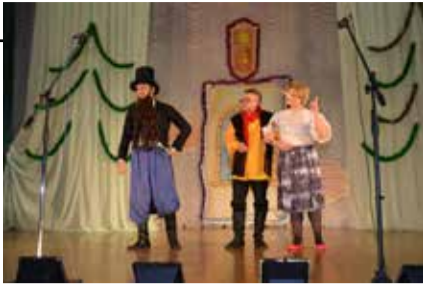
Плод трудов папы Карло (в центре) узнаваем сразу

— Что вы, никогда. Это же чисто для души. Так-то я — технарь, с юности пространственное мышление «включать»